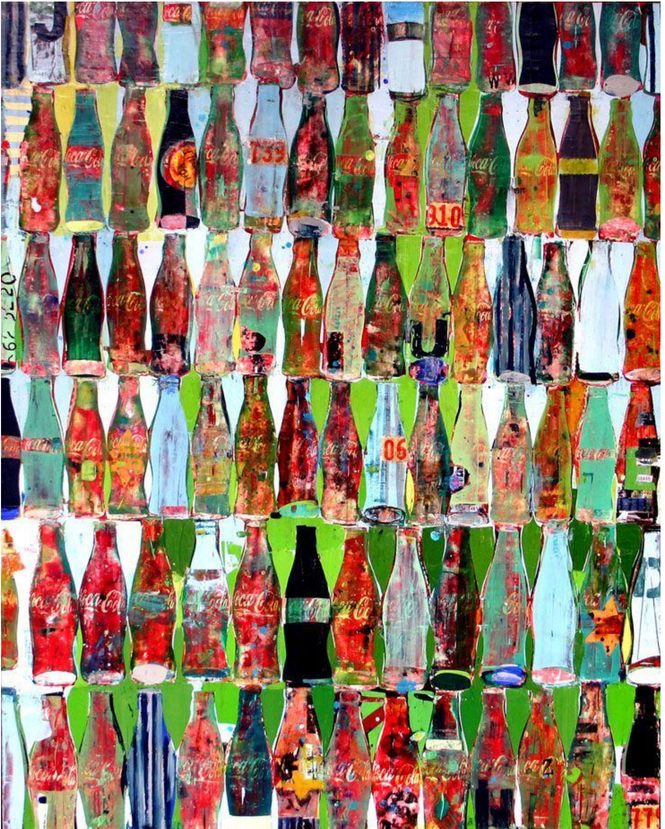
K. Frohsin, Cokework.

L'analisi della presenza e diffusione della Coca Cola nella DDR, non tanto e solo della bibita, quanto dell'oggetto simbolo, in uno dei saggi contenuti nel libro