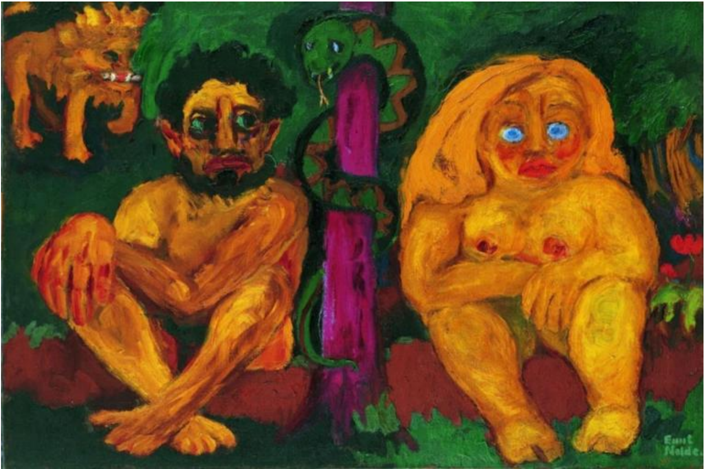
Emil Nolde, Paradise Lost .

Nel mito, possiamo immaginare che Adamo ed Eva, prima di accorgersi e sentire il desiderio della mela, fossero in quella condizione alla quale noi oggi sembreremmo tendere. Ci siamo a un certo punto, accorti di noi, di esserci, perché abbiamo sentito desiderio e mancanza: perché ciò sia accaduto e accada, perché l'esserci prenda consistenza e si faccia sentire, è necessaria una presa di distanza dall'essere e quella presa di distanza comporta l'elaborazione di una mancanza. Se ci accorgiamo di noi nella trasformazione dal silenzio, dal vuoto coincidente, al riconoscimento e alla conoscenza, sembriamo oggi impegnati a non volere vivere il dolore di quel vuoto e a regredire a una saturazione, preferendo l' horror pleni all' horror vacui .