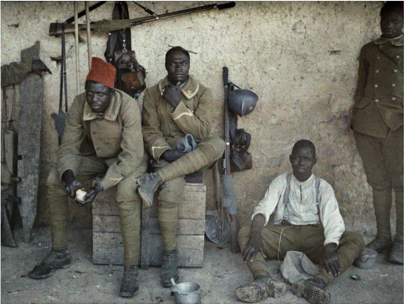
Soldati del Senegal coscritti nell'esercito francese sul fronte occidentale, giugno 1917 (ph. Galerie Bilderwelt/Getty Images).

L'ordine internazionale scaturito dalla guerra 1914-1918 è fragile. La «pace punitiva» sorta a Versailles non rimuove le cause della catastrofe del 1914, radicalizza ulteriormente le ragioni e le retoriche, in particolare tra Francia e Germania. La carta dei rapporti tra le potenze europee esce profondamente mutata: dalla disintegrazione dell'impero austro-ungarico e di quello ottomano, territori immensi in cui diverse aspirazioni all'indipendenza erano state all'origine del conflitto; dalla rivoluzione bolscevica in Russia, con il suo portato di instabilità nelle relazioni internazionali post-belliche e con una frattura ideologica inedita nella modernità; dall'intervento diretto nelle questioni europee in grande stile, con l'ingresso nel conflitto degli Stati Uniti nel 1917. Nel decennio successivo alla fine della guerra, un nuovo instabile ordine internazionale poggia su una Società delle Nazioni, immobile di fronte alla rinata nazione tedesca, resa feroce dalla povertà e dall'umiliazione. I fascismi proliferano ovunque e fanno a loro volta governo “armato” in Italia, Germania, Spagna, Ungheria, Romania, Polonia... Questa guerra diventa il primo tempo di una guerra dei trent'anni del XX secolo .