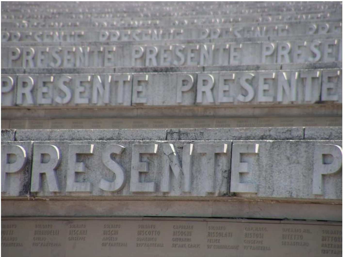
Sacrario militare di Redipuglia.

Luogo esemplare di questa rete discorsiva è Redipuglia (già Sredipolje), in provincia di Gorizia, i cui centomila sepolti ne fanno il maggior sacrario militare europeo e uno tra i più imponenti monumenti ai caduti della Grande guerra. Tra retoriche belliciste e dolore per la perdita, fin dalla fondazione del primo memoriale, antecedente all'attuale, Redipuglia è un tempio per il mito della nazione, fondato sull'immagine del sacrificio e centrato sulla fusione tra il luogo, teatro di combattimenti, e sepolture dei soldati. Inaugurato nel 1923 sul vicino colle sant'Elia, il sacrario ripensato dal fascismo del 1938 – è la sua forma ancora attuale – mostra le trasformazioni della religione politica fascista, nel senso di una ritualità dello Stato che trasferisce le credenze nel martirio e nella resurrezione dal piano personale a quello collettivo per farlo coincidere con la rigenerazione della “nuova” nazione. Con l'impressionante dimensione monumentale della struttura a gradoni aumenta il numero dei defunti fino a oltre centomila.