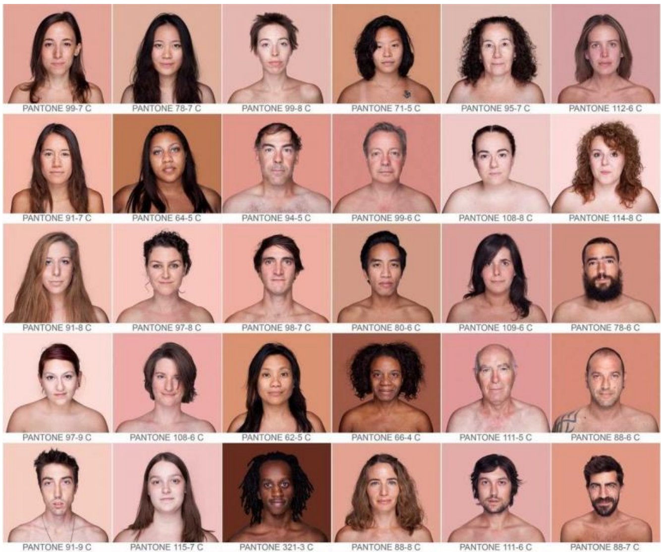
Angélica Dass, Humanae (dal 2012).

antiche donne greche e cinesi. Il trucco poteva avere effetti letali, ma ancora nell'Ottocento si potevano acquistare illuminanti a base di piombo con nomi fantasiosi e affascinanti. Altri due esempi soltanto: la vicenda del vestito di satin avorio della regina Vittoria che inaugura la moda dei vestiti da sposa di questa tonalità, come dimostra l'abito disegnato da Sarah Burton per la duchessa di Cambridge. L'altro aneddoto riguarda il vestito "color carne" di Michelle Obama in una cena ufficiale nel 2010 e il paradossale permanere di tale definizione nel nostro mondo globalizzato, in cui il colore della pelle non è certo riducibile a quello della donna "bianca". Lo ha dimostrato il progetto Humanae , una sorta di inventario cromatico della pelle umana - catalogato con i codici Pantone -, della fotografa brasiliana Angélica Dass che dal 2012 raccoglie ritratti di persone diverse provenienti da ogni parte del mondo, rivelando migliaia di sfumature di colore.