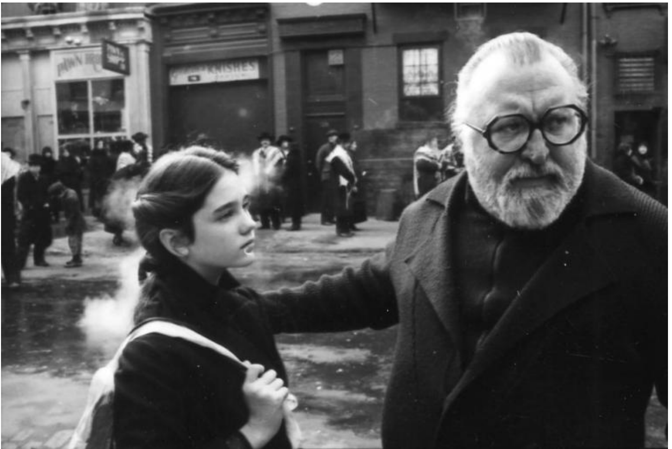
Jennifer Connelly e Sergio Leone sul set di "C'era una volta in America".

Quello che fa in più questa mostra – intitolata, non a caso, Il était une fois Sergio Leone – è accompagnarci, passo dopo passo, anche nel suo immaginario – alla scoperta del regista e dell'uomo che di queste “favole per grandi” è all'origine. Definizione che, confessa Leone, portando avanti la metafora, “mi ha, a volte, fatto affermare di avere l'impressione di essere, rispetto al cinema, come un burattinaio con i suoi burattini”. E la mostra della Cinémathèque tiene insieme tutto questo, il creatore e il suo universo, il progetto e i dettagli, le idee e la realizzazione tecnica.