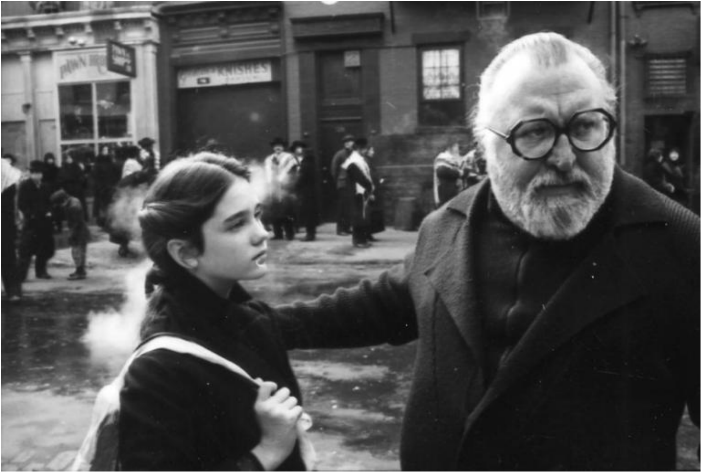
Jennifer Connelly e Sergio Leone sul set di “C’era una volta in America”.

mostra della Cinémathèque tiene insieme tutto questo, il creatore e il suo universo, il progetto e i dettagli, le idee e la realizzazione tecnica.