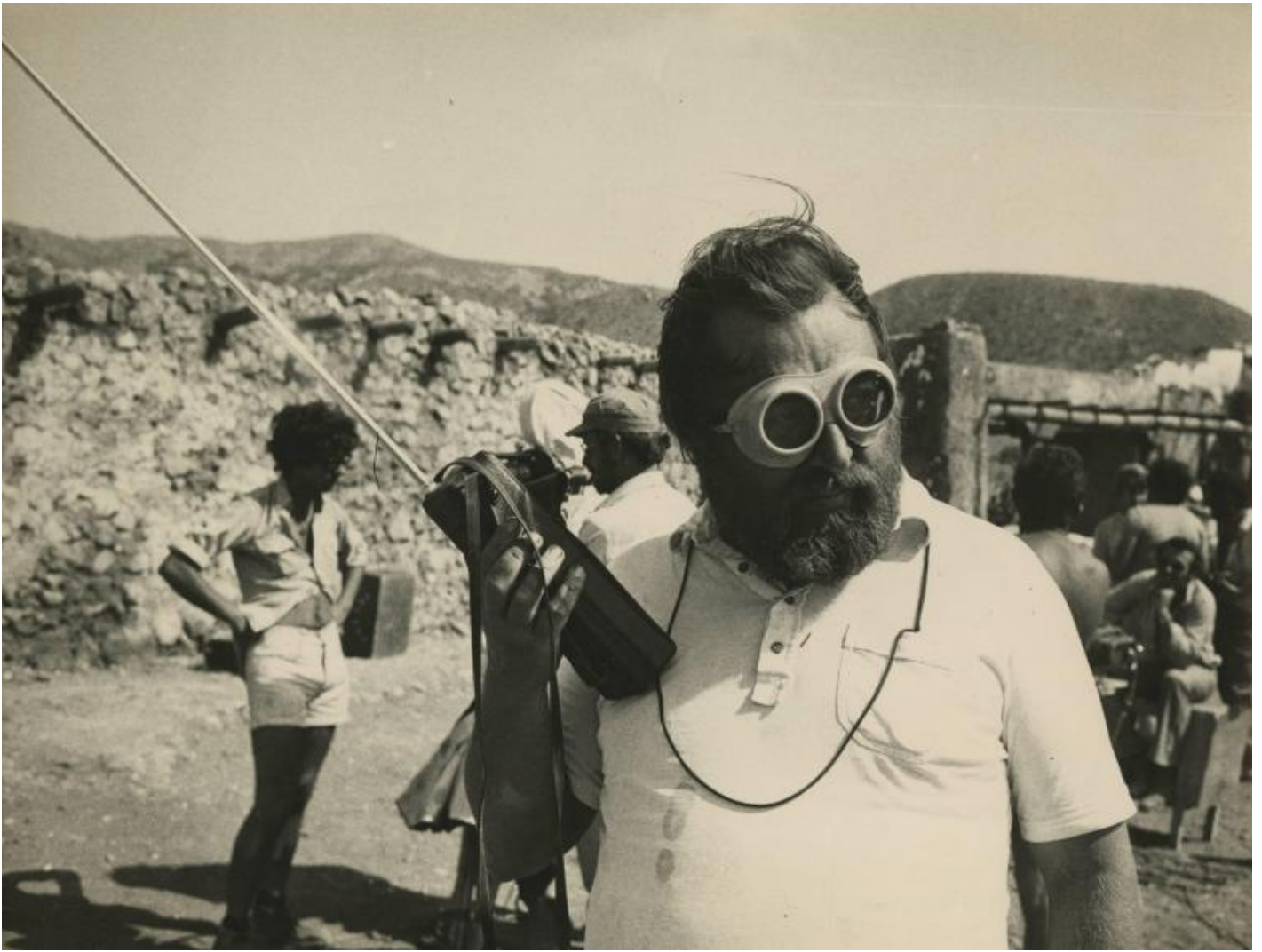
Sergio Leone sul set di "Giù la testa" (© Fondazione Cineteca di Bologna / Fondo Angelo Novi).

Nella testa di Leone, un film è questione di dettagli – di molti, moltissimi dettagli.