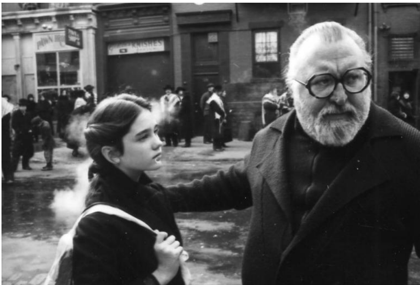
Jennifer Connelly e Sergio Leone sul set di "C'era una volta in America".

mostra della Cinémathèque tiene insieme tutto questo, il creatore e il suo universo, il progetto e i dettagli, le idee e la realizzazione tecnica.