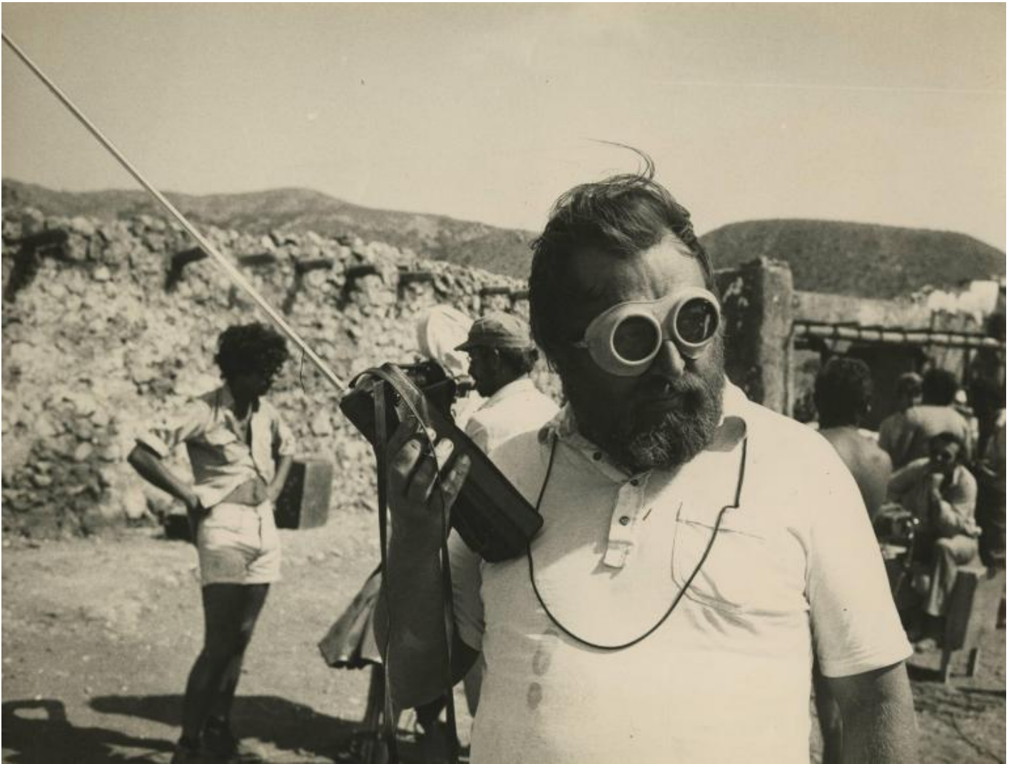
Sergio Leone sul set di "Giù la testa" (© Fondazione Cineteca di Bologna / Fondo Angelo Novi).

Nella testa di Leone, un film è questione di dettagli – di molti, moltissimi dettagli.