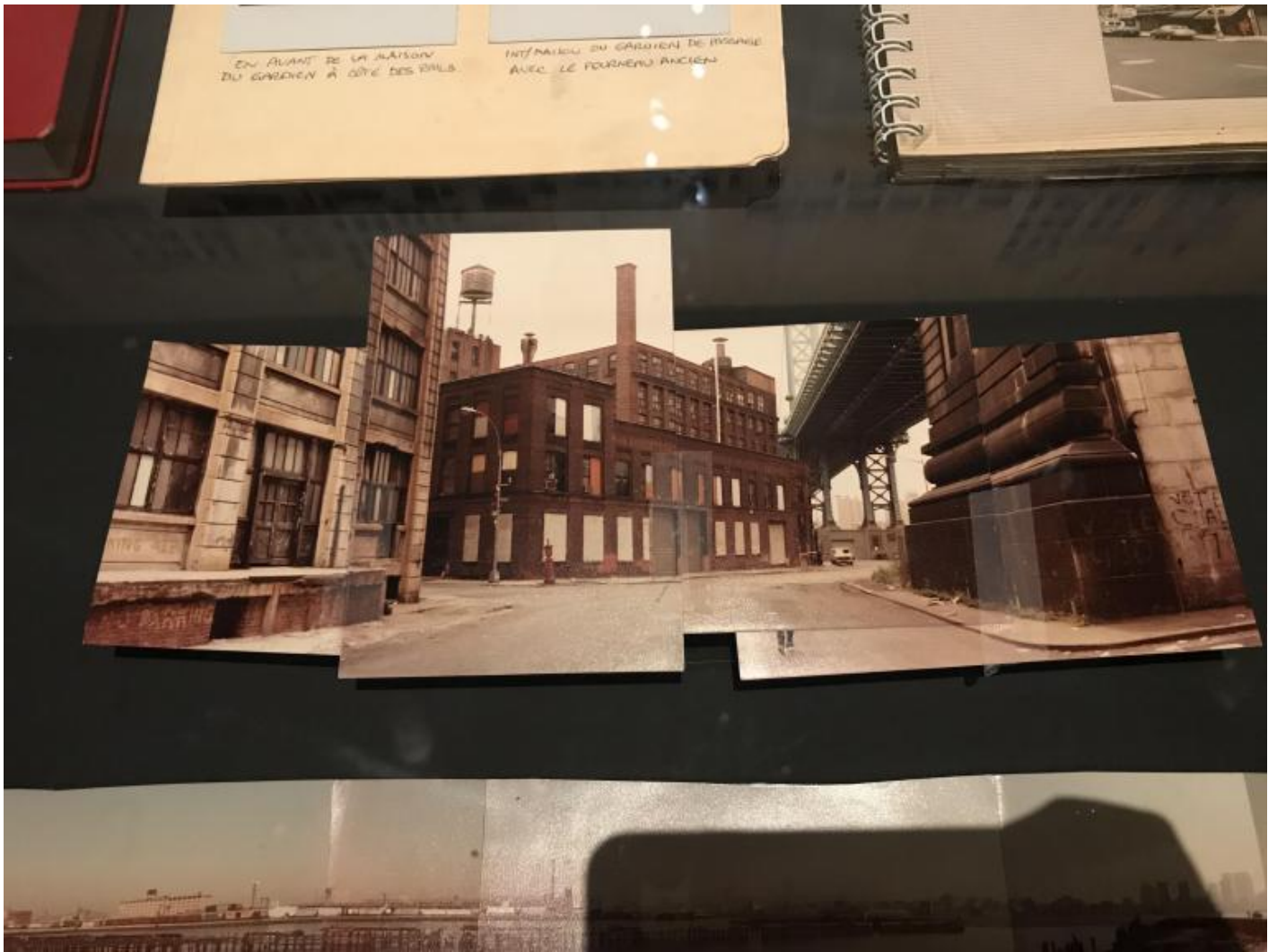
Tonino Delli Colli, collage di foto documentarie di New York utilizzato per la lavorazione di "C'era una volta in America".

C'era una volta in America , per esempio: la “cattedrale”, così la chiamavano i collaboratori di Leone – uscito nel 1984, tredici anni dopo Giù la testa , ma in gestazione da molti anni prima – è un oggetto narrativo delicato e complesso, in cui nulla è lasciato al caso. La documentazione di Tonino Delli Colli, direttore della fotografia, esposta in mostra lo racconta bene, dai collage di vecchie foto per ricostruire un panorama più ampio possibile alle minuziose scalette di lavorazione.