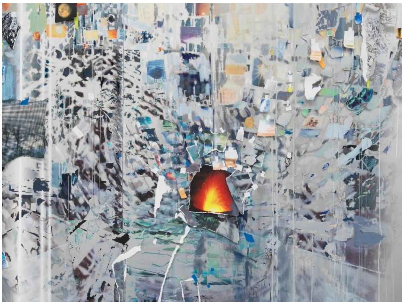
Opera di Sarah Sze.

Delle tracce di vernice bianca gocciolata sul pavimento, fanno da cerniera tra i due spazi e segnano il passaggio tra le due dimensioni. Attraverso la sua forma, la larga sala immediatamente richiama alla mente dell'artista la struttura del Colosseo, organismo che per lei sorprendente perché presenta, nello stesso momento, sia l'interno che l'esterno. Al suo interno una delicatissima macchina crea un mondo fantastico, realizzato attraverso la somma di diversi piccoli microcosmi, una fantasmagoria di materiali e suggestioni. Una sapiente e raffinata meticolosità caratterizza le minuscole costruzioni che ricordano delicate sculture giapponesi, in parte illuminate da luci. Sono per l'appunto dei cenni, dei frammenti che costruiscono l'insieme, un insieme composto da elementi attinti dall'esterno fusi con quelli prelevati dalla sua vita privata, per un racconto generale e personale. Una macchina, simile a una giostra, gira su sé stessa illuminando di volta in volta particolari diversi, alcuni dei quali riflettono la propria sagoma sulle pareti, intrecciandosi con le immagini in movimento (come la superficie dell'acqua increspata o un volo di uccello), anche loro ruotanti sulle pareti. Quell'apparente caos è anche qui ordinato con estremo rigore, in cui ogni gerarchia è annullata con la creazione di diversi punti focali.