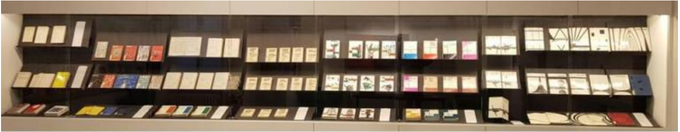
Laboratorio Formentini, Milano, mostra Conservare il fuoco, la parete della mostra con alcune delle copertine storiche delle collane di Il Saggiatore.

lei supervisionate nella sua qualità di art-director editoriale ante litteram della Mondadori prima e di Il Saggiatore poi) si susseguono sulle pareti della sala che ospita la rassegna, in una serrata conversazione, quasi un testa a testa, con quelle più recenti, concepite invece da FG Confalonieri, cui spetta pure, unitamente alla rivisitazione del logo aziendale (inizialmente creato da Giovanni Balilla Magistri e in seguito rivisto da Anita Klinz), l'allestimento dell'esposizione.