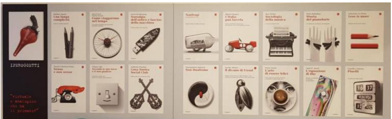
Una parete della mostra con alcune delle copertine dell'ultimo decennio, progettate da FG Confalonieri, suddivise per tematiche; qui: Iperoggetti.

“La prima stagione si muove sul filo delle collane. La collana come strategia di sistema dichiara un'intenzione programmatica, offre al lettore percorsi-sequenza dotati di una linea chiaramente riconoscibile. La collana è anche una piattaforma comunicativa, con una propria regia e un coordinamento d'immagine” scrive Giovanni Baule nella presentazione della mostra.