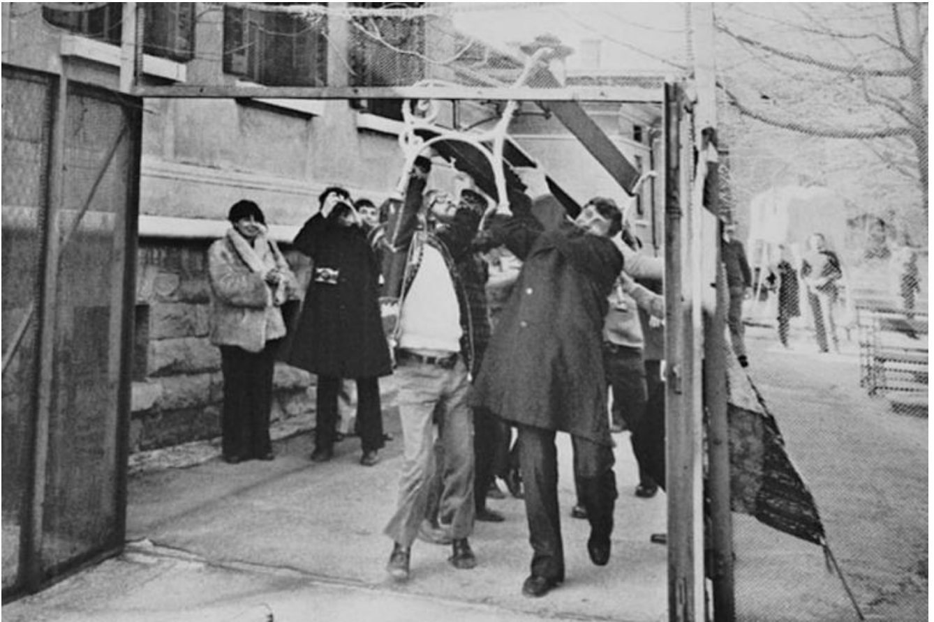
Franco Basaglia rompe i muri dell'op di Trieste per far uscire Marco Cavallo.