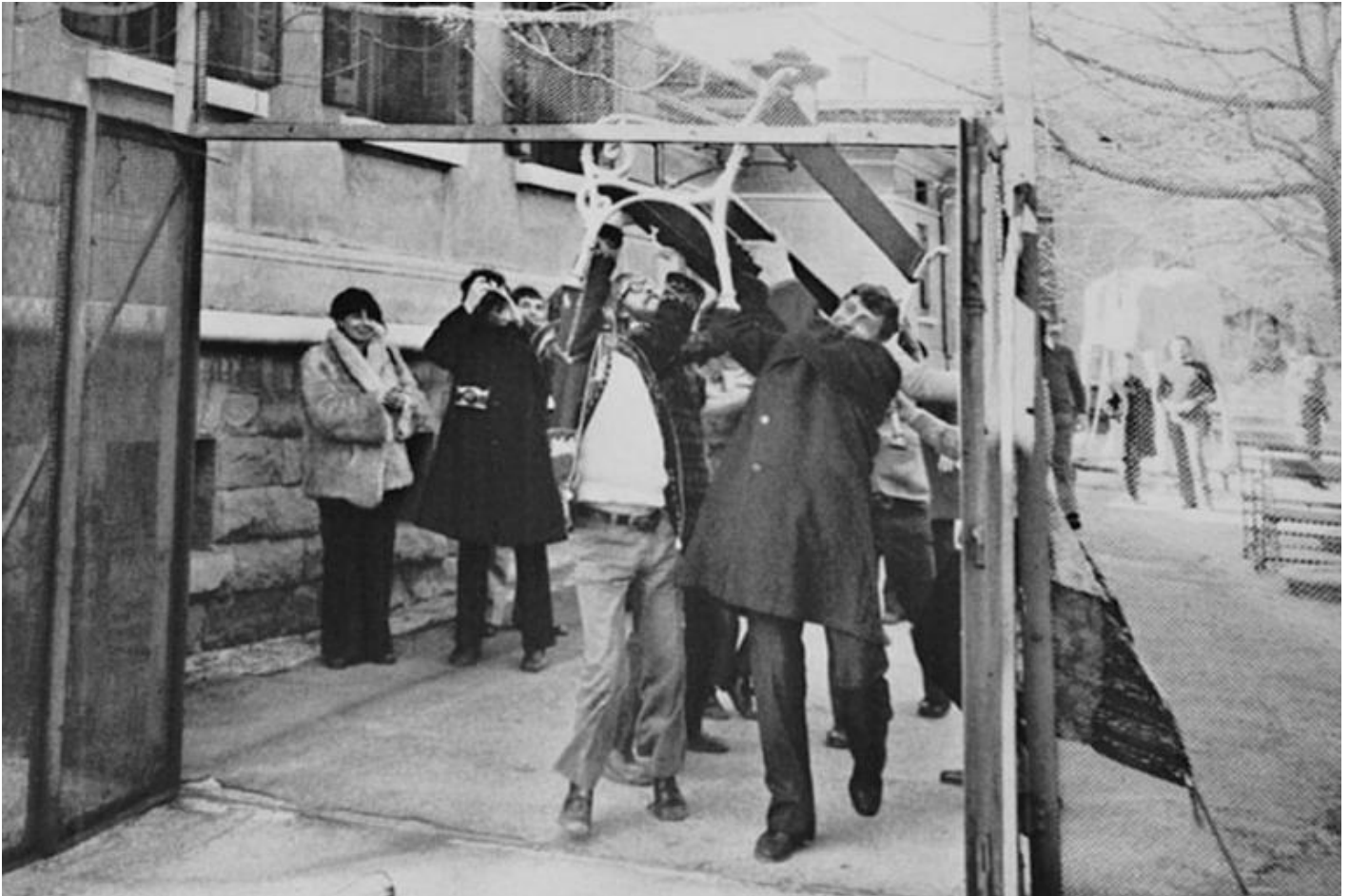
Franco Basaglia rompe i muri dell'op di Trieste per far uscire Marco Cavallo.

delicatissimo e la voce di Dell'Acqua in più punti si spezza: per la prima volta i 600 internati escono oltre le cinta rivendicando il loro diritto alla libertà e la loro appartenenza alla società e scendono in corteo fino al centro di Trieste. Difficile non commuoversi guardando l'epica fotografia di Basaglia che sfonda il cancello con una panchina per far uscire Marco Cavallo: era il marzo del 1973, il primo spiraglio, il primo sintomo dell'abbattimento del muro che sarebbe poi crollato nel 1978. Da quel giorno Marco Cavallo, il simbolo del riscatto, continua a girare il mondo per narrare che un'alternativa alla reclusione è possibile grazie all'arte.