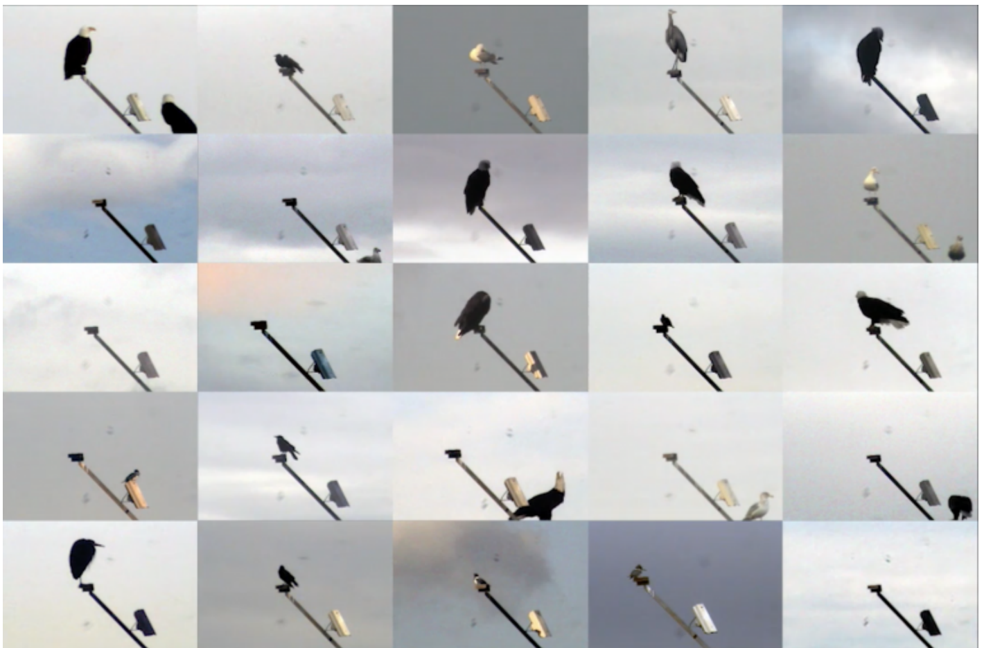
Irene Fenara, "21st Century Bird Watching", 2017, digital video, 7'00".

La ricomposizione dell'immagine avviene, nelle mie scansioni, preferendo la successione temporale a quella spaziale. Si possono rintracciare, analizzando le immagini, le varie posizioni che le fotografie come oggetto hanno assunto nel tempo, la traccia che hanno lasciato sul piano dal loro muoversi nello spazio. Lo spazio, il tempo e il movimento si spostano su un altro piano di lettura, un quinto orizzonte che si trasforma in una dimensione in cui le storie si sovrappongono e scorrono allo stesso tempo.