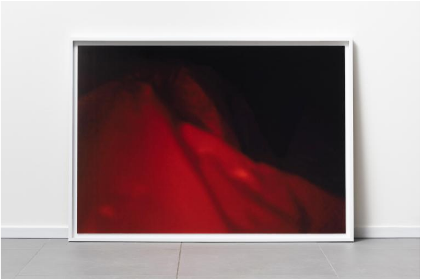
Irene Fenara “Supervision. photo from surveillance camera”, 2018, cm 85x120, installation view “Blind and other Cloudings, Spazio Leonardo, Milano .