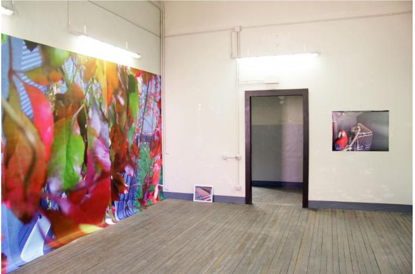
Irene Fenara "Supervision. photo from surveillance camera", 2018, photos from surveillance cameras installation view BACO Bergamo.

dell'isola. Ho cercato di restituire in parte l'esperienza di un luogo tramite la visione mediata del luogo stesso. Le ho mostrato immagini del paesaggio in movimento sullo schermo della sua televisione ma quello che mi ha più colpito è stata la differente reazione tra moglie e marito. Il marito si è infatti emozionato nel vedere i luoghi che riconosceva come la sua isola mentre la moglie non era particolarmente coinvolta. Questo mi ha fatto riflettere su come l'esperienza diretta e l'esperienza mediata producano sensazioni molto differenti se non opposte. Non intendo dire che una sia meglio dell'altra ma che c'è una differenza se guardiamo un oggetto, la fotografia dell'oggetto o la fotografia della fotografia dell'oggetto e che la scelta del linguaggio è determinante.