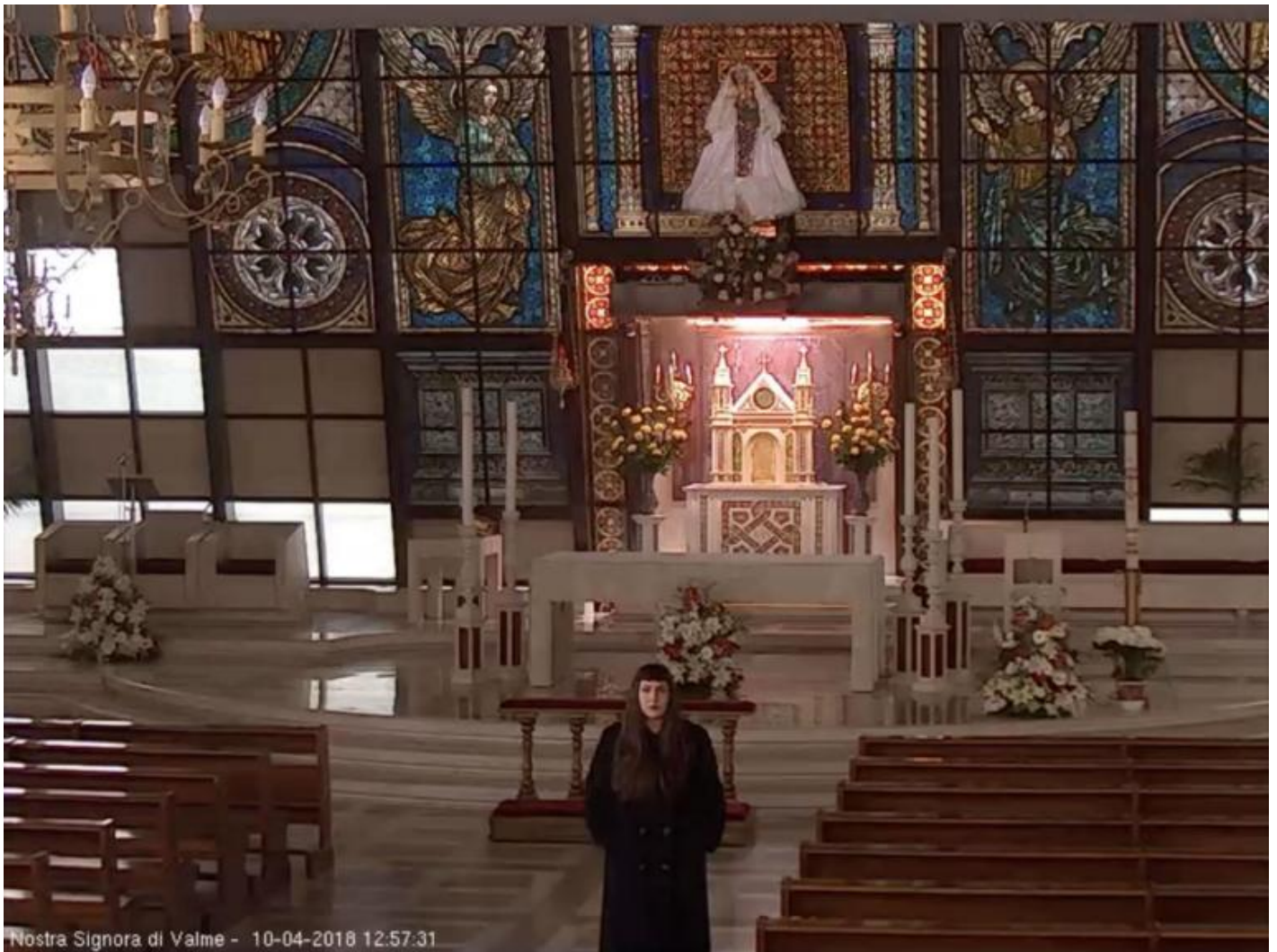
Irene Fenara, "self portrait from surveillance camera", 2018, cm 36 x 47, courtesy the artist and UNA.