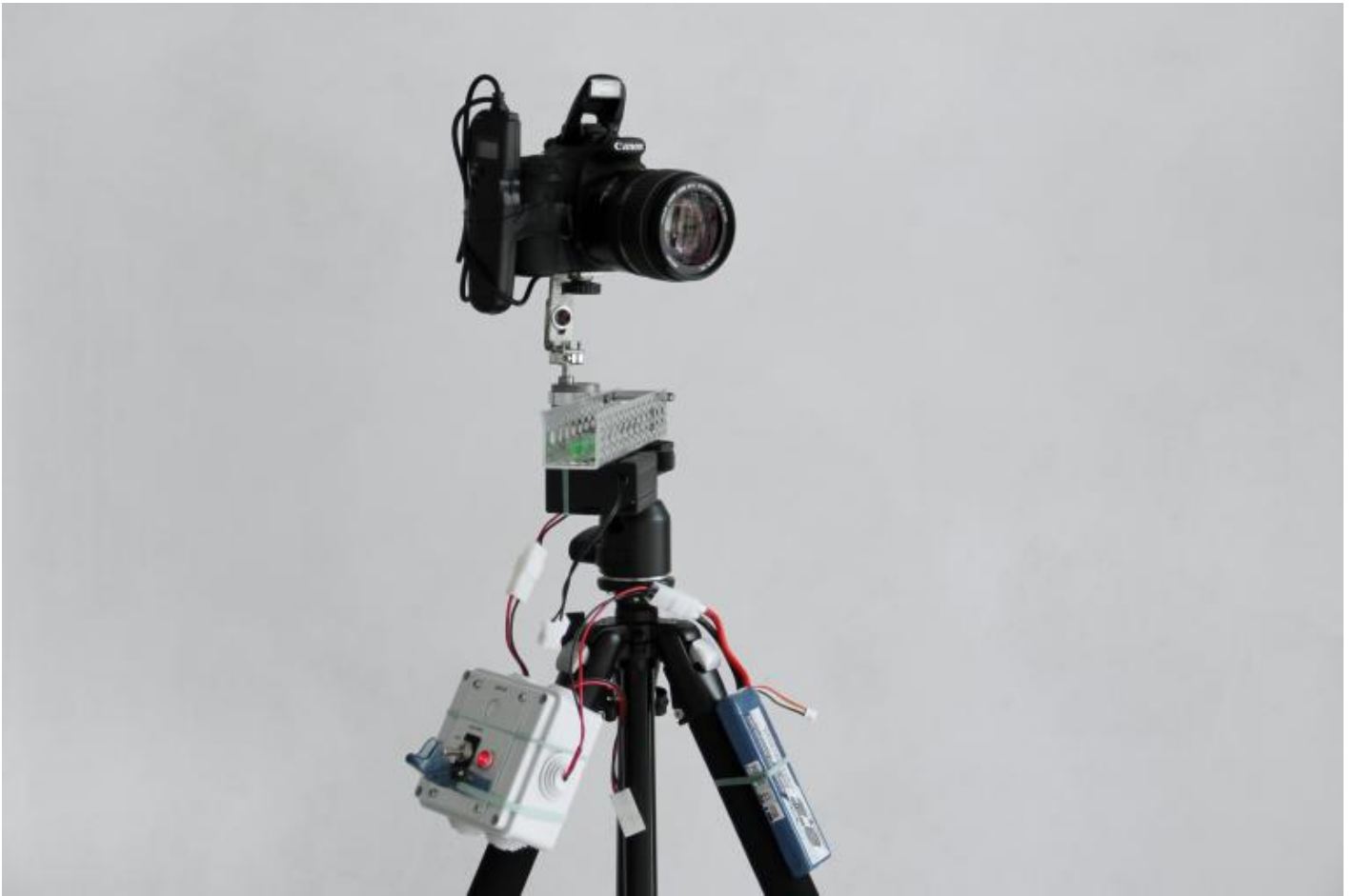
Irene Fenara, "Alta frequenza", 2015, multimedia installation, LocaleDue, Bologna.