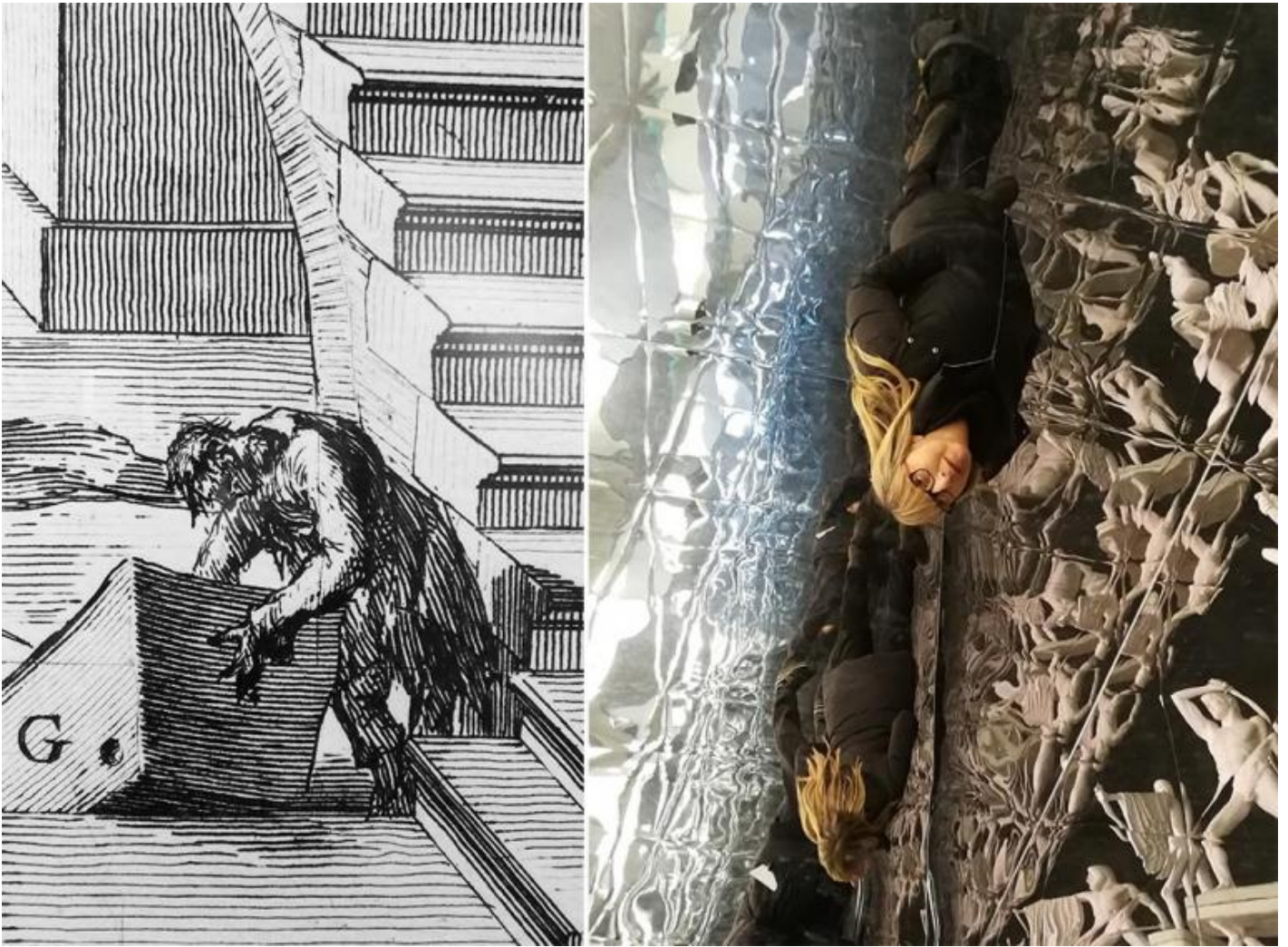
Giovan Battista Piranesi, Particolare di veduta. / Sezione Decorum: la riproduzione volontaria.

Al piano terra della Crypta Balbi è esposta l'opera Split stone (7:34) dell'artista contemporanea Sarah Sze, alla quale la galleria d'arte Gagosian di Roma ha dedicato una personale (fino al 27 gennaio 2019). L'opera, che non ha un rapporto con la mostra ideata da Serlorenzi, fissa la fugacità di un tramonto in un masso di granito mettendo in evidenza come ogni immagine stampata, proiettata o dipinta sia composta da particelle d'inchiostro e luce, che migrano dallo schermo alla tela e poi alla scultura e all'architettura. Queste particelle si trasferiscono da un linguaggio all'altro cambiando supporti e materiali, come i temi figurativi e decorativi del mondo classico nella produzione di Volpato. Involontariamente un'altra opera d'arte contemporanea entra a far parte del pastiche , nel segno della traduzione anziché della serialità e della catastrofe che incombe.