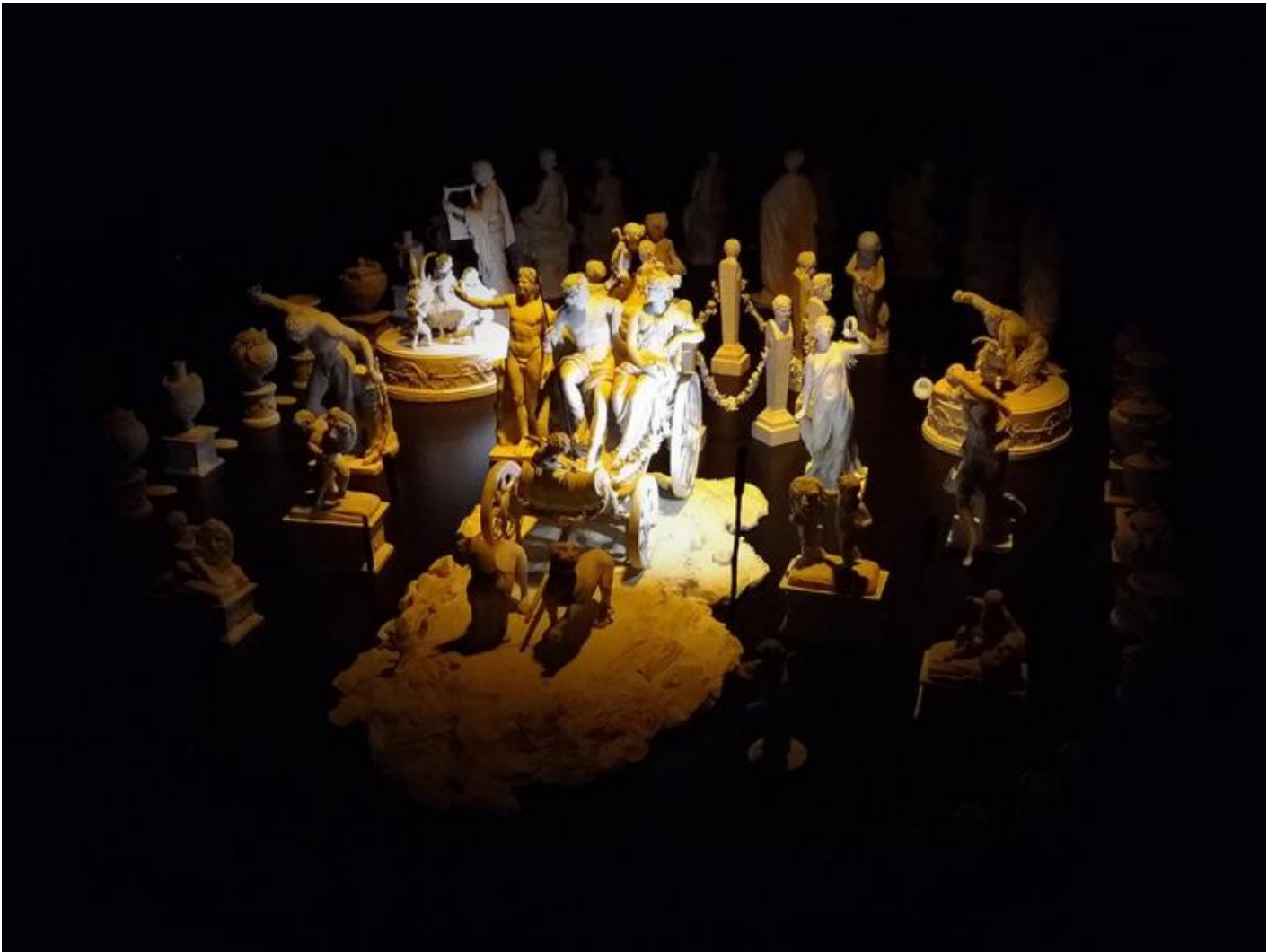
Giovanni Volpato, Dessert di Bacco e Arianna, centrotavola composto da 115 pezzi, presentato come installazione multimediale. Bassano del Grappa, Musei Biblioteca Archivio.

La serialità della Pop Art è assunta da Mirella Serlorenzi, archeologa e ideatrice della mostra, come originale chiave di lettura della produzione artistica di Volpato, che rese popolare l'arte classica con una vasta e variegata traduzione delle opere in dimensioni, materiali e supporti diversi. Statuette ma anche tazze, piatti, portauova, calamai, dessert, candelabri... oggetti vari sui quali figure e motivi decorativi tratti dall'iconografia del mondo classico migrarono spostandosi da uno all'altro con trasferimenti di supporto e salti di scala. Sia la fiorentina Doccia-Ginori che la Real Fabbrica napoletana avevano avviato ancor prima di Volpato la riproduzione seriale in scala ridotta della scultura classica inaugurando l'epoca dei souvenir in porcellana, ma la manifattura romana portò la produzione a un livello qualitativo superiore. Capolavori dell'arte classica rimpiccioliti e tradotti in porcellana non verniciata per restituire la diafana luminosità e il supposto candore dei marmi classici, che invece erano in origine colorati, trasformazioni iconografiche e trasferimenti da un supporto all'altro: oltre al tema della copia e della serialità qui emerge anche quello della traduzione .