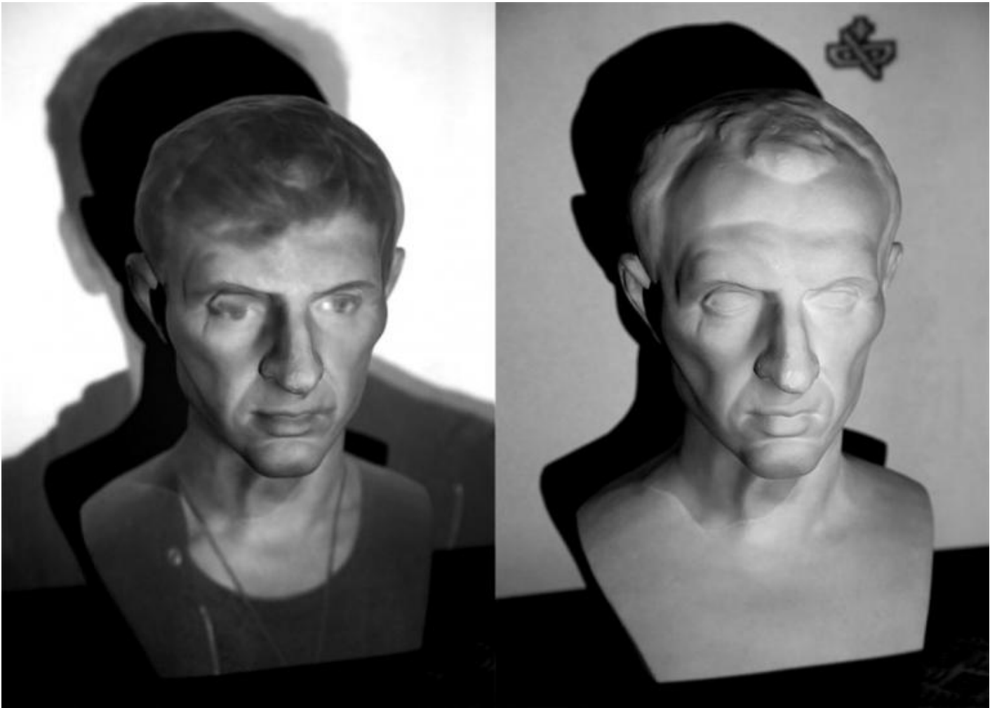
Proiezione di un volto su una copia in gesso del Ritratto di Silla, I secolo a.C.

L'immagine mostra due visi con tratti somatici diversi, ma anche due visi che appartengono a due epoche diverse. La coincidenza imperfetta richiama sia il tema dell'identità sia quello del rapporto che il nostro tempo ha con altri tempi.