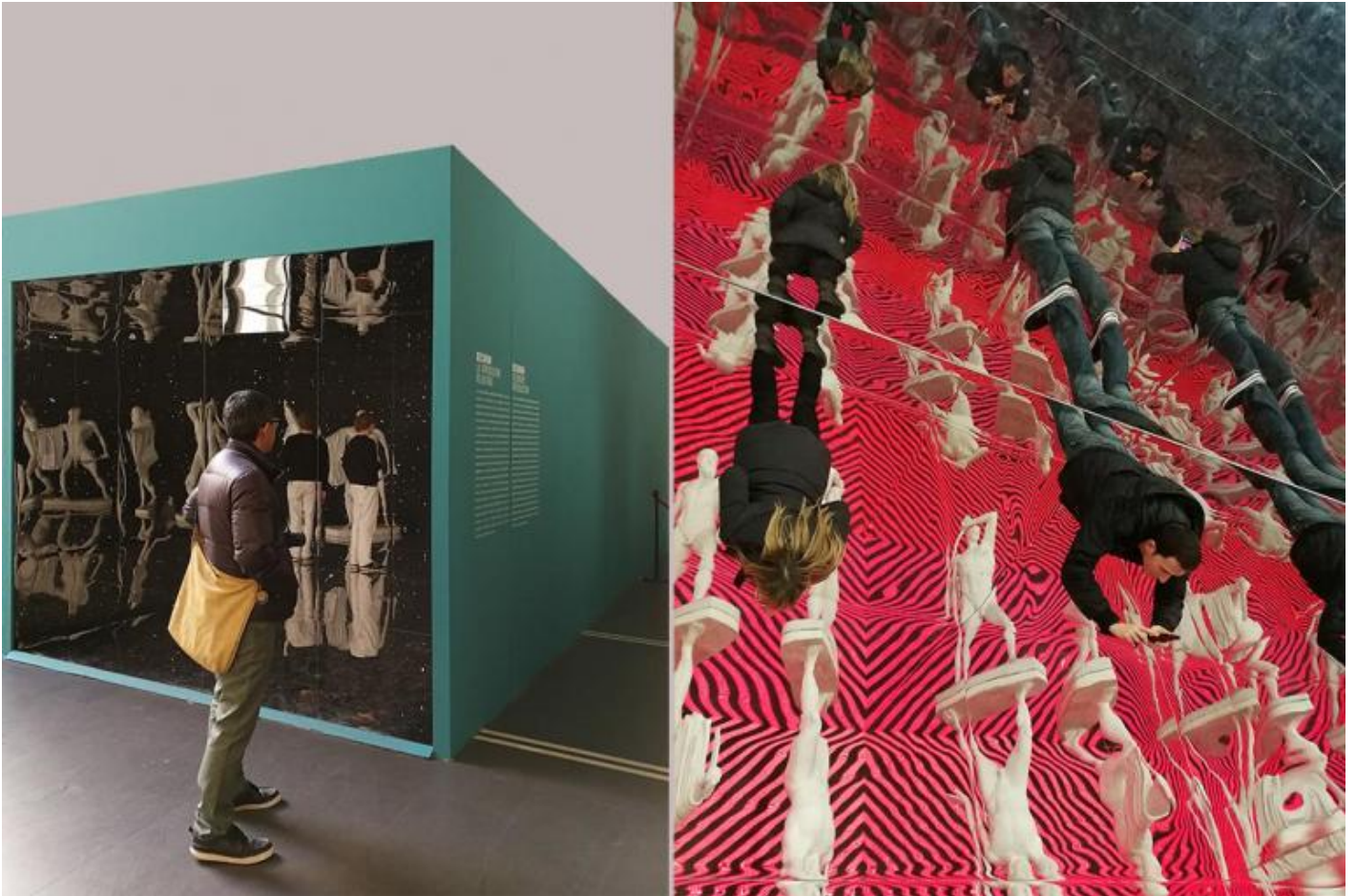
Sezione Decorum: la riproduzione volontaria. Vista dall'esterno e dall'interno.

Per questa ragione la coraggiosa se non spericolata mostra scuote gli addetti ai lavori e incuriosisce molto i non addetti. La sezione Decorum: la riproduzione volontaria , più spregiudicatamente pop di altre, è composta da un grande parallelepipedo cavo internamente ricoperto da superfici specchianti, che moltiplicano una copia del Gruppo dei Tirannicidi Armodio e Aristogitone creando un effetto psichedelico anni Sessanta: una sorta di luna pop-park che mette in scena il tema proposto dalla mostra con grande successo di pubblico. Sia le sale allestite a Palazzo Massimo che quelle allestite alla Crypta Balbi sono piuttosto fantasmagoriche.