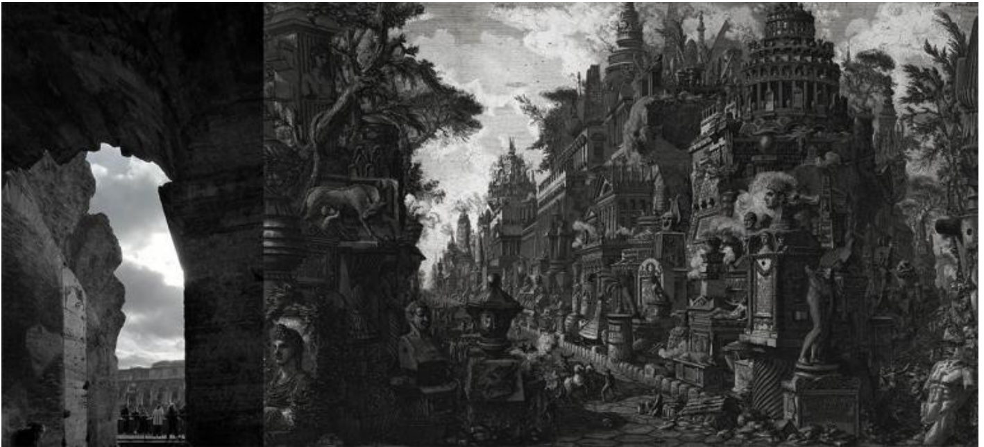
Anfiteatro Flavio. / Giovan Battista Piranesi, Veduta ideale del bivio tra la via Appia e Ardeatina tratta da Le Antichità Romane, 1756.

Mi aggiro per il corridoio curvo al piano superiore (Secondo Ordine) dell'anfiteatro Flavio, dove è allestita la mostra, soffermandomi ogni tanto a guardare attraverso le arcate dirute un cielo fortemente chiaroscurato. L'immagine è suggestiva. Richiama alla mente le incisioni di Giovan Battista Piranesi e il suo progetto di costruire una nuova Roma sulla base delle parlanti ruine . L'idea di un tempo che non scorre in modo uniforme dal passato verso il futuro ma in modo discontinuo è diventata una questione centrale anche per la critica dell'arte. La lezione inaugurale di Agamben si conclude infatti con un richiamo alle riflessioni di Walter Benjamin sulle immagini del passato che giungono alla leggibilità solo in un determinato momento della loro storia. Il fluire della storia non è continuo, evolutivo e lineare ma discontinuo e intermittente. Questa mancanza di conseguenza, questa assenza di successione che Benjamin riferisce alla storia pone una serie d'interrogativi alla critica dell'arte. "La storia dell'arte non può essere che anacronistica" sostiene infatti Georges Didi-Huberman in Storia dell'arte e anacronismo delle immagini (Bollati Boringhieri, Torino 2007). Il contemporaneo è l'inattuale, spiega Marco Belpoliti in un articolo di qualche anno fa sull'arte contemporanea , aggiungendo che "l'artista contemporaneo divide e interpola il proprio tempo, lo mette in relazione con altri tempi, scava nel passato per giungere nel futuro".