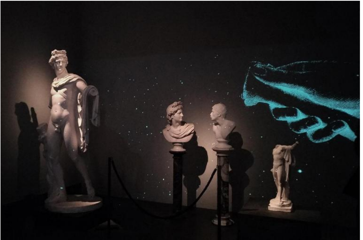
Veduta della sezione Ritorno all'antico con grazia e ironia a Palazzo Massimo. Da sinistra: Apollo del Belvedere, prima metà II secolo d.C. da un originale del IV secolo a.C. Roma, Musei Vaticani; Francesco Vezzoli, Self-portrait as Apollo del Belvedere's lover, 2011. Milano, Fondazione Prada; Antonio Canova, Perseo trionfante, 1798. Possagno, Museo Canova.