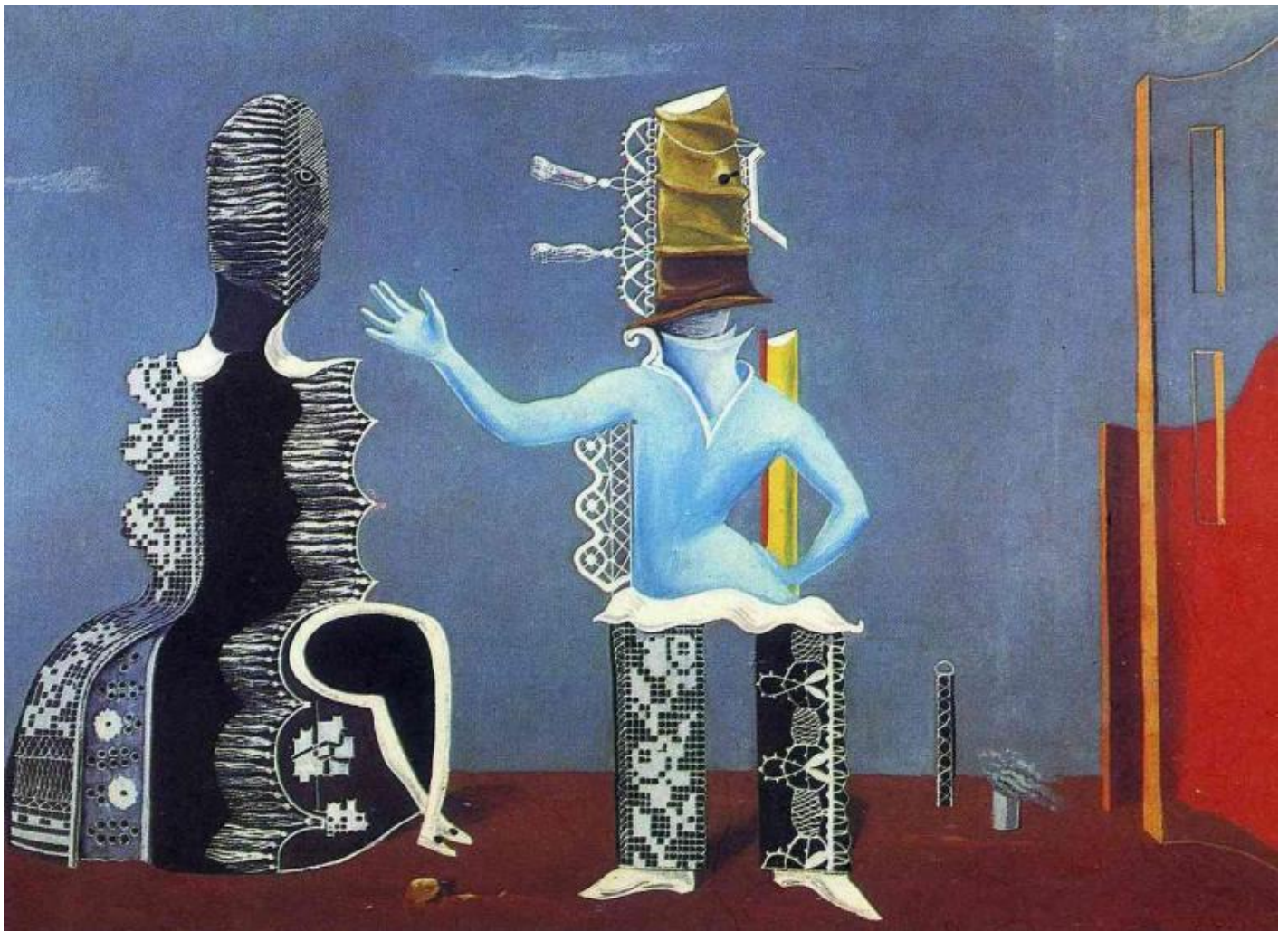
Max Ernst, Le couple , 1923.

In mostra ci sono alcune delle opere imperdibili dei principali protagonisti dei due movimenti: c'è il Torso ombelico di Jean Arp, c'è la Scatola-in-valigia di Marcel Duchamp, c'è lo sfacciato Egoismo di Francis Picabia, Man Ray a iosa, dagli "oggetti a funzionamento simbolico" più famosi (il ferro da stiro con i chiodi, la macchina da cucire impacchettata...) a fotografie e "rayogrammi" a diversi dipinti, così come numerosi Dalì, dal telefono-astice a quadri famosi come Il grande paranoico e Impressioni d'Africa (accompagnato da impressionanti disegni preparatori); c'è l'enigmatico Pittura-poesia di Joan Mirò dedicato a Michel Leiris e Georges Bataille; c'è la misteriosa Coppia di Max Ernst, nonché suoi bellissimi "frottage"; ci sono diversi René Magritte, famosi e no, tra cui un comicissimo e inquietante Personaggio seduto che raffigura invece un uomo in piedi! Ci sono le foto delle Bambole di Hans Bellmer ormai diventate imprescindibili... e così via per tanti altri artisti. Insomma la mostra è davvero antologica e di grande soddisfazione già sotto questo aspetto.