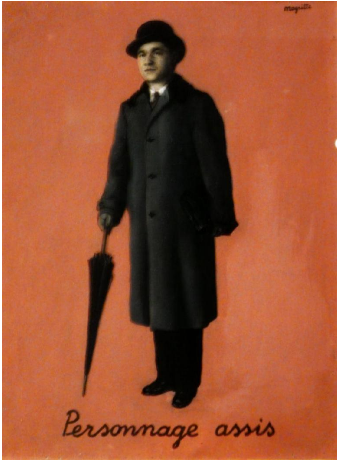
René Magritte, Le bon exemple , 1953.