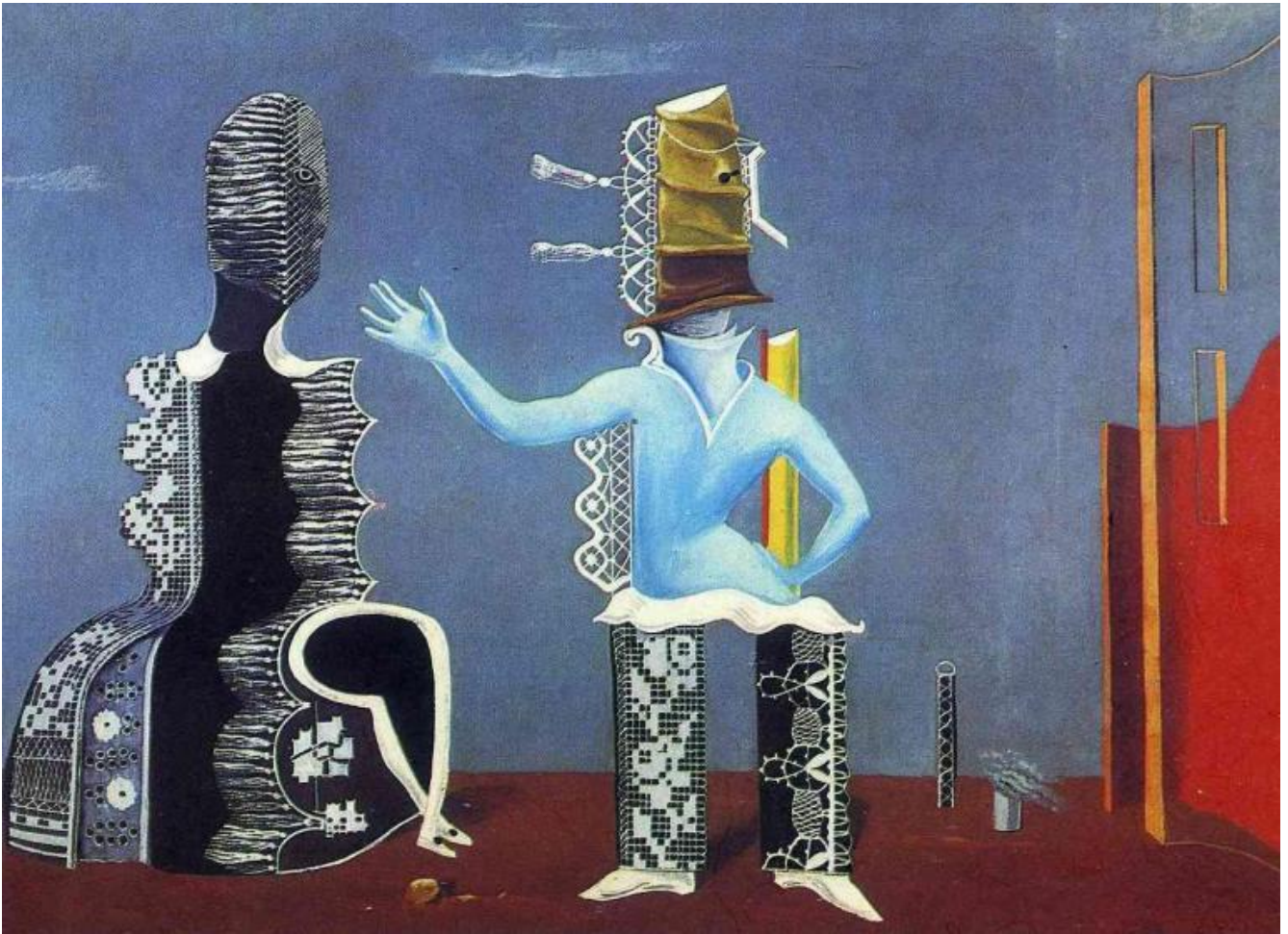
Max Ernst, Le couple , 1923.

Le opere sono raccolte in otto stanze intorno ad altrettanti nuclei tematici piuttosto che secondo un percorso cronologico: la finalità della mostra non è storica ma di rilettura e reinterpretazione. Anche i temi sono non solo i più noti e inevitabili, ma anche qui non senza slanci: così dal “nulla”, o particolare negazione (“Dada non vuol dire nulla”), di Dada si passa agli elementi di continuità con il Surrealismo, quindi al sogno e al doppio “a lezione da Freud”, si fa una pausa di riflessione con i “padri nobili e segreti” del Surrealismo, ovvero poeti e scrittori come Lautréamont (le non notissime illustrazioni di Dalì ai Canti di Maldoror ) e Raymond Roussel o il “performer”, diremmo oggi, Arthur Cravan, pugile-poeta-viveur; viene quindi naturalmente l’Eros, l’“amore folle”, non senza il risvolto di quello che viene qui chiamato “corpo offeso”, cui segue una nuova pausa sul “cuore antico” della “rivolta del Moderno” – e qui la parte da leone la fa Giorgio de Chirico – per passare a un tema meno noto qual è l’interesse dei surrealisti per la scienza nuova, dalle geometrie non euclidee alla relatività alla scissione dell’atomo (in cui Dalì vedeva l’apice “paranoico critico” dell’incontro tra fisica e metafisica). Chiudono infine una riflessione sul “rapporto tra arte e cultura