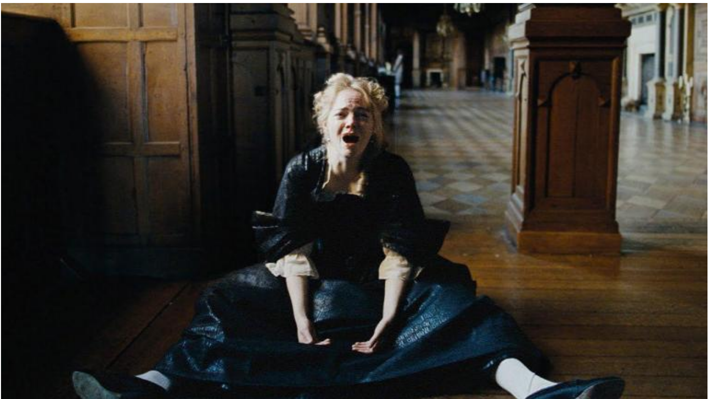
Emma Stone ne “La Favorita”.