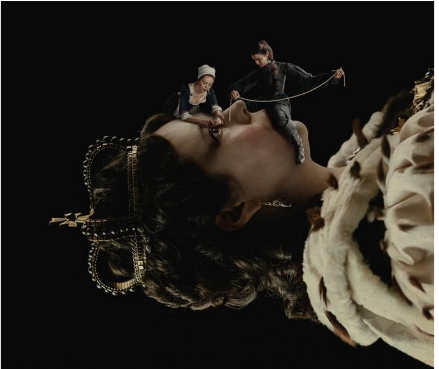
Particolare della locandina del film.