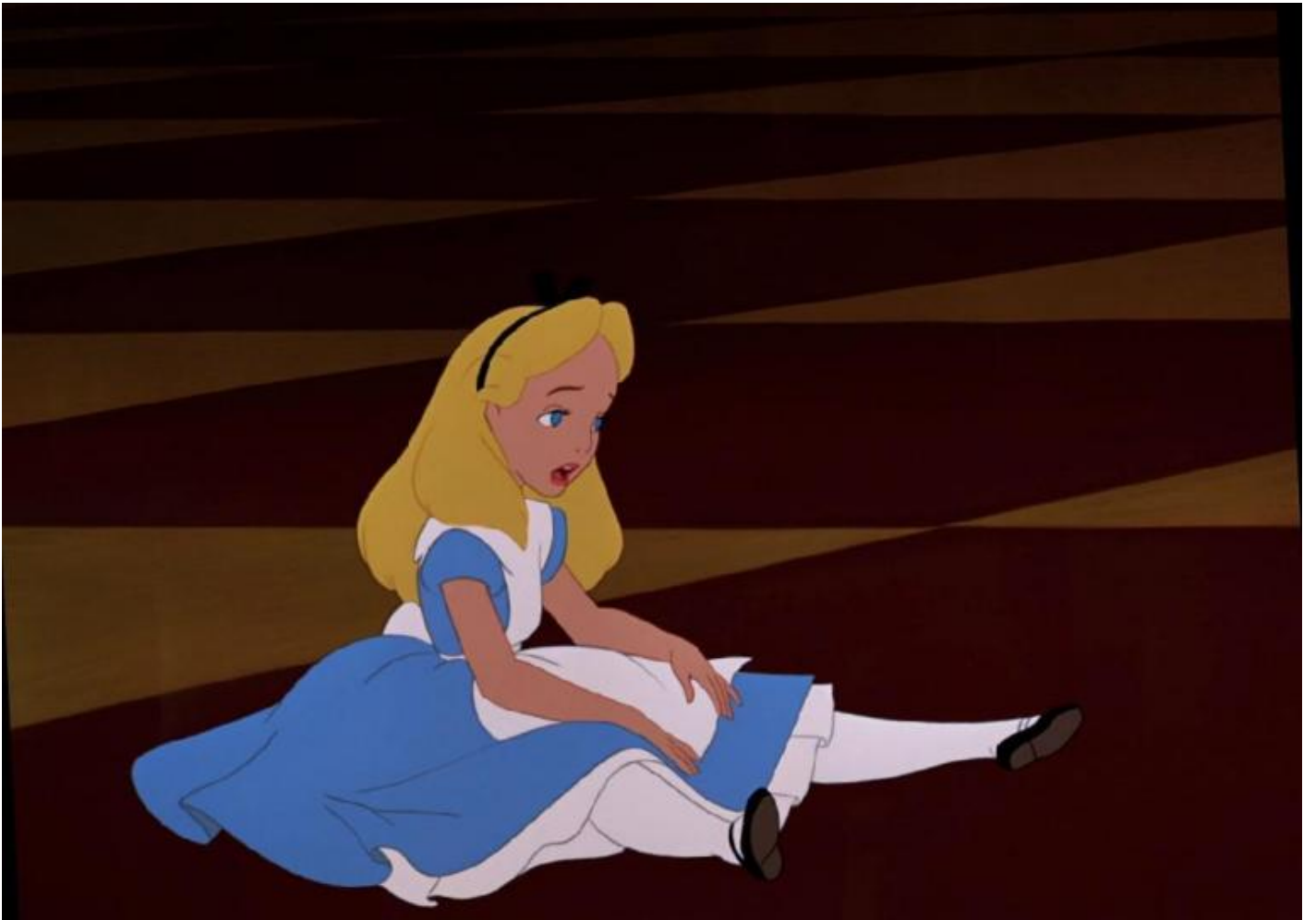
“Alice nel paese delle meraviglie”.