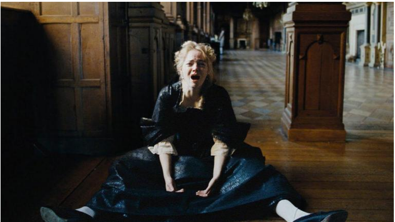
Emma Stone ne "La Favorita".