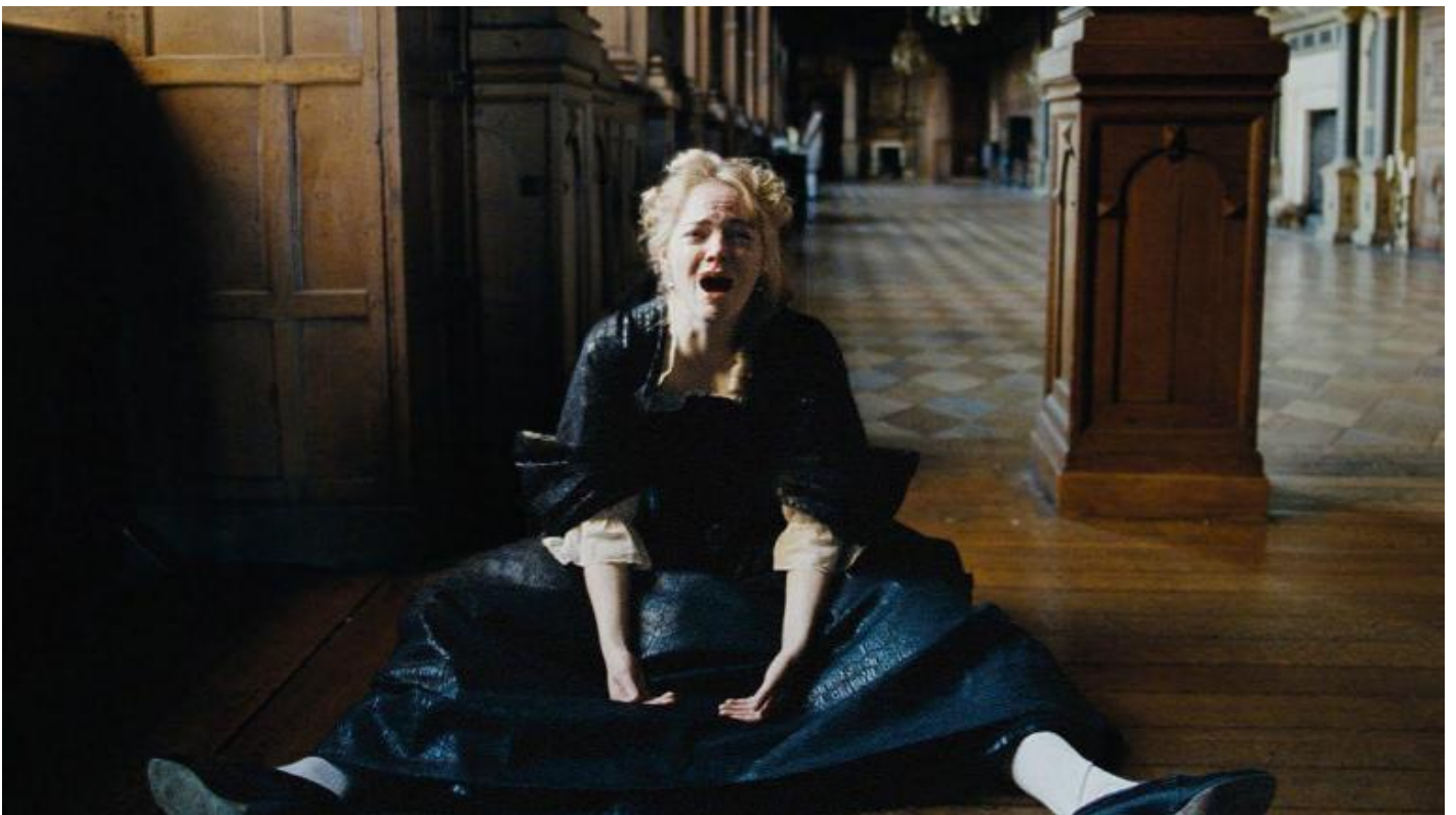
Emma Stone ne “La Favorita”.