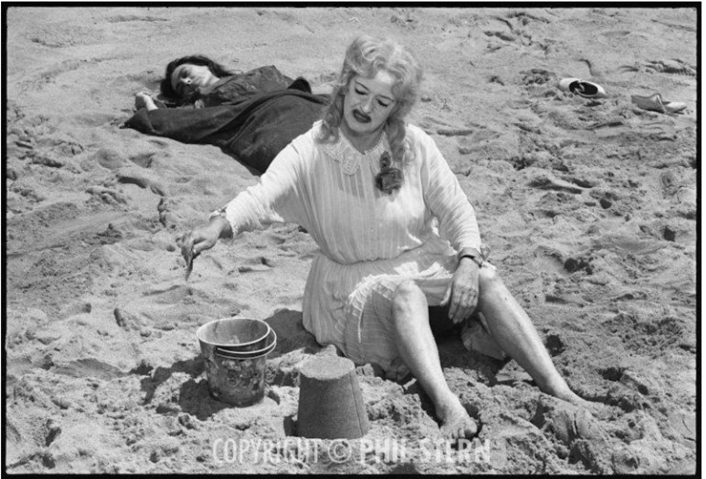
Bette Davis in “Che fine ha fatto Baby Jane?”.