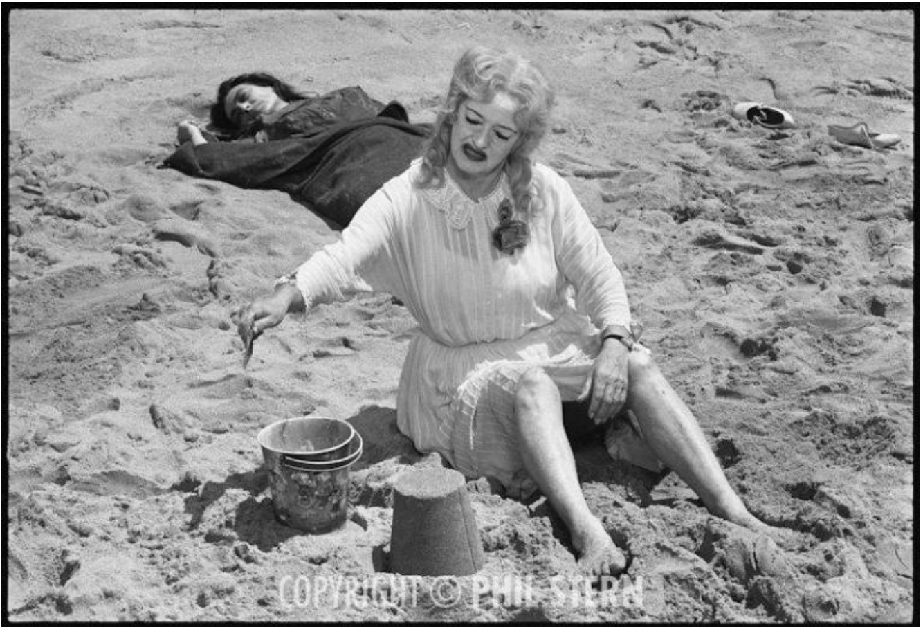
Bette Davis in "Che fine ha fatto Baby Jane?".