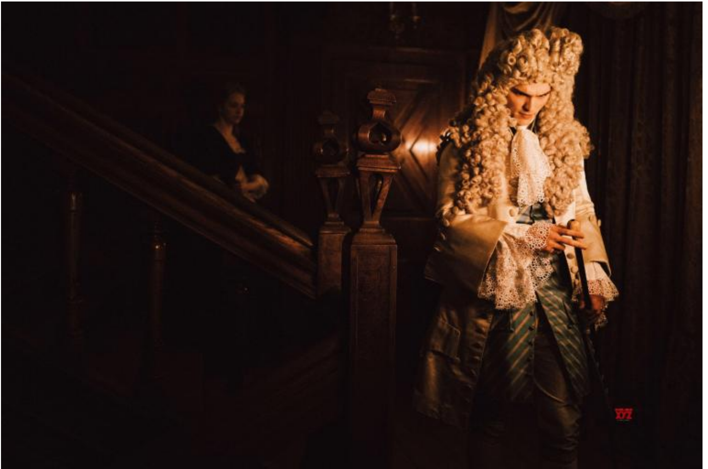
“ La Favorita ”.

Eppure, non è soltanto il trattamento grottesco e il rovesciamento dei ruoli a rendere La Favorita un film di cui non ci dimenticheremo. Piuttosto, il suo interesse risiede nel progetto volutamente ambiguo con cui la riscrittura e la regia mettono in scena l’operato e l’ambivalenza profonda di un bizzarro mondo matriarcale – avvalendosi anche della spettacolarità stilizzata dei costumi di Sandy Powell, che ha scelto per gli abiti sfarzosi delle protagoniste solo le tonalità essenziali del bianco e nero, un po’ come se fossimo in un film d’animazione ispirato a una favola.