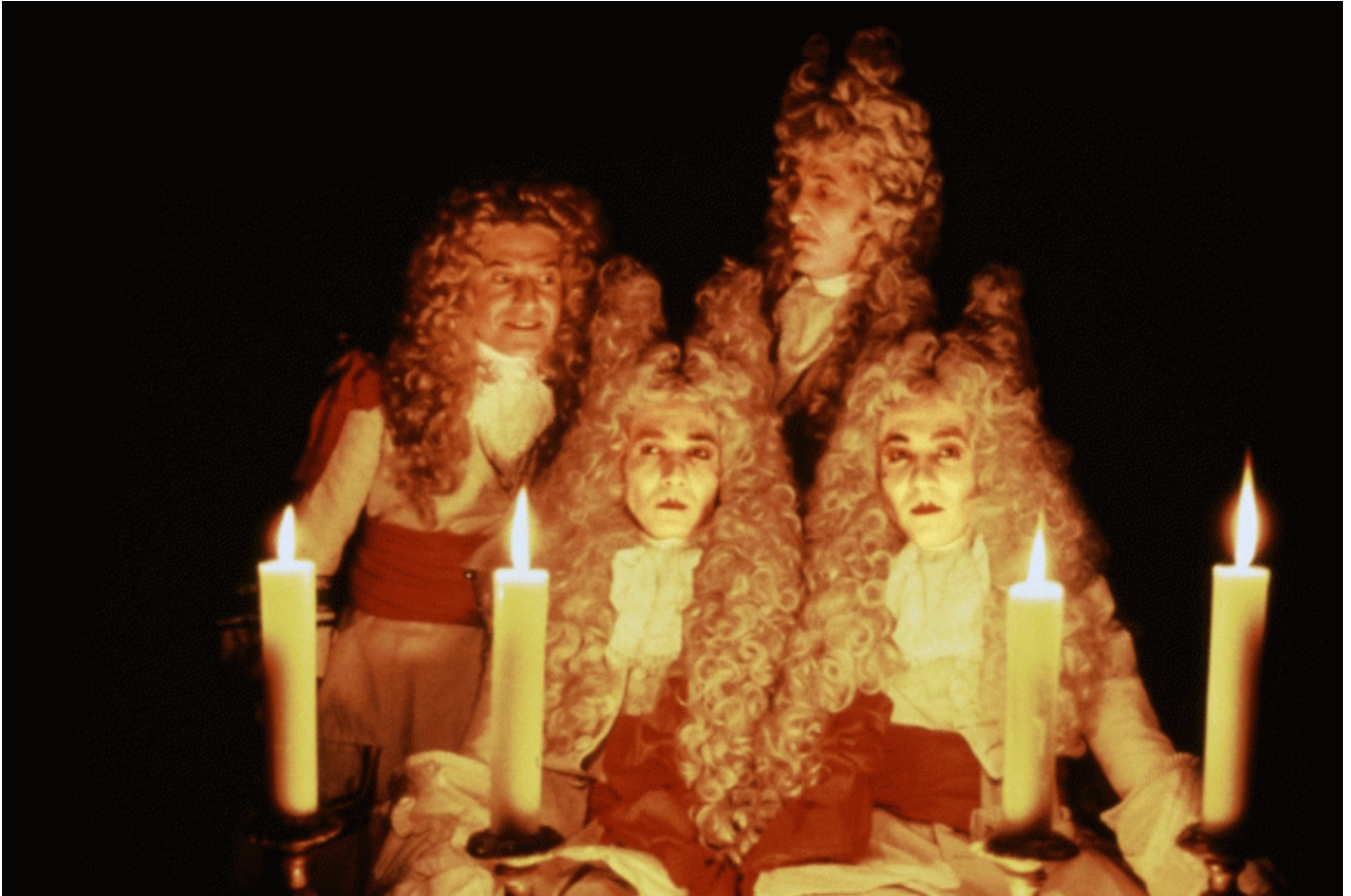
"I misteri del giardino di Compton House".

maschili (non c'è Barry Lyndon). Sono le donne le protagoniste del potere, in mezzo a un mondo maschile ironicamente marginale e futile - da questo punto di vista, volendo cercare un riferimento, più che a Kubrick viene da pensare a certe scene de I misteri del giardino di Compton House (1982) di Peter Greenaway.