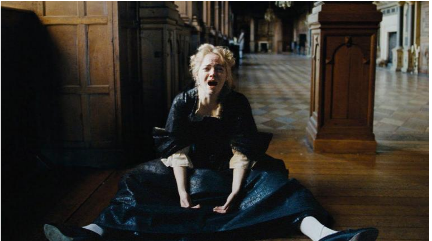
Emma Stone ne “La Favorita”.