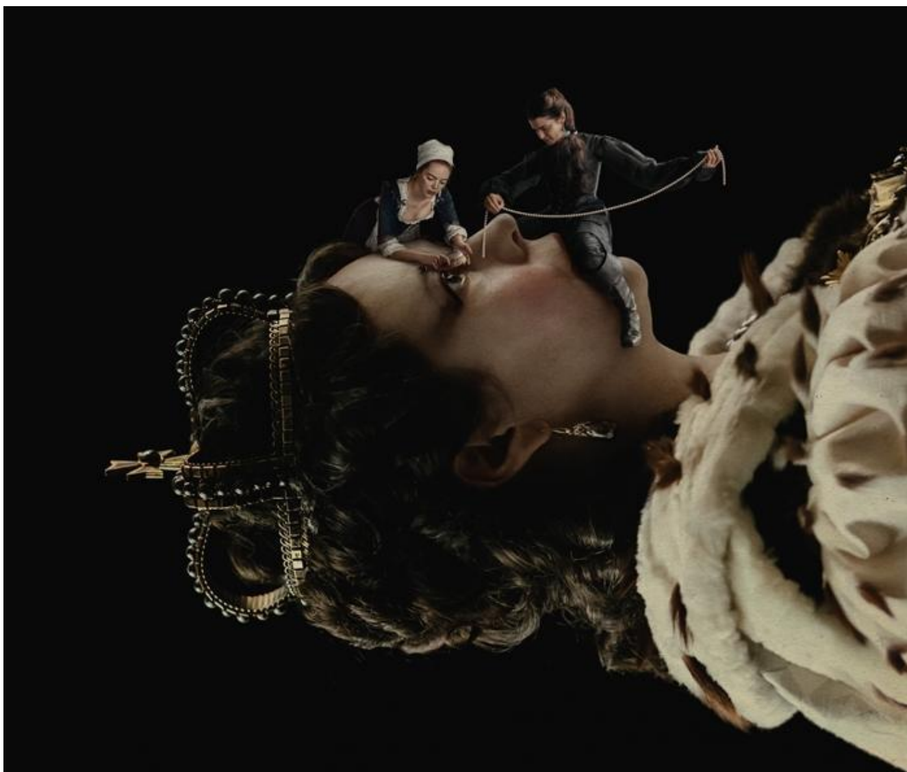
Particolare della locandina del film.