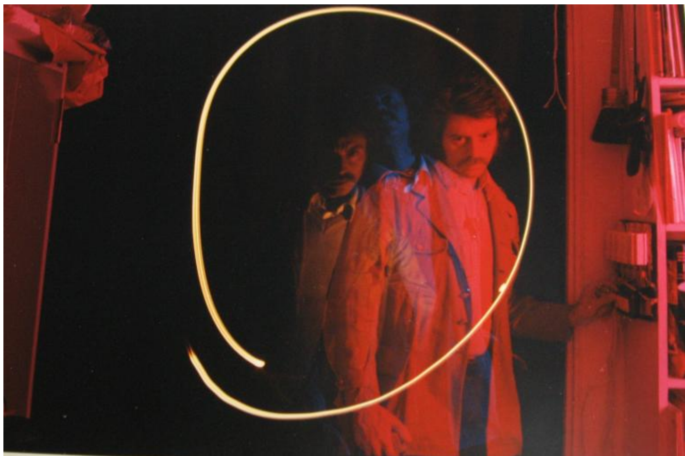
Luigi Di Sarro, Autoritratto, Scrittura luce e movimento in tre posizioni, 1975.