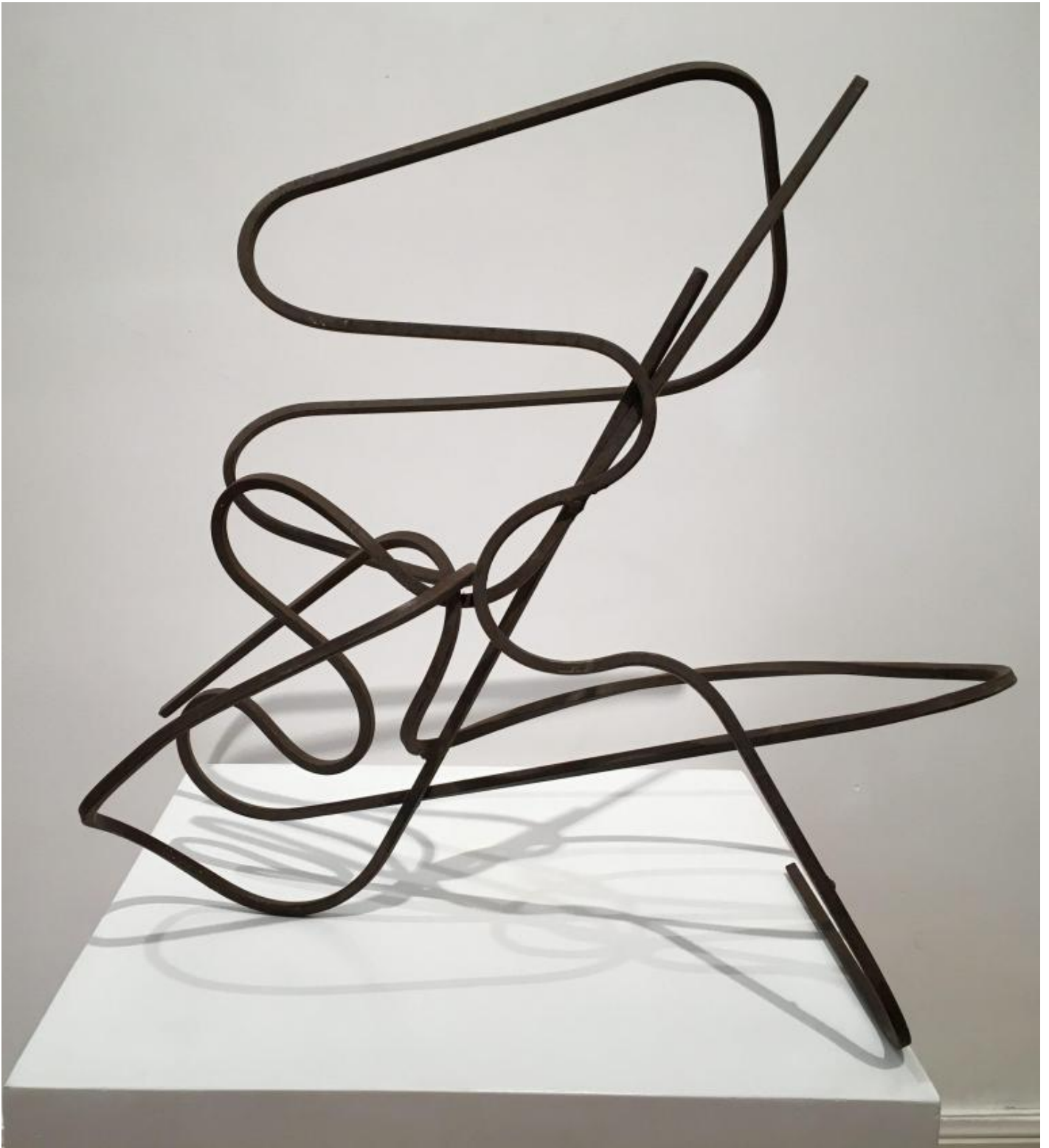
Luigi Di Sarro, Senza titolo, Scultura in tondino di ferro, 1971.

E difatti è propria di quel periodo, oggi tanto osservato e al centro di ricorrenze e anniversari, la trasformazione dell'opera in dispositivo estetico fonte di altre immagini e pensieri al di fuori di ogni convenzione linguistica, una "struttura" che sfida la triade delle belle arti «originalità, originale, origine». Si domanda ad esempio Di Sarro: "Potremmo ancora comunicare se la contaminazione del linguaggio mette in crisi il dialogo? ...per ora vale considerare la stessa ambiguità una caratteristica connotazione iconografica del nostro tempo. Molte sono le cose che l'uomo può non capire, ma forse rappresentano il documento di una cultura in divenire".