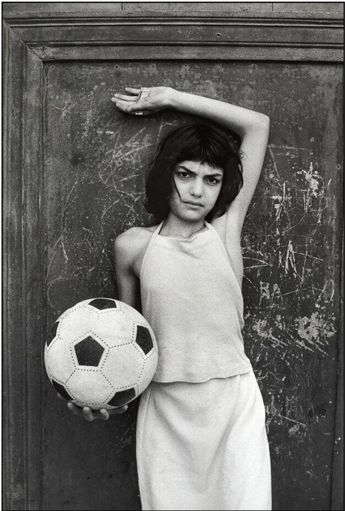
Letizia Battaglia, La bambina con il pallone, quartiere la Cala, Palermo, 1980.