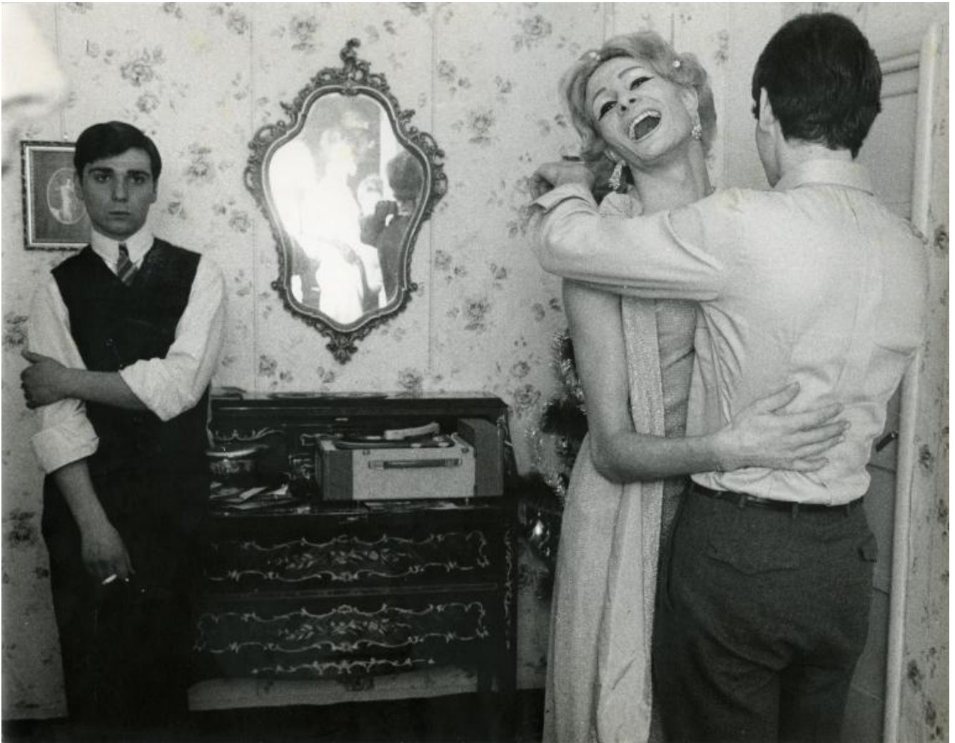
Lisetta Carmi, I Travestiti, 1965, fotografia, stampa originale a gelatina d'argento / photograph, original gelatin silver print, 18 x 24 cm, © Lisetta Carmi, Courtesy Galleria Martini & Ronchetti.

Così come accade ai “travestiti” che Lisetta Carmi inizia a fotografare nel 1965, durante una festa di capodanno nei vicoli del centro storico di Genova, la sua città natale. Nei successivi sei anni diventa loro amica e, vivendo con loro, li fotografa. Il libro I travestiti a cura di Sergio Donnabella, con testi di Lisetta Carmi e di Elvio Fachinelli, viene pubblicato nel 1972. Come era già successo a Letizia Battaglia, quel mondo le offre lo spunto per riflettere su se stessa. Il primo atto di nomadismo è spostarsi in un mondo diverso dal suo. “Io stessa a quel tempo ero assillata - forse a livello inconscio - da problemi di identificazione maschile o femminile. Oggi capisco che non si trattava tanto di accettazione di uno “stato” quanto di rifiuto di un “ruolo”. E i travestiti (o meglio il mio rapporto con i travestiti) mi hanno aiutato ad accettarmi per quello che sono: una persona che vive senza un ruolo. Osservarli mi ha fatto capire che tutto ciò che è maschile può