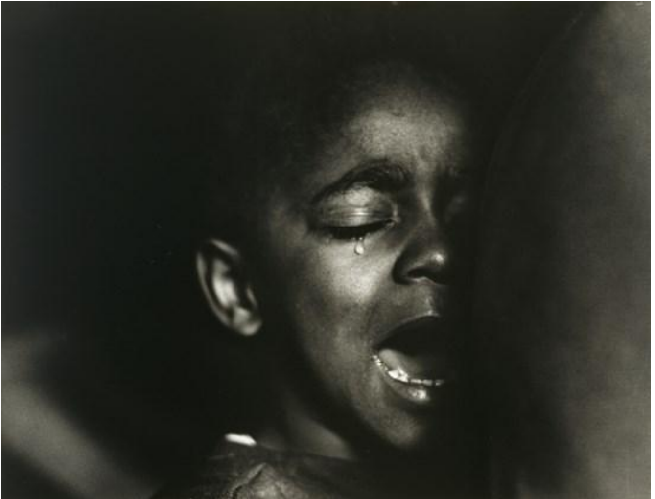
Gordon Parks, "Ellen Crying" (1968).