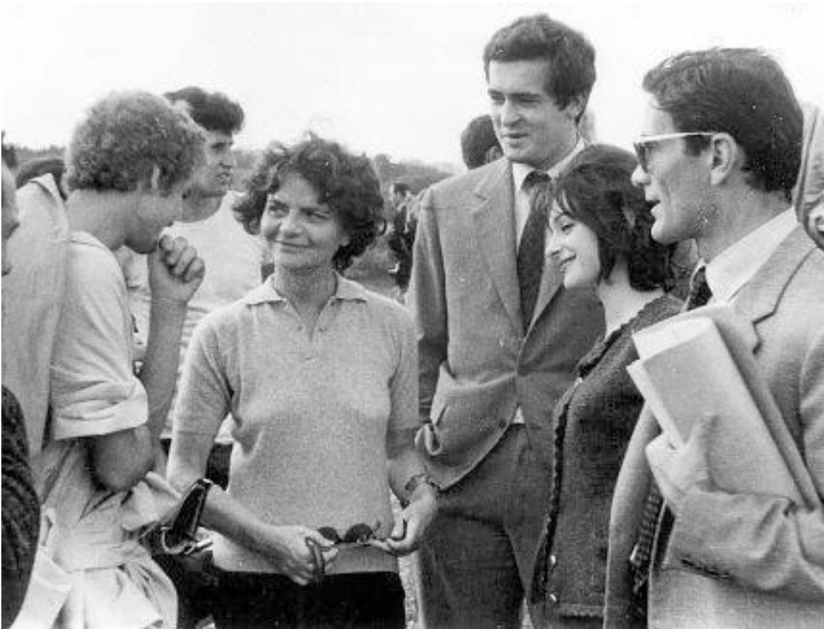
Morante con Pasolini, Bernardo Bertolucci, Adriana Asti.