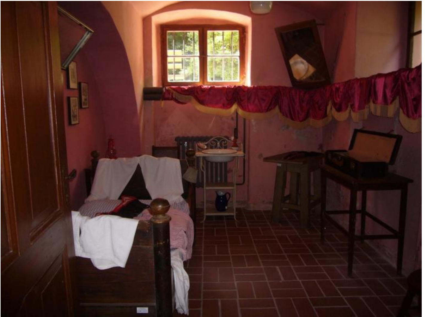
La stanzetta a luci rosse del Mulackritze.

Nei primi anni Settanta il museo divenne anche luogo di ritrovo della sotto cultura gay di Berlino est. Le domeniche pomeriggio gli attivisti del Homosexuellen Interessengemeinschaft (Gruppo di interesse omosessuale) di Berlino si davano convegno a Mahlsdorf, diventato centro culturale e di documentazione gay, e vi organizzavano conferenze, feste e celebrazioni. Se due giovani, ragazzi o ragazze che fossero, avevano bisogno di un posto tranquillo per fare l'amore, alcune stanze del museo erano messe a loro disposizione. I vetri erano stati appositamente dipinti di nero perché a eventuali ispezioni della STASI non tradissero la propria funzione.