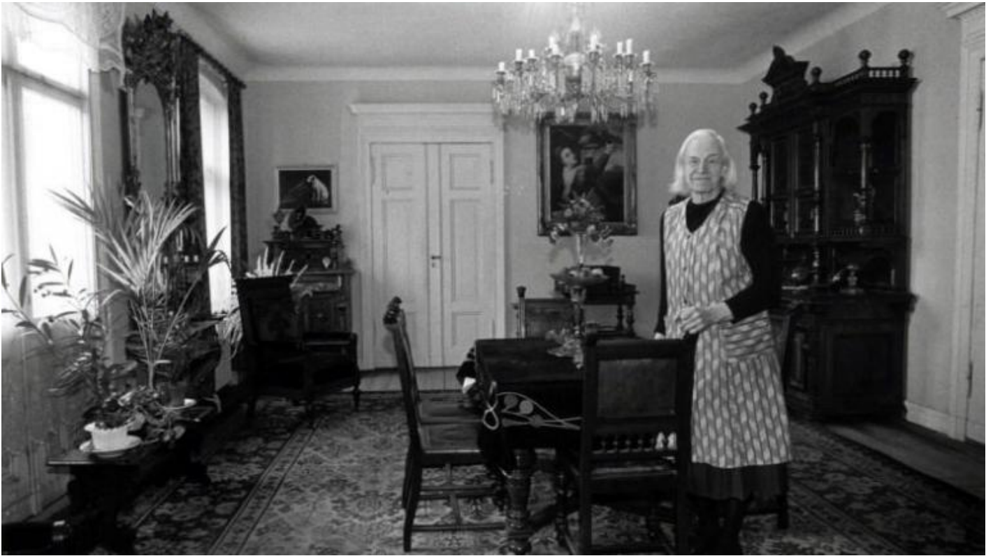
Charlotte von Mahlsdorf nel suo museo.

Ed ecco che torniamo ai mobili da cui abbiamo preso le mosse. Nella Berlino bombardata, Charlotte prese a raccogliere la mobilia che si era salvata dalla distruzione. C'è chi sostiene che anche durante la guerra non si fosse fatta scrupolo di raccogliere i mobili rimasti abbandonati nelle case degli ebrei deportati. D'altra parte è noto il suo impegno a favore della causa ebraica, la sua netta opposizione al nazismo. Tratti che contribuiscono a colorare di ambiguità la sua figura e la sua storia. Storia di un travestito che, dopo essere sopravvissuto al nazionalsocialismo, si apprestava ad affrontare la DDR: personaggio scomodo e provocatorio passato da un totalitarismo all'altro.