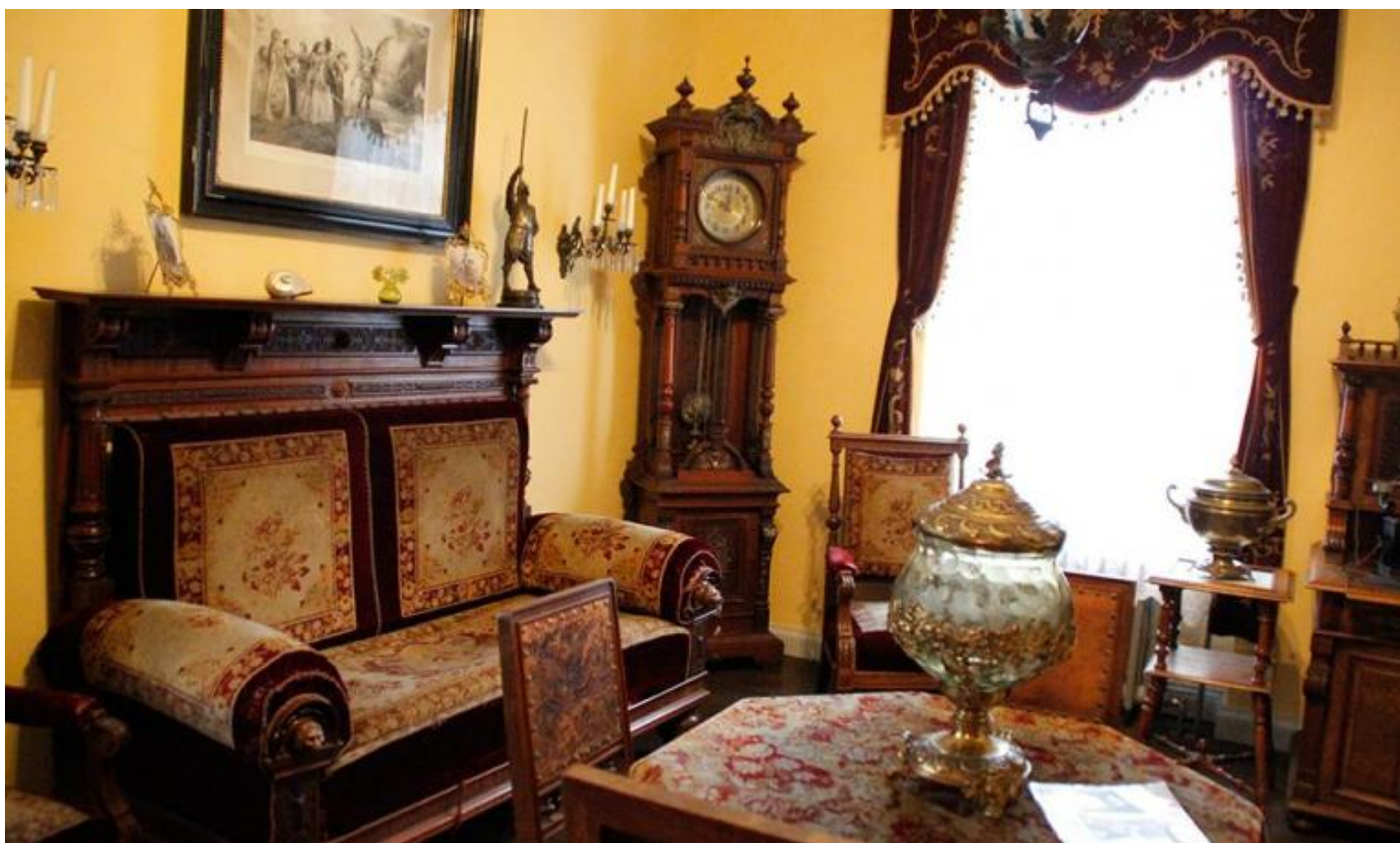
Stanza in stile Gründerzeit al Gründerzeitmuseum di Berlino.

Avete presente quelle stanze un po' soffocanti, colme di mobili massicci, riccamente intarsiati, di divani dai braccioli scolpiti con rivestimenti in tessuto damascato che pare sempre polveroso, di credenze, tavoli e sedie con gambe a torciglione, colonnine, pinnacoli? Stanze in cui, se anche si aprono le finestre, l'aria resta pesante, in cui applique e lampadari ridondanti mandano una luce tutto sommato fioca che rischiarà a stento i ninnoli ammassati nelle vetrinette e sui ripiani? Ecco. Tutto comincia da lì. Dalla mobilia che i borghesi tedeschi e austriaci avevano scelto per arredare i propri appartamenti in case che, nella struttura architettonica e nelle facciate, riprendevano gli stessi principi degli intérieur : sovrabbondanza di stili, ostentazione, opulenza, gusto discutibile.