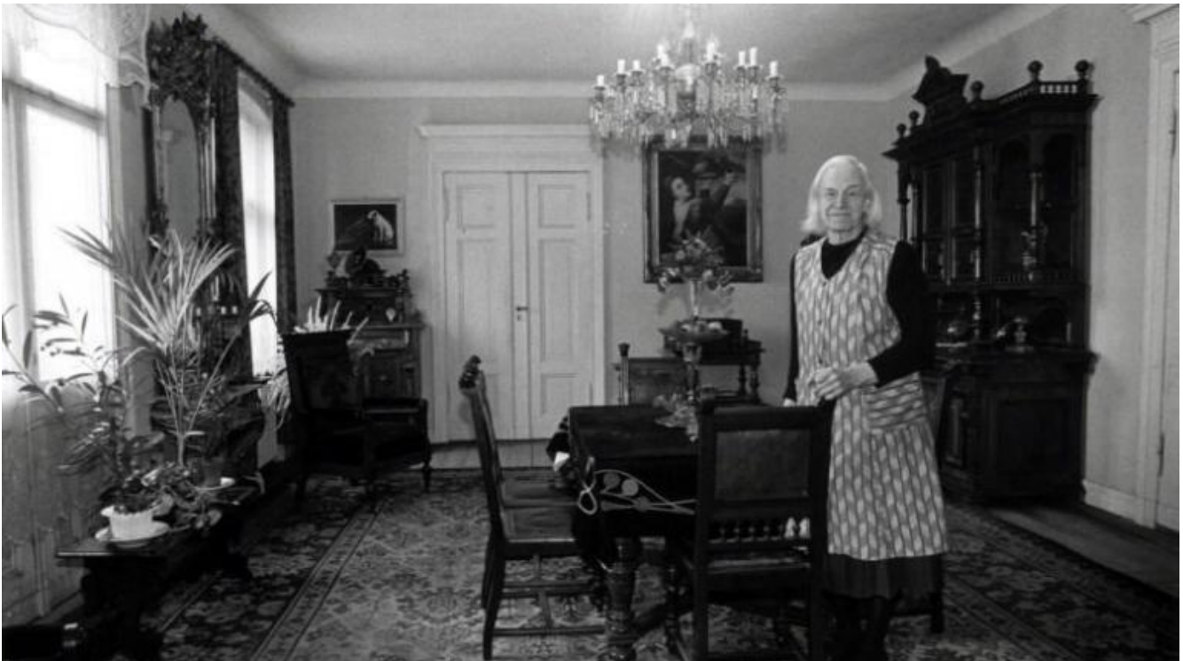
Charlotte von Mahlsdorf nel suo museo.

Dopo la guerra Lothar era diventato definitivamente Charlotte (Lottchen) a cui aveva aggiunto l'ironico cognome di von Mahlsdorf, giocando sul sobborgo di sua provenienza. I capelli si erano allungati e sarebbero stati tenuti sempre in una foggia sobria e discreta. Il viso non avrebbe conosciuto trucco. Unica concessione alla frivolezza, un filo di perle o una semplice collana. Gli abiti femminili che avrebbe prediletto non erano quelli della diva o della drag queen , bensì i dimessi indumenti della massaia, addirittura i grembiuli da donna delle pulizie.