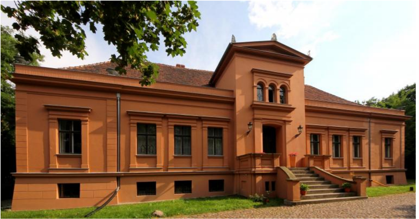
La casa padronale di Mahlsdorf sede del Gründerzeitmuseum.

collaborazione con il Märkisches Museum fu interrotta bruscamente proprio per questi motivi, ma non si arrese. Fra il 1959 e il 1960, mentre la sua collezione tornava a crescere e acquisiva forma e dimensione di quello che sarebbe diventato il museo del Gründerzeit, fece partire una campagna per la conservazione di una residenza padronale nel suo quartiere natio, Mahlsdorf. In cambio degli interventi di risanamento le fu concesso l'uso dell'edificio senza affitto da pagare. A quanto racconta lo restaurò da sola lavorando alacremente giorno e notte. Il 1960 vide la luce del primo settore del Gründerzeitmuseum nell'unica ala già restaurata della magione.