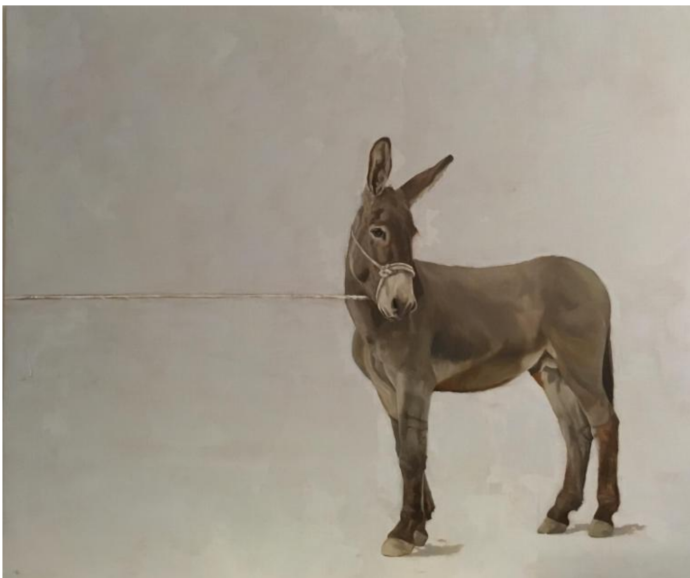
Marco Bettio, Un asino non è un cavallo, 2016, Olio su lino, cm 100x120, Collezione privata Courmayeur.

Trattare l'asino non solo come strumento da lavoro, ma – se non proprio come compagno – almeno come “vicino” ci consente di capirne meglio la natura. Credo che la grande domanda che noi possessori di asini ci facciamo sia: come fa un animale a essere così? Paziente al limite dell'indifferenza, ma insieme consapevolissimo di tutto quello che gli sta intorno.