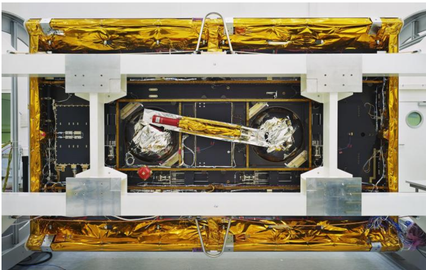
Thomas Struth GRACE-Follow-On, veduta dal basso / GRACE-Follow-On Bottom View, IABG, Ottobrunn, 2017 Inkjet print, 139,7 x 219,4 cm © Thomas Struth.

Cos'è più complesso: l'uomo e la sua a-sincronia o la macchina simbolo di organizzazione ed efficienza, dove tutto è perfettamente sincronizzato? E se pensiamo alle immagini di Struth, il confronto è riassumibile in un altro quesito: cos'è più misterioso, il mare o il caos ordinato dei fili e dei meccanismi? Così facendo, lo sguardo interroga se stesso e la sua presunta egemonia. E tocca anche il noema della fotografia, l'idea che non abbandona mai nessuno spettatore: il presunto potere di testimonianza di un'immagine, ciò che è assolutamente innegabile: l'"è stato" ( ça a été ) di Roland Barthes. Qui è tutto dinnanzi a noi eppure non c'è nulla che si possa davvero dire che esista.