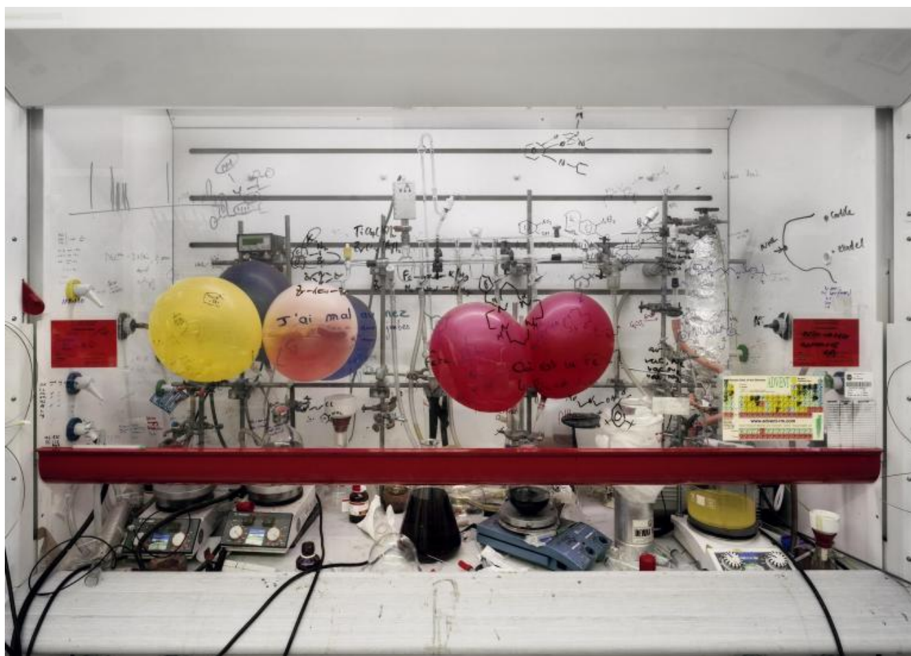
Thomas Struth Cappa chimica, Università di Edimburgo / Chemistry Fume Cabinet, The University of Edinburgh, 2010 C-print, 120,5 x 166,0 cm