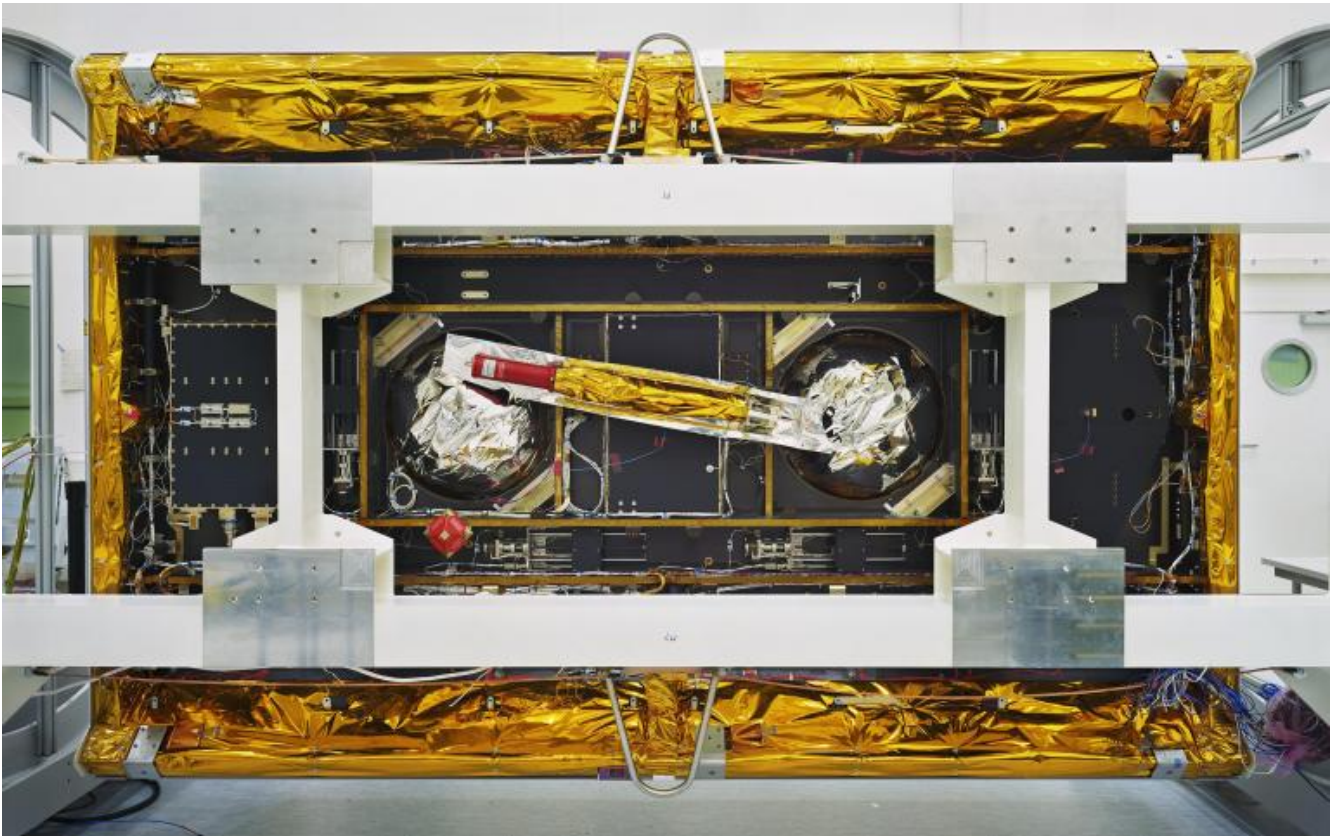
Thomas Struth GRACE-Follow-On, veduta dal basso / GRACE-Follow-On Bottom View, IABG, Ottobrunn, 2017 Inkjet print, 139,7 x 219,4 cm © Thomas Struth.

Stavolta l'indice non indica che una forma di disorientamento in cui si è immersi. L'uomo si specchia dentro la sua opera e non riesce a riconoscersi. I fili delle macchine sono al tempo stesso un veicolo verso il futuro e retaggio di un passato che non ci abbandona, sono i serpenti dei capelli di Medusa che pietrificano i pensieri dello spettatore. Che la fotografia sia lo scudo di Perseo? Difficile da dire. Per il momento sembra metterci dinnanzi alla complessità di un problema e al modo di vedere-capire, anche se la scoperta di questa relazione complessa non comporta la risposta ai quesiti che vengono sollevati, quanto il "risveglio di un problema", una presa di coscienza che non è solo intellettuale, ma anche estetica ed etica. Basta esserne consapevoli.