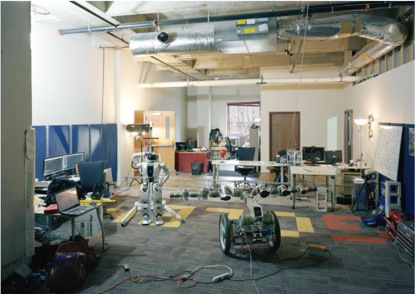
Thomas Struth Golems Playground, Georgia Tech, Atlanta, 2013 C-print, 235,1 x 328,0 cm

Il nostro occhio non prende possesso delle cose. Ciò che vediamo è caotico ma non disordinato, perché tutto sta nel posto preciso in cui deve stare. Eppure lo stile documentario dell'immagine, in perfetta sintonia con la chiarezza che evoca la presunta razionalità della scienza, non trasmette alcuna conoscenza. L'idea per cui il visibile deve essere leggibile e deve veicolare una verità che include un dovere estetico e un imperativo etico viene messa in discussione, proprio attraverso una chiarezza e una visione che escludono il senso di ciò che vediamo. Vedere non significa capire. Si può solo presumere, nel senso di supporre o, meglio, stare in bilico tra il ritenere ciò che è dinnanzi a noi e il desiderio di spingersi oltre l'immagine. Il limite di queste fotografie è anche il limite della nostra capacità di comprendere. Se il senso di "fotografia" è "scrittura della luce", "words of light" annotava William Henry Fox Talbot su una delle copie del Pencil of Nature , cosa sta scrivendo Thomas Struth? Cosa diventano gli spazi del Mast che le espone: un deposito, una galleria d'arte, un santuario, un osservatorio?