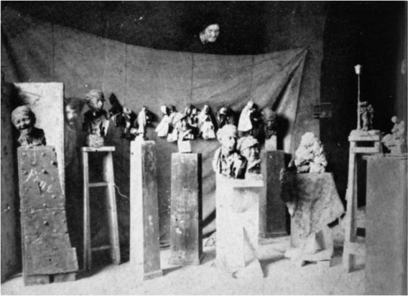
Medardo Rosso nello studio al numero civico 12 di via Solferino a Milano nel 1883. Fotografia di fotografia con collage.

Rosso sigla con uno scapigliato “cucù”, sporgendo la testa da dietro un pannello.