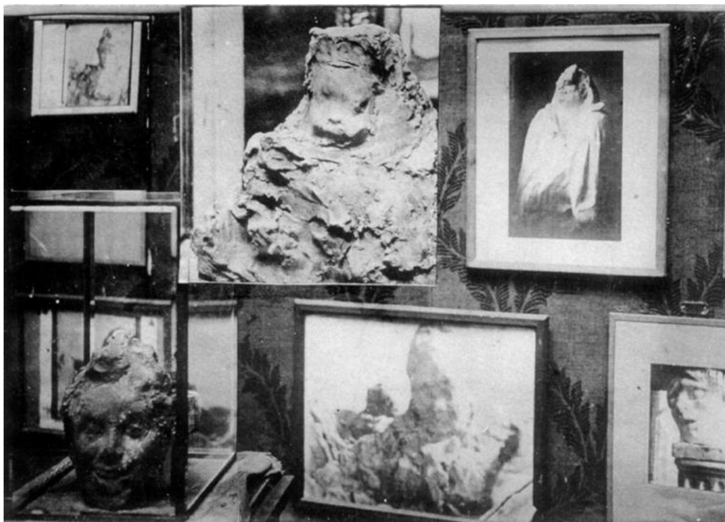
Medardo Rosso, assemblaggio di fotografie a sua volta fotografato. Aristotipo su cartoncino rigido, 1904. Collezione privata.

Mentre la mostra al Museo del Novecento di Firenze sta per terminare, un'altra mostra sull'opera di Rosso sta per iniziare.