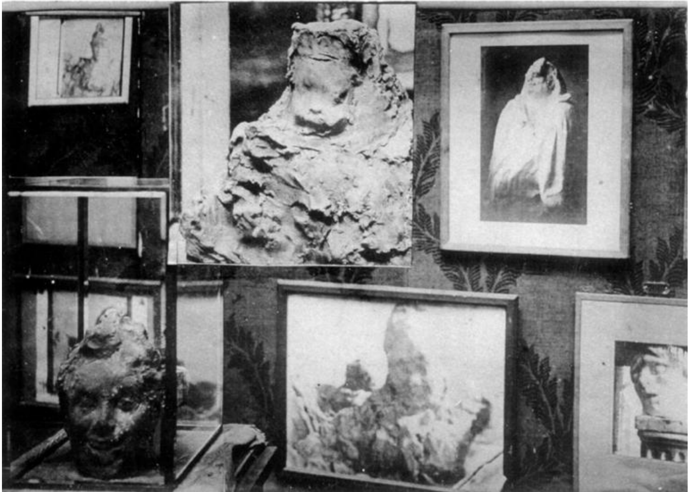
Medardo Rosso, assemblaggio di fotografie a sua volta fotografato. Aristotipo su cartoncino rigido, 1904. Collezione privata.

Mentre la mostra al Museo del Novecento di Firenze sta per terminare, un'altra mostra sull'opera di Rosso sta per iniziare.