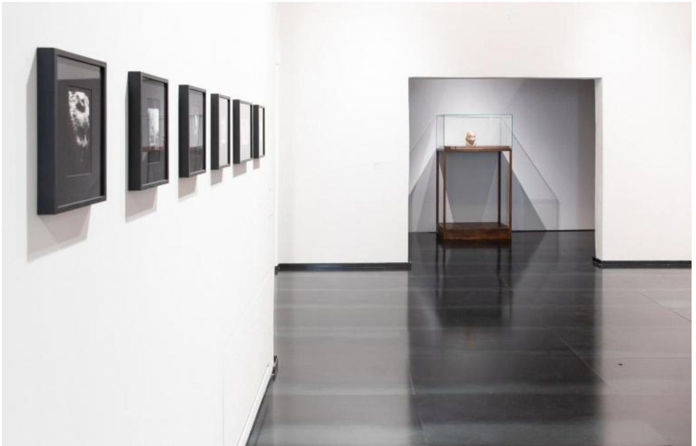
Veduta della mostra Solo - Medardo Rosso a cura di Marco Fagioli e Sergio Risaliti. Museo del Novecento, Firenze.

C'è chi ritiene che solo col medium fotografico, l'artista abbia "raggiunto l'effetto finale che ricercava". È l'opinione di Gloria Moure che nel 1996 ha organizzato la prima mostra fotografica di Rosso. In aperta polemica con le opinioni di Moure, accusata di aver forzato antistoricamente l'interpretazione dell'opera, Luciano Caramel, curatore della mostra Medardo Rosso. Le origini della scultura moderna , organizzata nel 2004 al MART, ribadisce che la scultura e non la fotografia "costituisce il raggiungimento ultimo di Rosso" e che il superamento della statuaria e della scultura-oggetto avviene "entro, e non oltre, la scultura". Ci vorrà la mostra alla collezione Peggy Guggenheim di Venezia curata da Paola Mola nel 2007 per dirimere la questione portando l'attenzione sulla "instabilità" dell'immagine causata dal suo "trasferimento" da un medium all'altro.