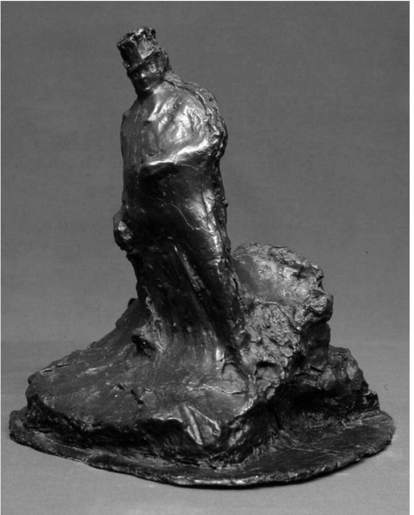
Medardo Rosso, Bookmaker, 1894. Cera. Mart, Rovereto.