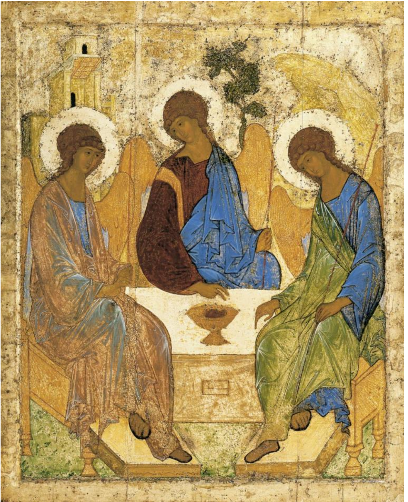
Trinità di Rublëv.

Vediamo intanto come si presenta la situazione adesso. Partiamo dal basso, cioè dal porno; quando ancora lo si vedeva al cinema, la struttura era chiara: c'erano i momenti-clou degli incontri sessuali ripresi con