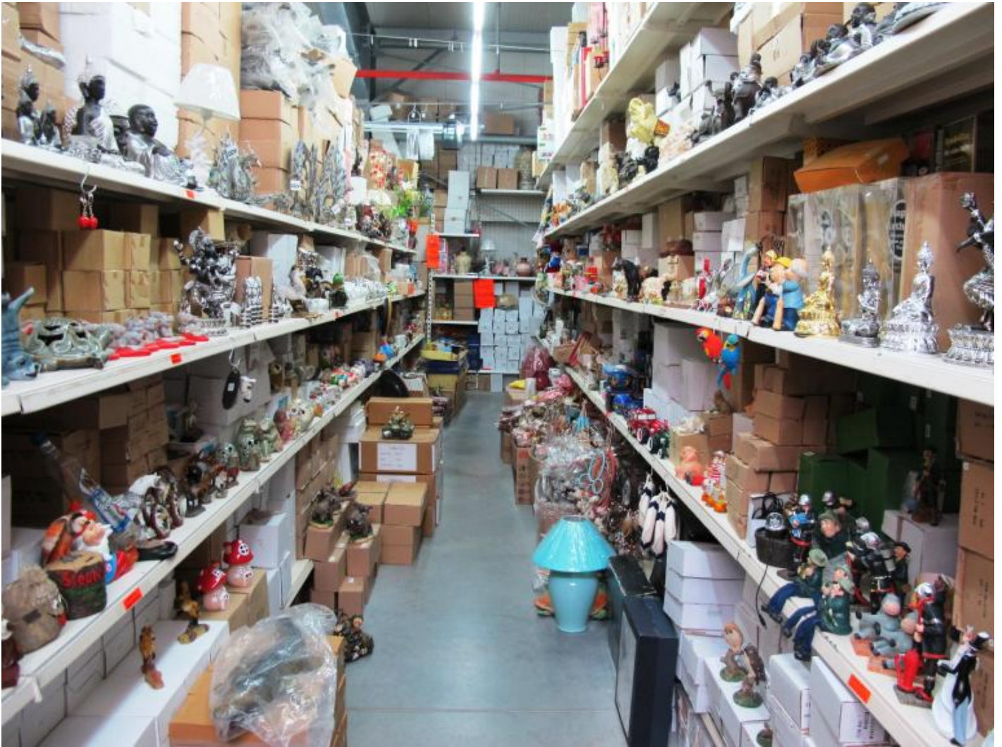
Banchi di oggettistica al Dong Xuan Center di Berlino.

Riprenderò il problema del kitsch religioso nelle puntate successive. Accantoniamo la Nefertiti vietnamita, elemento di “omaggio” a Berlino in mezzo a un universo di paccottiglia variegato e indistinto, e torniamo al punto da cui abbiamo preso le mosse. Per essere più precisi, al sito webshop del Neues Museum in cui si illustrano, e vendono, i gingilli legati all’esposizione museale. Dopo cataloghi, porta chiavi, gioielli, carte da gioco, magneti e segnalibri che riprendono e riproducono svariati elementi in mostra (gettonatissima è la dea-gatta Bastet), si arriva a lei, Nefertiti, prima in forma di maschera proteggi occhi (come quelle fornite in aereo per poter dormire), poi di busto in copia conforme all’originale. La prima, in questo caso l’occhio sinistro è risolto con un ambiguo chiaro-scuro (permane evidentemente l’idea kitsch di non perturbare l’utente), si ferma a 9,95 euro.