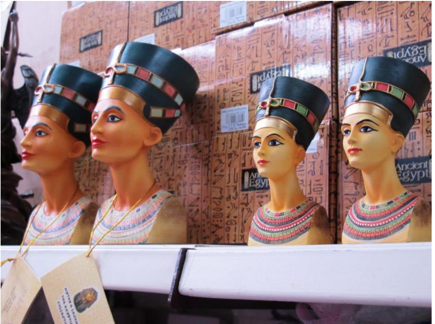
Lo scaffale delle Nefertiti in uno dei negozi del Dong Xuan Center di Berlino.

Come interpretare diversamente la volontà dei creatori delle riproduzioni? Il kitsch più autentico si compiace di rimuovere il brutto, lo scomodo, la merda, come scriveva Milan Kundera. Mette tutto a posto in modo da garantire che l'esperienza estetica sia distensiva e spensierata. Quanto funestamente attuale, anche al di fuori dei casi specifici di cui mi occupo in questa sede, risulta tale atteggiamento. E in settori e ambiti della vita, dalla politica allo spettacolo, dalla scuola alla stampa, che in teoria dovrebbero prenderne nette distanze anziché assecondarlo. La semplificazione, la riduzione di concetti complessi e importanti a nozioni banali per favorirne la divulgazione, l'innalzamento della convenzionalità a valore, l'elargizione di emozioni fasulle trionfano, ben al di fuori del centro commerciale in questione e pongono allarmanti incognite rispetto al futuro dell'umanità. Torniamo al nostro problema, solo apparentemente folcloristico e settoriale, e riprendiamo il ragionamento.