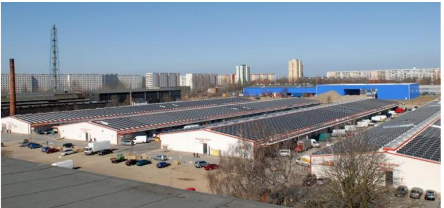
Il Dong Xuan Center di Berlino.

Oggi, sotto le volte degli otto padiglioni, fervono attività commerciali all'ingrosso e al minuto, gestite da vietnamiti (cica 16.000 nella Berlino odierna, 4000 dei quali stanziati a Lichtenberg), pakistani, indiani, turchi che propongono abbigliamento, elettrodomestici, oggettistica, giocattoli, parrucchieri, fiori di plastica, strutture per saloni di manicure, ristoranti e negozi di alimentari. Il tutto in una sequenza caotica e avvincente