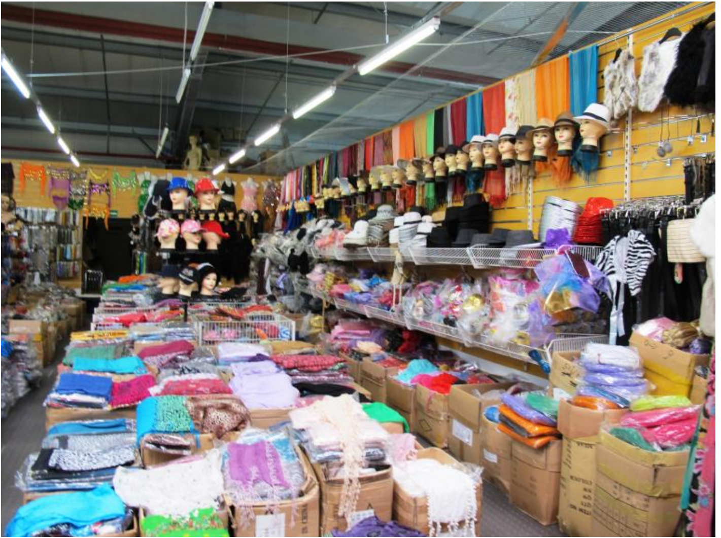
Uno dei negozi al Dong Xuan Center di Berlino.

E Nefertiti? Che c'entra? Ebbene, c'è posto anche per lei. Accanto a cento altri personaggi riprodotti in serie, vero inconsapevole omaggio a Walter Benjamin, troneggiano pure le copie della regina.