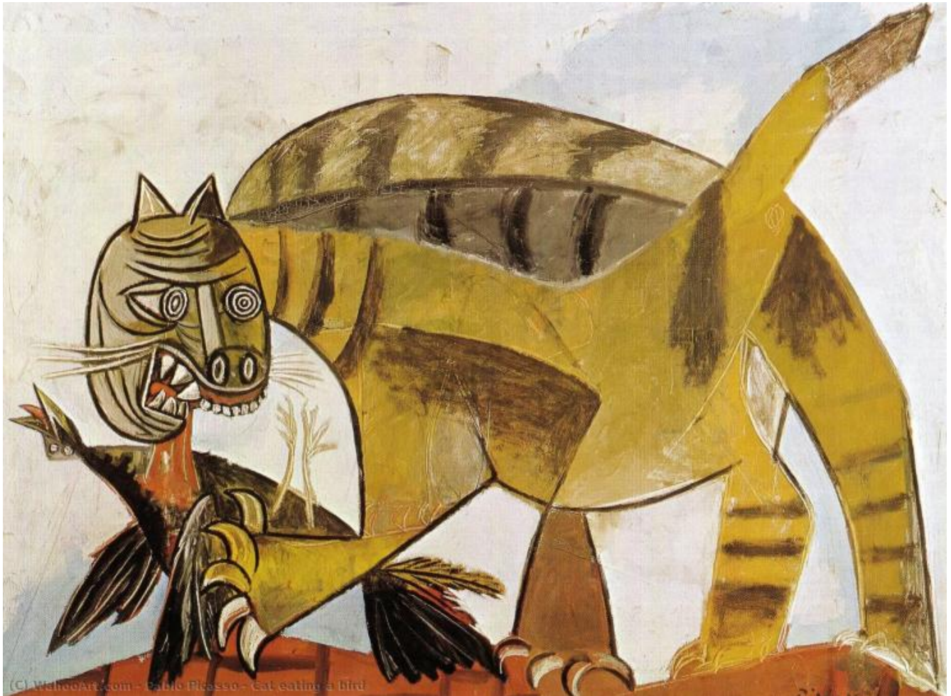
Opera di Pablo Picasso.

peli che si impastano persino ai colori; Andy Warhol e i suoi venticinque gatti chiamati "Sam" nella sua casa dell'Upper East Side ritratti in un libriccino a tema felino tenuto rigorosamente privato e regalato solo agli amici; Utagawa Kuniyoshi, con le sue stampe giocose e sorprendenti e il registro dei felini defunti con tanto di altare buddhista).