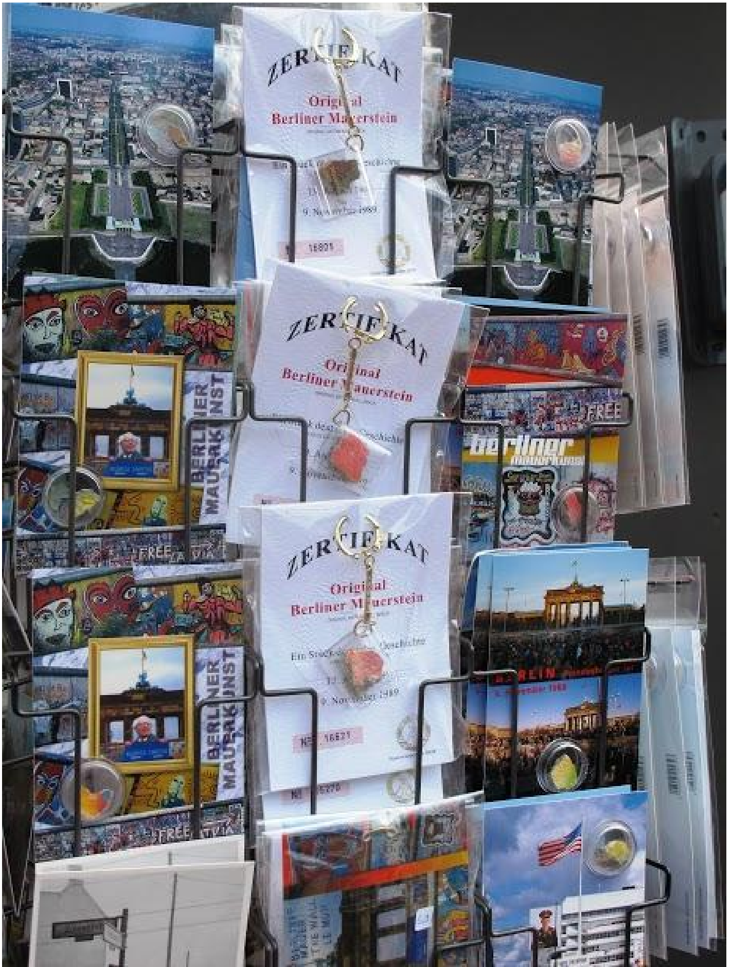
Souvenir al Check Point Charlie.