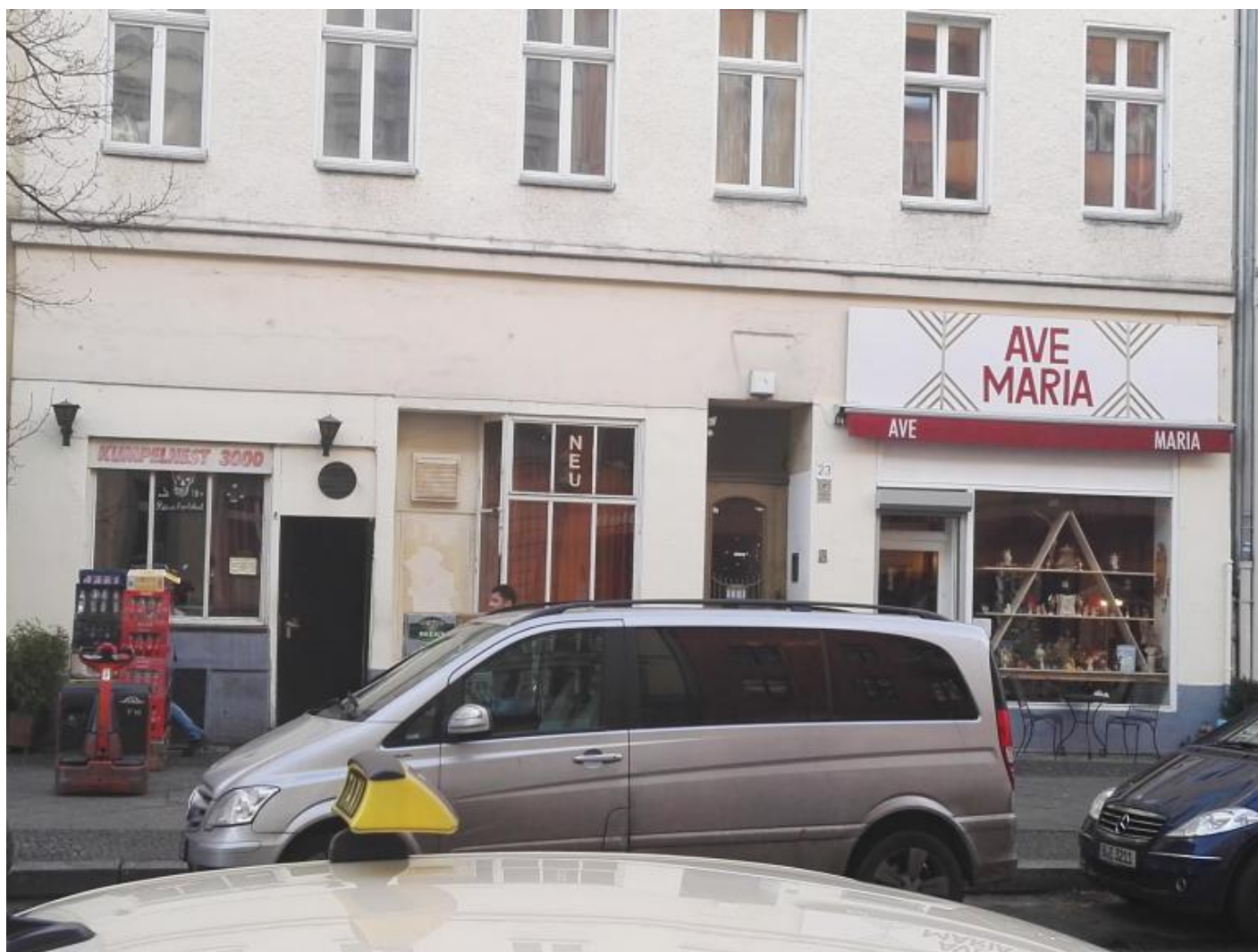
I due locali fianco a fianco.