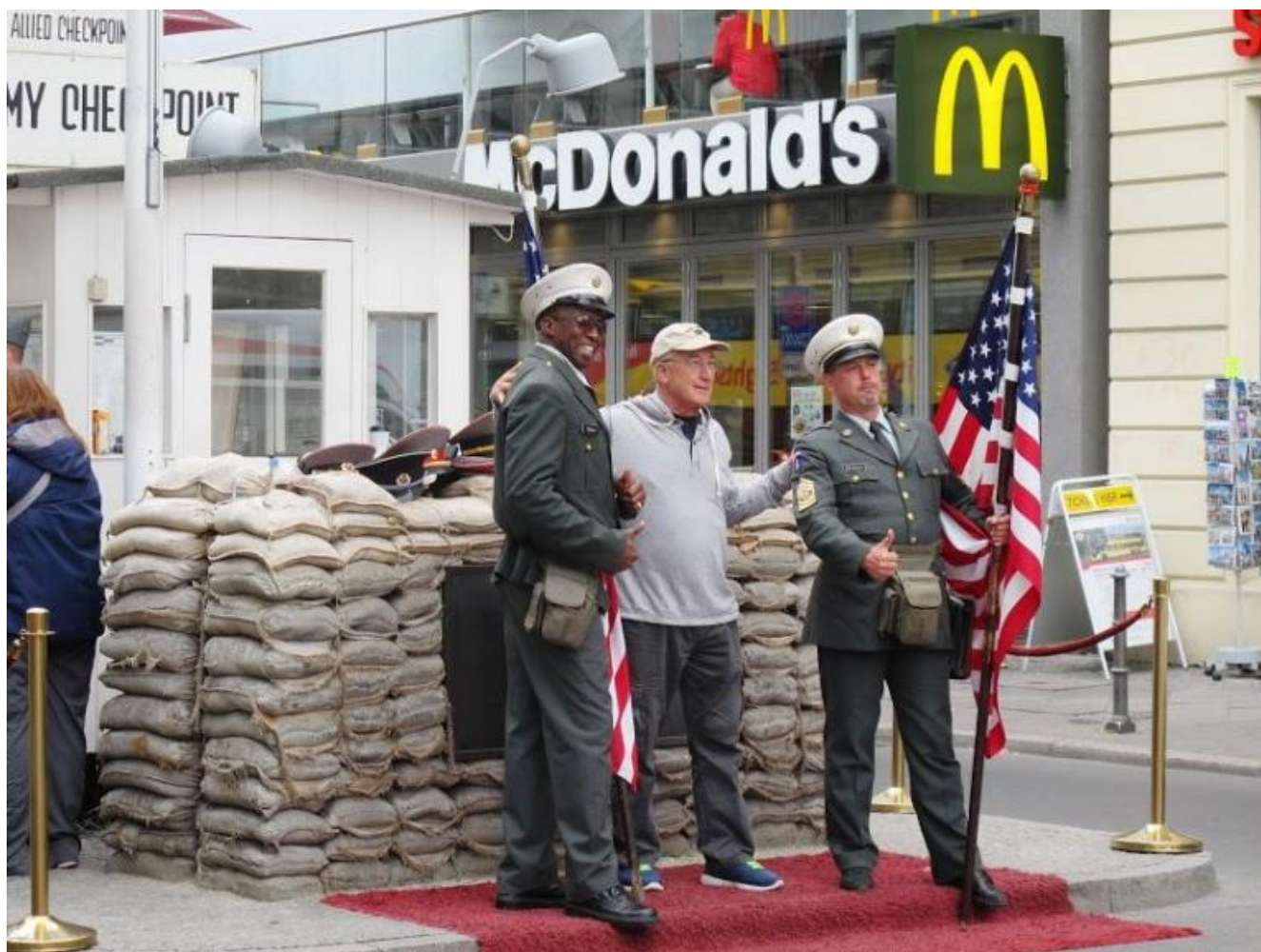
In posa al finto Check Point Charlie.

Finti timbri con altrettanto finti visti di transito vengono apposti su finti passaporti per pochi euro. Eccola "l'emozione estetica interpretata non come atto critico, ma come dimensione meramente relegata ai sensi" (Mecacci). L'originale Haus am Checkpoint Charlie , esposizione inaugurata nel 1963 come museo che documentasse la storia del luogo e le sue violenze contro i diritti umani, è stata ampliata, trasformata in museo-spettacolo e accoglie a sua volta visitatori a frotte. Un'installazione di Frank Thiel del 1998, cassone luminoso come molti altri pensati in città per i messaggi pubblicitari, espone i ritratti di un giovane soldato americano e di un suo coetaneo russo (già non più sovietico, visto che le fotografie furono scattate nel 1994) che guardano l'uno verso il settore dell'altro. L'opera rimanda al famoso fronteggiarsi dei carri armati delle due potenze, breve ma minaccioso, oggi ignorato dai più, durante la cosiddetta crisi di Berlino del 1961. Tutto il resto, come anche gran parte di quanto già considerato, è paccottiglia, mercificazione del ricordo, souvenirizzazione della storia, "fruizione aberrante": negozi di gadget, cartoline, libretti di bassa divulgazione, riproduzioni,