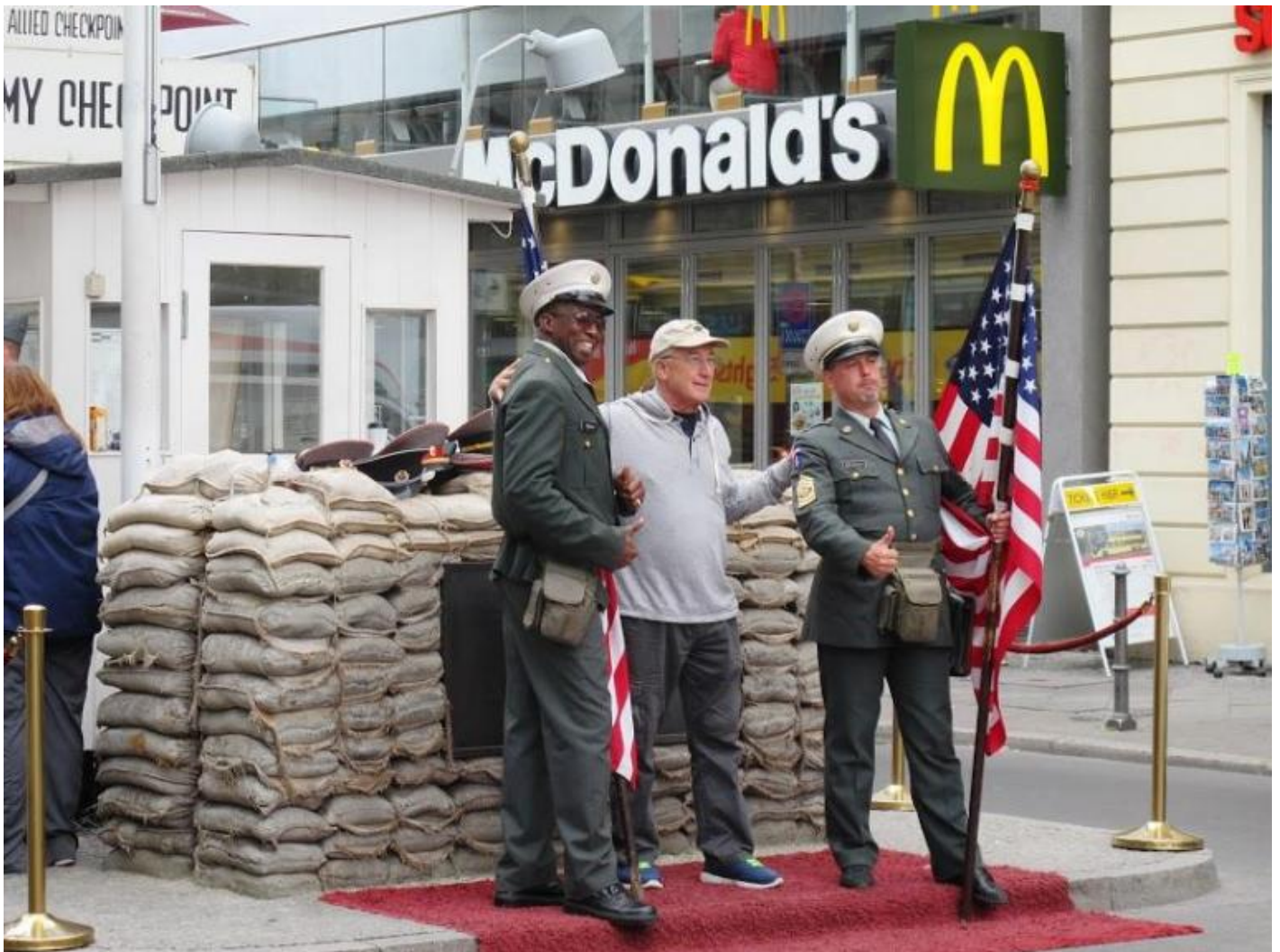
In posa al finto Check Point Charlie.

allo spettacolare. Mi riferisco al Check Point Charlie, l'isolato che ai tempi della città divisa ospitava il famigerato punto di transito tra il settore americano (quartiere di Kreuzberg) e quello sovietico sedicente "democratico" (quartiere di Mitte), riservato a militari delle forze alleate, diplomatici e cittadini stranieri, prevedeva per chi volesse attraversarlo una vera e propria gimcana tra sbarramenti di vario tipo atti a evitare azioni di sfondamento. La baracca, inizialmente di legno poi di metallo, eretta dalle forze alleate come base di controllo fu volutamente mantenuta in condizioni di provvisorietà per sottolineare, in pieno spirito da guerra fredda, il non riconoscimento di quel varco come legittimo confine internazionale. Oggi quella autentica è stata musealizzata e al suo posto ne sorge una copia ispirata al modello primigenio del 1961. Finti soldati in finta divisa, accanto a una catasta di sacchetti di sabbia, la presidiano pronti a mettersi in posa per le torme di turisti che affollano la strada. E, beffardamente, l'insegna di McDonald's resta l'unico tratto autentico dell'immagine.