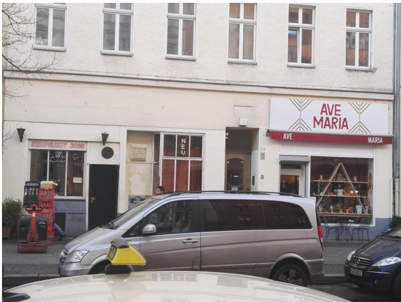
I due locali fianco a fianco.