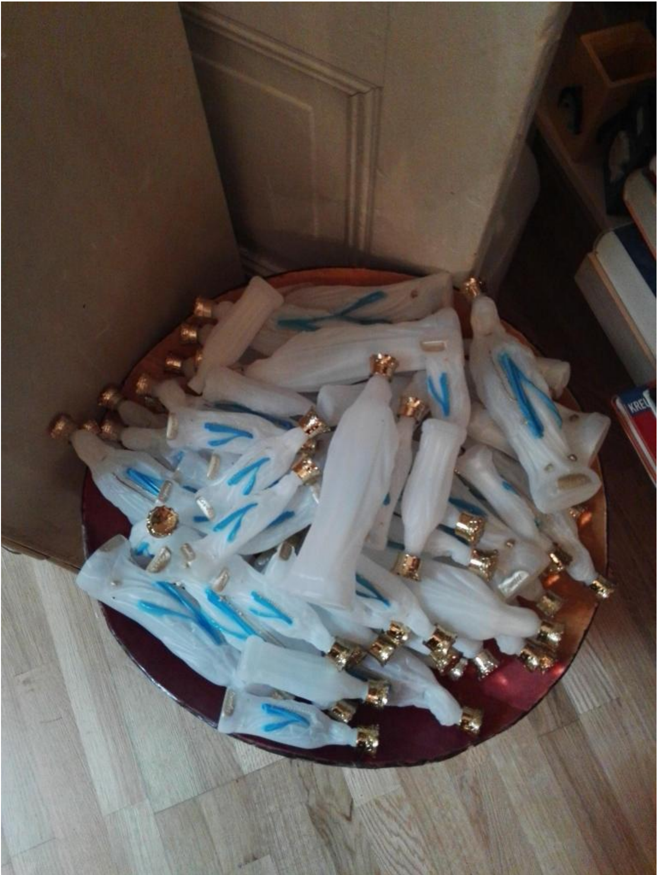
Riproducibilità tecnica delle Madonne contenenti acqua benedetta.