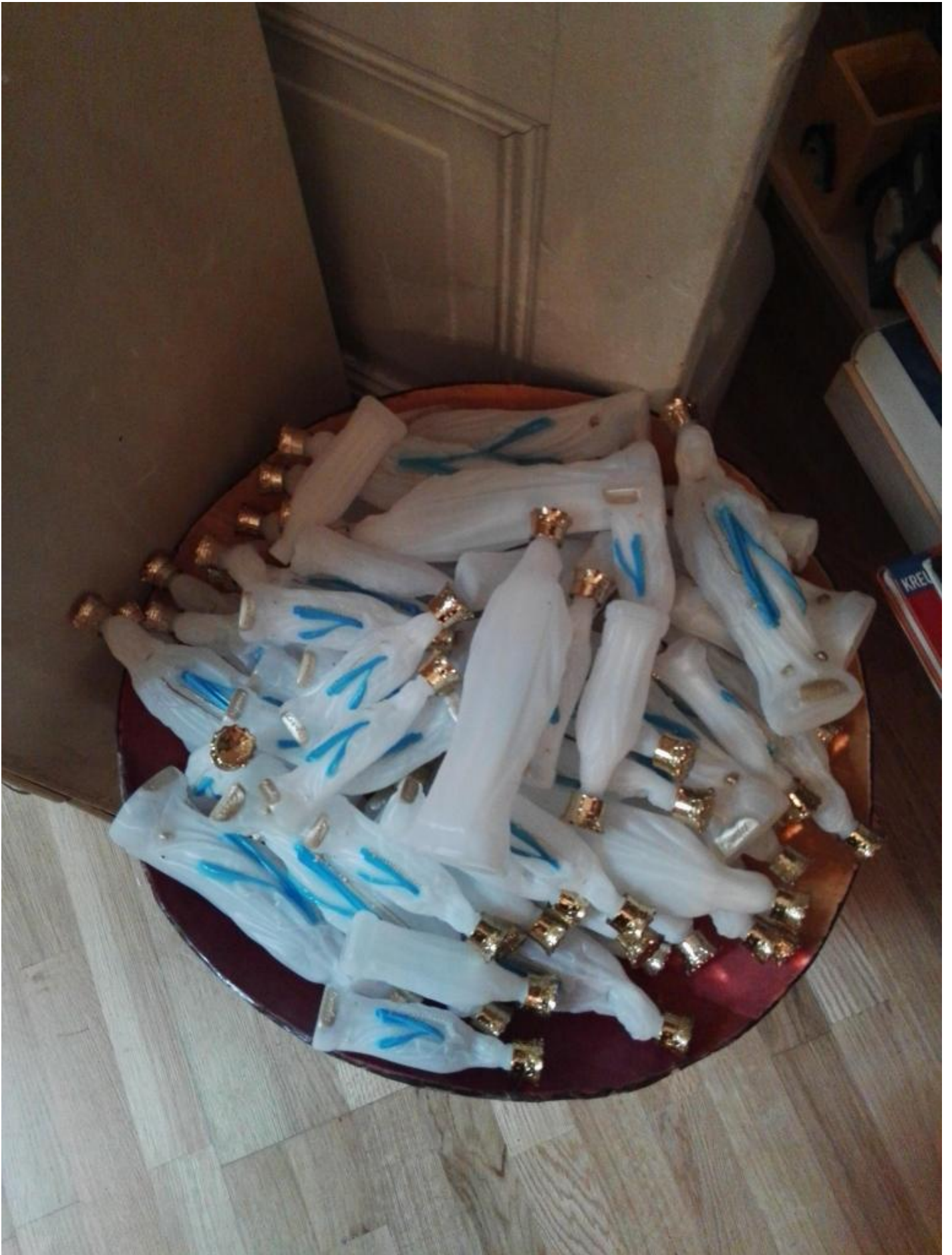
Riproducibilità tecnica delle Madonne contenenti acqua benedetta.