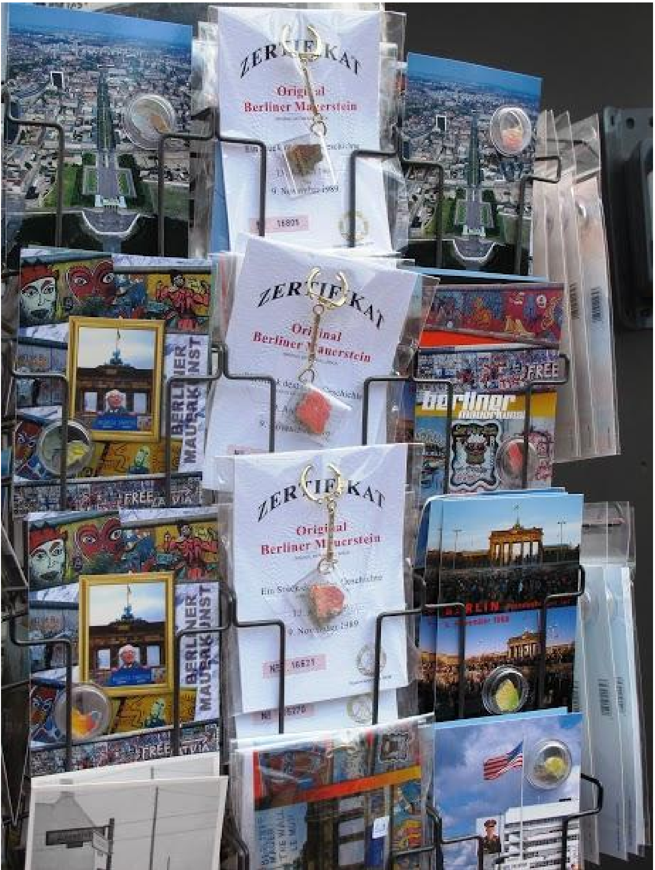
Souvenir al Check Point Charlie.