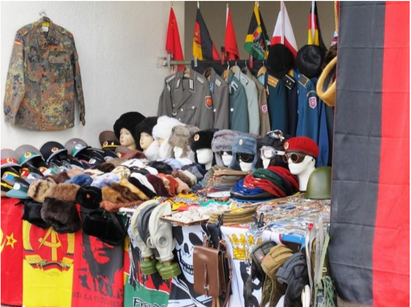
Bancarelle di souvenir "politici".