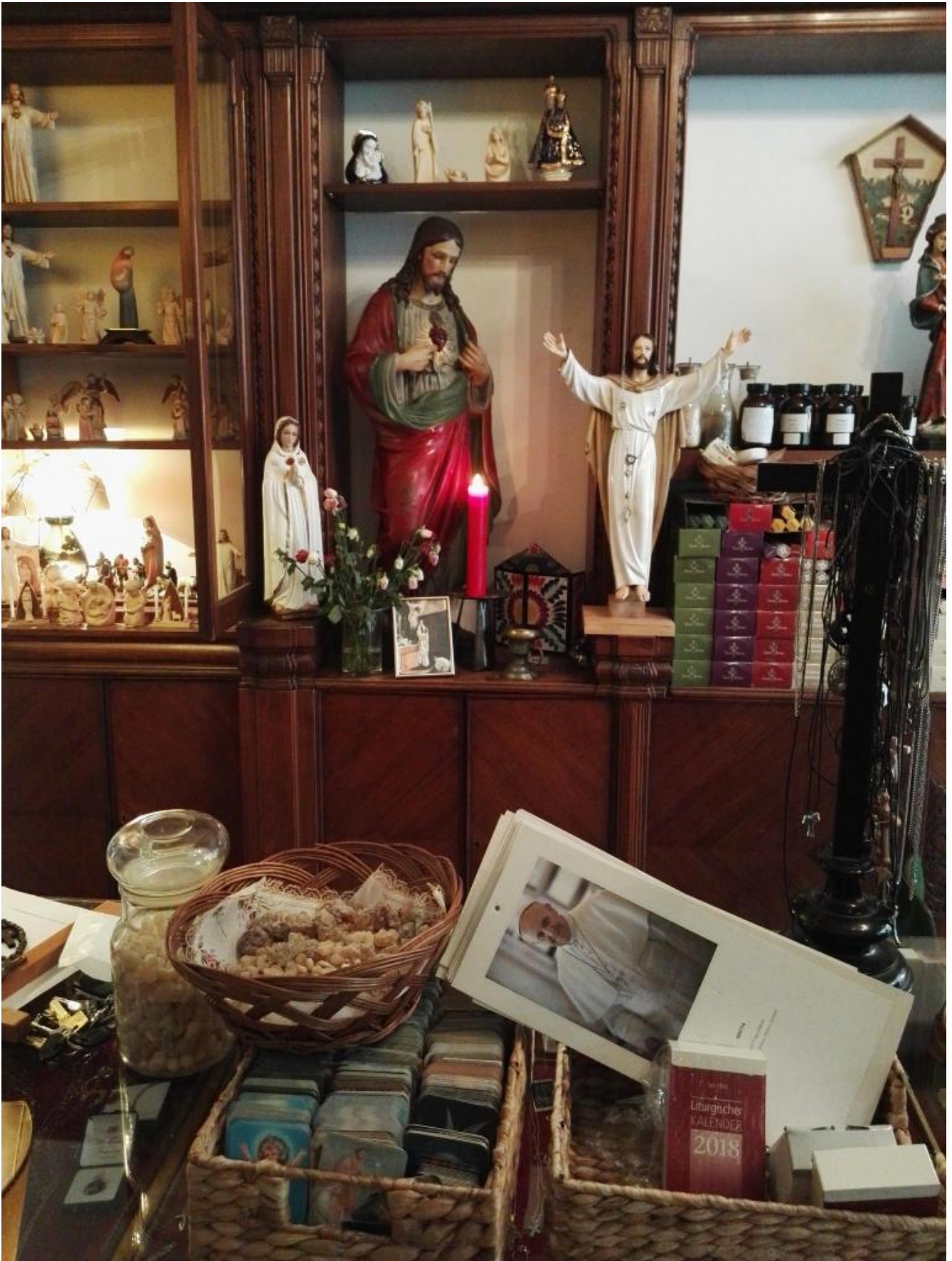
Il negozio Ave Maria di Berlino.