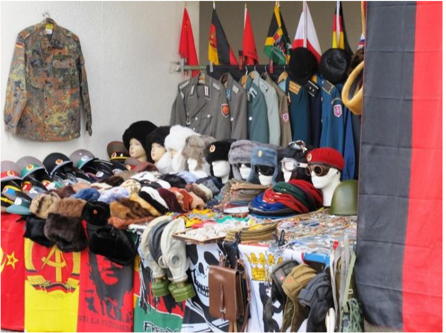
Bancarelle di souvenir “politici”.