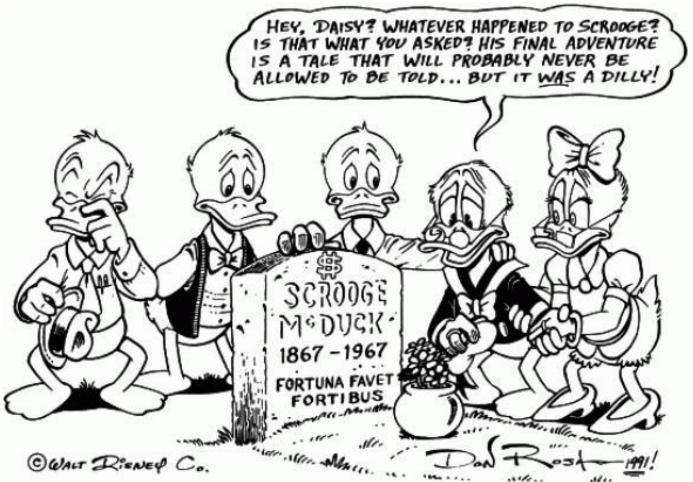
Don Rosa, "Hey, Daisy, Whatever Happened to Scrooge?" (1991).

Avengers: Endgame mette in scena il passaggio dall'aggressività gratuita, ma vitale dell'adolescenza alla consapevolezza responsabile, ma in discesa della maturità. Nell'intreccio tra schermo e realtà, lo spettatore adolescente che nel 2008 si era riconosciuto nel playboy di Ironman e nel mantra "Hulk Spacca!" deve oggi fare i conti con la vita. E sono conti salati. I sentimenti si traducono in responsabilità. Oltre al funerale di Tony Stark che si immola per la sua famiglia, vi è la morte del grande Achille della tradizione della Marvel: Capitan America. E muore, non perché il suo personaggio sia ucciso, ma perché si sottrae al suo destino, che è appunto, quello di non mollare mai.