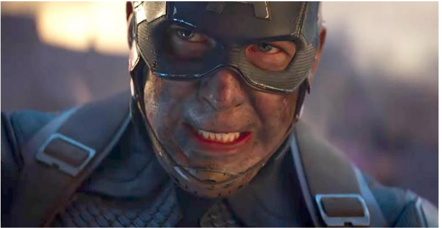
Capitan America/Steve Rogers (Chris Evans).

La cosa interessante è che in questo crepuscolo degli dei dell'adolescenza, le donne sembrano uscirne immuni (a parte Black Widow, che essendo l'eroina femminile più datata viene prontamente sacrificata). A differenza dei maschi, le nuove eroine sembrano in grado di coniugare forza e responsabilità, maturità e vitalità, equilibrio e determinazione (da Carol Danvers alias Captain Marvel a Frigga, da Valkyrie alle Dora Milaje di Wakanda). Pepper Potts (Gwyneth Paltrow) completa la sua parabola da segretaria a CEO delle Stark Industries. Il mondo femminile è il vero vincitore della battaglia finale dal quale gli uomini escono, quando non ammaccati fisicamente, malconci emotivamente. I maschi non crescono, al massimo invecchiano, ingrassano, e muoiono; al contrario le donne fioriscono, maturano e realizzano se stesse.