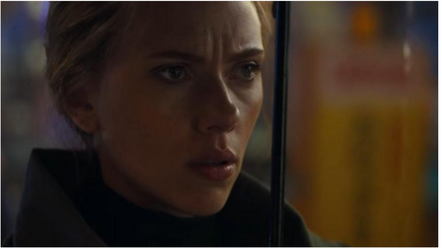
Black Widow/Natasha Romanoff (Scarlett Johansson).

La fine simbolicamente più significativa di tutte però è quella di Capitan America (Chris Evans) che rinuncia al suo ruolo di combattente. Un supereroe muore non solo quando il suo alter-ego, in questo caso Steve Rogers, viene meno, ma soprattutto quando la sua immagine ideale viene tradita. Anche le maschere hanno un'anima, spesso più viva della persona che li incarna momentaneamente.