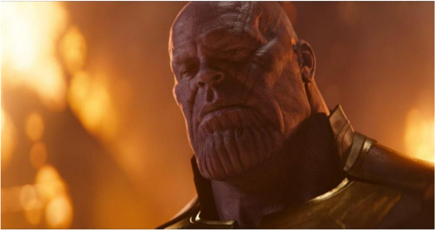
Thanos (Josh Brolin).

Il tema del film è il cambiamento che, inevitabilmente, porta alla morte. Non a caso l'arcinemico è Thanos, il cui nome deriva da Thánatos , la personificazione della Morte nella mitologia greca, un personaggio inventato dal fumettista americano Jim Starlin durante una lezione di psicologia nel '72. Thanos uccide i personaggi in due modi: o affrontandoli in campo aperto o, in modo più sottile, costringendoli a farsi carico delle loro responsabilità. Non è mosso da obiettivi personali, ma è la personificazione della sordità del mondo ai nostri desideri giovanili. Come ha detto Neil deGrasse Tyson «L'universo non ha alcun obbligo di avere un senso per noi».