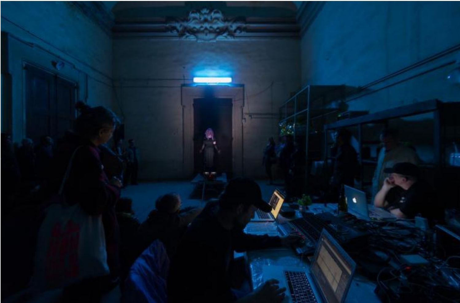
Simon Vincenzi. From the Dead Air Orgy, The song of Silenus