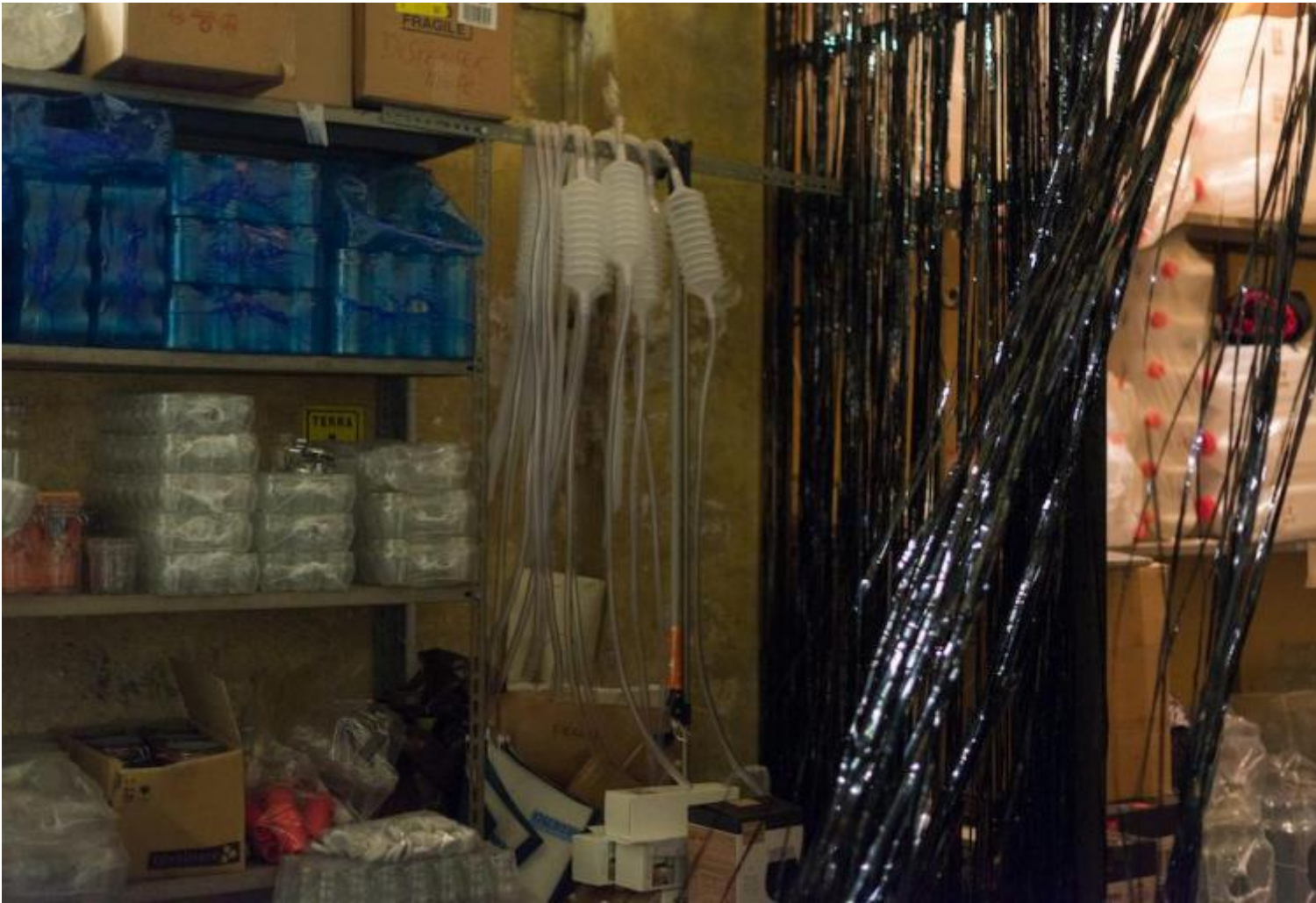
Simon Vincenzi. From the Dead Air Orgy, The song of Silenus © Luca Ghedini