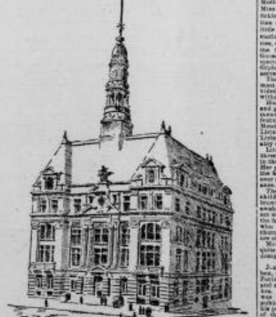
Architectural drawing of a building, likely the new Municipal Building.

The Mother Goose is a well-known character.