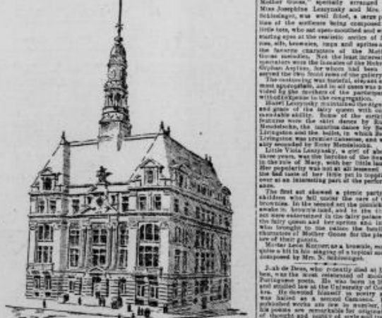
Architectural drawing of a building facade, likely the new Municipal Building.

Dr. Warburg is the author of several books on the art of the Indians.