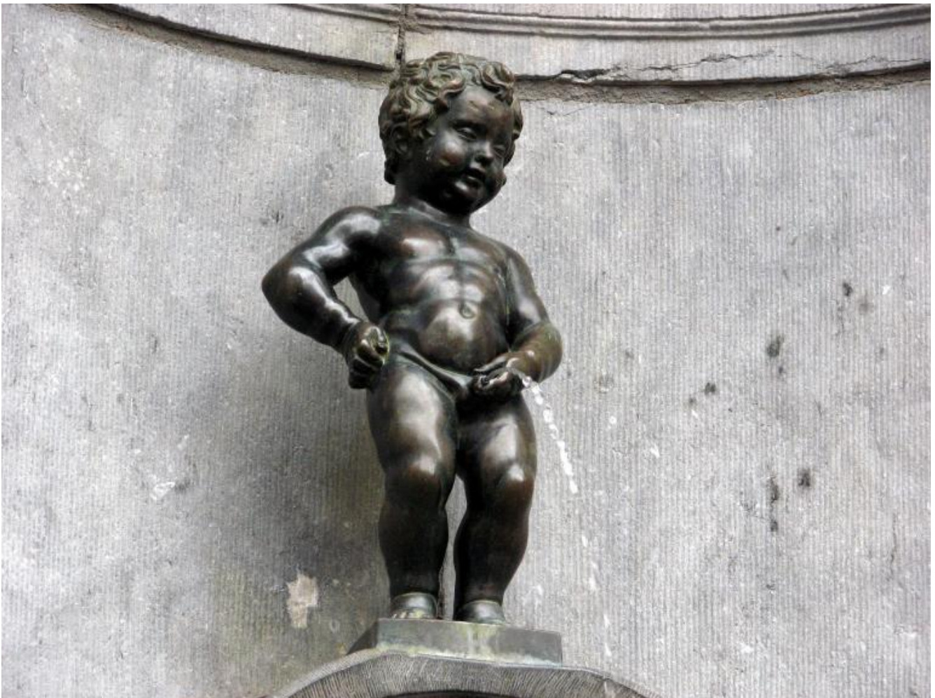
Jérôme Duquesnoy il Vecchio, "Manneken-Pis" (1619), Bruxelles.

L'operazione compiuta con questo nuovo saggio, Figure piscianti , si palesa proprio a partire da un celebre spostamento. Citando la pagina del New York Herald (14 aprile 1917) su Fountain di Marcel Duchamp, Lebensztejn ritrova la questione centrale del decorum evocata più sopra. Fountain , l'orinatoio rovesciato, dovrebbe stare altrove, forse in un gabinetto, ma certo «il suo posto non è in una mostra d'arte». L'indecoroso Duchamp addita così nel ventesimo secolo qualcosa che in realtà non ha sempre assunto i tratti dello scandalo né tantomeno della perversione. La storia dell'arte è popolata di figure che pisciano – questo libro ne osserva le molteplici apparizioni e gli altrettanto significativi occultamenti a partire dal 1280 fino ad oggi.