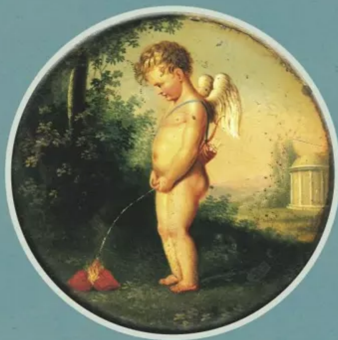
Figure piscianti 1280-2014