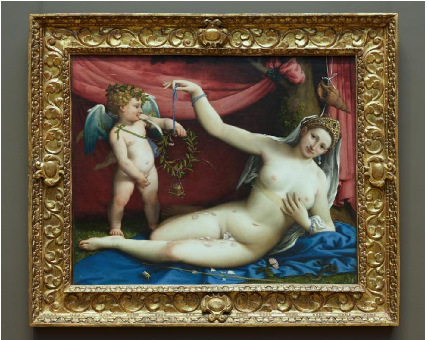
Lorenzo Lotto, "Venere e Cupido" (1525-30), New York, Metropolitan Museum.

Trescore un putto visto dal basso per fargli prendere di mira, col suo getto, l'acquasantiera. Tuttavia, nota Lebensztejn, il liquido non è dorato, bensì verde come il motivo vegetale che lo circonda – verde, soprattutto, «per analogia con il leone verde, la rugiada degli alchimisti» (p. 35). Gesto inappropriato? Forse, ma l'umorismo, il divertimento basso, non annulla il sotto testo alchemico: semplicemente, i due aspetti si mescolano assieme.