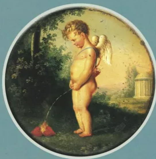
Figure piscianti 1280-2014