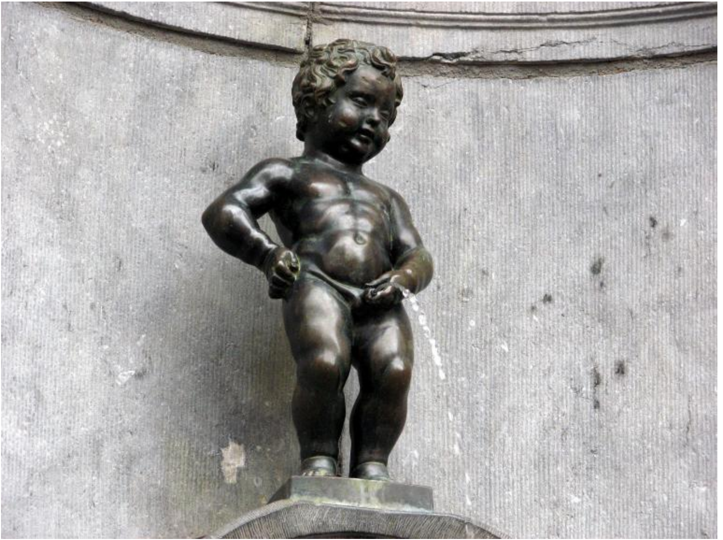
Jérôme Duquesnoy il Vecchio, “Manneken-Pis” (1619), Bruxelles.

Figure piscianti ha già ottenuto un certo successo in Francia (dove è pubblicato da Macula) e anche grazie alla traduzione americana per i tipi di David Zwirner. Scrivenerne ora, al momento della sua pubblicazione in italiano (UTET, 2019; traduzione di Rinaldo Censi), permette di notare come una buona parte dell’attenzione venga dal suo soggetto, considerato tabù per un saggio di storia dell’arte. In realtà Figure Piscianti dimostra paradossalmente il contrario, specialmente nei primi capitoli. Prendendo come punto di partenza la fontana del Manneken-Pis a Bruxelles (commissione del 1619 a Jérôme Duquesnoy il Vecchio), Lebensztein imbastisce un’indagine minuziosa sulla circolazione e la trasmissione della figura del puer mingens . In questa prima fase, la ricognizione sul motivo e sulla sua manifestazione fisica (spesso come statua di una fontana) tende a rivelare e a commentare, confrontandole, le fonti letterarie. Nel dettaglio, particolare importanza è attribuita alla simbologia contenuta nell’ Hypnerotomachia Poliphili di Francesco Colonna (1499), e il sogno esoterico di Polifilo, del resto, così fitto di emblemi da decifrare, non può non essere il punto di partenza ideale per questa programmatica investigazione iconologica.