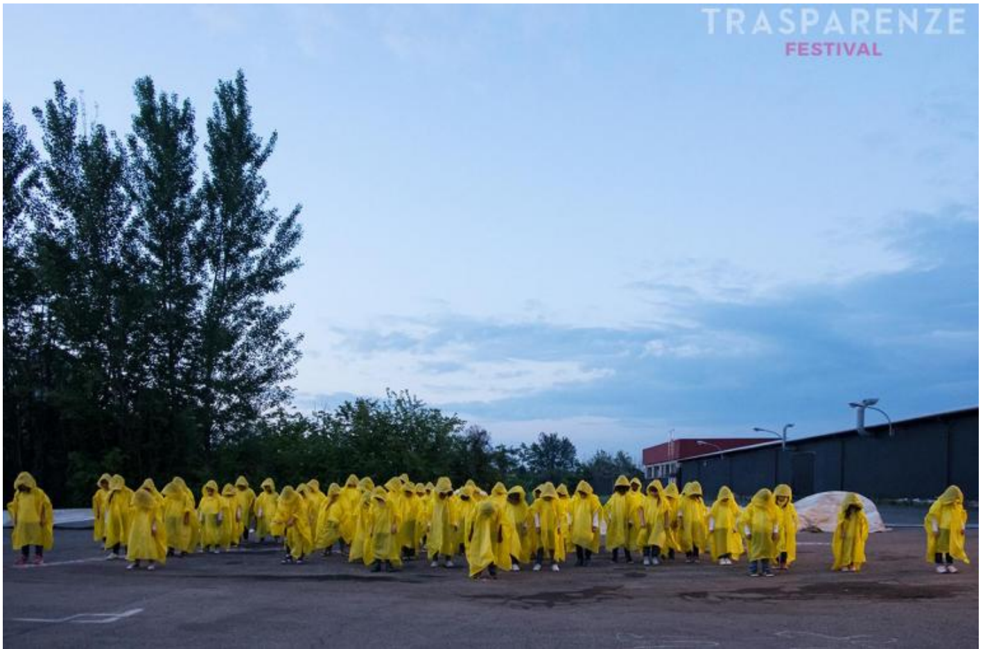
I bambini di "Moby Dick", Teatro dei Venti, ph. Chiara Ferrin.

In effetti, questo titolo Crepa continua sotterraneamente a ispirare molti dei lavori che questa edizione di Trasparenze ha selezionato. Sono molti gli spettacoli che hanno un qualche legame, discreto o diretto, con la morte o la finitezza e la necessità di affrontarla. Si possono menzionare, al riguardo, almeno quattro dei lavori ospitati dal festival. Si può cominciare da Pragma di Teatro Akropolis, che evoca con una pantomima senza parole lo sprofondamento nell'Ade di Persefone, l'incontro di questa con la madre Demetra e la nascita di Dioniso, divinità in cui gli opposti della cura e della distruzione coincidono. Si può poi passare a Divine di Danio Manfredini, riscrittura del romanzo Nostra signora dei fiori di Genet, popolato da travestiti e prostitute che muoiono o si consumano per amore, e allo stesso Moby Dick di Teatro dei Venti, dove la caccia alla fantastica balena bianca si conclude con un naufragio della nave Pequod e una discesa nell'abisso. Infine, si può ricordare Un.Habitants di Caterina Moroni: una performance ambientata in un cimitero, in cui 20 spettatori alla volta sono messi in contatto con i morti che sono lì sepolti, o che forse dormono per risorgere in futuro, attraverso delle cuffie che trasmettono delle istruzioni e delle riflessioni che i defunti vogliono lasciare ai vivi.