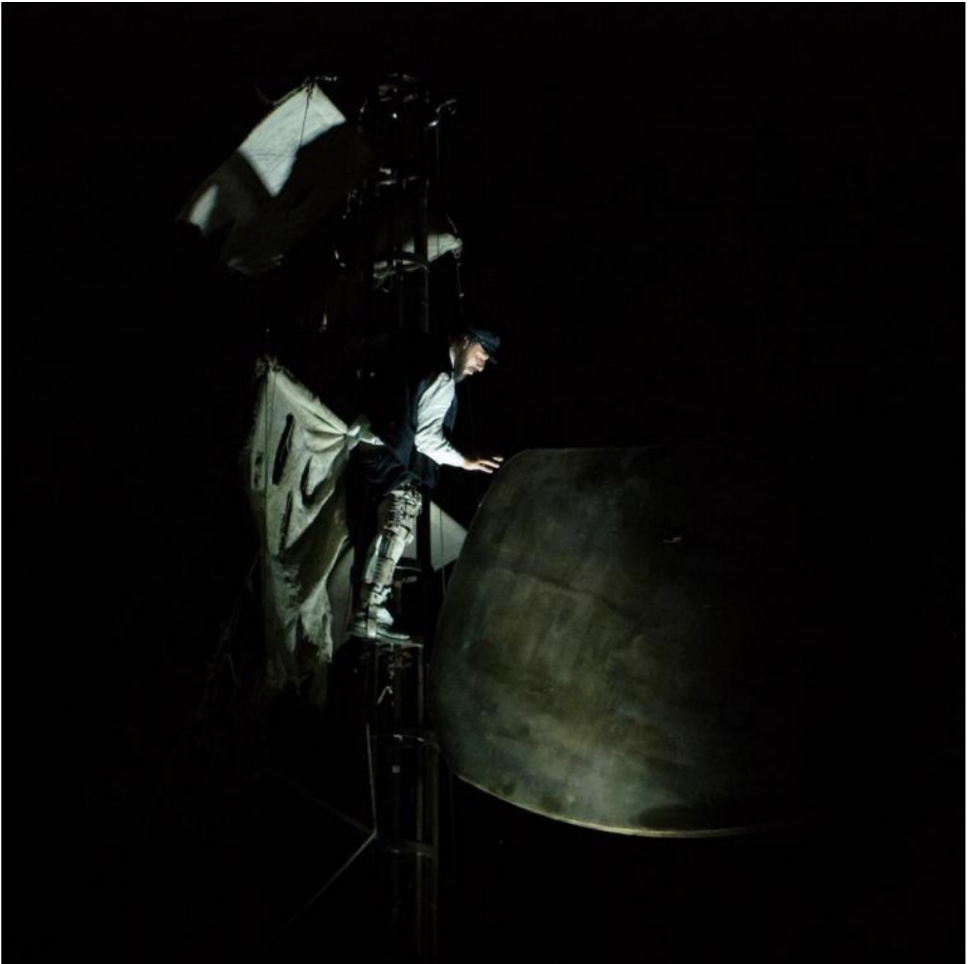
“Moby Dick”, Teatro dei Venti.

Questa importanza della delicatezza a teatro permette di evitare un possibile equivoco su quanto si diceva all’inizio. Quando si supponeva che la bellezza non si lascia toccare dai deboli di spirito, non si intendeva dire che allora il bello lo esperisce chi esercita la forza e la violenza. Ci vuole dopo tutto più coraggio, studio e creatività per dare o ricevere una carezza che per commettere atrocità su scala planetaria. Anche i dementi e gli imbecilli sono capaci di strangolare, accoltellare, bombardare, squartare, torturare, calciare, violentare, dissanguare, sterminare, segregare, e via dicendo con altri verbi attinenti al lessico dell’orrore. Gli atti delicati di cui è capace il teatro sono resi possibili, invece, solo tramite un lavoro continuo, congiunto, a volte disperato e sempre pieno di difficoltà degli artisti col loro pubblico, che spesso rasenta la frustrazione e il fallimento. Ma se non è del tutto assurdo pensare che questo sforzo comune conduca a una sorta di eternità, il rischio risulta essere bello e il tormento o l’amarezza che esso porta con sé sembra apparire più dolce di ogni delizia terrena.