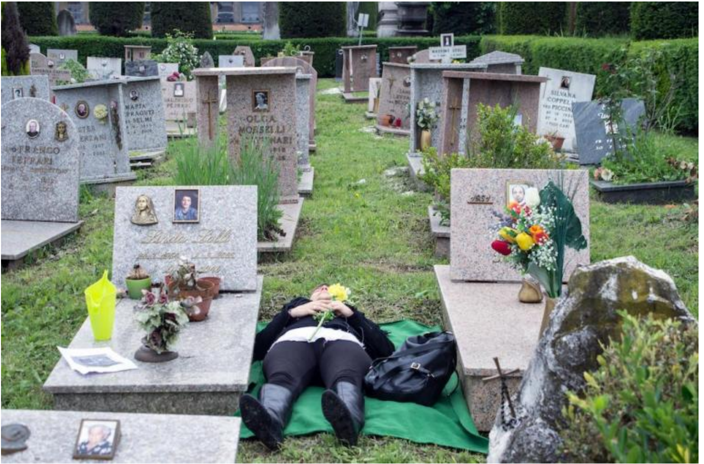
“Un.Habitants” di Caterina Moroni, ph. Chiara Ferrin.

Non sarebbe allora peregrino supporre, entro questa prospettiva, che questa edizione di Trasparenze suggerisca che il teatro possa essere definito come una “arte del crepare”, nel doppio senso di arte che spezza il comodo guscio di noce delle nostre sicurezze e che fa da tramite per raggiungere una buona morte. Come infatti ci sono molti modi e stili di vita, così ci sono altrettanti modi e stili del morire. Se immaginiamo di volare sulla schiena di un grande uccello e di planare sopra tutta la terra abitata, osserveremmo una umanità variegata e mai uniforme. Alcuni esseri umani muoiono così come sono vissuti: in modo piatto e senza intensità, centellinando i loro affetti e i loro pensieri con un cucchiaino da caffè. Altri sono più generosi ma disperdono le loro energie, lasciando così dietro di sé solo un ricordo di un’esistenza disordinata e confusa. Altri ancora nuocciono e fanno del male, o vivono per distruggere. La casistica potrebbe continuare potenzialmente all’infinito, tanto che il nostro ipotetico uccello non ce la farebbe a un certo punto più a proseguire nel suo volo di ricognizione e stramazzerrebbe stanco in basso, sulla terra ruvida o dentro un segmento dell’oceano.