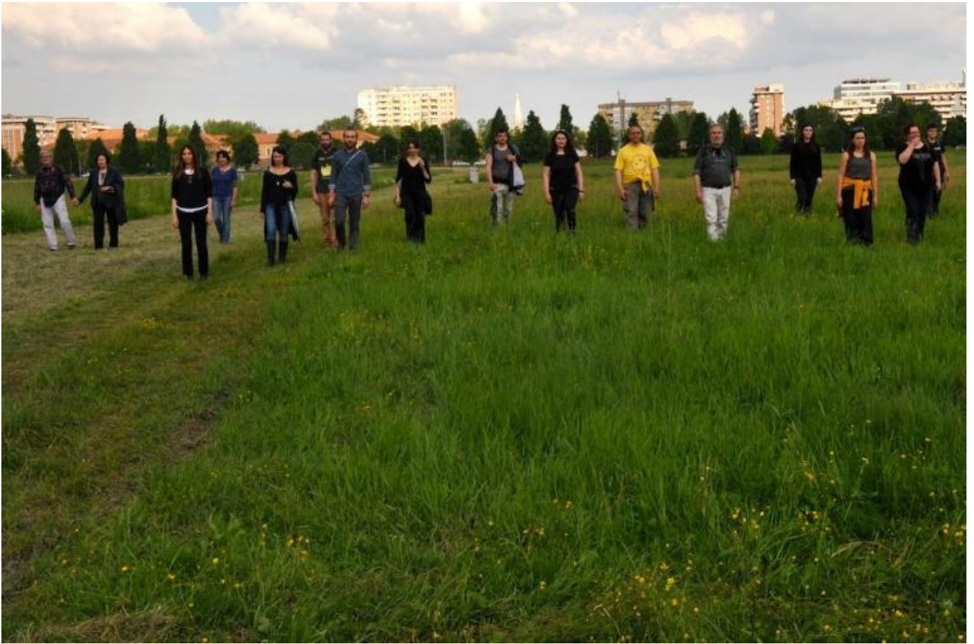
“Camminare”, DOM-, ph. Carlo Rotondo.