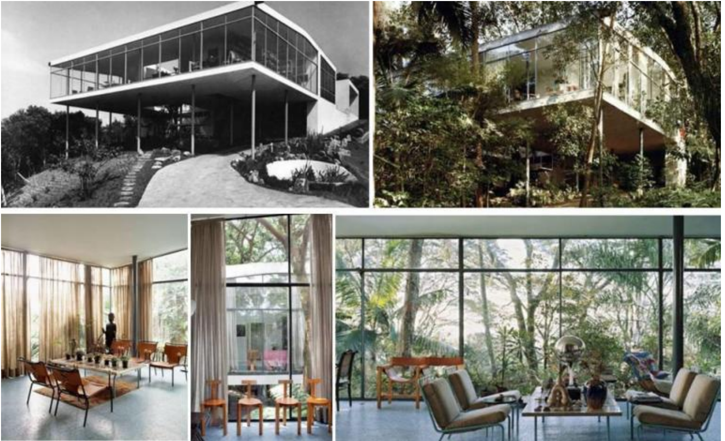
Lina Bo Bardi, Casa de Vidro, 1951, San Paolo, arredata con i mobili da lei progettati.

Oggi, la Casa de Vidro è la sede dell'Istituto Lina Bo e P. M. Bardi.