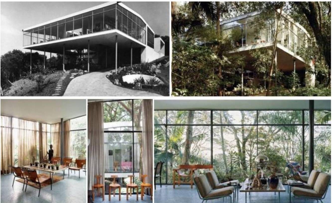
Lina Bo Bardi, Casa de Vidro, 1951, San Paolo, arredata con i mobili da lei progettati.

Oggi, la Casa de Vidro è la sede dell'Istituto Lina Bo e P. M. Bardi.