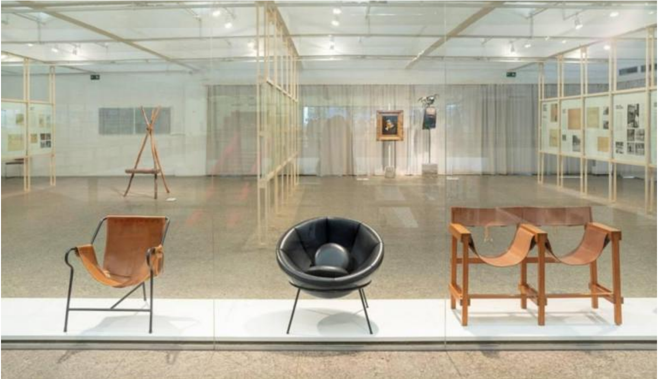
Uno scorcio della mostra Lina Bo Bardi: Habitat, in corso al Museu de Arte de São Paulo (MASP).

della sperimentazione di forme inconsuete e di tipologie innovative, né quello dell'impiego di nuovi materiali, senza escludere una nota ludica e allo stesso tempo lirica, così come proprio dei suoi interventi architettonici è il loro colloquio con la natura.