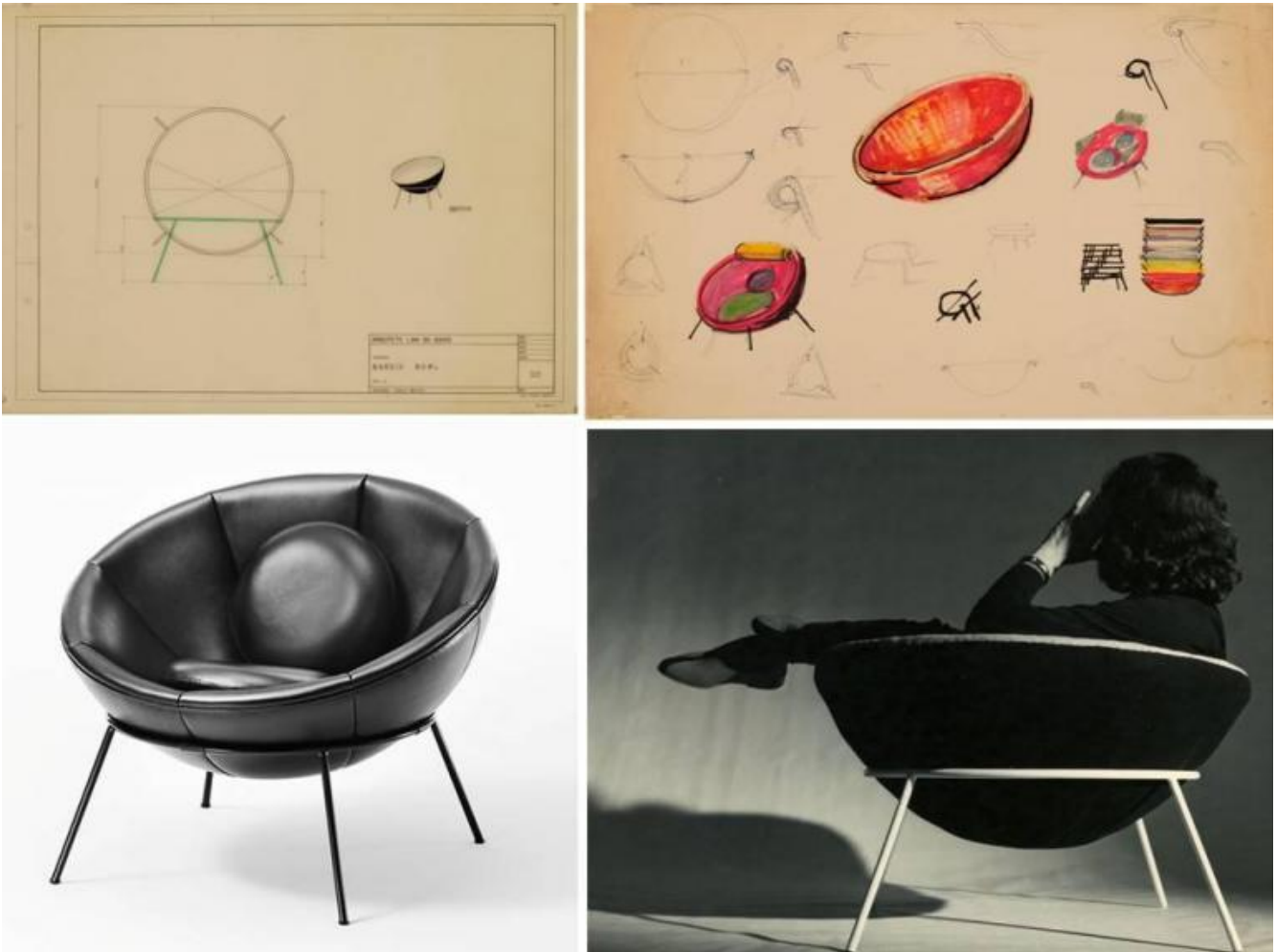
Lina Bo Bardi, Bowl chair, 1951. Sopra: disegni di progetto. Sotto: veduta della poltroncina BC in pelle nera (courtesy of Arper) e Lina stessa seduta su uno dei due esemplari realizzati per la sua casa di San Paolo, in una foto di Francisco Albuquerque.

Intanto, nel 1950 aveva fondato con il marito la rivista quadrimestrale Habitat , diretta da entrambi, incentrata sul tema delle arti e della cultura del Brasile e anche sulle sue riflessioni intorno al Modernismo.