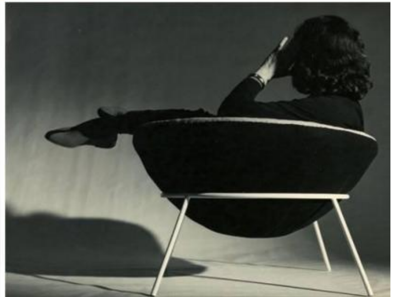
Lina Bo Bardi, Bowl chair, 1951. Sopra: disegni di progetto. Sotto: veduta della poltroncina BC in pelle nera e Lina stessa seduta su uno dei due esemplari realizzati per la sua casa di San Paolo.

Intanto, nel 1950 aveva fondato con il marito la rivista quadrimestrale Habitat , diretta da entrambi, incentrata sul tema delle arti e della cultura del Brasile e anche sulle sue riflessioni intorno al Modernismo.