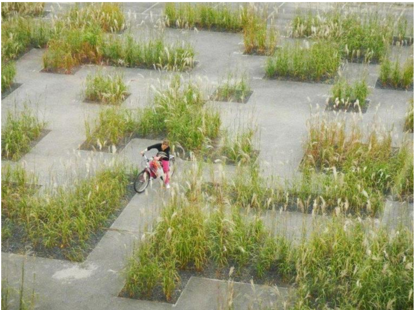
Wagon Landscaping. Flashcode garden, Kortrijk, Belgio.

Il testo di Georgieff è il risultato di decenni di lavoro sul campo, è un testo operativo, a volte formato da trascrizioni d'interventi che l'autore ha fatto durante workshop, altre da descrizioni di lavori in tutta Europa. Mi è capitato di presentare il suo libro e avere l'occasione di incontrarlo e ho iniziato chiedendogli di spiegarmi una delle frasi che s'incontra durante la lettura: La libertà è di natura muscolare. Dall'idea di libertà, che come ogni muscolo si atrofizza se non viene utilizzata, è partita la conversazione, Pablo ci ha parlato di sprogettazione , di come ogni progetto venga affrontato in gruppo dove ognuno ha un suo apporto personale senza ci sia necessariamente un leader, di come questo modo di procedere sia a volte, parole sue, un vero casino , ma che dà sempre risultati più che validi. L'Atelier Coloco è riuscito, per esempio a coinvolgere gli abitanti dello Zen di Palermo, storicamente portato a esempio del disastro delle periferie, attraverso quello che chiama l'invito all'opera , in sostanza, siamo davanti a uno spazio da trasformare? bene, invece che chiuderci negli studi e cominciare a pensare, mettiamoci a lavorare con le mani, facciamo.