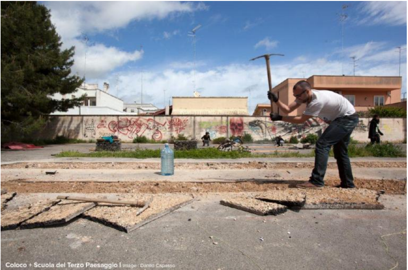
Atelier Coloco, Scuola del Terzo Paesaggio. Asfalto mon amour. Lecce, Italia, 2016.

Il termine urbanistica entra nel vocabolario italiano di diritto solo nel 1929, quando viene fondato l'Istituto Italiano di Urbanistica. La terminologia deriva dalle esigenze conoscitive e operative della nuova città industriale e non solo non tiene conto del senso della città fin dalla sua nascita, ma impone una visione della città totalmente sradicata dal territorio che la contiene. Il senso precedente era di un rapporto di interdipendenza città/campagna, quello moderno è totalmente urbanocentrico e la dicotomia è irreversibile. Nel mondo latino urbs/urbis definisce la città in contrapposizione ad arx/arcis , cittadella e a rus/ruris , campagna. Urbs , come l'inglese town , contiene il significato di recinto, mura. L'abitare indigeno e quello tradizionale sono studiati con invidia, ci si affanna a costruire newtowns e cités nouvelles col solo risultato di verificare che standard e servizi sociali non sono sufficienti per far nascere una vera città. L' effetto città , rigorosamente cercato e progettato, non si realizza, non nasce, solo la griglia è evidente. La gente non riesce a riconoscersi in uno spazio progettato da un tecnico, e quando dà segni di ribellione, vengono visti come risultati dell'ignoranza e dell'ingratitudine.