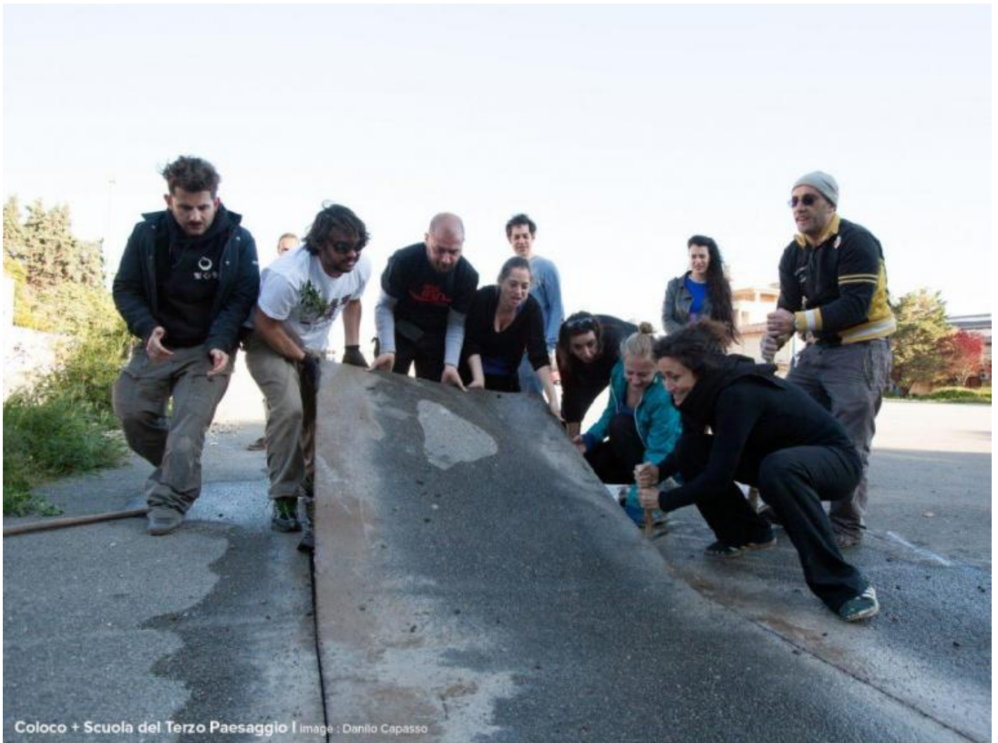
Atelier Coloco, Scuola del Terzo Paesaggio. Asfalto mon amour. Lecce, Italia, 2016.

L'idea di città moderna nasce quindi in tutta Europa per risolvere i problemi generati dal sistema industriale e si mette al suo servizio. Il problema principe sono le smisurate masse di aspiranti operai che lì si riversano dalle campagne. Che fare? diceva uno che di operai se ne intendeva, gli urbanisti moderni la risposta ce l'hanno pronta: una bella colata di cemento e asfalto, e costruiamo a più non posso. Che ci fosse bisogno di respirare, all'inizio del Novecento non era ancora visto come un problema, dopo qualche decennio qualcuno se ne accorge e quando il secolo finisce la situazione è diventata talmente imbarazzante che non si può più far finta di nulla. Che fare?