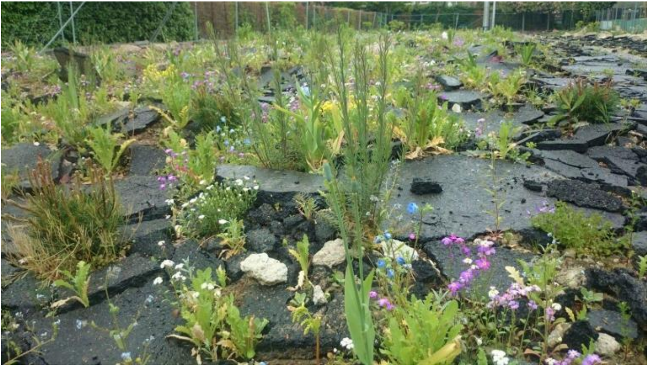
Wagon Landscaping. Jardin Joeux, Aubervilliers, Parigi, Francia.

Da qui si genera il modello della città industriale dominante fino ad oggi. La progettazione della nuova città è concepita come servizio alle esigenze dell'industria, il fine è costruire grandi espansioni urbane in poco tempo, la presenza di grandi masse fa nascere la questione dell'abitazione operaia. In Inghilterra si usano termini come town planning city, town design, urban design, civic art , mentre i francesi usano art urbain , i tedeschi städtbau , costruzione della città. Ildefonso Cerdà, urbanista e ingegnere spagnolo, usa urbanizaciòn per definire il fenomeno dell'accelerata immigrazione urbana. In Italia dal 1908 per definire il medesimo fenomeno si usa il termine urbanesimo . To urbanize inglese invece è l'atto di rendere urbano un luogo. In Francia dal 1910 si usa urbanisme .