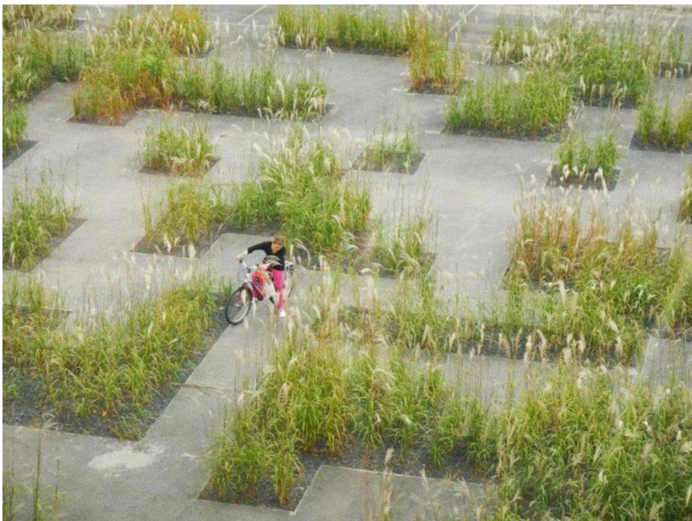
Wagon Landscaping. Flashcode garden, Kortrijk, Belgio.

Il testo di Georgieff è il risultato di decenni di lavoro sul campo, è un testo operativo, a volte formato da trascrizioni d'interventi che l'autore ha fatto durante workshop, altre da descrizioni di lavori in tutta Europa. Mi è capitato di presentare il suo libro e avere l'occasione di incontrarlo e ho iniziato chiedendogli di spiegarmi una delle frasi che s'incontra durante la lettura: La libertà è di natura muscolare. Dall'idea di libertà, che come ogni muscolo si atrofizza se non viene utilizzata, è partita la conversazione, Pablo ci ha parlato di sprogettazione , di come ogni progetto venga affrontato in gruppo dove ognuno ha un suo apporto personale senza ci sia necessariamente un leader, di come questo modo di procedere sia a volte, parole sue, un vero casino , ma che dà sempre risultati più che validi. L'Atelier Coloco è riuscito, per esempio a coinvolgere gli abitanti dello Zen di Palermo, storicamente portato a esempio del disastro delle periferie, attraverso quello che chiama l'invito all'opera , in sostanza, siamo davanti a uno spazio da trasformare? bene, invece che chiuderci negli studi e cominciare a pensare, mettiamoci a lavorare con le mani, facciamo.