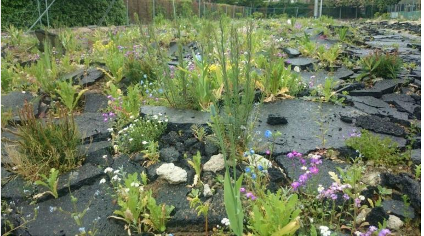
Wagon Landscaping. Jardin Joeux, Aubervilliers, Parigi, Francia.

È solo un altro dei regali di un'idea di città nata nel Novecento, dove inizia a essere concepita come il contenitore della forza lavoro delle fabbriche. La sostanziale continuità mantenuta nel tempo sia dalla casa che dalla città si è dissolta di fronte alle necessità dell'industria, è il primo vero cambiamento dalla loro comparsa. Nel Novecento le città abdicano e si trasformano nel luogo deputato alla gestione del fenomeno di geografia urbana risultato dalle forti immigrazioni per esigenze di manodopera e dal conseguente incremento accelerato della popolazione.