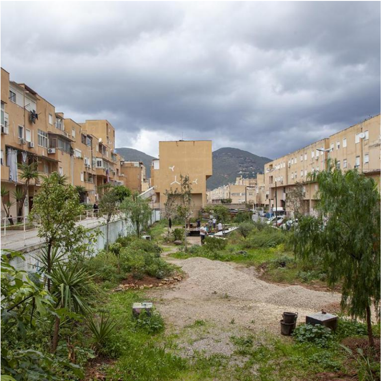
Atelier Coloco. Diventare giardino, per Manifesta 12, Quartiere Zen, Palermo, 2018.

Il testo di Georgieff è il risultato di decenni di lavoro sul campo, è un testo operativo, a volte formato da trascrizioni d'interventi che l'autore ha fatto durante workshop, altre da descrizioni di lavori in tutta Europa. Mi è capitato di presentare il suo libro e avere l'occasione di incontrarlo e ho iniziato chiedendogli di spiegarmi una delle frasi che s'incontra durante la lettura: La libertà è di natura muscolare. Dall'idea di libertà, che come ogni muscolo si atrofizza se non viene utilizzata, è partita la conversazione, Pablo ci ha parlato di sprogettazione , di