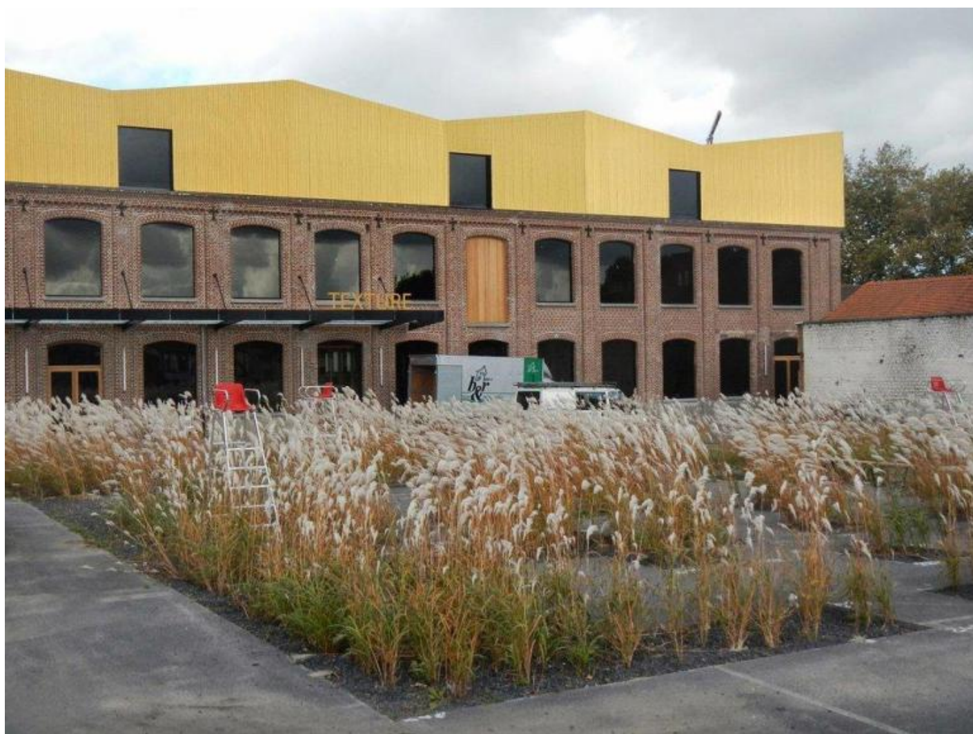
Wagon Landscaping. Flashcode garden, Kortrijk, Belgio.

La nuova generazione di paesaggisti ha una soluzione estrema ed efficace per risolvere alcuni dei problemi delle città contemporanee: prenderle a picconate. Sono quelli cresciuti nell'influenza del pensiero di Gilles Clément e della sua idea di Terzo Paesaggio, che ha spostato drasticamente l'attenzione dai giardini per signora bene alla potenza della natura vegetale che s'insinua fra gli interstizi delle città, cresce fra le fessure delle materie desolatamente inerti di cui sono costituiti edifici, strade e ogni cosa che l'uomo appoggia alla terra, soffocandola. Ed è proprio questo il problema, quello che i tecnici chiamano sigillazione del suolo. Perché è un problema? Giusto per citare quello che è più evidente, è per la sigillazione del suolo che quando piove giusto un po' più del normale, le strade si allagano con relativi danni a cose e persone.