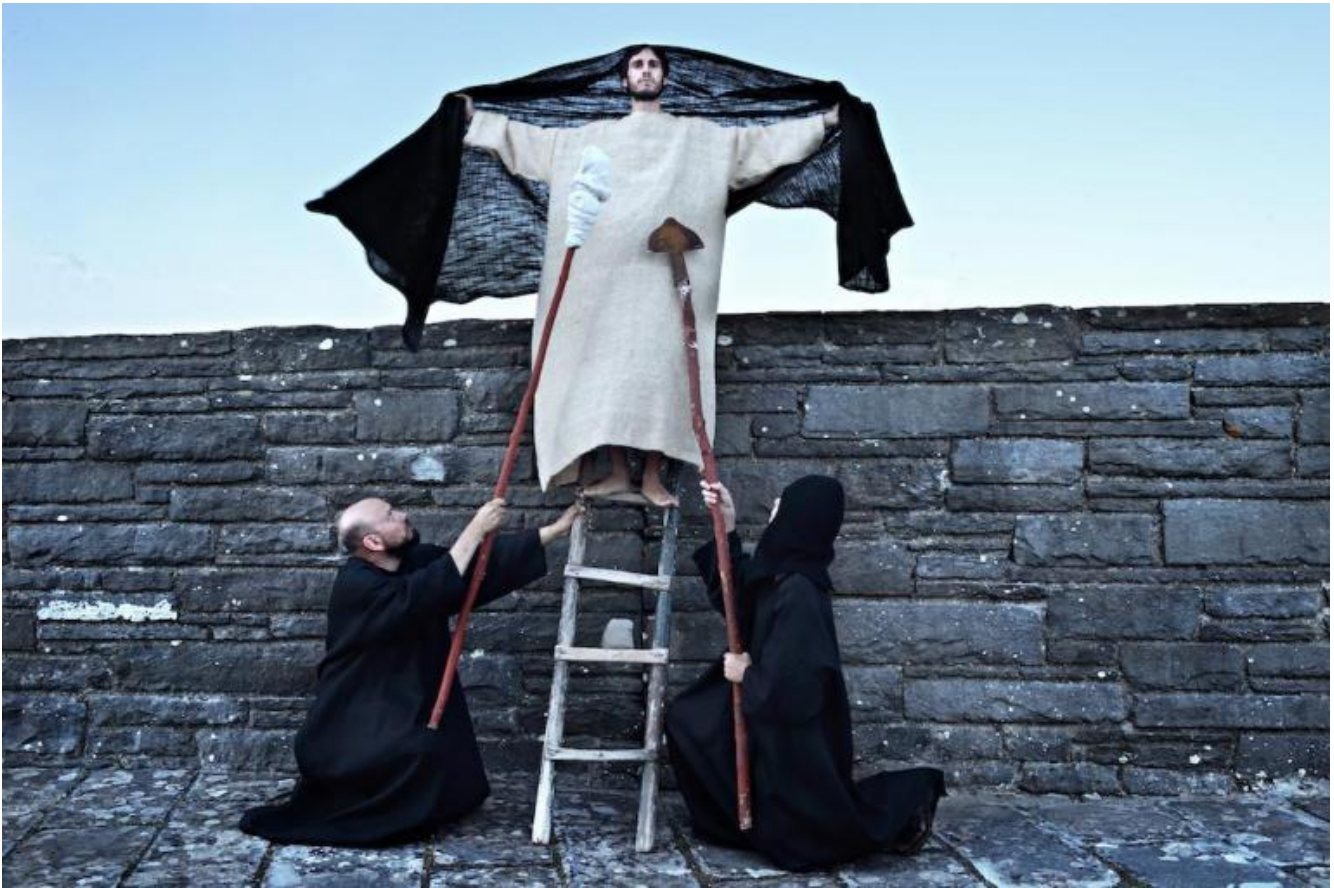
Pro e contra Dostoevskij, ph. Franco Guardascione.

Lo spettacolo si chiude con un'apertura, dopo i baci del tradimento, della rottura, del rifiuto del Cristo, un bacio all'Inquisitore e uno al protagonista, rivestito dello stesso rosso manto, continuando a dibattersi nella domanda su cosa avvenga se tutto è permesso. Il finale si dilata in una scena dolcissima, dall'altra parte della costruzione centrale del cimitero, verso il sole che tramonta tra i monti verso il lago Bilancino sullo sfondo, con il sogno in volo dell'uomo ridicolo e la scoperta, il desiderio, l'affermazione poetica che il male non può essere lo stato normale degli uomini.