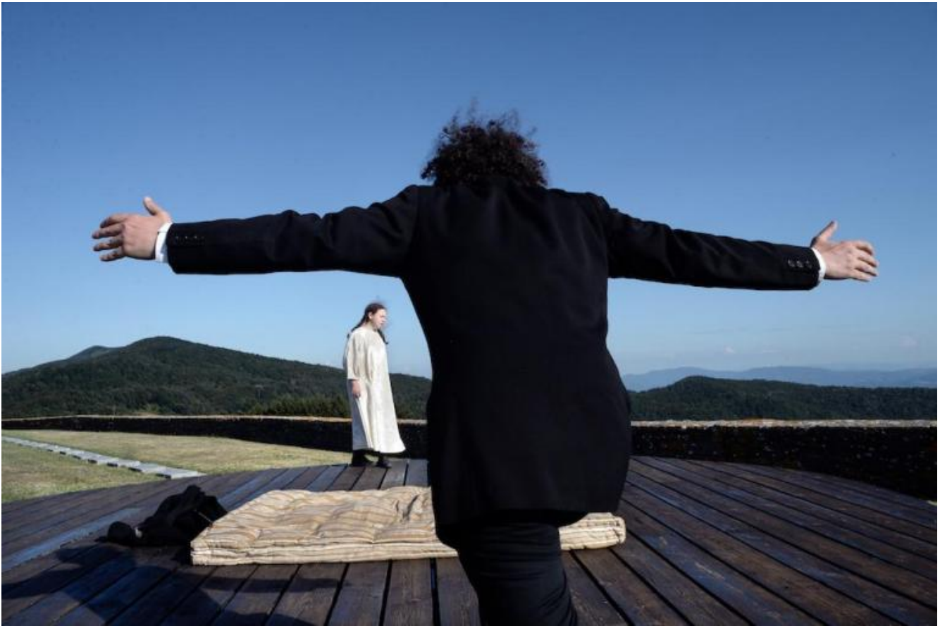
Pro e contra Dostoevskij.

Dostoevskij: il male, la volontà di potenza prima di Nietzsche, l'abisso di libertà dell'uomo che, abolito Dio, forza i limiti dell'arbitrio; e, di contro, l'ansia di senso, di assoluto, di legame, di religione, di fratellanza. L'abisso della tentazione della libertà e l'indagine sul bisogno di verità, di consistenza, di argini alle seduzioni, di silenzio, di ascolto interiore.