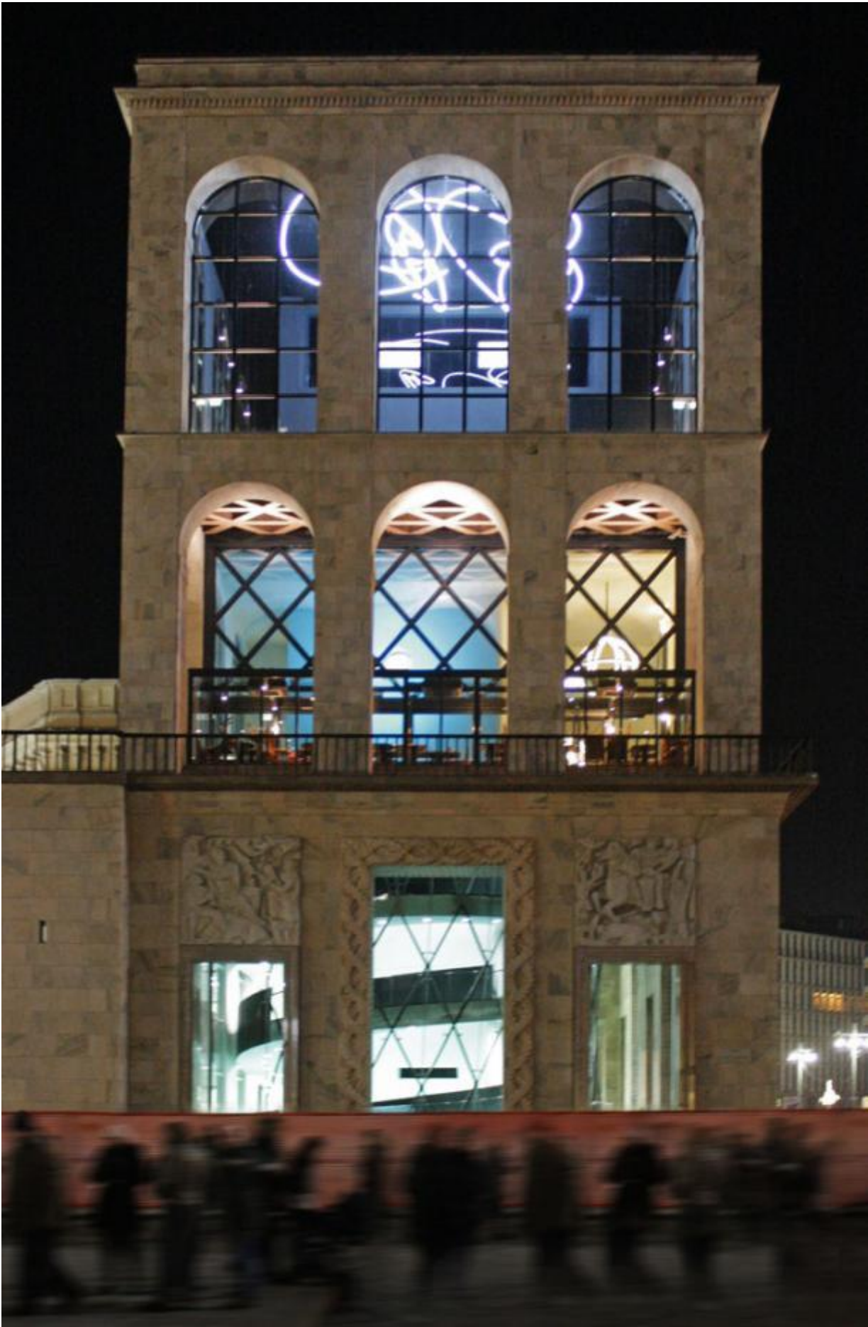
Museo del Novecento, Milano