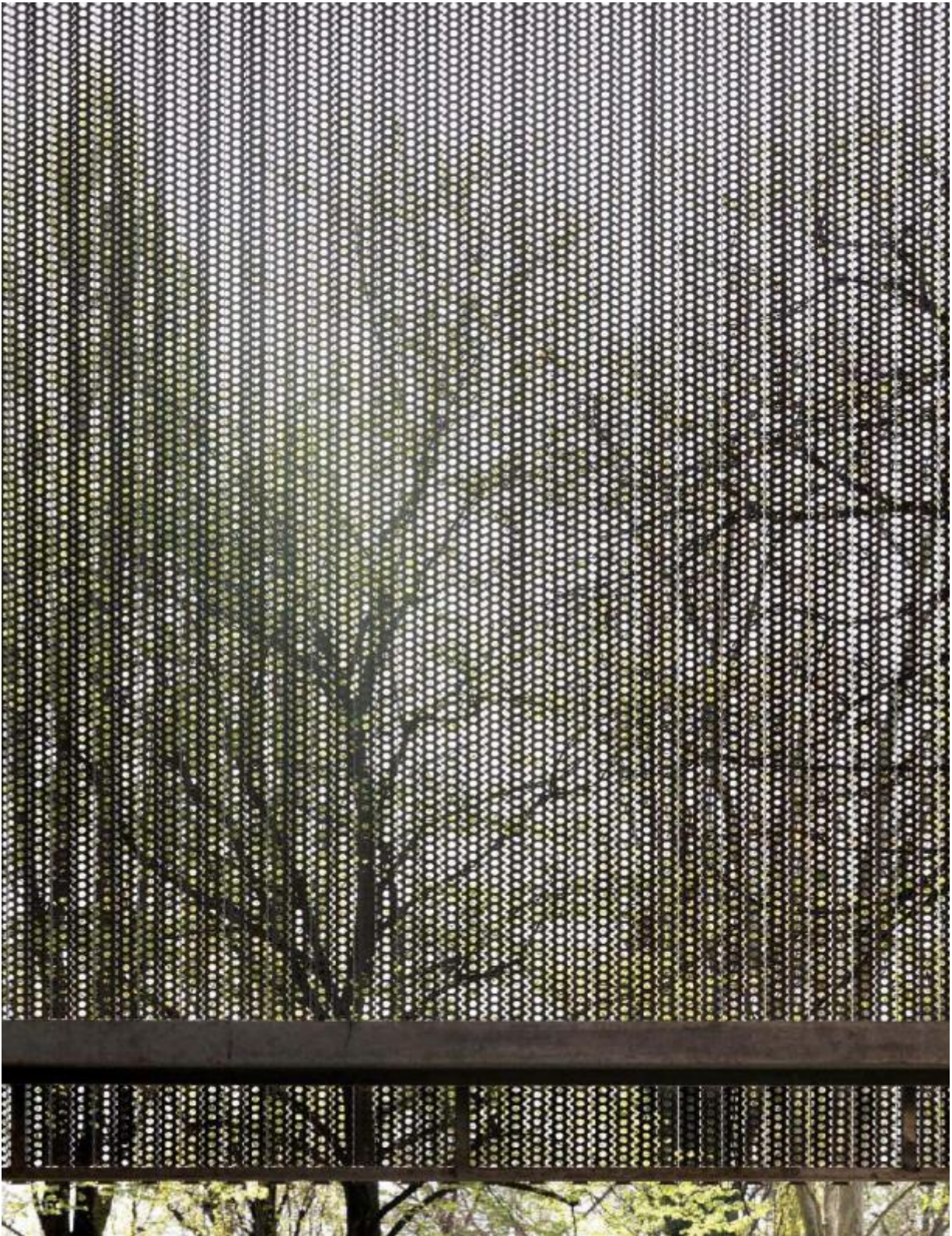
Studio Dordoni, Edificio per uffici, Milano