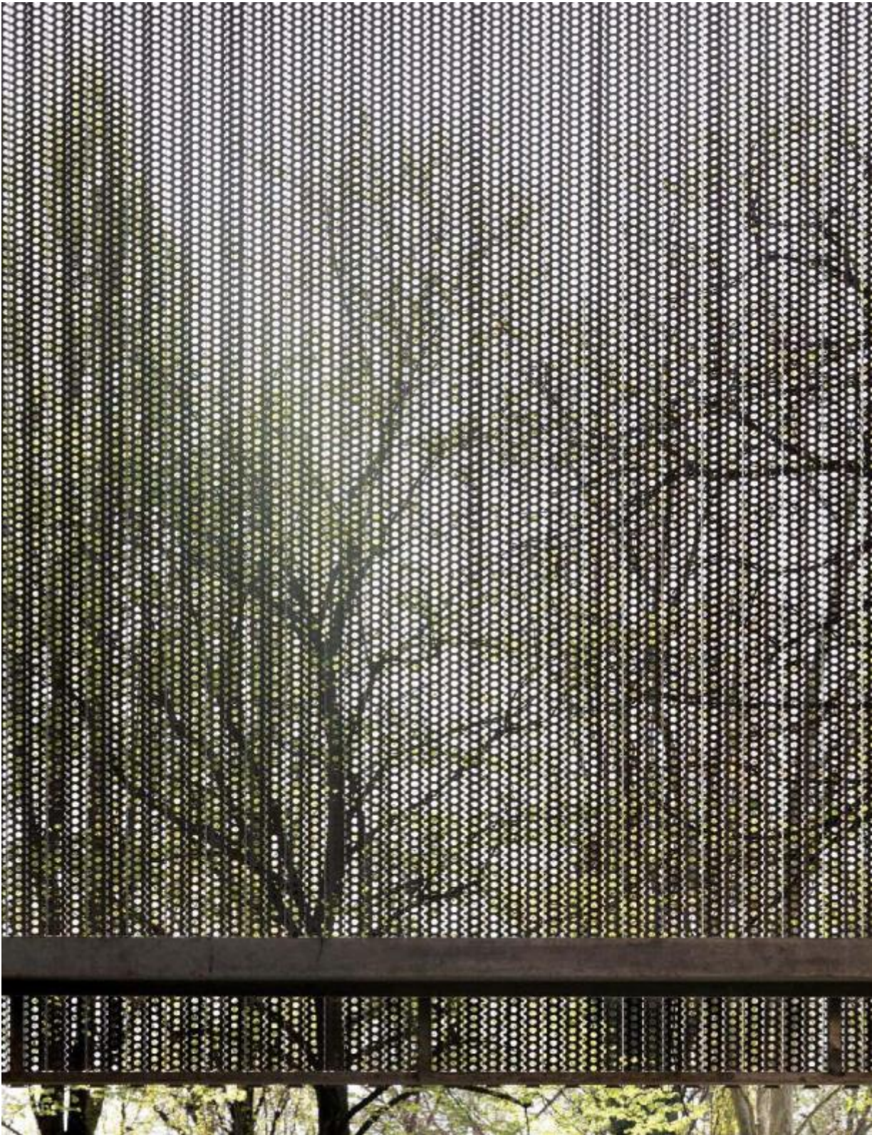
Studio Dordoni, Edificio per uffici, Milano