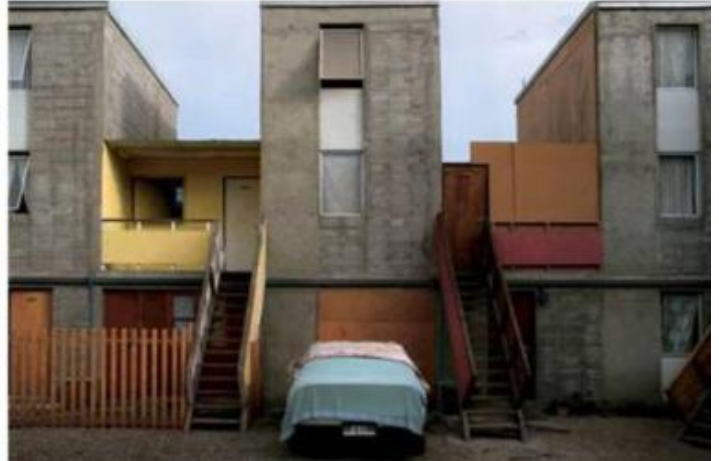
Alejandro Aravena, social housing, progetto di open building Quinta Monroy, a Iquique, Cile, 2004. In alto a sinistra foto fatta al termine del cantiere, nelle altre foto varie riconfigurazioni con modifiche apportate dagli abitanti.

A destare interesse è anche la dirompente forza di Alejandro Aravena, che coraggiosamente afferma: “[noi architetti] non siamo consulenti, siamo autori. Questo significa correre il rischio di fare proposte”. E le sue proposte si sono concretizzate nei famosi progetti di social housing a bassissimo costo, ‘open building’ che prevedono la possibilità di riconfigurare l’edificio nel tempo, a seconda delle necessità di chi lo abita, con interventi di autocostruzione, come nel caso di Quinta Monroy , ad esempio, realizzato a Iquique, in Cile e completato nel 2004, che si compone di 93 edifici. Oltre ad altri prestigiosi riconoscimenti, nel 2016, i suoi lavori a forte impronta sociale, gli hanno guadagnato il Pritzker Prize, premio che per l’architettura corrisponde al Nobel.