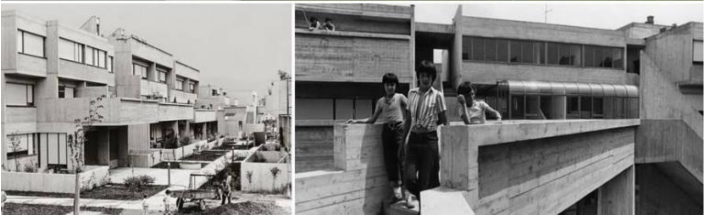
Giancarlo De Carlo, Villaggio Matteotti, Terni, 1969-1975.