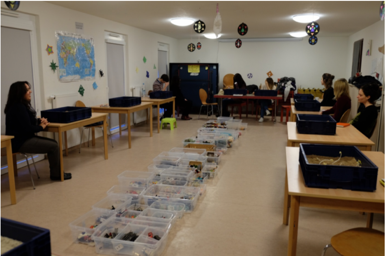
Terapia della sabbia per bambini yazidi a Stoccarda.

suo paese, quest'anziana signora non ha più aperto bocca. E non solo non profferisce parole, non le accoglie neanche più. L'indicibilità si è iscritta nel suo corpo. Non alza lo sguardo nemmeno una volta: né quando entriamo nella tenda, né mentre stiamo seduti, né quando ce ne andiamo. Nella mano sinistra tiene - me ne accorgo solo uscendo - un ciottolo."