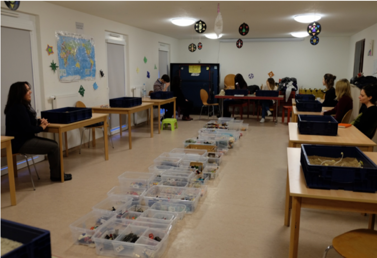
Terapia della sabbia per bambini yazidi a Stoccarda.