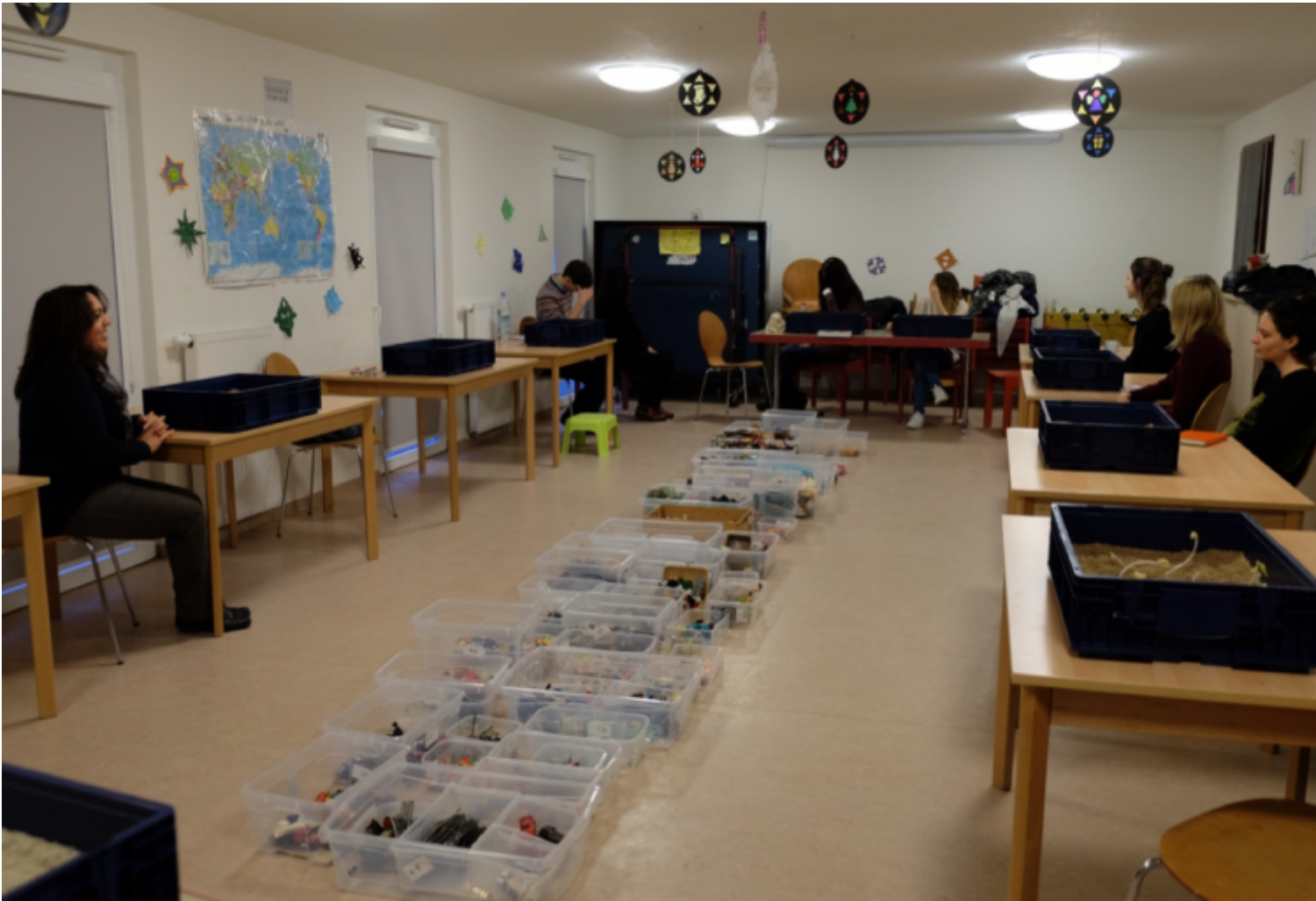
Terapia della sabbia per bambini yazidi a Stoccarda.

Più avanti l'autrice torna su questa scena, come se non le avesse dato pace, come se richiedesse un'altra descrizione, un'altra cornice, ancora contenimento. Questa volta Othmann fa un tentativo, aiutandosi con un grandangolo che le permette di avvicinarsi gradualmente. Apre con le parole "io scrivo". Come un'invocazione per riuscire a tenersi assieme, mentre mantiene lo sguardo su ciò che ha visto.