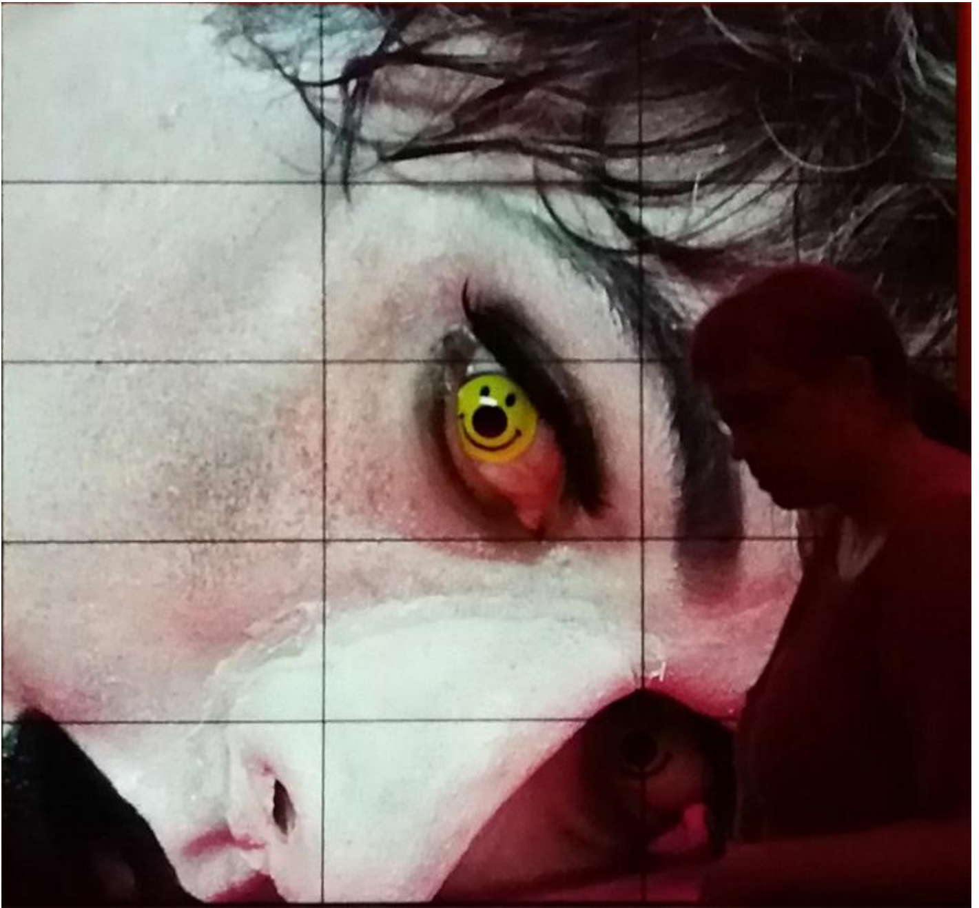
Alex Da Corte, Rubber Pencil Devil, video, 2019. Frame.

Nel video Rubber Pencil Devil di Alex Da Corte, presentato alla 58. Esposizione Internazionale d'Arte a Venezia (fino al 24 novembre), forme e colori dell'arte moderna e contemporanea (cultura alta) si mescolano a sketch televisivi, pupazzi, disegni animati, pubblicità e musical (cultura bassa). L'artista mette in scena con ironia cinquantasette momenti tratti dalla storia culturale americana del XX e XXI secolo, dimostrando come l'incontro fra cultura alta e bassa nella società di massa abbia modificato il concetto di patrimonio culturale . Anche i disegni animati e i fumetti meritano una tutela, alla pari dei grandi capolavori dell'arte? È una domanda che mi sono posto anni fa, incuriosito dalle rette che s'irradiano dalla testa di Gyro Gearloose (Archimede Pitagorico, personaggio inventato da Carl Barks negli anni Cinquanta del secolo scorso) quando un'idea illumina la sua mente.