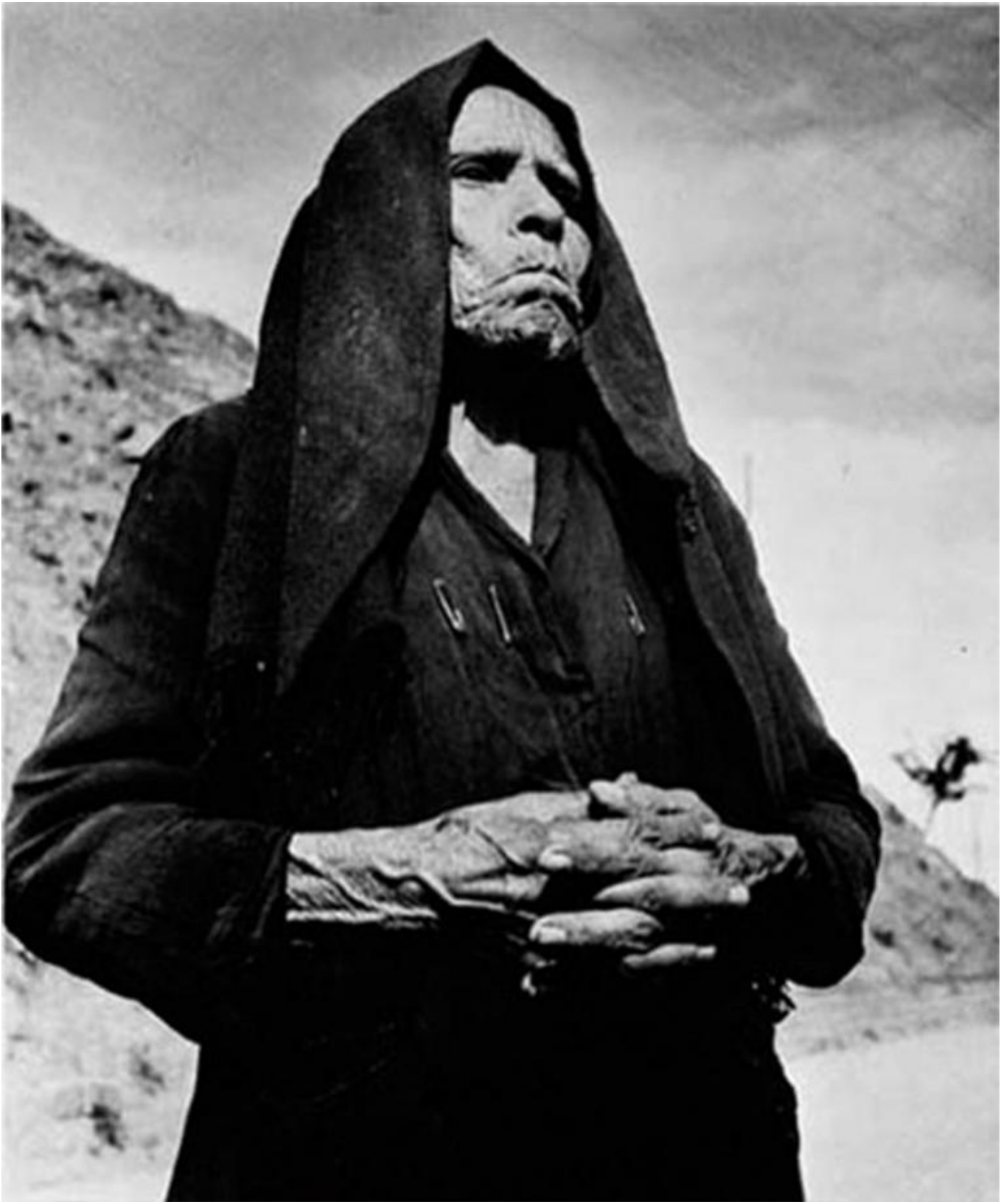
Fattucchiera di Colobrarò, 1952.

Secondo l'autore l'incontro con l'altro, sia esso l'amerindo al tempo delle scoperte geografiche o le "plebi rustiche" di cui scrive l'antropologo Ernesto De Martino negli anni Sessanta del secolo scorso, è il punto di partenza per una moderna definizione di patrimonio culturale . Non può esserci una coscienza democratica