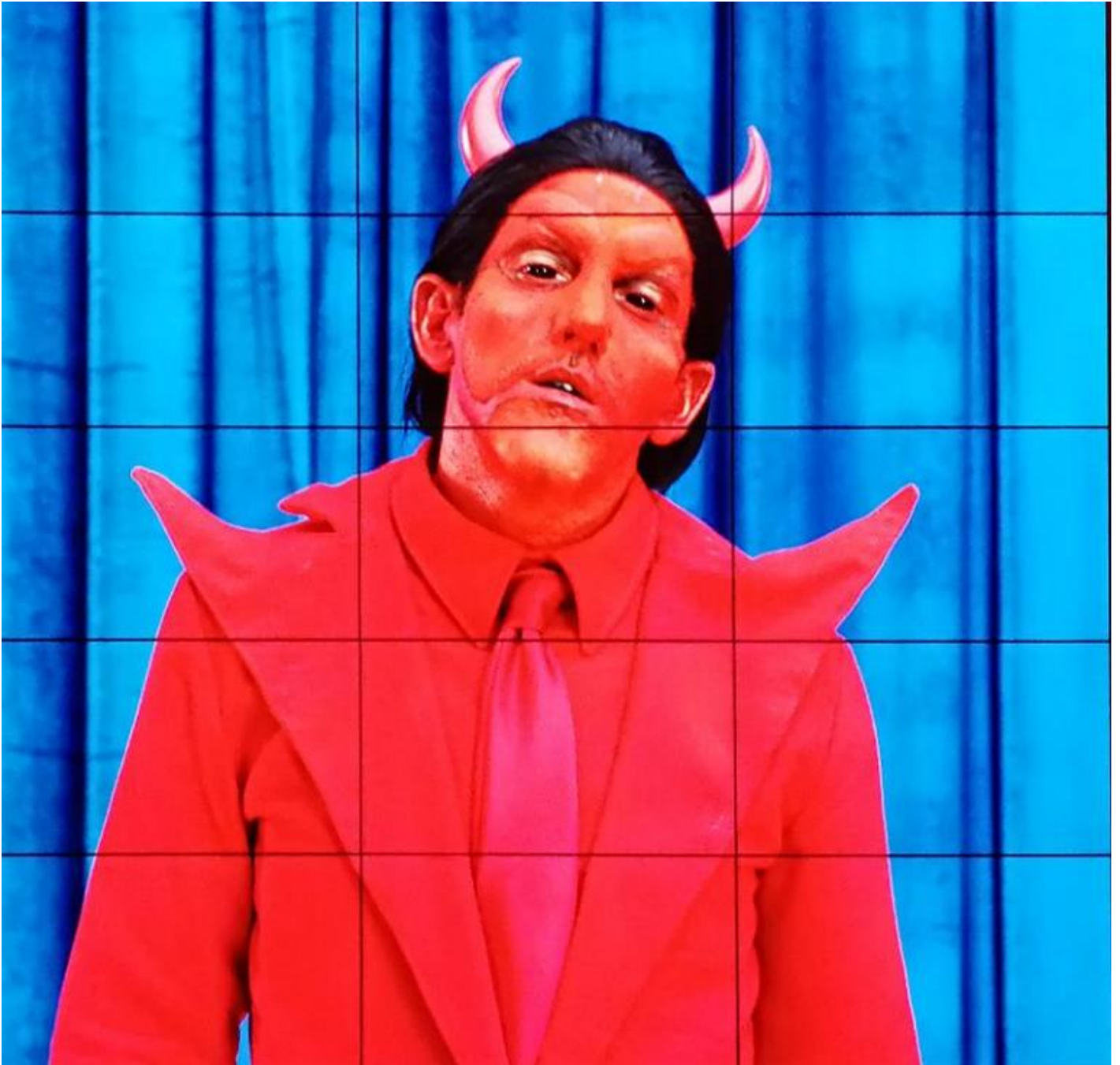
Alex Da Corte, Rubber Pencil Devil, video, 2019. Frame.

nazionale (ed europea) se non integrando i ceti sociali subalterni nella compagine sociale. Nella postfazione al saggio di Verde, Fabio Dei porta l'attenzione sul fatto che l'assenza di un approccio antropologico ci impedisce di comprendere l'attuale problema del populismo, della rottura tra élite culturali e popoli (p. 267). Senza integrare il concetto di cultura alta con il concetto di cultura bassa, riferito agli oggetti e alle pratiche ordinarie del quotidiano, alle forme che la cultura popolare assume nel contesto della società di massa, non può essere compreso il concetto moderno di beni culturali .