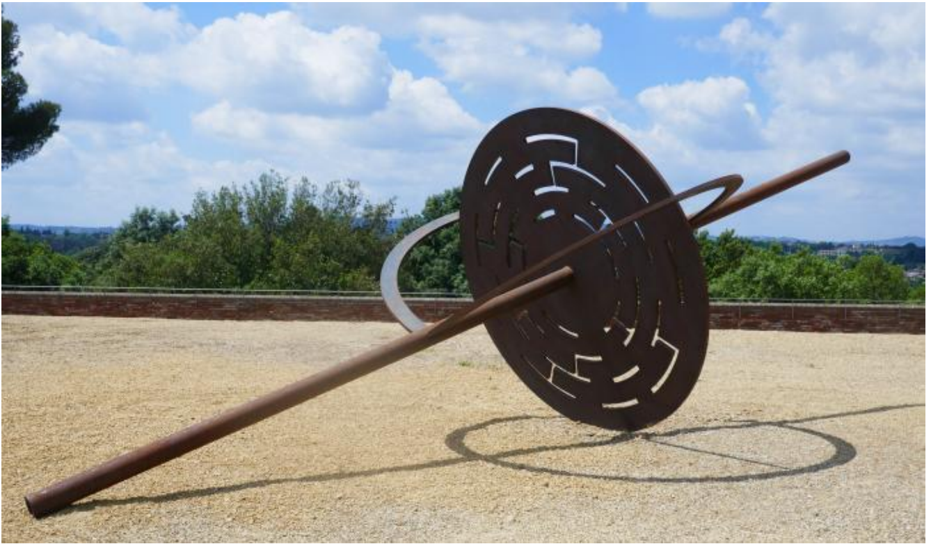
Le vie del cielo, 1995, nella mostra Gong. Eliseo Mattiacci, Firenze, Forte di Belvedere, 2018

Nel 1967 Mattiacci ha partecipato alla prima mostra dell'Arte Povera, alla Galleria La Bertesca di Genova. Ha tuttavia considerato da sempre vincolante circoscrivere la propria poetica all'interno di un'etichetta, di una compagine definita. Di "situazioni" più che di "gruppi" Mattiacci è infatti andato alla ricerca sin dai suoi primi passi, quando nel 1964 dalle Marche approda a Roma, dove soggiorna per più di vent'anni, sino al 1986, anno in cui dopo la nascita della figlia Cornelia farà ritorno con la compagna Silvia Mancini nelle Marche, stabilendosi a Pesaro.