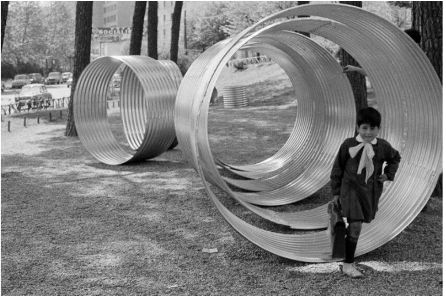
I Cilindri praticabili allestiti nel Parco Nomentano, Roma, 1968 Foto Claudio Abate.

Il 1° marzo 1969, a distanza di due mesi dall'azione dei Dodici cavalli vivi di Kounellis, Mattiacci entra nel garage di via Beccaria, il nuovo spazio di Sargentini, su un compressore arancione e blu e spiana della terra pozzolana per creare un percorso-sentiero vibrante e accidentato che si estende dall'ingresso all'interno. Leggendo oggi questo intervento in relazione con il coevo scenario earthworks americano, sembra che Mattiacci abbia fornito la propria risposta e critica alle grandi operazioni sul paesaggio compiute dagli artisti d'oltreoceano. Se alla base delle azioni di accumulazione, scavo, scaricamento, incisione, demarcazione condotte sul paesaggio dagli artisti americani vi è l'utilizzo di mezzi meccanici, Mattiacci nella sua azione trasforma il rullo compressore in una sorta di grande ready-made, ancora una volta un oggetto-giocattolo che depotenzia la tecnologia e conferisce "qualità misteriose" all'azione.