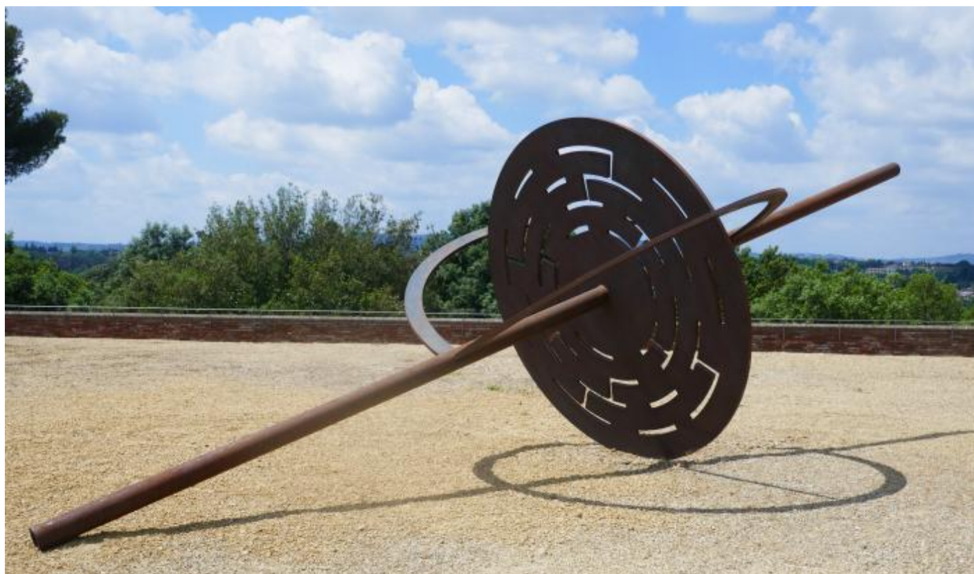
Le vie del cielo, 1995, nella mostra Gong. Eliseo Mattiacci, Firenze, Forte di Belvedere, 2018

Due mostre in anni recenti hanno riportato all'attenzione la centralità del suo lavoro nell'ambito del rinnovamento della scultura del XX Secolo – le antologiche curate da Gianfranco Maraniello al Mart di Rovereto nel 2016, e da Sergio Risaliti, al Forte di Belvedere e al Museo del Novecento di Firenze nel 2018. Attraversando i decenni e i diversi momenti della sua ricerca, questi eventi espositivi hanno evidenziato la potenza di una processualità plastica che ha scardinato i confini per disegnare nuove spazialità e modalità della scultura.