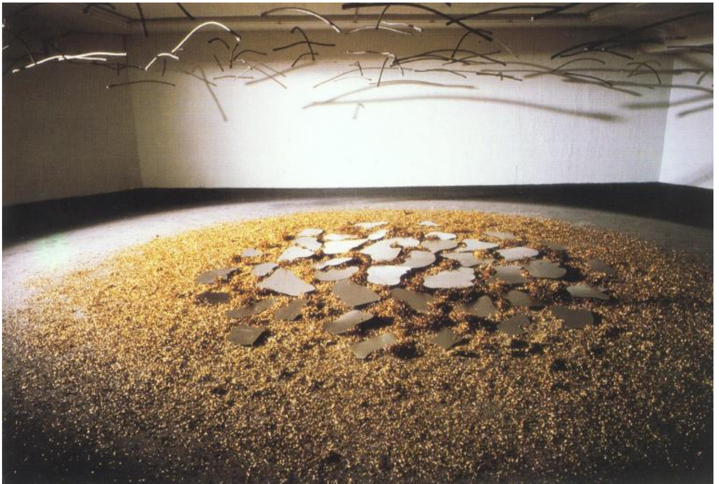
Alta tensione astronomica, 1984

A ragione Fabrizio D'Amico, che a Mattiacci ha dedicato pagine tra le sue più intense, ha letto queste riflessioni come rivelatrici di tanta scultura a venire, quando a partire dagli anni Ottanta nuovi interessi cosmico-astronomici rivitalizzano il suo rapporto con la materia, con l'immagine plastica, con l'idea di scultura.