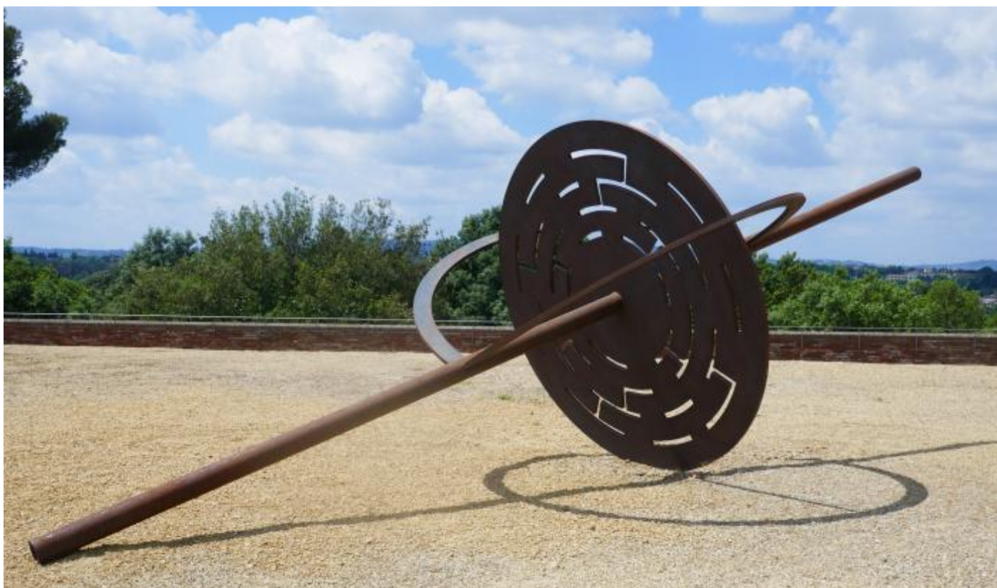
Le vie del cielo, 1995, nella mostra Gong. Eliseo Mattiacci, Firenze, Forte di Belvedere, 2018