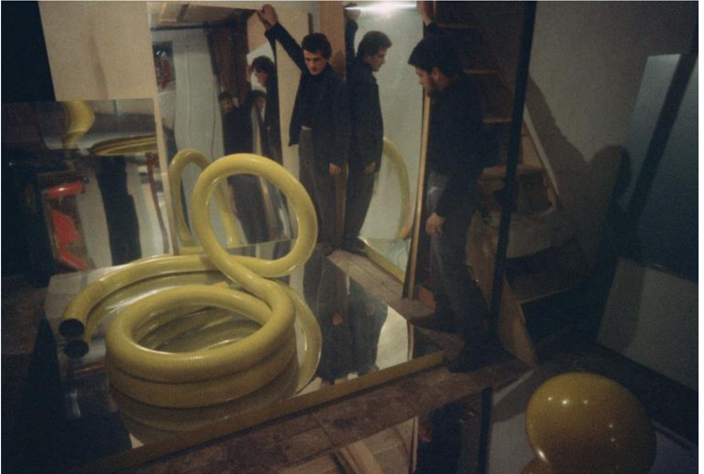
Eliseo Mattiacci nello studio di via Laurina, Roma, 1966-1967