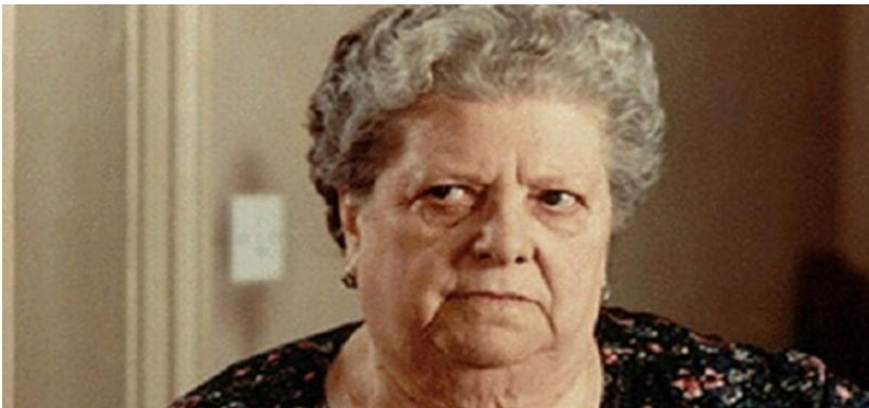
Sora Lella sardonica.

Roma nostra, gajarda e tosta, ma fino a un certo punto. Uno spirito, piuttosto, che si trasfigura in una vis comica insieme cruda e sottile, temeraria e disperata, selvatica e celeste, come di chi è abituato a maneggiare il sacro acchiappandolo per la coda e quindi vedendo come meglio non si potrebbe quel che di pochissimo sacro c'è di norma sotto la coda. Di qui certe antiche occhiate da pesce lesso di Alberto Sordi, certe impazienze della Sora Lella (“Annamo bbene! Annamo proprio bbene!”), certi implausibili ruggiti di Gigi Proietti, certi sdegnati scatti della Magnani, certi salti logici di Verdone, certe fiabesche tiritere di Corrado Guzzanti, certe risolte sentenze di Roberto D'Agostino, certe accorati scoppi di risa di Sabrina Ferilli.