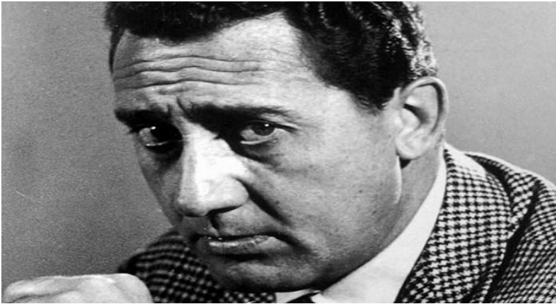
Diffidenza di Sordi.

culo dell'altri”), nelle risposte social alle minacce dell'Isis (“Attenti ar raccordo, che restate imbottijati!”), come pure “Pijateve pure mi'socera!”).