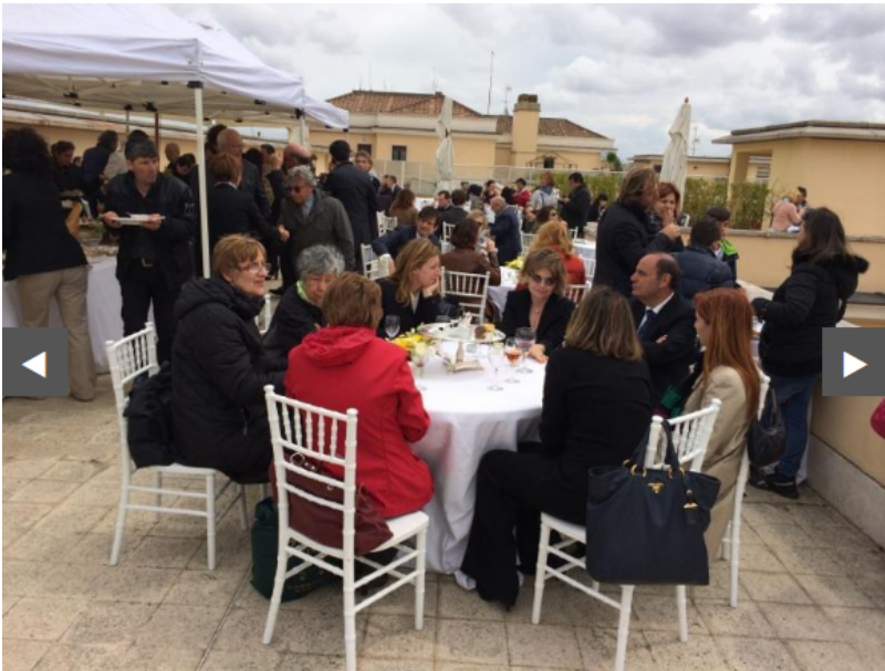
Banchetto per la beatificazione dei due papi.

E ancora, non è questione di demagogia anti-politica, però anche al giorno d'oggi i politici cedono al gusto della patacca e alla smania di far bella figura; così nel dicembre del 2003 accadde che un nutrito drappello di deputati e senatori pretesero e ottennero di attraversare il già caotico centro di Roma a cavallo, mentre altri onorevoli non cavallerizzi li seguivano in carrozza, insieme a vigili, poliziotti e spazzini comunali incaricati di seguire il corteo per raccogliere in tempo reale la cacca degli animali.