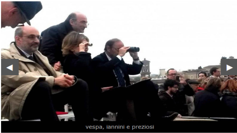
Vespa e altri vip sul tetto della Prefettura apostolica.