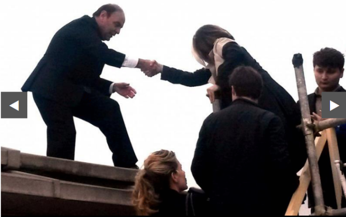
Li rampichini del Palazzo Apostolico, aprile 2014.

Ma tale è l'applicazione di pronto ed efficace uso del Poeta che dagli e dagli, secondo un processo inverso si finisce per fiutare, individuare, riconoscere, anche con una certa sicurezza, le tipiche atmosfere belliane nell'attualità: nobili che inguattano opere d'arte, segretari di Papi dalle mani leste, gentiluomini di Sua Santità e della "Cricca" a caccia sessuale per il tramite di coristi esotici, monache prese inopinatamente a revolverate. In questo senso irresistibile è stato richiamare Belli dall'aldilà quando Bruno Vespa e altri vip, sponsor e privilegiati maggiorenti ascesero, grazie all'intervento di Francesca Immacolata Chaoqui, sul tetto del palazzo della Prefettura apostolica per meglio seguire la cerimonia di beatificazione di Giovanni XXIII e Pio IX; e una volta arrampicatisi lassù fecero la comunione e banchettarono anche, con il che osservando il magnifico servizio fotografico realizzato in tempo reale da Roberto D'Agostino per Dagospia, in un empito di esaltazione quasi medianica mi sentii autorizzato a immaginare addirittura un possibile titolo di sonetto: "Li rampichini de li ddu Papi beati".