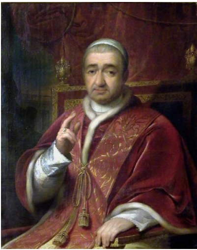
Papa Gregorio XVI

Per cui appena cominciato a fare il giornalista, a Panorama poi alla Stampa e infine a Repubblica , ho sempre fatto in modo che nell'armadietto dietro la scrivania ci fosse a portata di mano l'edizione dei Sonetti, completa di indice dei nomi, dei luoghi e delle cose notevoli; così come nei miei vari pc e devices, compreso l'iphone, non mancano mai files, in formato word e pdf, dedicati per un'agevole ricerca automatica – che in realtà tanto agevole non è considerate le varianti, i raddoppi, le maiuscole – su e giù lungo l'ottovolante dei 2273 sonetti. Amen.