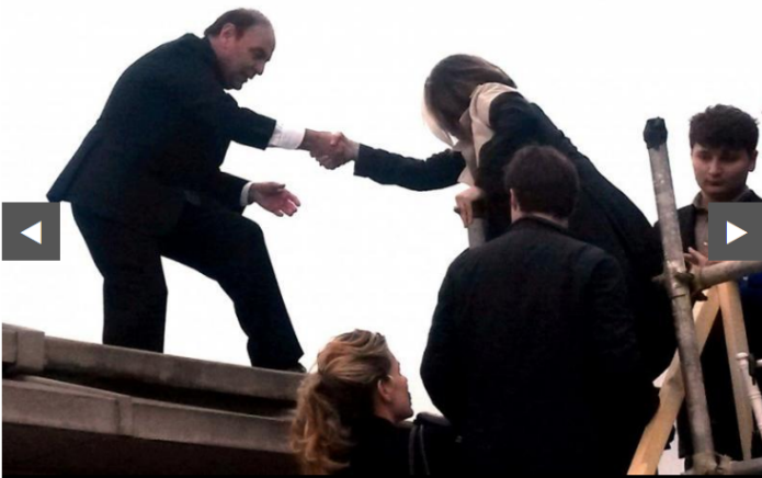
Li rampichini del Palazzo Apostolico, aprile 2014.