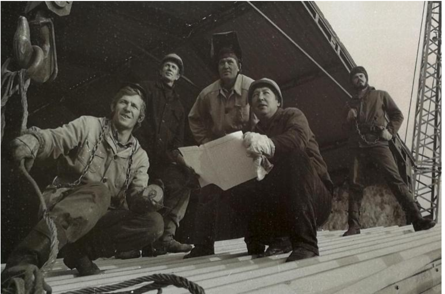
Fotografia dell'incontro storico degli operai ferroviari avvenuto il 29 settembre 1984 nel tratto Cuanda-Ciara, luogo in cui verrà costruito il binario di scambio Balbukhta al 1602esimo chilometro della ferrovia principale di Bajkal-Amur.

Il corpo di Lenin riposa ancora nel suo mausoleo, nonostante il fallito tentativo di Boris Yeltsin di sfrattarlo dopo la dissoluzione del Soviet Supremo della Russia nella Federazione Russa. Vi fu tuttavia un periodo in cui dovette cambiare residenza. Il Politburo del Comitato centrale del PCUS decise di trasferirlo a Tjumen in Siberia, a est della catena degli Urali, quando il 22 giugno 1941 le truppe tedesche oltrepassarono il confine sovietico.