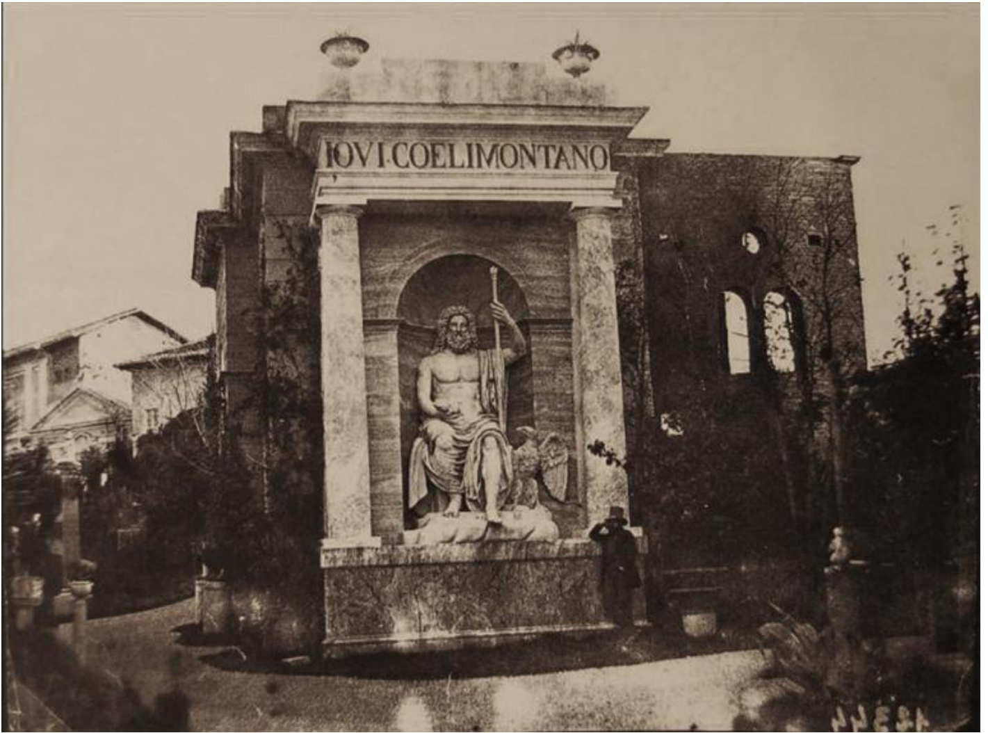
Edicola di Giove Celimontano (fine del I secolo d.C.) a Villa Campana in una foto del 1851, ora al Museo Statale Ermitage di San Pietroburgo.

D'altra parte anche l'Esposizione delle realizzazioni dell'economia nazionale (VDNKh) , inaugurata a Mosca nel 1939 (esempio notevole di architettura sovietica stalinista), testimonia la preferenza del potere politico autoritario per la citazione dell'antico, nel caso della VDNKh rivisitato in senso trionfalistico ed eclettico, a dispetto delle rivoluzionarie sperimentazioni suprematiste e costruttiviste dell'Avanguardia Russa, che avrebbero dovuto fornire i caratteri estetici della trasformazione sociale e politica in atto.