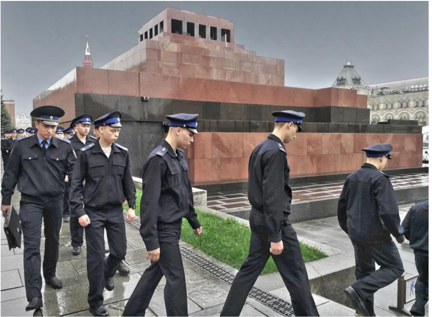
Cambio della guardia al Mausoleo di Lenin.

Questa singolare pedagogia del visuale la dobbiamo a Stalin, che ordinò la conservazione e l'esposizione del corpo di Lenin, e ai mafiosi russi che indirettamente ne finanziarono la cura.