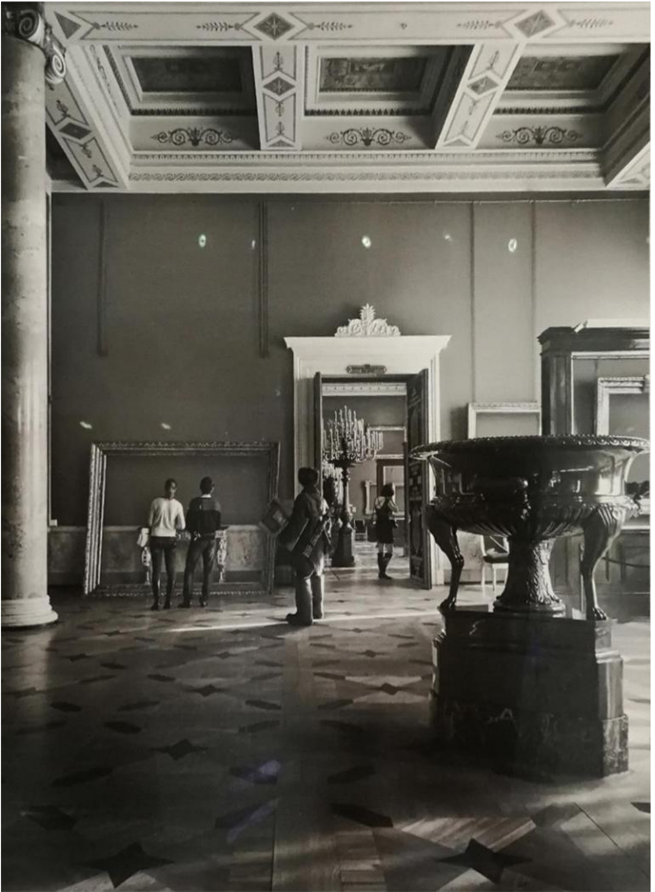
Yasumasa Morimura, The Hermitage. 1941 -2014, 2014, stampa digitale su carta.