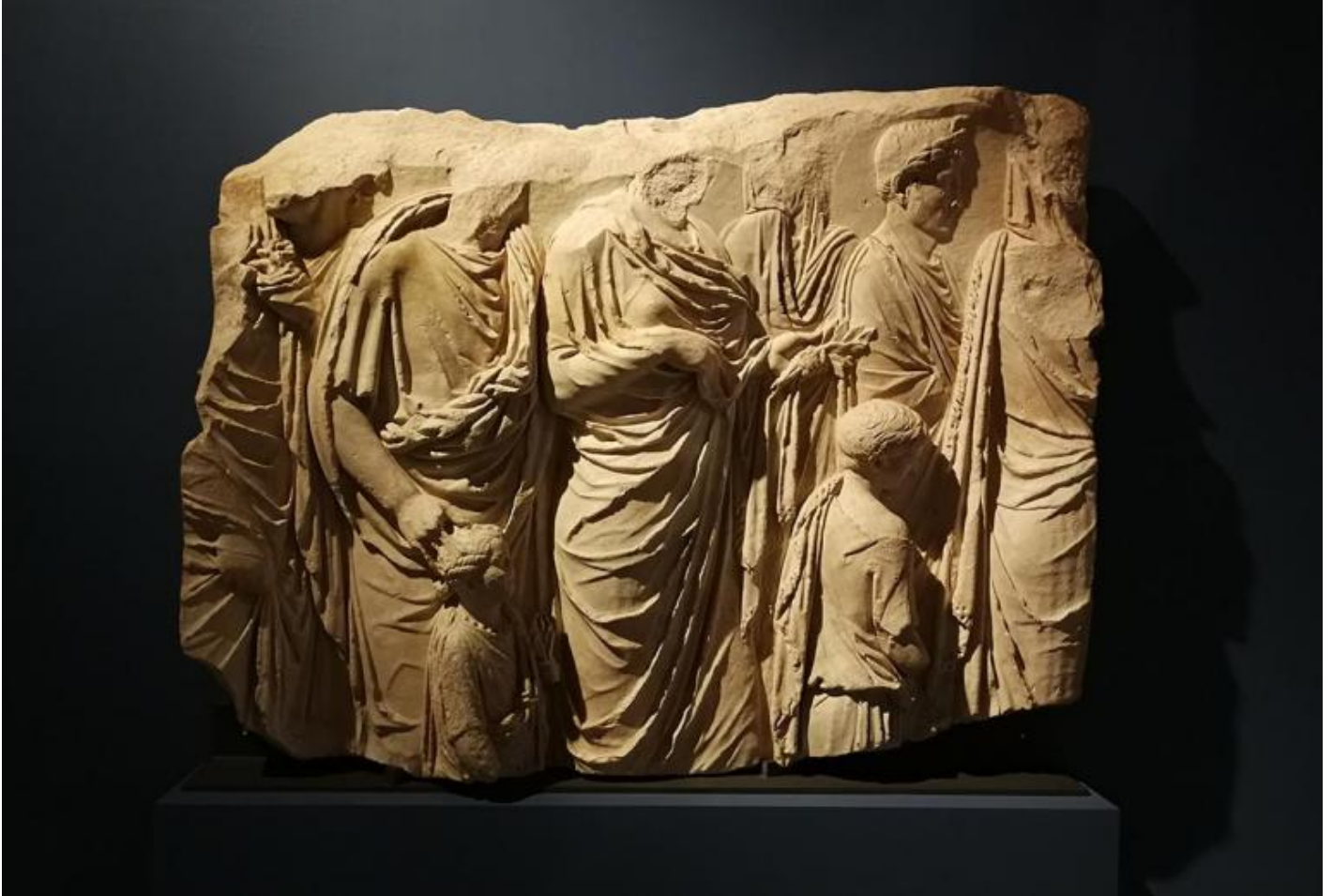
A Dream of Italy. The Marquis Campana Collection, frammento dell'Ara Pacis, I secolo a.C. acquistata dal Louvre.

un'importante parte del nostro patrimonio artistico e culturale, ma in seguito ad alcune peripezie, fra le quali l'arresto del marchese, accusato di essersi illegalmente appropriato dei fondi del Monte di Pietà dello Stato Pontificio di cui era direttore, nel 1861 la collezione fu messa in vendita. L'Hermitage e il Louvre acquistarono il grosso, il resto andò al Victoria and Albert Museum e ad alcuni collezionisti (a Roma rimasero solo le monete), suscitando l'indignazione di coloro che tentavano di difendere il patrimonio artistico e culturale italiano.