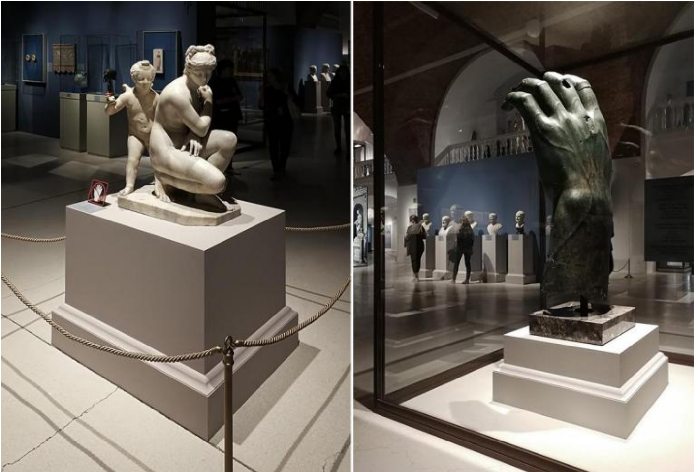
A Dream of Italy. The Marquis Campana Collection, vedute della mostra.

La collezione dell'Hermitage comprende un importante gruppo di opere provenienti dalla raccolta Campana, alla quale il museo di San Pietroburgo dedica la mostra A Dream of Italy. The Marquis Campana Collection (fino al 20 ottobre 2019), organizzata in collaborazione con il Louvre, partner del progetto. Il marchese Giovanni Pietro Campana raccolse e catalogò numerose opere tentando un'enciclopedia dell'arte italiana dai tempi antichi al Neoclassicismo. Nel 1858 pubblicò i cataloghi, otto di arte antica e quattro di pittura e scultura dal Rinascimento al Neoclassicismo, divisi per classi. Ogni classe era suddivisa in sezioni tematiche e cronologiche.