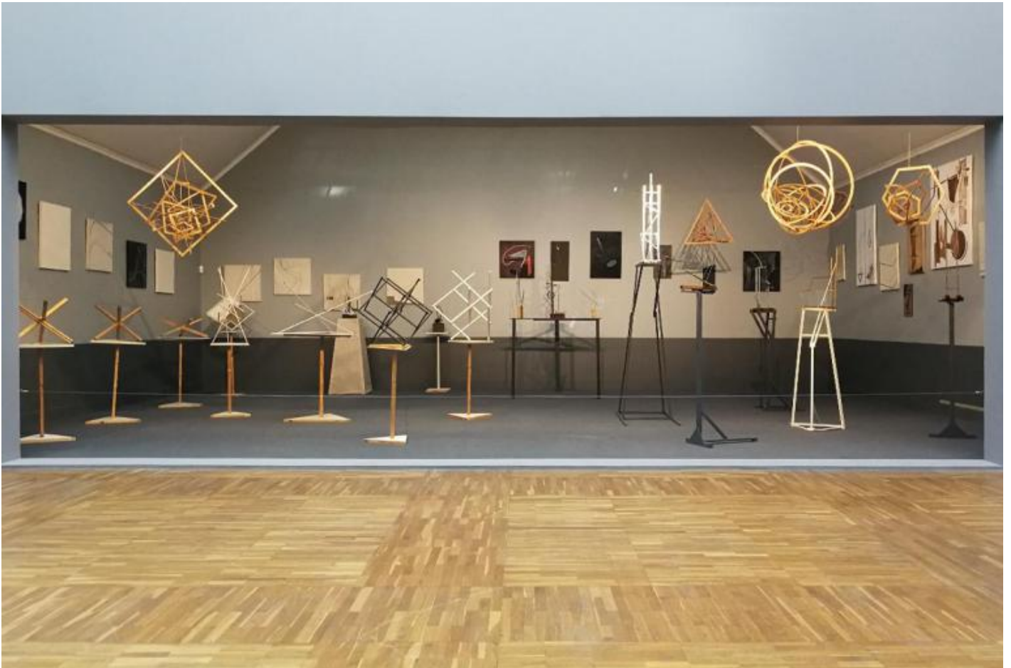
Mostra della Società dei Giovani Artisti (OBMOKhU) organizzata nel 1921 a Mosca. Ricostruzione esposta alla Nuova Tret'jakov, Mosca.

Le utopie non si realizzano, i sogni talvolta sì. Caterina II aveva “un sogno dell’Italia” che realizzò convocando a corte architetti e urbanisti italiani per dare a Pietrogrado una forma neoclassica, integrata a tipologie russe e sovrapposta a quella Rococò di Pietro il Grande. Lenin aveva invece un’utopia che in quanto tale non poteva essere realizzata.