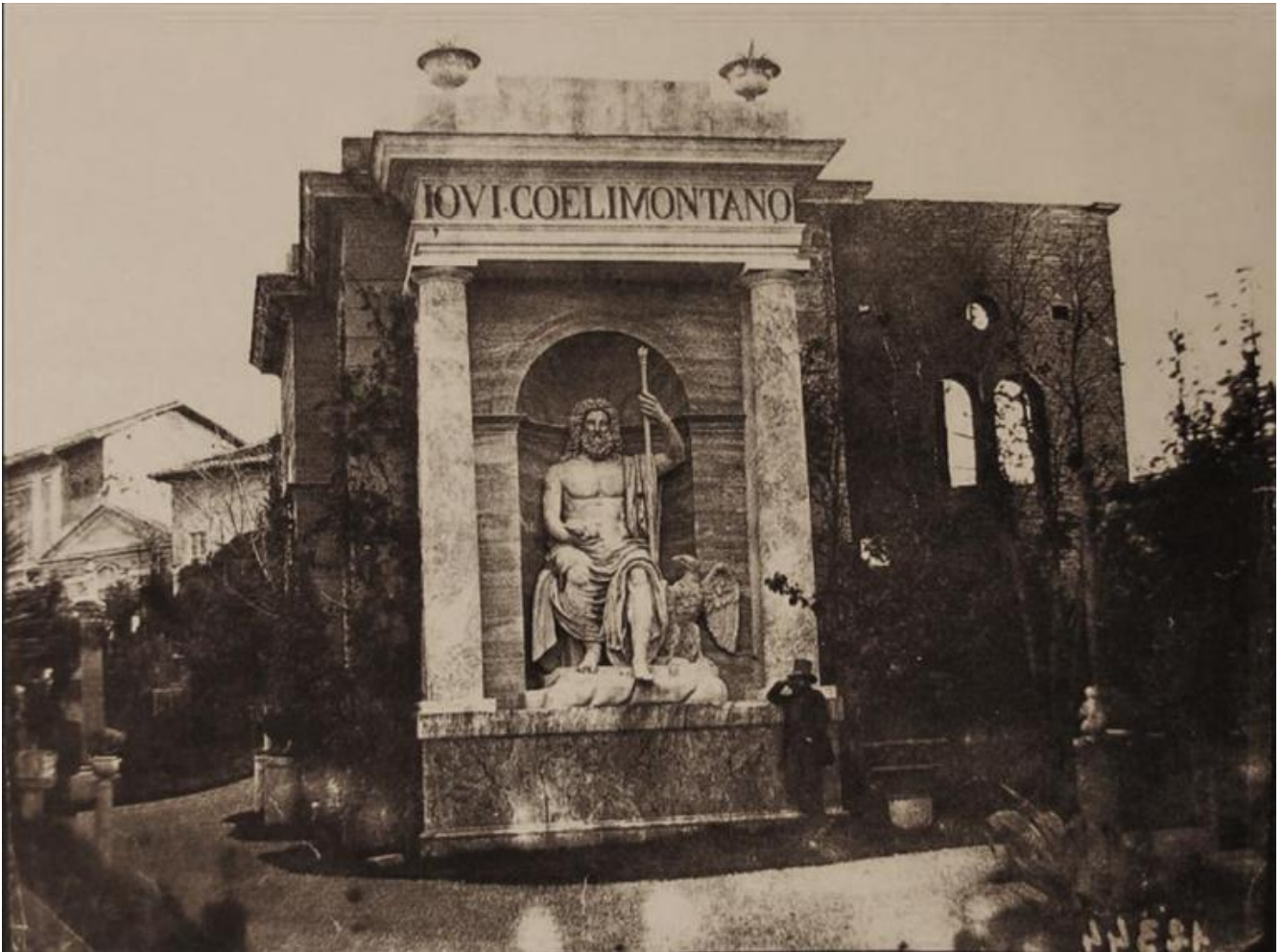
Edicola di Giove Celimontano (fine del I secolo d.C.) a Villa Campana in una foto del 1851, ora al Museo Statale Ermitage di San Pietroburgo.

Con queste acquisizioni gli stati nazionali intendevano rafforzare la loro autorità, non solo utilizzando l'arte come strumento di propaganda per la costruzione di una coscienza coloniale nazionale, ma anche appropriandosi dei simboli dell'altrui potere politico con scorribande cronologiche oltre che geografiche. La statua di Giove Celimontano della collezione Campana acquistata dall'Hermitage, già intesa in epoca romana come simbolo del potere statale, svolge in questo senso un ruolo significativo.