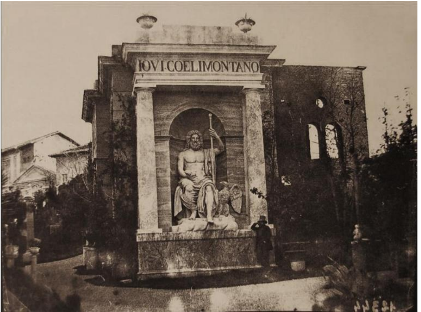
Edicola di Giove Celimontano (fine del I secolo d.C.) a Villa Campana in una foto del 1851, ora al Museo Statale Ermitage di San Pietroburgo.

D'altra parte anche l'Esposizione delle realizzazioni dell'economia nazionale (VDNKh) , inaugurata a Mosca nel 1939 (esempio notevole di architettura sovietica stalinista), testimonia la preferenza del potere politico autoritario per la citazione dell'antico, nel caso della VDNKh rivisitato in senso trionfalistico ed eclettico, a dispetto delle rivoluzionarie sperimentazioni suprematiste e costruttiviste dell'Avanguardia Russa, che avrebbero dovuto fornire i caratteri estetici della trasformazione sociale e politica in atto.