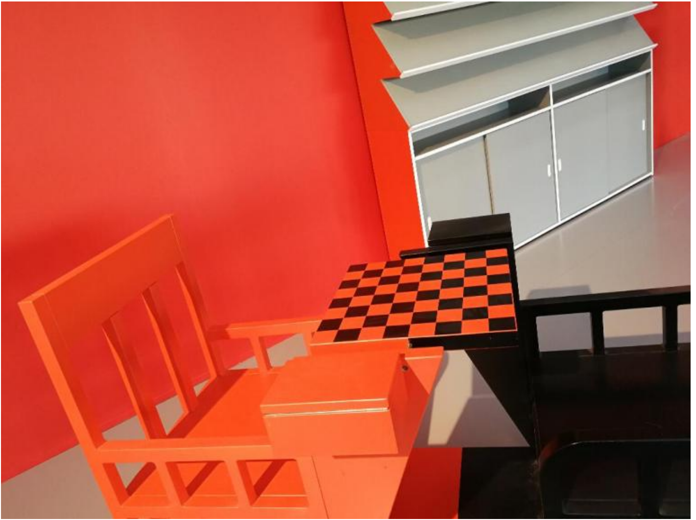
Aleksandr Michajlovič Rodčenko, ambiente per il dopolavoro operaio progettato per l'esposizione universale di Parigi del 1925. Dettaglio della ricostruzione esposta alla Nuova Tret'jakov, Mosca.