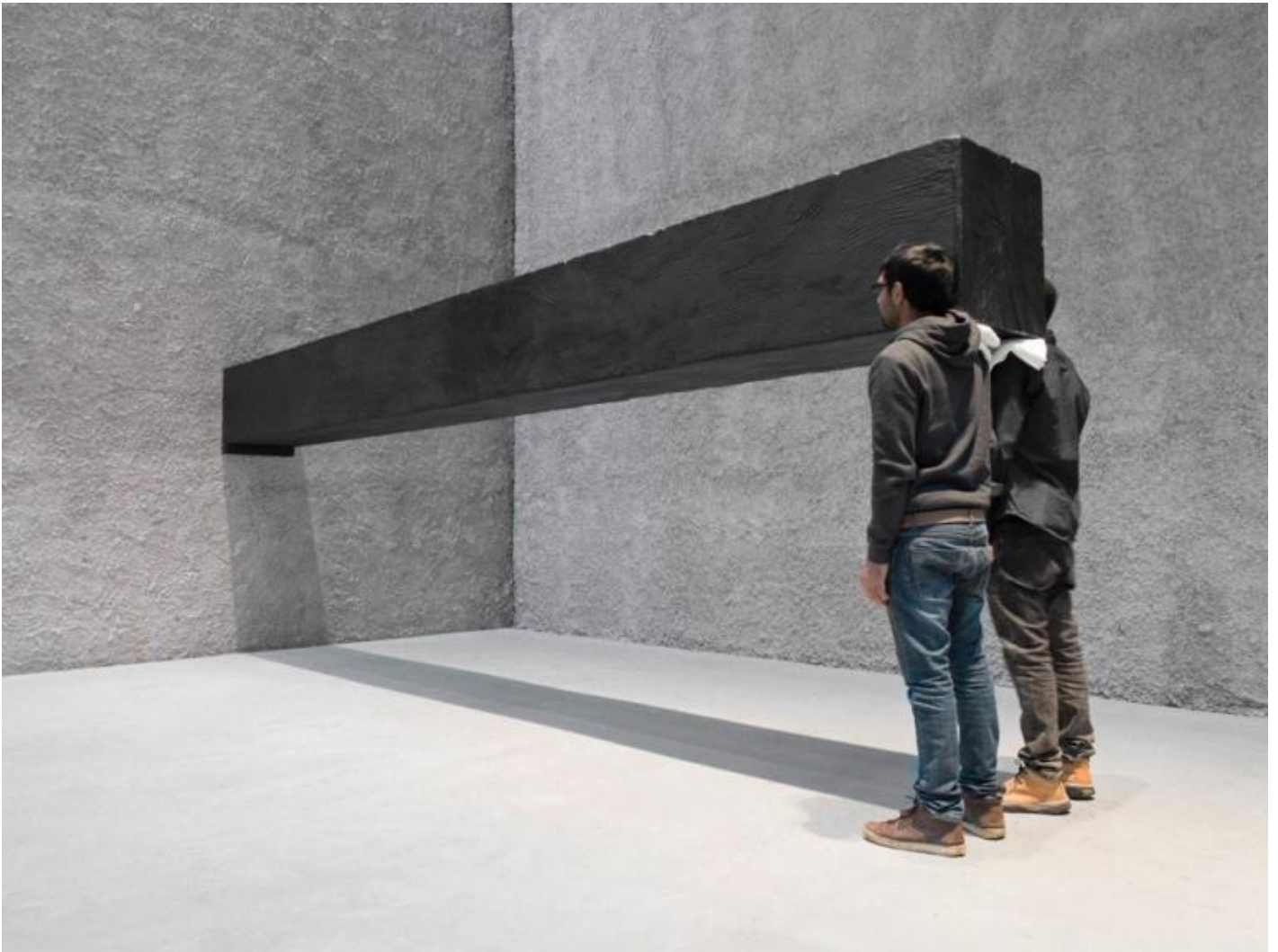
Santiago Serra, Forma di 600x57x52 cm costruita per essere sostenuta perpendicolarmente a una parete, 2001.

Violenza delle immagini, con una forte icasticità espressiva, rimandi a situazioni sgradevoli, segnali allarmanti del profondo disagio esistenziale nel quale si dibatte la nostra epoca, alienazione e una feroce critica sono gli elementi che caratterizzano la tua ricerca da anni. Ci puoi parlare del carattere intrinsecamente politico del tuo lavoro?