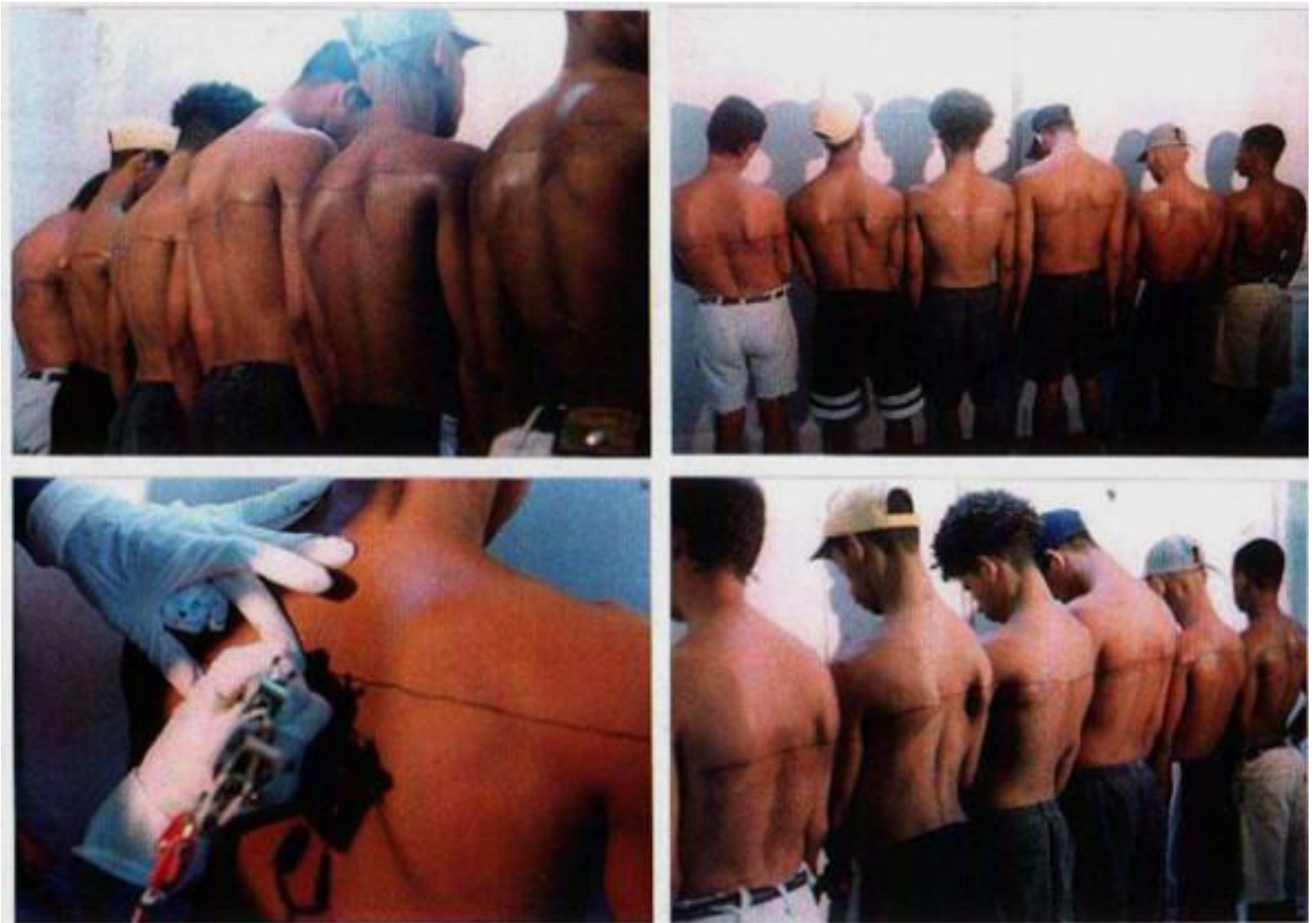
Santiago Serra, Immagini tratte dalla performance all'Havana, Riga di 250 cm tatuata su sei persone retribuite, 1999.

Nel rito cattolico, in un momento della messa, ai credenti viene chiesto di battere il petto mentre ripetono: “mia colpa, mia colpa, mia grandissima colpa”. È una delle innumerevoli tecniche utilizzate da quella religione per ottenere la distruzione dell'individuo e della sua autostima, per ottenere lo schiavo perfetto, quello capace di auto-schiavizzarsi. Anche se questi rituali sono ancora in uso, sono antiquati. Oggi, i mass media come la televisione, Hollywood o Internet, forniscono contenuti simili di carattere auto-punitivo. Convincere la vittima della sua colpa di fronte all'abuso è un manuale per tutti gli abusanti. Questi temi aleggiavano nella mia produzione artistica da molto tempo, concentrando tale colpa nell'ambiente di lavoro, militare, sessuale, ecc. Per questo motivo, alla fine, abbiamo deciso di nominare così la nostra mostra a Milano.