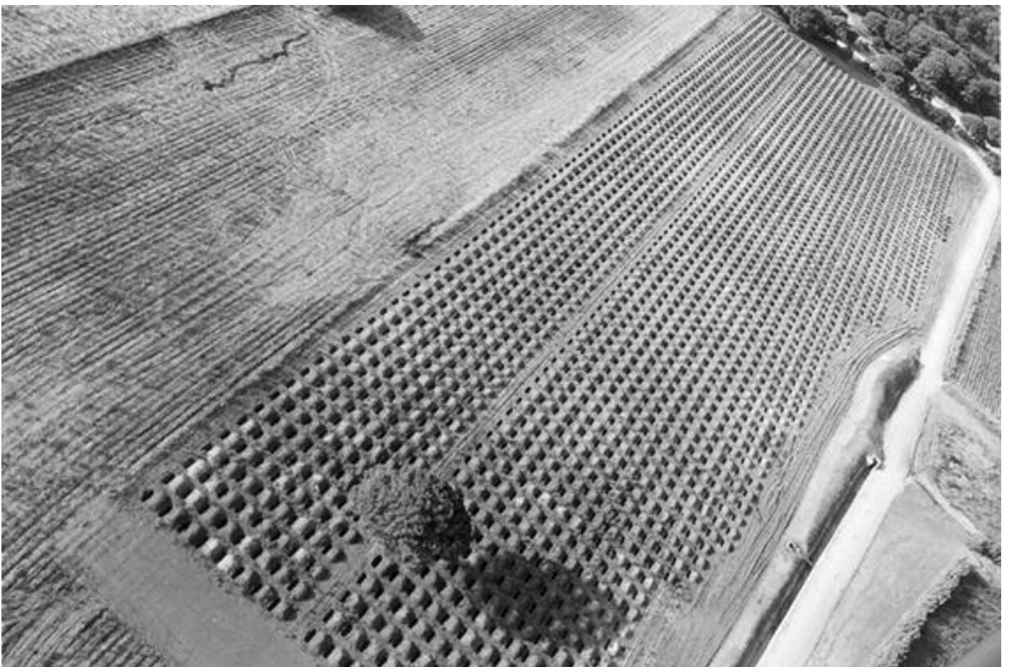
Santiago Serra, 3000 buchi ciascuno di 180x50x50 cm, luglio 2002, Cadiz Spagna.

Se un museo mi contatta per chiedere un nuovo lavoro o per mostrarne uno già fatto è perché c'è una certa complicità. Il museo conserva ed espone ciò che la società apprezza di più, o almeno è così in teoria. Naturalmente questa è solo verbosità. Infine, sono musei privati o pubblici, dove le decisioni vengono prese a titolo personale e per scopi curricolari. Quindi, alla fine tutto dipende da persone specifiche con atteggiamenti diversi nei confronti della vita e dell'arte. Quindi ho avuto esperienze di ogni tipo. Ho avuto difficoltà a lavorare in alcuni musei e in altri tutto è andato molto meglio di quanto mi aspettassi. Non ho un'opinione fissa sui musei. Dipende da chi c'è dentro. Questo può essere estrapolato in centri sociali autogestiti. Puoi trovare persone che collaborano con te nell'esercizio della tua libertà di artista e puoi trovare il contrario, gli ortodossi deliranti dell'eterodossia. Nella mia esperienza di artista so con certezza come andranno le cose solo se lavoro con persone di cui mi fido completamente, e nemmeno al cento per cento. Ogni nuova esperienza è imprevedibile a priori.