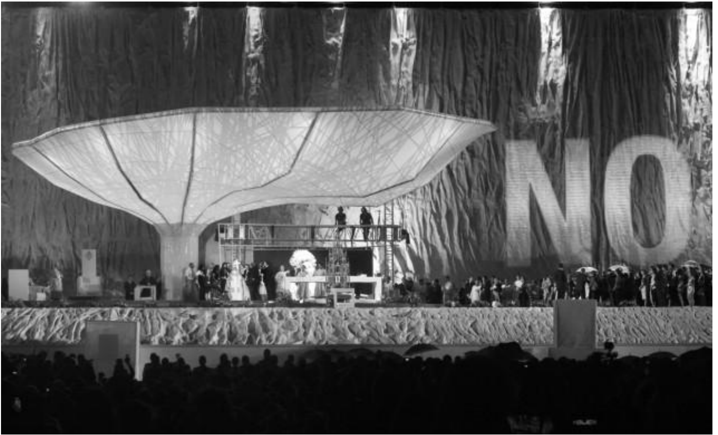
Santiago Serra, No proiettato sopra il Papa, 18 luglio 2009.

Sierra si interroga sulla questione della responsabilità, si confronta con la sfida di legittimare la pratica artistica dentro e contro la logica capitalista che la sostiene, coinvolge le istituzioni come parti attive nel controverso e ambiguo meccanismo. Mette in scena le iniquità socio-economiche direttamente dentro gli spazi deputati del museo e della galleria, rendendo responsabili in tempo reale anche gli spettatori. Nel 2001, a Zurigo, nel 2002, a New York, nel 2010 a Brisbane, e nel 2016 alla König Galerie di Berlino, con Forma di 600 x 57 x 52 cm costruita per essere sostenuta perpendicolarmente a una parete l'artista rievoca il tema della crocifissione, concentrandosi sul senso della materialità nella religione contemporanea, attraverso una performance, in cui un parallelepipedo viene sollevato e sostenuto orizzontalmente dalle spalle di due persone, retribuite con un salario minimo per la loro prestazione. In questa performance, Sierra intende i lavoratori come una sorta di incarnazione moderna di Cristo, dove il parallelepipedo rimanda a un braccio della croce e l'azione appare fredda e disincantata, per mostrare che nella situazione economica attuale il corpo è diventato una merce qualunque, disponibile e in vendita a basso costo.