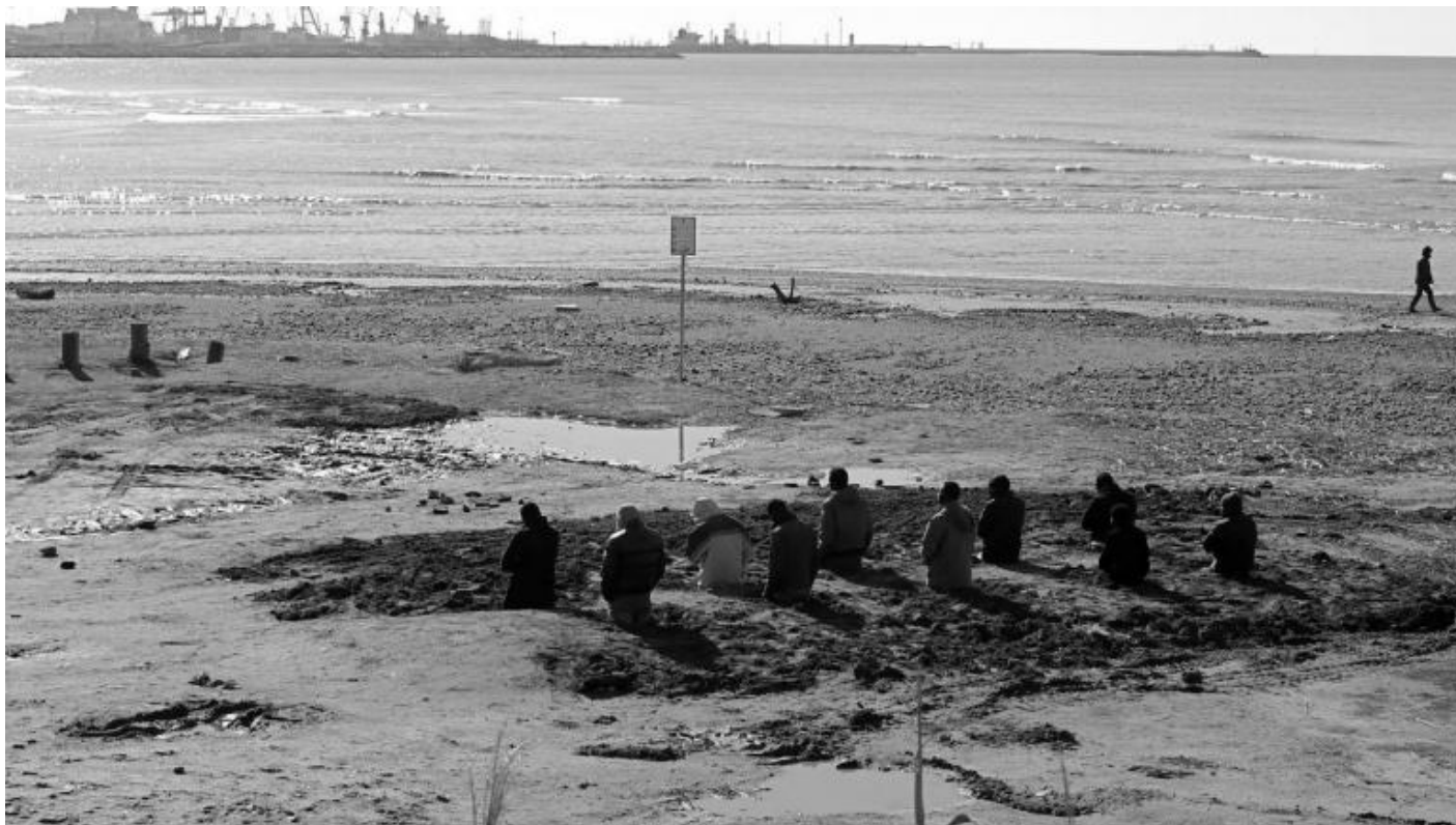
Santiago Serra, Sepoltura di dieci operai, 2010.

Forse non è l'ambiguità che uso. Non mi piace l'uso universale obbligatorio del lieto fine per chiudere concettualmente una proposta artistica. Si può dire qualsiasi cosa, ma non bisogna dimenticare che il lieto fine può invalidare qualsiasi proposta. Lavoro per un pubblico intelligente, a cui non voglio fare il lavaggio del cervello. Questo fa sì che il mio lavoro ponga problemi irrisolti, aperti al pensiero in libertà. Non la chiamerei ambiguità. Non so nemmeno se sono chiamate all'azione, ma ognuno è libero di agire o non agire. La mia impressione è che il pubblico porti già questa decisione da casa sua, prima di vedere il mio lavoro. Non voglio dire a nessuno cosa dovrebbe o non dovrebbe fare.