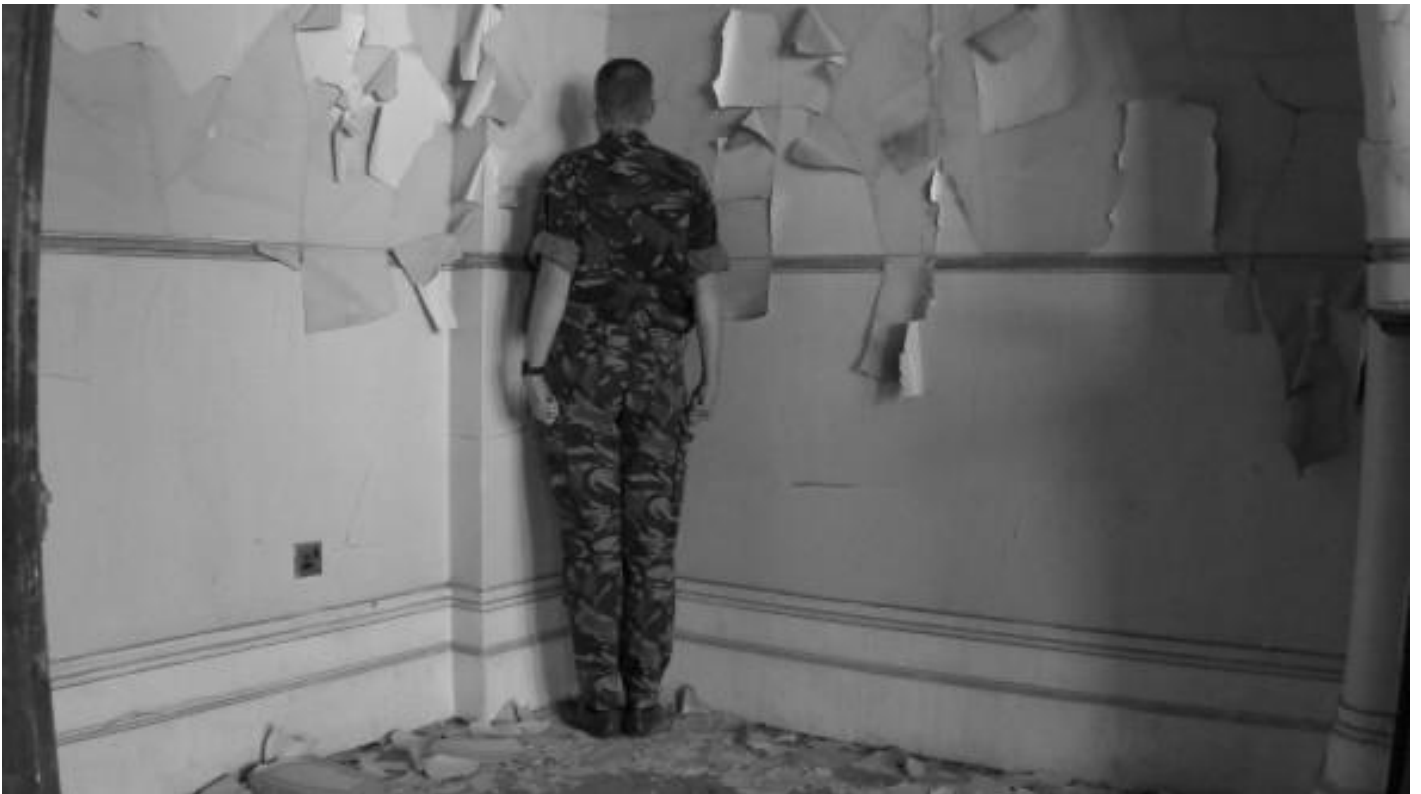
Santiago Serra, Veterani con il viso rivolto verso il muro, 2011/2015.

La Chiesa cattolica e la sua influenza è dovuta alle sue tecniche magistrali e brillanti di dominazione sociale e di accumulazione capitalistica. Sono veri saggi del male. Nulla li supera in Occidente.