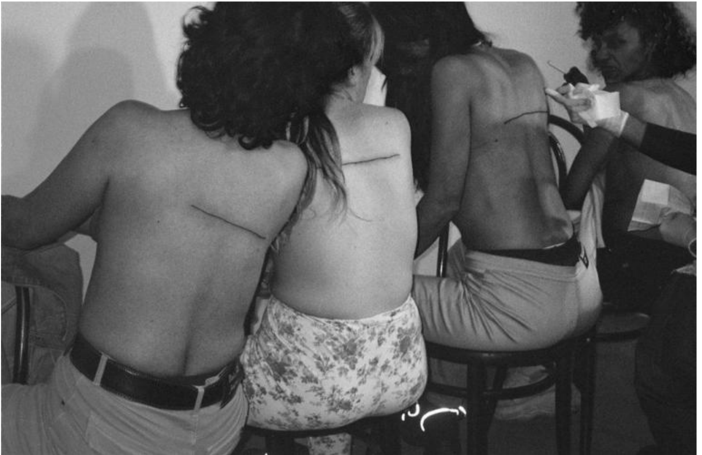
Santiago Serra, Riga di 160 cm tatuata su quattro persone, 2000.

Anche nella serie dedicata ai veterani di guerra, inaugurata a Berlino nel 2011, i soldati sono considerati come anonime cifre diffuse dai media, vittime dei governi, che li sfruttano per raggiungere i propri obiettivi politici ed economici. Esempio è anche Sepoltura di dieci operai (2010): a Livorno l'artista convoca dieci lavoratori senegalesi e in cambio di una somma di denaro li convince a essere sepolti sul lungomare del Calambrone, in modo che rimanga visibile solo la testa. Spesso nei lavori dell'artista spagnolo sono coinvolte persone appartenenti alle fasce più povere ed emarginate della società, che vendono il loro tempo e il loro corpo, all'interno di una messa in scena delle attività economiche regolate da un sistema contrattuale, dove gli individui vengono retribuiti per svolgere una determinata azione, perlopiù inutile o con scarso valore. Le sue opere sono al contempo accusate al sistema neoliberista e merci con un plusvalore ratificato da prestigiose istituzioni culturali e monetizzato da importanti e ricche gallerie internazionali. In occasione della conferenza Latest Works al MACRO ASILO di Roma (10 settembre 2019), abbiamo incontrato Santiago Sierra per porgli alcune domande.