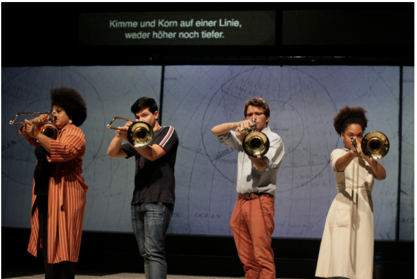
Rimini Protokoll, Granma.

L'atto del guardare – non solo a teatro, ma anche di fronte alle immagini che compongono il nostro quotidiano flusso mediale – diventa così il cuore di un'indagine che ne riafferma da un lato il pericolo, dall'altro il profondo valore politico.