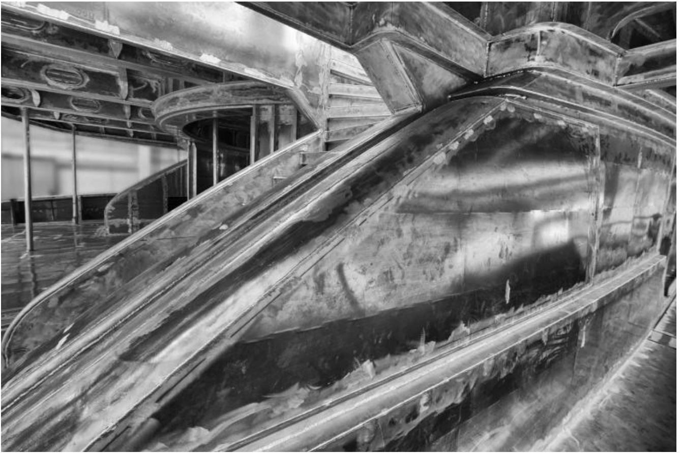
San Lorenzo, Metal Superyachts production.