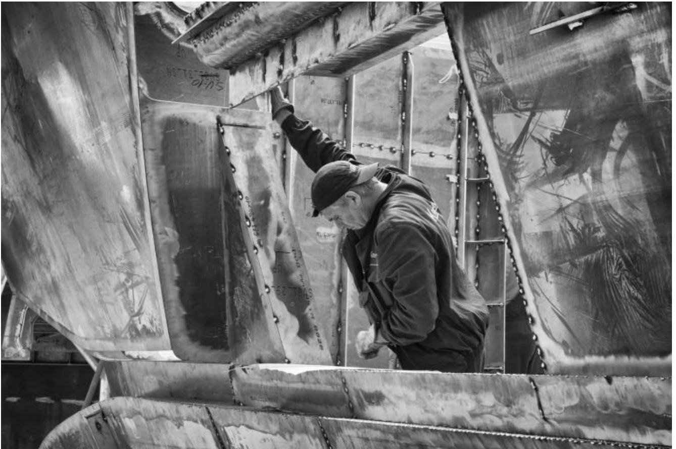
San Lorenzo, Metal Superyachts production.