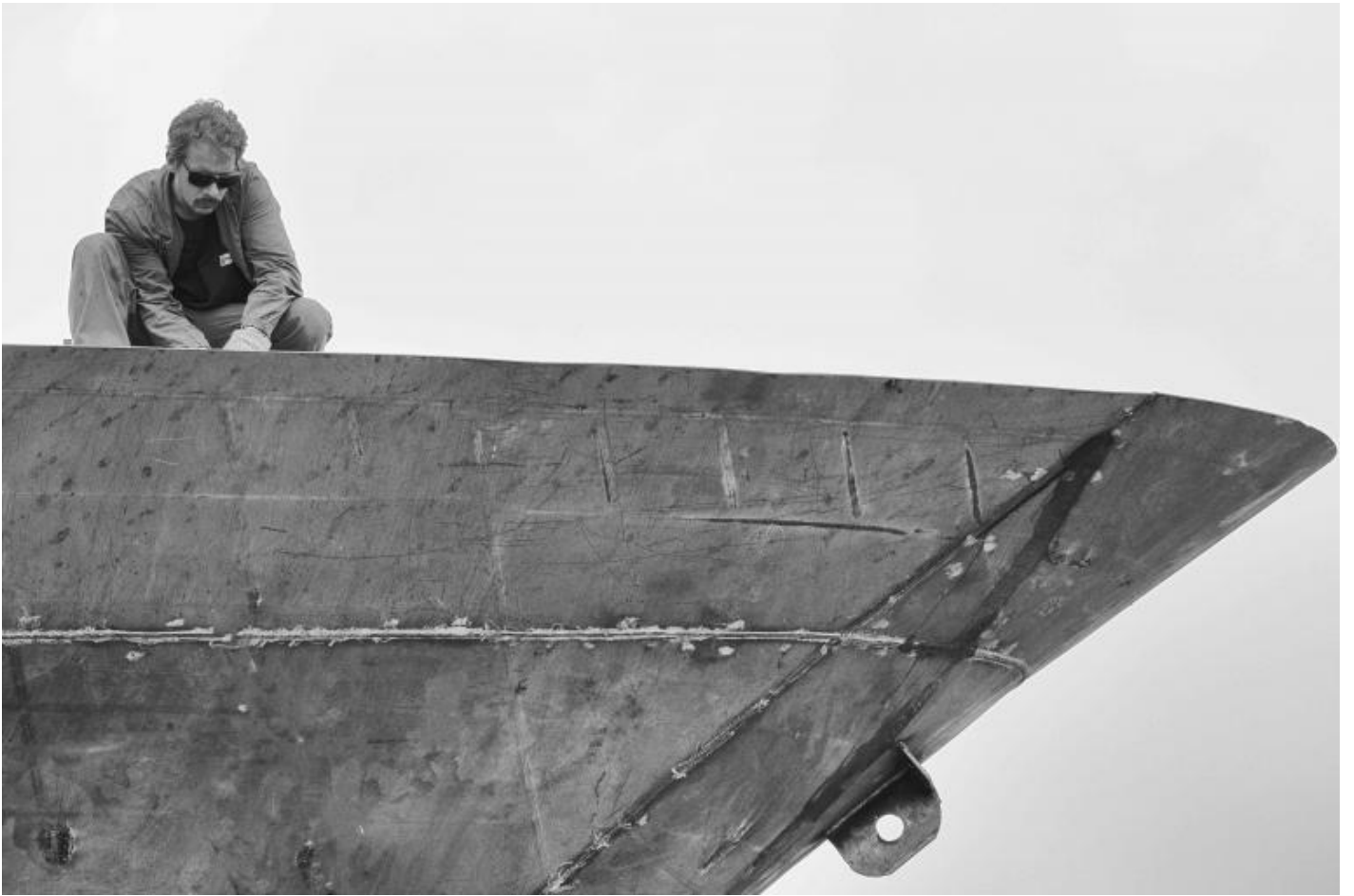
San Lorenzo, Metal Superyachts production.