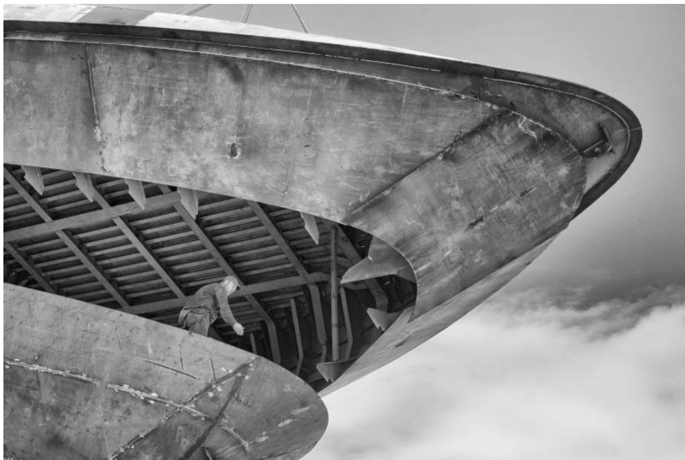
San Lorenzo, Metal Superyachts production.

La prua della nave come il muso di un pescecane a bocca spalancata, la carena simile a un oggetto spaziale da issare sulla rampa di lancio, una finestrella verticale che ricorda un quadro di Fontana, un elemento triangolare sospeso nel vuoto simile a una scultura dell'arte povera, l'elica come un vortice futurista al fermo immagine. Si potrebbe continuare descrivendo altre immagini che le fotografie rigorosamente in bianco e nero di Silvano Pupella evocano nello spettatore della mostra ai Tre Oci di Venezia, Naviganti. Un viaggio dentro i cantieri San Lorenzo (Grand Hotel de la Ville, Parma, dal 22 maggio all'8 ottobre 2023). Questo lavoro rigoroso e ricco d'evocazioni richiama analoghe opere che hanno documentato il lavoro umano negli anni Cinquanta e Sessanta, quando la modernità italiana stava affermandosi e la descrizione del connubio uomo-macchina era un tema consueto.