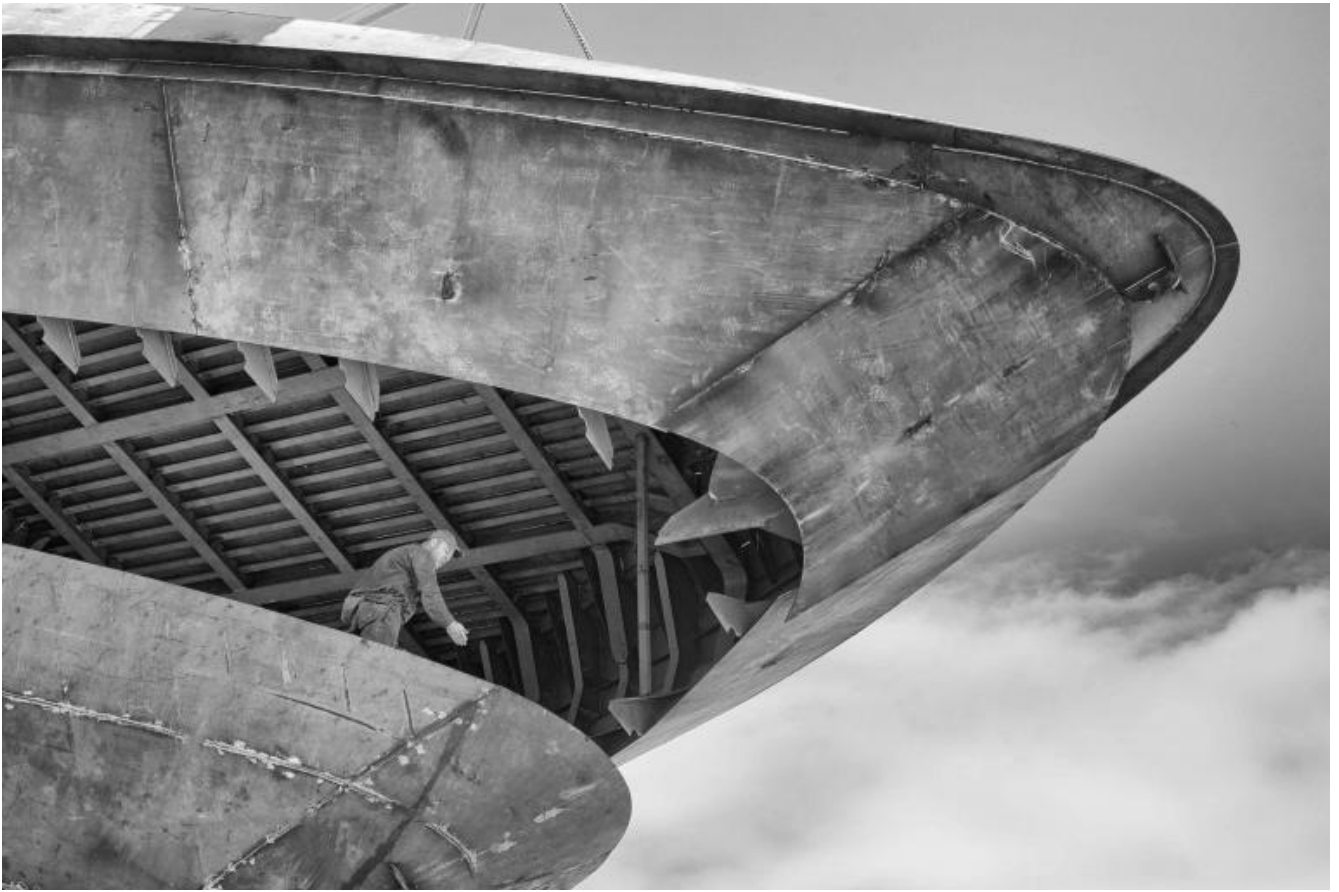
San Lorenzo, Metal Superyachts production.