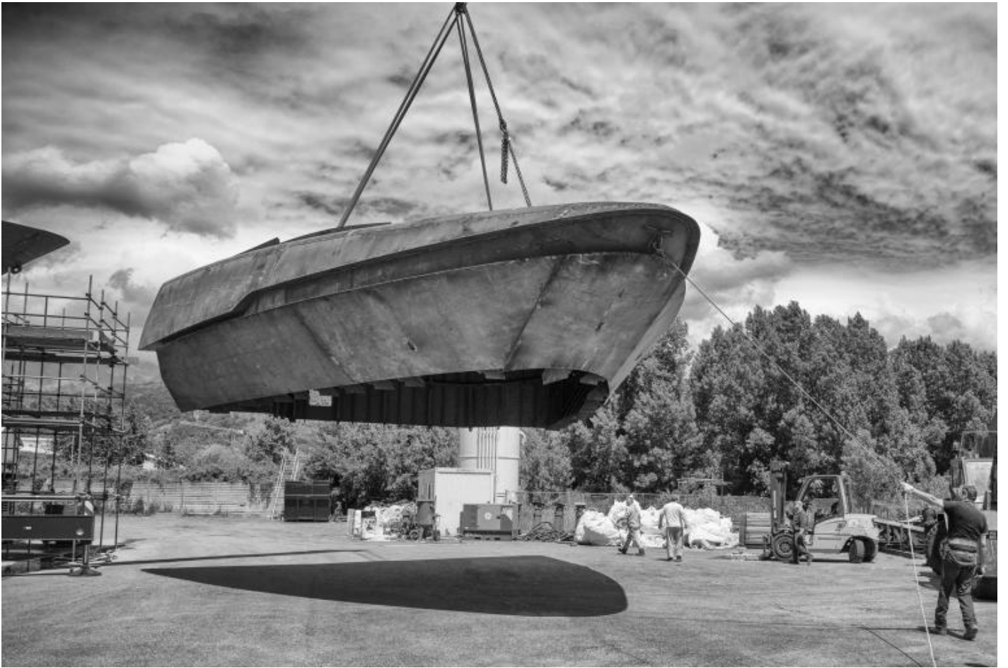
San Lorenzo, Metal Superyachts production.