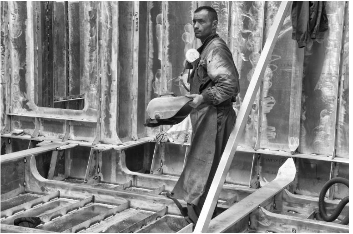
San Lorenzo, Metal Superyachts production.