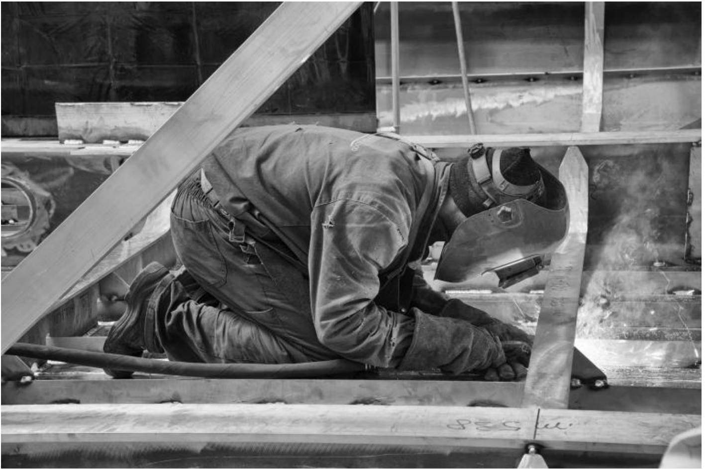
San Lorenzo, Metal Superyachts production.