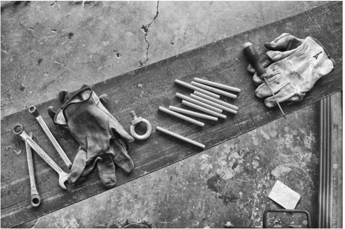
San Lorenzo, Metal Superyachts production.