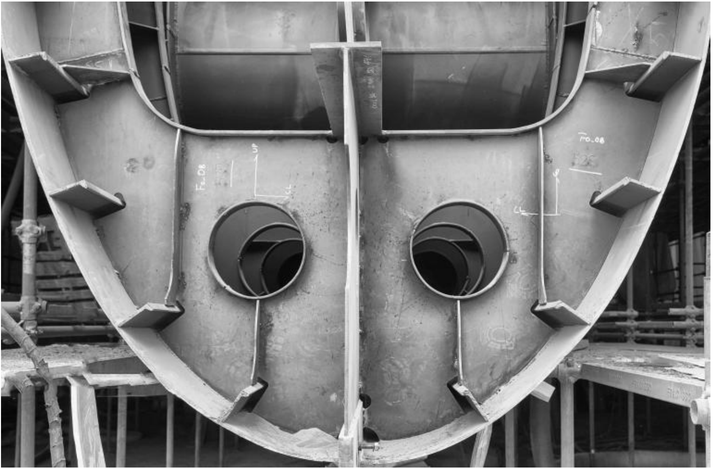
San Lorenzo, Metal Superyachts production.

La drammaticità implicita nel suo sguardo si coglie perfettamente nel momento in cui lo scafo, non ancora leggibile come tale, viene issato mediante una gru subito dopo lo scatenarsi di un temporale. Le nuvole accentuano la forza caotica del momento. La loro forma imprevedibile e cangiante si oppone alla forma definita e tozza dell'oggetto. Ma è il minuscolo uomo che dà il senso delle proporzioni dell'azione: alza la mano, come per indicare la direzione in cui spostare il grande sospeso. Appare piccolissimo sul piazzale del cantiere. Sopra di lui, immenso, si svolge il conflitto di aria e nuvole; sul piazzale la pioggia ha lasciato la propria traccia nelle pozze sparse. Il braccio della gru partisce così lo spazio dell'immagine come se il segno verticale fosse un asse del mondo, che si protende verso il cielo senza tuttavia raggiungerlo. Lavoro di formiche che manovrano oggetti immensi, li issano e li modificano con le proprie mani. Tutto è a misura d'uomo e tutto, per necessità, lo trascende.