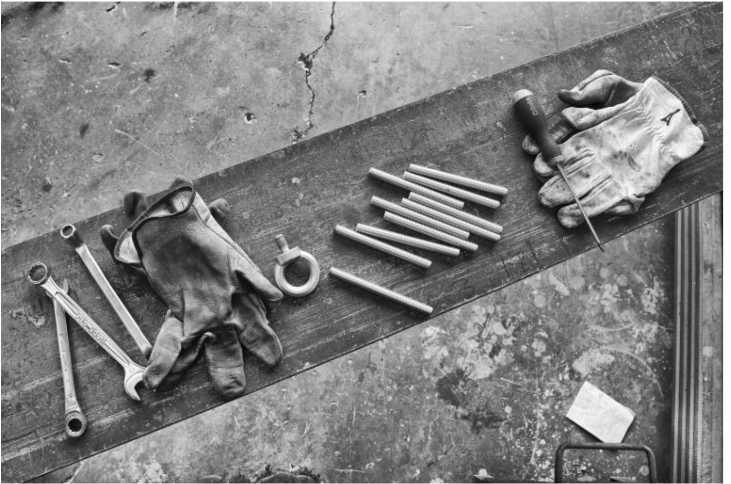
San Lorenzo, Metal Superyachts production.