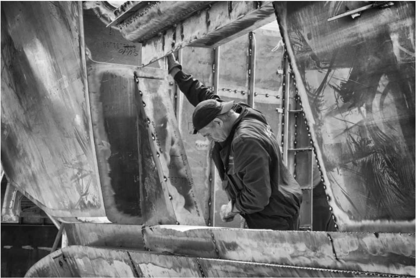
San Lorenzo, Metal Superyachts production.