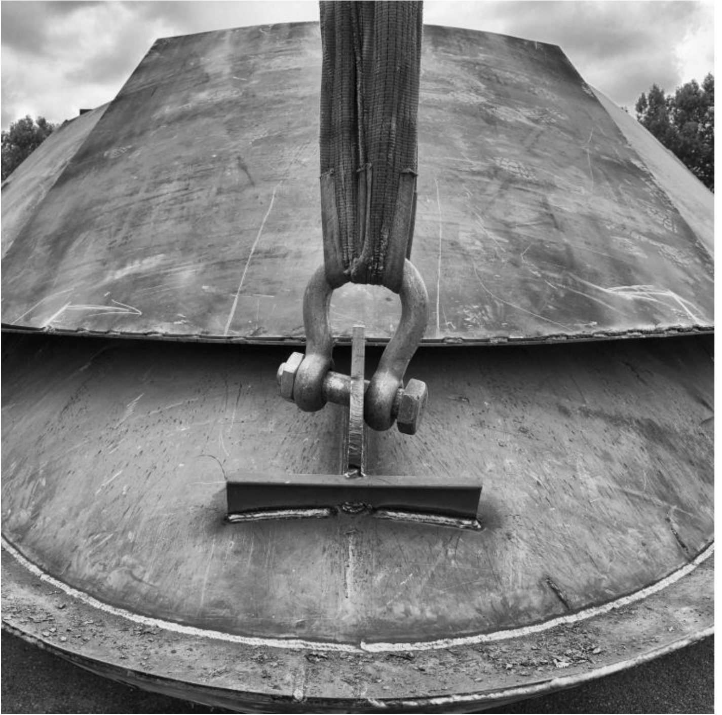
San Lorenzo, Metal Superyachts production.