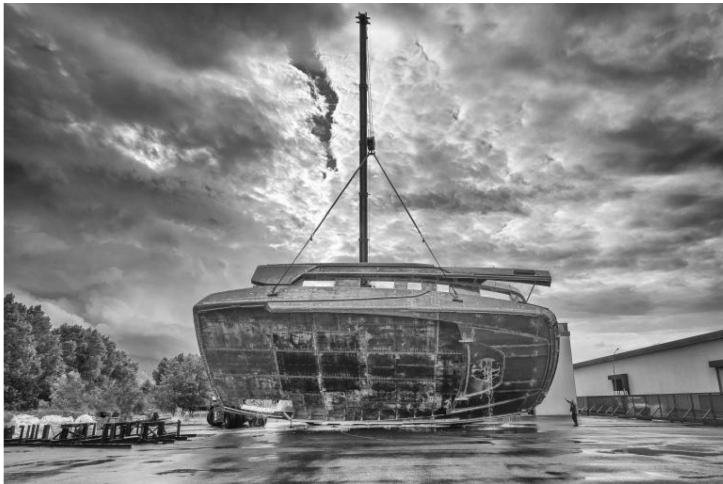
San Lorenzo, Metal Superyachts production.