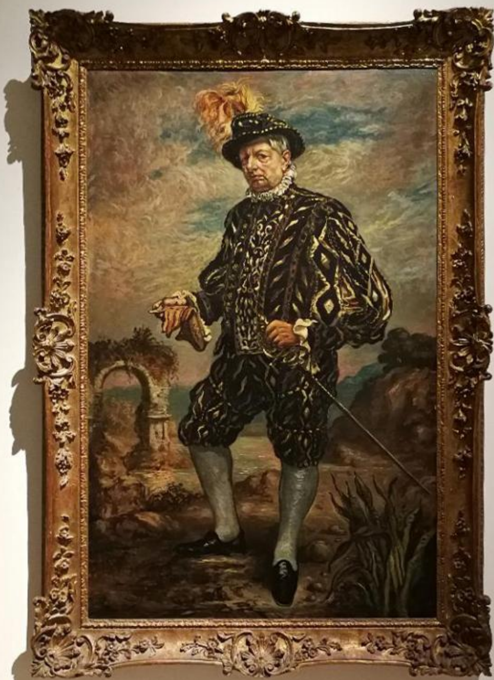
Acting as a man in black costume Self-Portrait in Black Costume 1640

Oil on canvas, 148 x 107 cm Brno, Gallerie Nazionale d'Arte Moderna