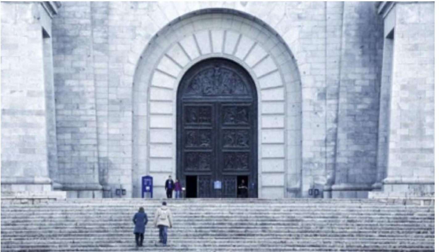
L'unico ingresso alla basilica.