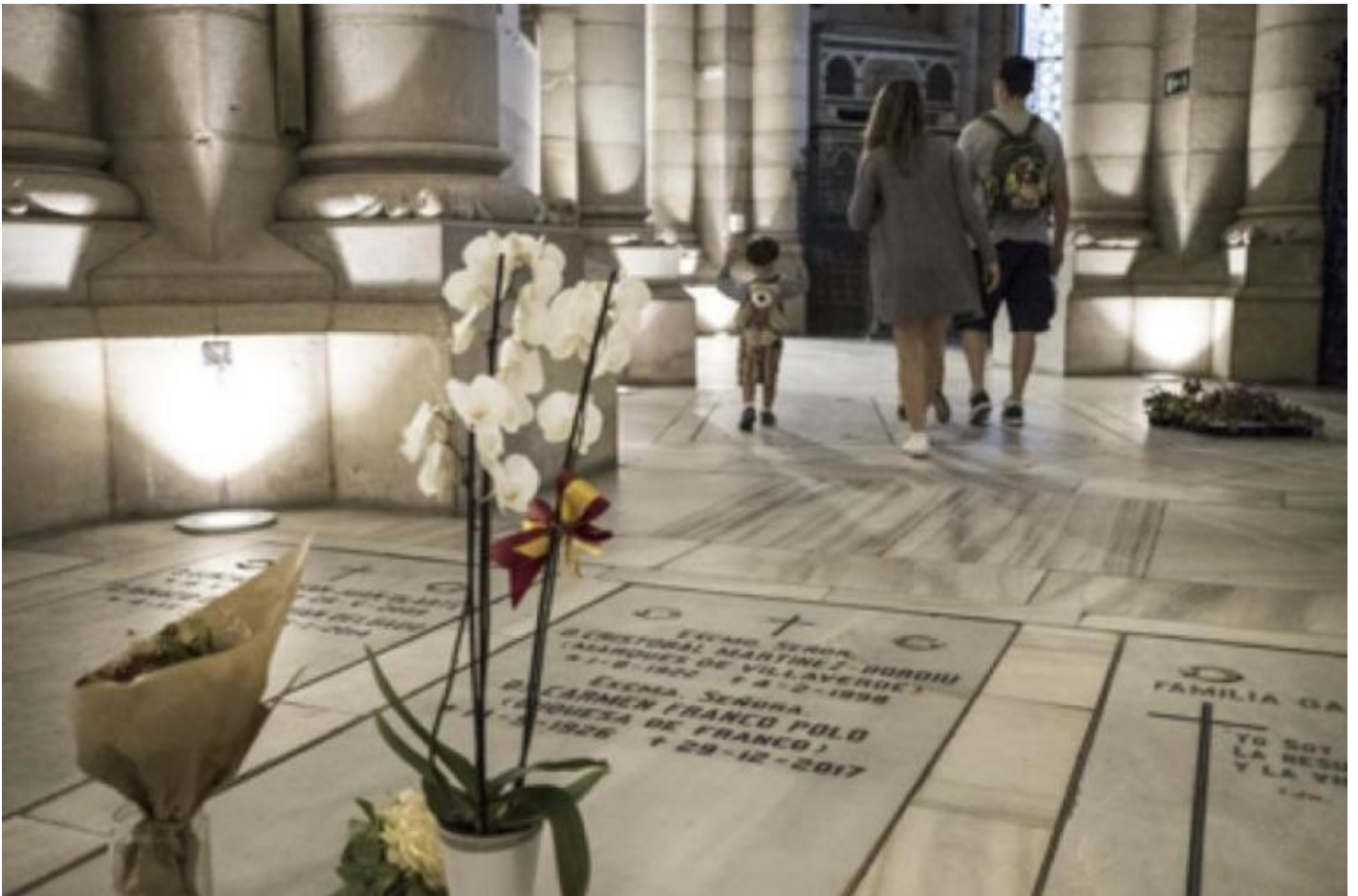
Tomba della figlia di Franco, vicino alla porta d'ingresso della cripta della cattedrale di Madrid.

La chiesa cattolica si è comportata inizialmente in modo ambiguo, non volendo immischiarsi, ma quando ha visto che l'abate della basilica, di passato falangista, sfidava illegalmente gli ordini del Tribunale Supremo rifiutandosi di aprire la porta agli inviati del governo, lo ha esautorato. In questa mancanza di determinazione, la chiesa aveva dichiarato di non voler ostacolare il desiderio della famiglia che voleva portare Franco alla cattedrale di Madrid, con la giustificazione che nella cripta è seppellita la figlia del dittatore.