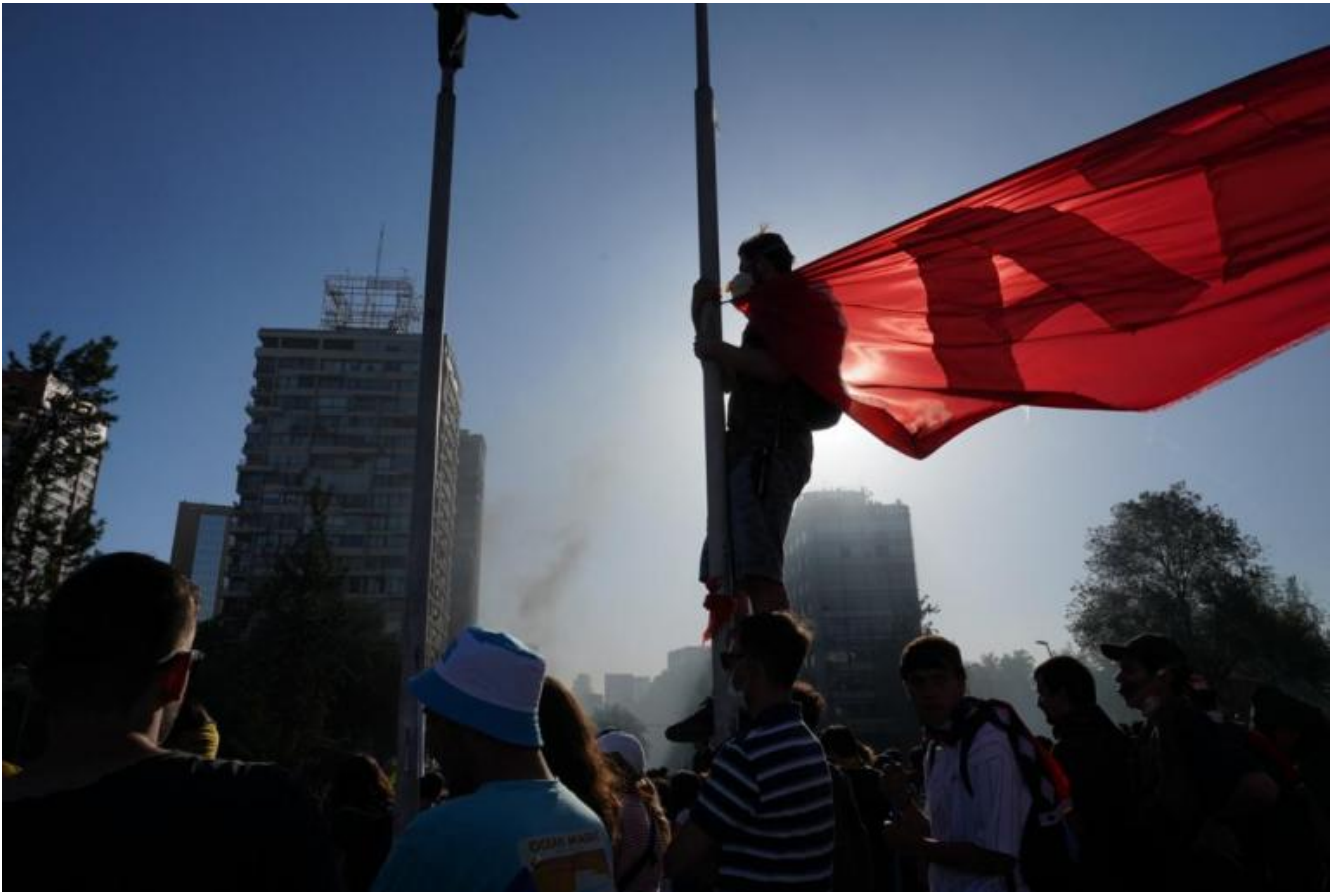
Alameda, @Javier Godoy Fajardo

Nel Cile privatizzato da Pinochet e appena modificato dei governi democratici, le differenze di classe sono drammatiche e l'ascensore sociale ha perso credibilità. Tutto è privato, tutto costa e tanto, istruzione e salute. Le scuole private sono carissime, quelle pubbliche offrono una preparazione scarsa che non garantisce il punteggio minimo necessario per accedere alle università, tutte a pagamento e che si dividono in due gruppi: quelle sovvenzionate e statali in cui occorre oltre alla retta anche il punteggio alto e quelle private a scopo di lucro in cui basta pagare e che assicurano in genere una preparazione scadente e un titolo che vale poco in cambio di rette per cui le famiglie si indebitano. Per inciso: il costo di una università parte da 3.500 dollari all'anno, ma per quelle più prestigiose come la Universidad Católica si arriva a mille dollari al mese.