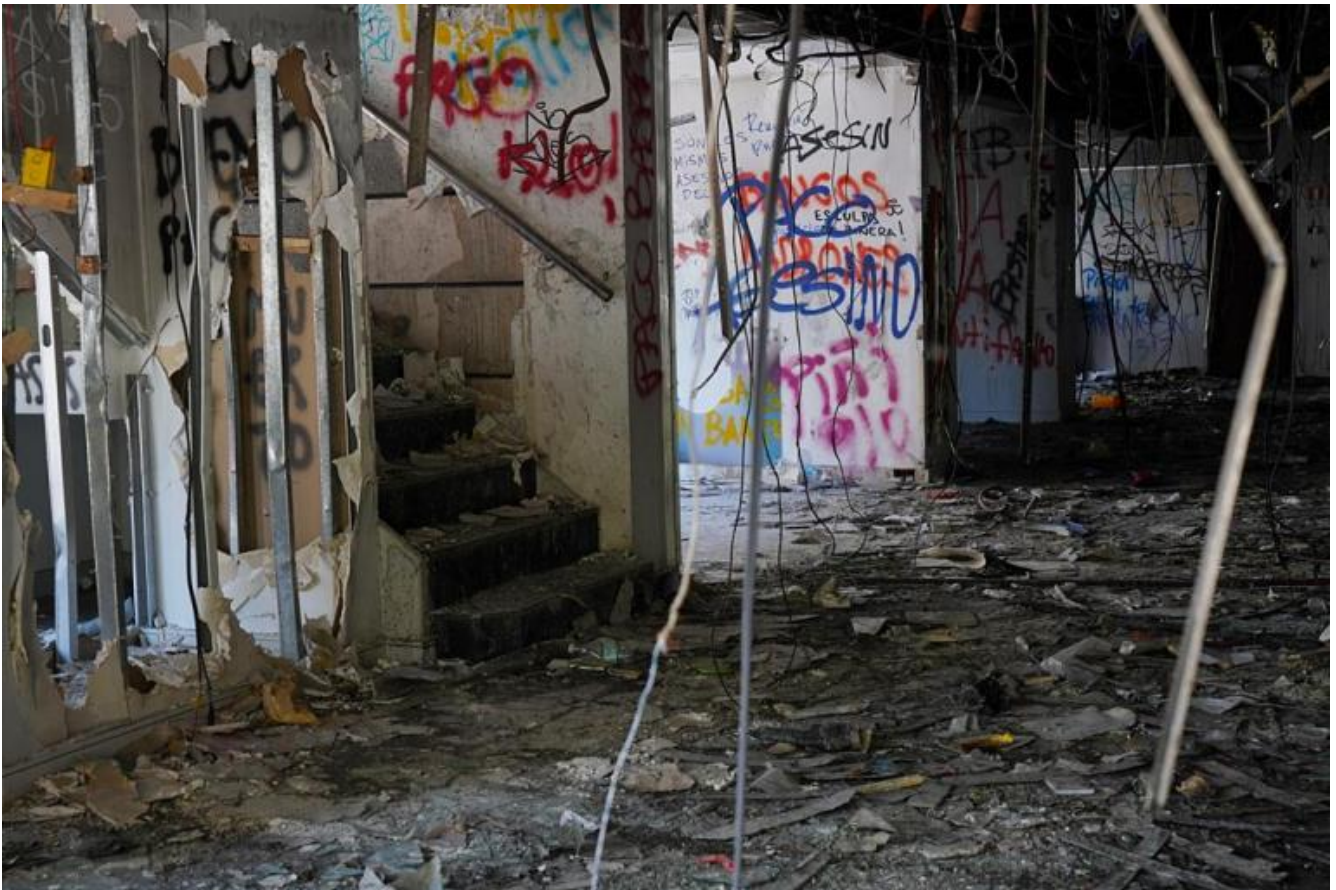
Banco Santander, distrutto