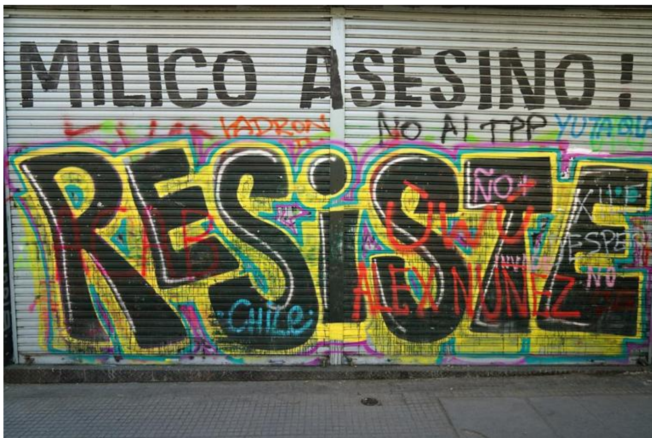
@Javier Godoy Fajardo

Negli ultimi anni il prezzo di un appartamento è aumentato del 150 per cento, contro un aumento degli stipendi di appena il venticinque. Il rincaro del biglietto è stato l'ultima goccia, poco prima era toccato alla bolletta della luce: il venti per cento in più che "generosamente" il presidente aveva scaglionato in due rate, anche se la seconda l'ha cancellata dopo le proteste. Accanto a indicatori macroeconomici sontuosi che solo negli ultimi anni si sono abbassati a causa della crisi globale, il Cile ha un record scoraggiante per le diseguaglianze, le più alte al mondo. A detenere gran parte delle ricchezze sono un pugno di famiglie, il resto è classe media sempre più compressa verso il basso e classi popolari che solo raramente sono tecnicamente povere, visto che il tasso di povertà si è abbassato dal trenta per cento del Duemila al sette per cento del 2017. Non ci sono favelas in Cile, né villas miseria, c'è solo una percentuale immensa della popolazione che arranca con fatica e reclama una vita decorosa e senza angosce che un paese ricco, con il 28 per cento del rame mondiale, dovrebbe garantire.