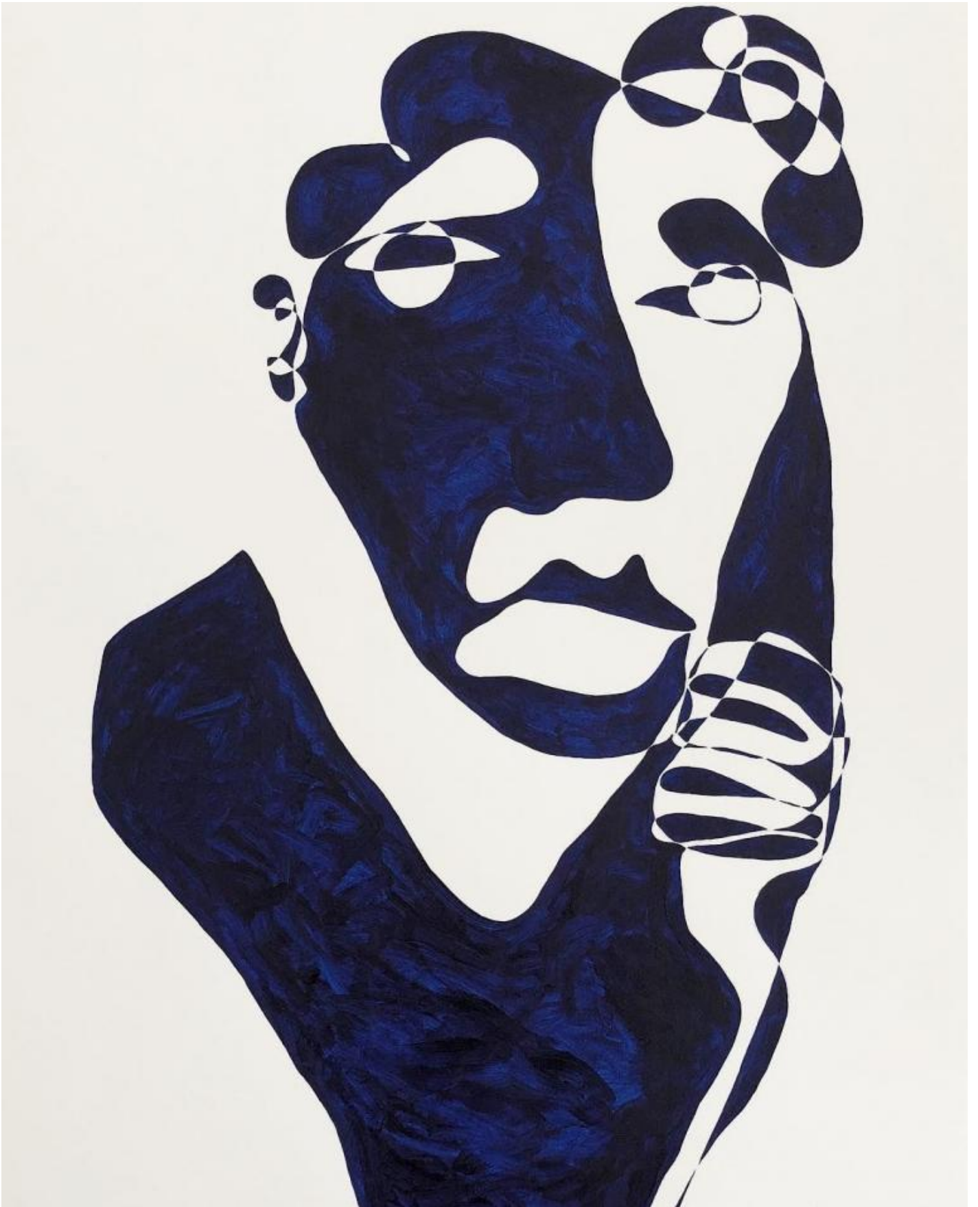
Opera di Christiane Spangberg.