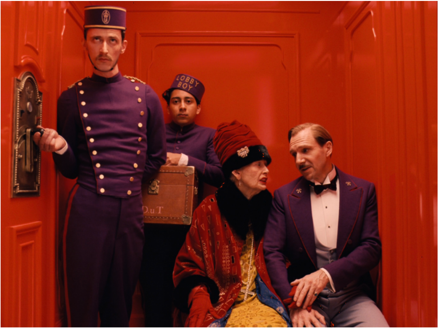
Grand Budapest Hotel (Wes Anderson, 2014).

Il fascino consolidato di questa eroica stagione rimasta nella memoria del Novecento come la più bella e scintillante, come la più teatrale, prova a parlarci ancora nel recente film omonimo tratto dalla serie e diretto da Michael Engler. Non è un film memorabile, forse non è nemmeno un film vero e proprio, ma, piuttosto, un omaggio al mondo raccontato dalla serie. È un lavoro piacevole, ma nulla di più: calligrafico, manieristico, privo di narrativa; soprattutto è un racconto a cui manca l'elemento più originale della serie. Aspettiamo di discuterne, però. Prima soffermiamoci sulla vicenda.