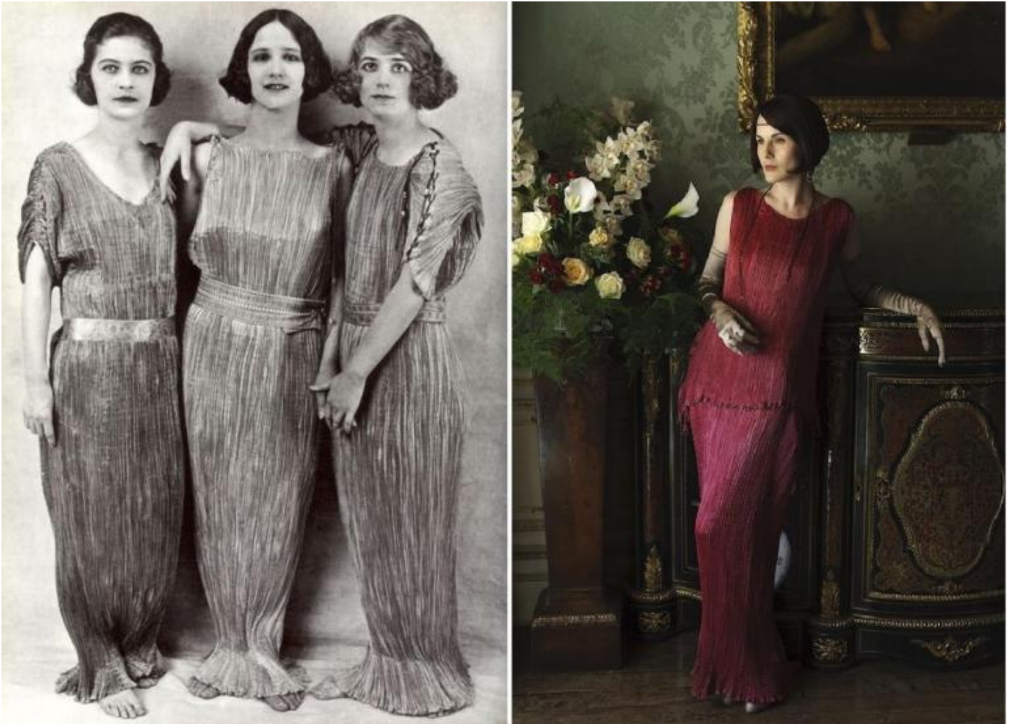
A sinistra: Le Isadorables, in un abito “Delphos”, ideato e realizzato da Mariano Fortuny; a destra: Michelle Dockery (Lady Mary) in Downton Abbey.

La storia può essere ricapitolata come una spettacolare avventura per il mantenimento di uno stato di cose e di privilegi che, sotto la minaccia del nuovo sistema di valori affermato dalla middle-class, dalla guerra e dalla modernità, sempre più sta diventando un mondo di ieri , un mondo perduto, e che a maggior ragione si cerca di trattenere: attraverso i codici delle belle maniere, i rituali della tavola, dei Balli, degli abiti, dell'intelligenza raffinata (come quella di Lady Violet) capace di mosse imprevedibili: