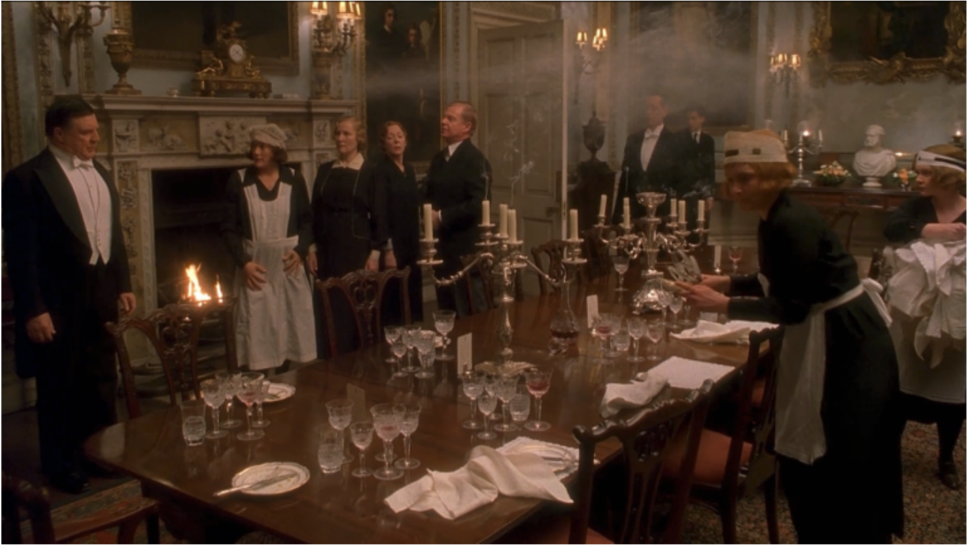
Gosford Park (Robert Altman, 2001).

Venticinque anni prima, un'altra serie tv inglese acclamatissima Upstairs Downstairs (mandata in onda tra il 1971 e il 1975) aveva raccontato, incrociandole, le vicende accadute tra il 1936 e il 1939 a una famiglia inglese e ai suoi domestici: