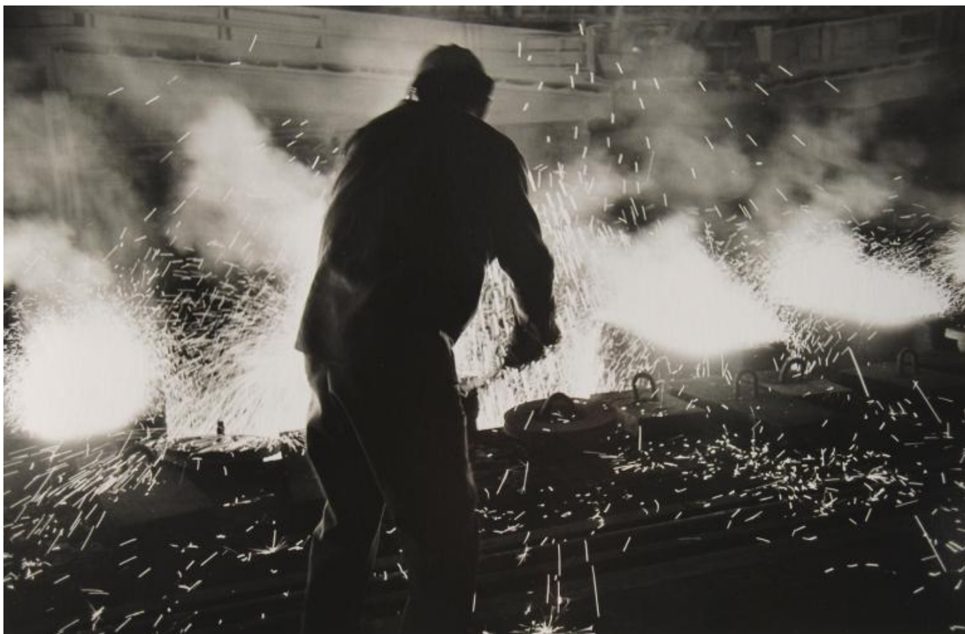
LISETTA CARMi - 2019.

Ben lo testimonia Lisetta Carmi, che nel restituire le immagini del porto di Genova e dello stabilimento dell'Italsider utilizza un linguaggio sperimentale, tra astrazione e documentazione. La mostra è accompagnata dal brano musicale di Luigi Nono che visita, con Lisetta Carmi, quegli stabilimenti nel 1964, ne registra i rumori e li pone alla base della sua composizione La fabbrica illuminata .