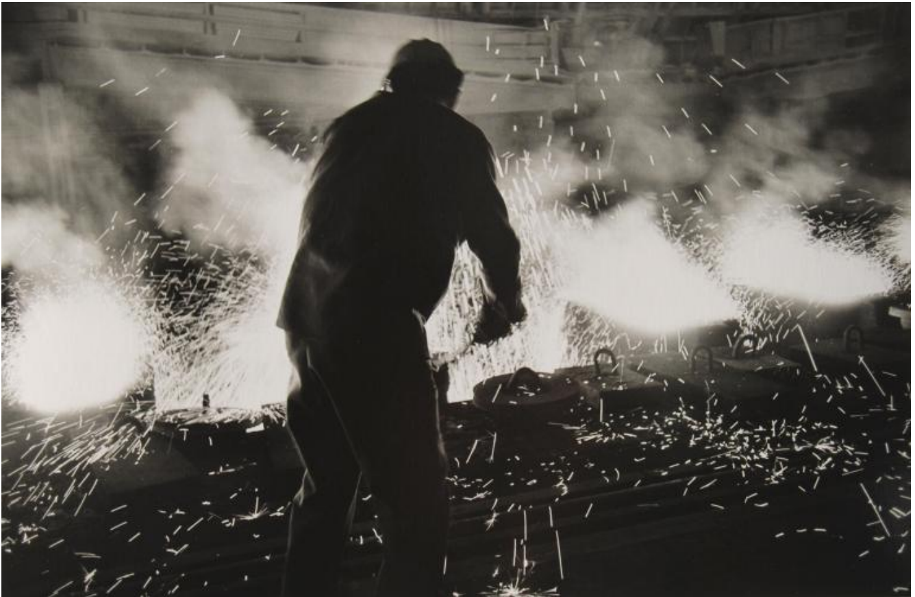
LISETTA CARMi - 2019.

Ben lo testimonia Lisetta Carmi, che nel restituire le immagini del porto di Genova e dello stabilimento dell'Italsider utilizza un linguaggio sperimentale, tra astrazione e documentazione. La mostra è accompagnata dal brano musicale di Luigi Nono che visita, con Lisetta Carmi, quegli stabilimenti nel 1964, ne registra i rumori e li pone alla base della sua composizione La fabbrica illuminata .