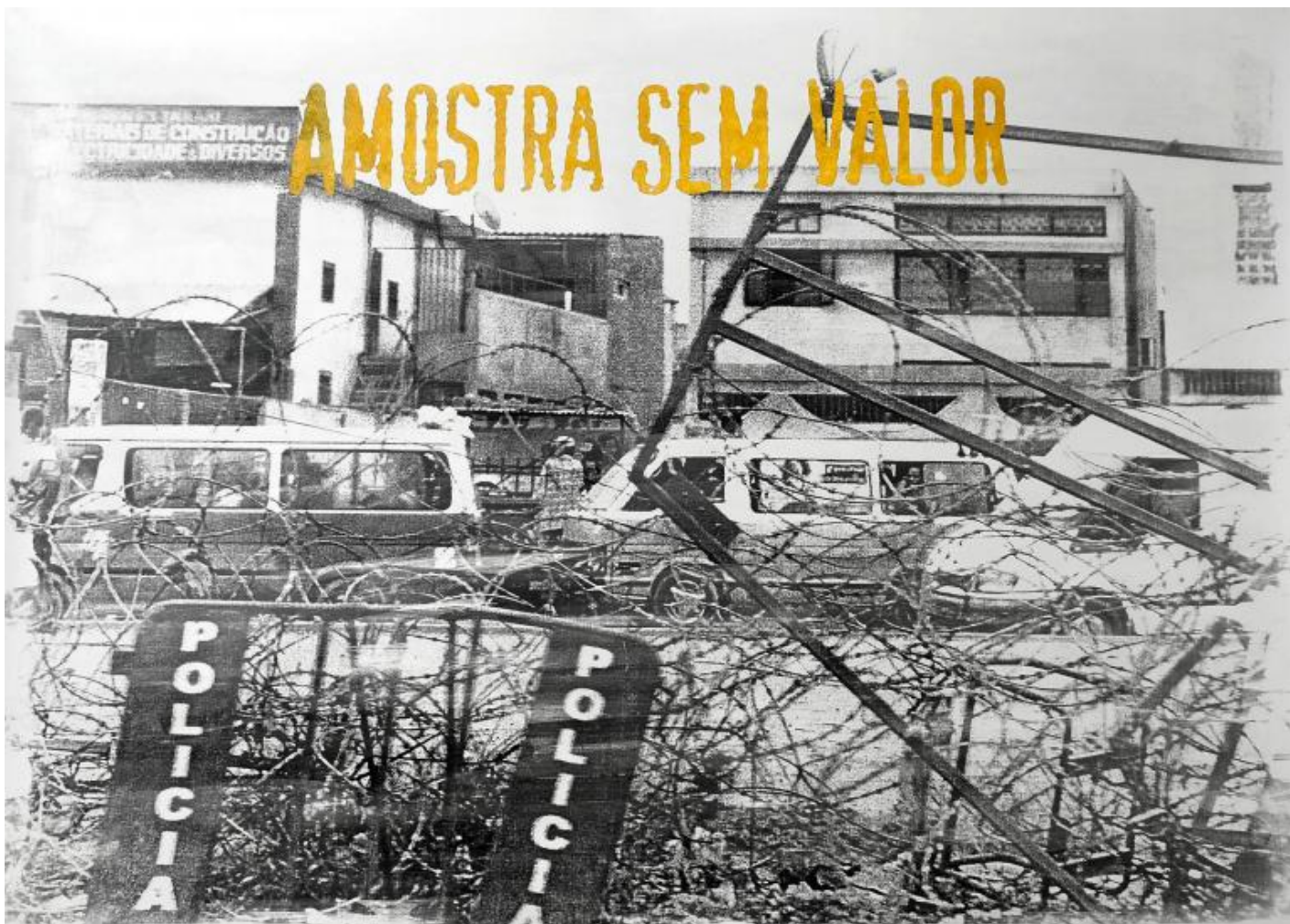
DÉLIO JASSE – Fondazione del Monte - Palazzo Paltroni Sem valor , 2019