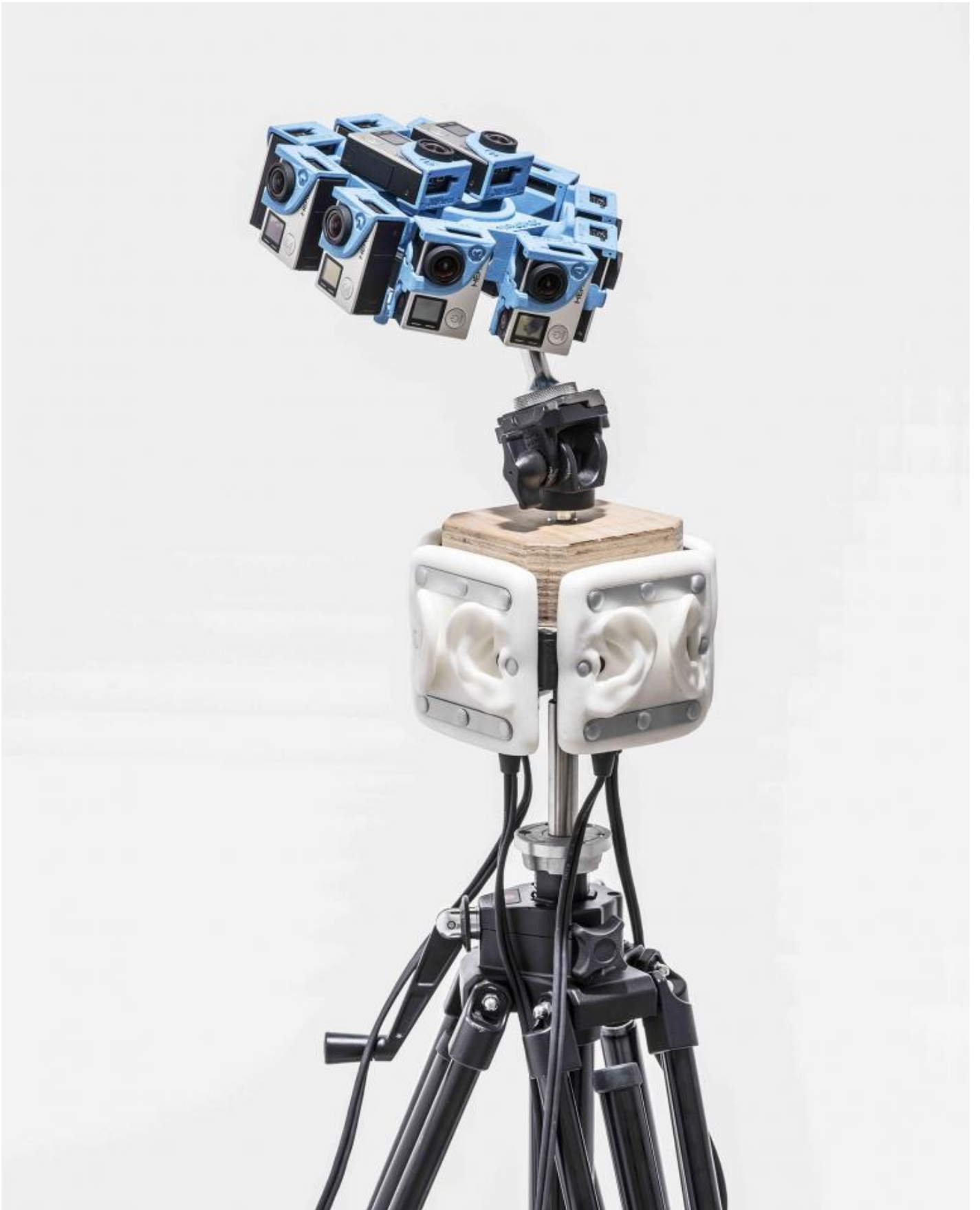
MATTHIEU GAFSOU – Palazzo Pepoli Campogrande 4.5.1 © Matthieu Gafsou / Galerie C / MAPS.