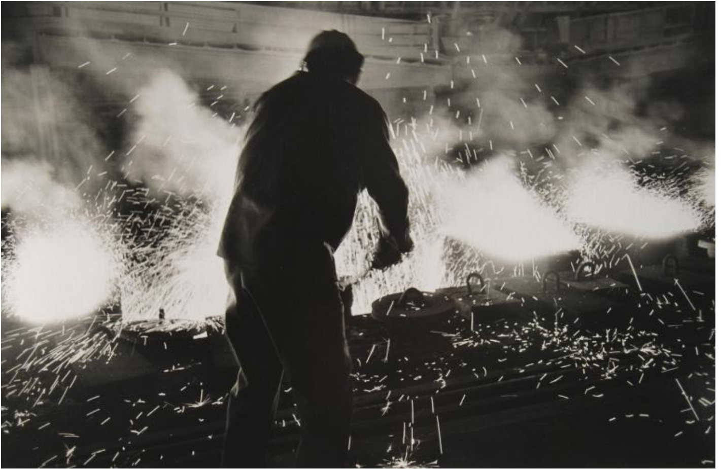
LISETTA CARMi - 2019.

Ben lo testimonia Lisetta Carmi, che nel restituire le immagini del porto di Genova e dello stabilimento dell'Italsider utilizza un linguaggio sperimentale, tra astrazione e documentazione. La mostra è accompagnata dal brano musicale di Luigi Nono che visita, con Lisetta Carmi, quegli stabilimenti nel 1964, ne registra i rumori e li pone alla base della sua composizione La fabbrica illuminata .