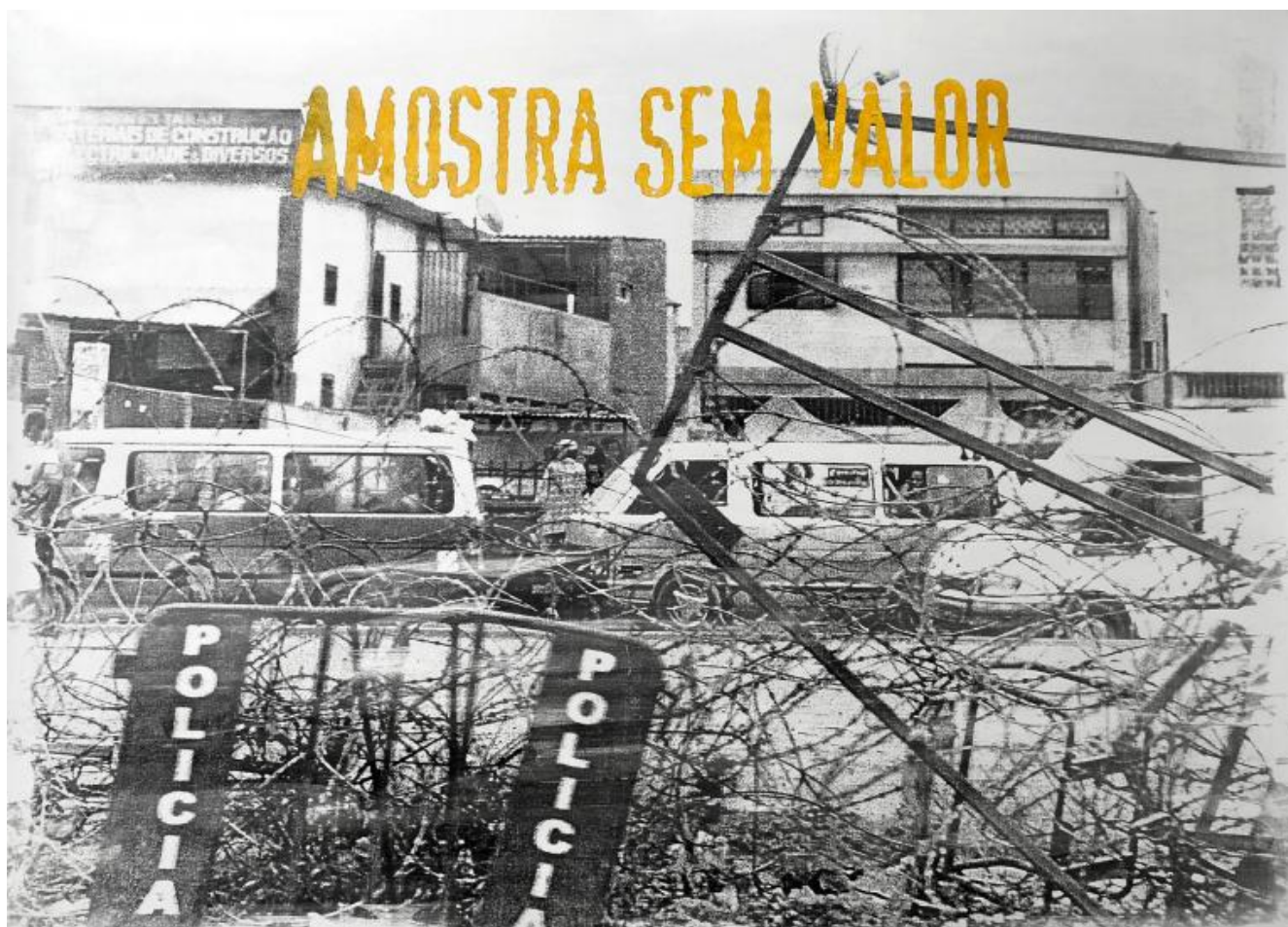
DÉLIO JASSE - Fondazione del Monte - Palazzo Paltroni Sem valor, 2019 © Délio Jasse. Courtesy of the artist and Tiwani Contemporary.

Matthieu Gafsou, H+ , di formazione filosofo, lavora sul concetto di Transumanesimo , spesso abbreviato con la sigla H+ . È un movimento che si dà come obiettivo quello di migliorare le performance cognitive, psichiche e fisiche dell'uomo attraverso l'utilizzo della scienza e della tecnologia. Il progetto costituisce una vasta ricerca su questo fenomeno, svolta all'interno di istituzioni scientifiche, laboratori e comunità in diversi paesi. A partire dalla capillare diffusione degli smartphone , che costituiscono ormai l'estensione del corpo di miliardi di individui, il lavoro documenta dispositivi e innovazioni che vanno dai supporti medici ( pacemaker , protesi, arti cibernetici) agli innesti di microchip , dai cibi sintetici alle strategie anti-invecchiamento. Immagini che sono affidate a un vero sistema di allestimento che sovrasta l'opera e che pare diventare il vero tema della mostra stessa e dove le opere diventano funzionali all'allestimento stesso. Appare quindi una deroga dell'autore che sposta l'attenzione del proprio messaggio all'allestimento, a volte a scapito della chiarezza, nel tentativo forse di superare la figura stessa del fotografo o del linguaggio fotografico. Il progetto si