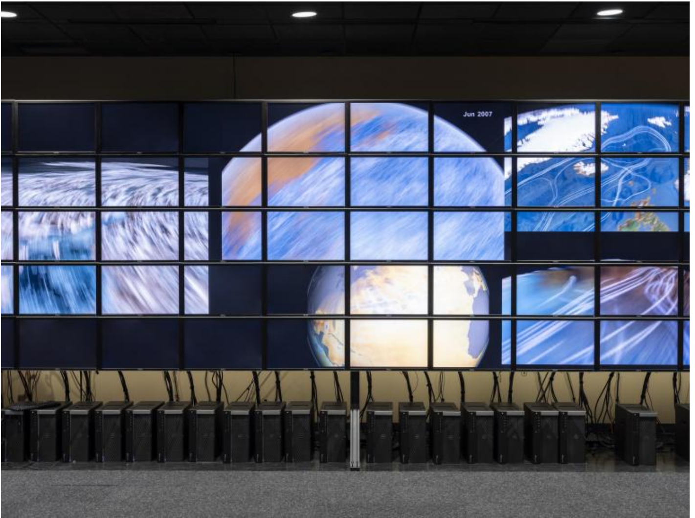
ARMIN LINKE – Biblioteca Universitaria di Bologna Università del Texas, Austin, sala di modellizzazione delle correnti oceaniche, Institute for Computational Engineering and Sciences (ICES) Computational Research in Ice and Oceans Group (CRIOS), Austin, Texas, USA, 2018 © Armin Linke 2018. Courtesy Galleria vistamare/ vistamarestudio, Pescara / Milan.