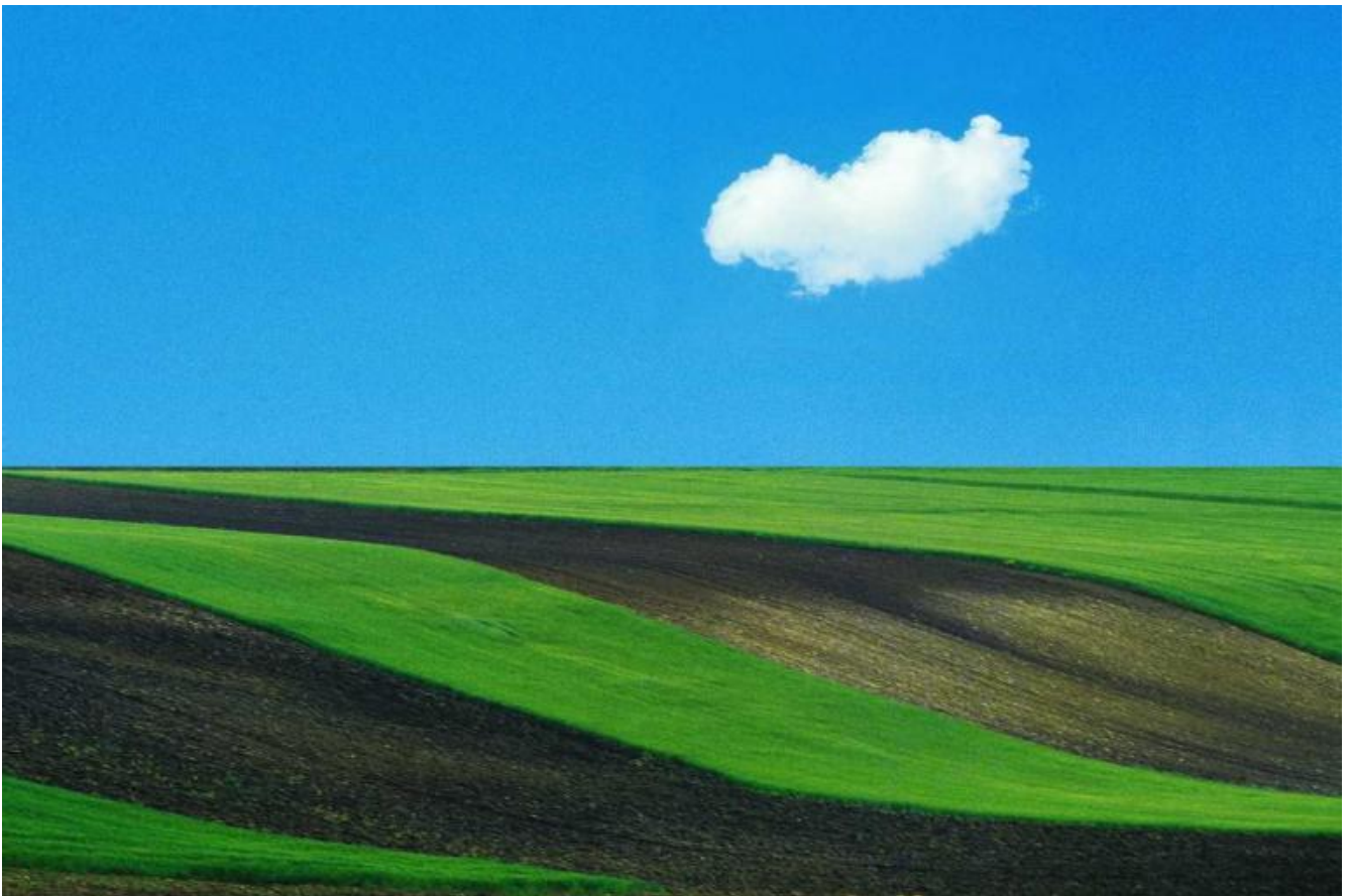
Opera di Franco Fontana.

Ho come l'impressione che ci sia un tempo tutto pronto alla poesia e i poeti siano clamorosamente impreparati. Per lungo tempo hanno atteso di essere interrogati. E ora che questo tempo è venuto non sanno cosa rispondere, vanno avanti con congegni verbali concepiti per un altro tempo e per un'altra umanità. Non sto dicendo che la poesia deve avere il passo dell'attualità. Sto dicendo semplicemente che oggi la poesia si trova nel cuore di chi legge più che nel cuore di chi scrive.