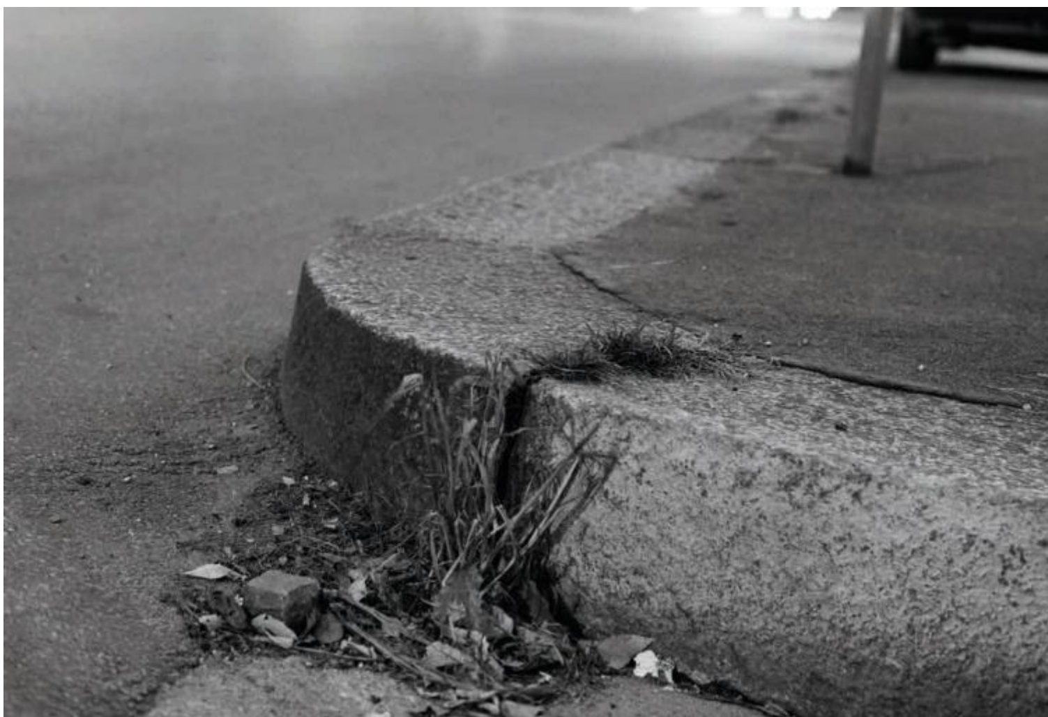
Con la coda dell'occhio , #23, 1993-94

Ma Marina Ballo Charmet disattende alla radice il presupposto di tale linearità («la sequenza , la ripetizione di fotografie di uno stesso soggetto, non ha per me un valore cinetico, né suggerisce una lettura da sinistra a destra, ma ha invece a che fare con una sorta di interruzione della narrazione»: Con la coda dell'occhio , p. 28). Le tre immagini – che riprendono persone sdraiate nell'erba a prendere il sole o a leggere il giornale, più lontano dei bambini che giocano coi loro genitori – hanno in comune gli stilemi cui il linguaggio dell'autrice ci ha abituato: il piano della composizione è s-centrato dall'abbassamento della prospettiva (sicché al centro dell'immagine non si trova il suo presunto “soggetto”, quello che ho appena descritto, bensì l'erba che si frappone fra esso e l'occhio della macchina) e la sua superficie è “macchiata” dal fuoco ondivago, che restituisce con precisione determinate parti del piano “allontanandone” altre in tratti più confusi.