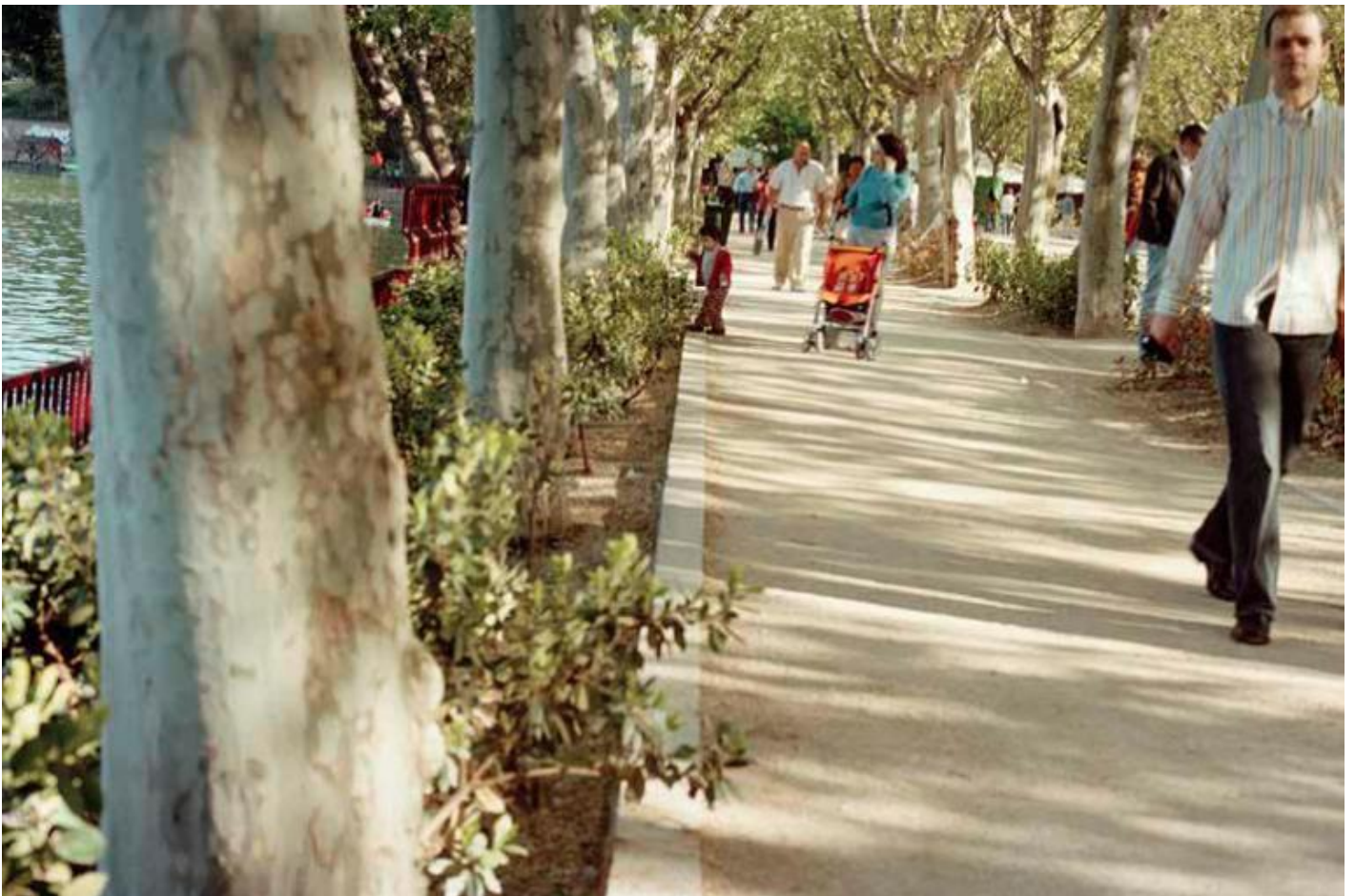
Il parco, Madrid, Casa de campo, 2008

Il frammento dal laboratorio della Cognizione del dolore s'intitola proprio Cui non risere parentes , ed è interessante che ogni volta che evoca questi versi-feticcio di Virgilio Gadda pensi pure alla figura proiettiva di Leopardi e alla sua aneddotica familiare (ci si metteva pure l'onomastica, a fargli proiettare la figura della propria madre anaffettiva, Adele Lehr, su quella per antonomasia anaffettiva – Gadda la chiama «a-genetica» e «castrante» – del canone letterario italiano, Adelaide Antici). Troppo capzioso, forse, sarebbe ricollegare l'anti-antropocentrismo di Leopardi – dalle Operette morali alla Ginestra – a questo mancato rispecchiamento materno, che su di lui proietta Gadda (eppure com'è noto definisce «matrigna», Leopardi, quella «natura» che nega all'essere umano l'abitarla in armonia).