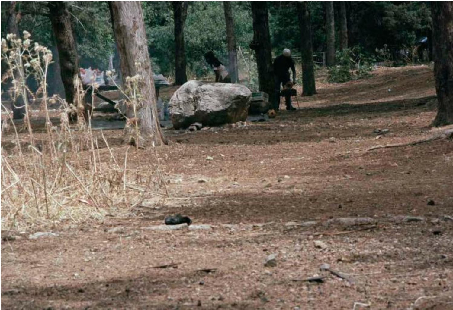
Il parco. Palermo, La Favorita, 2008