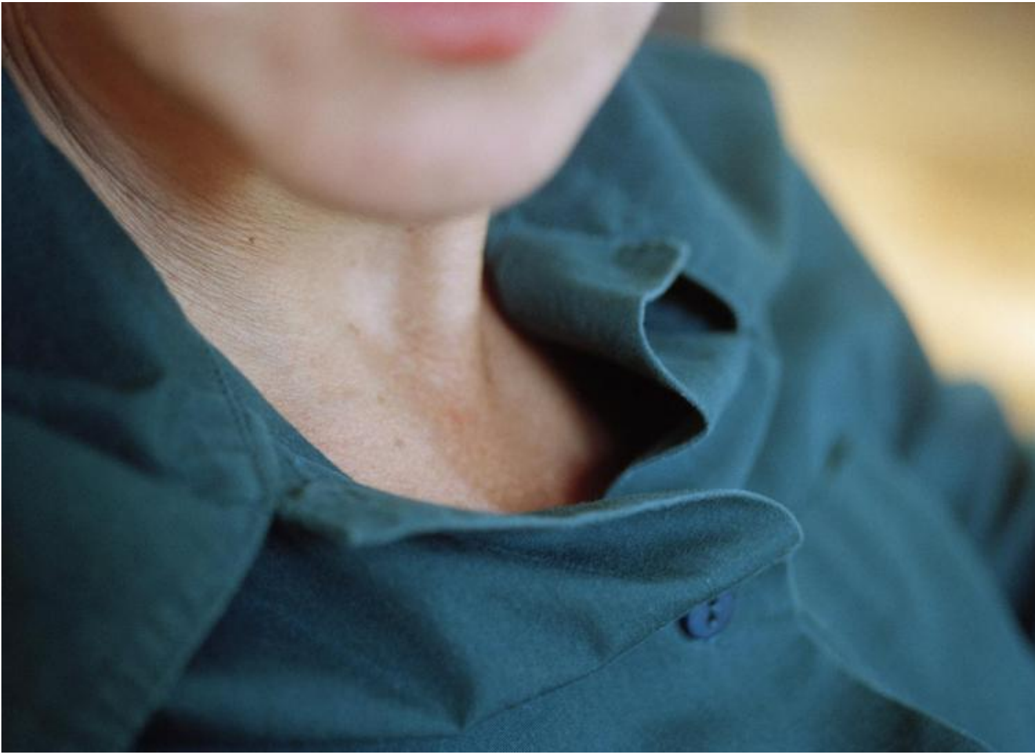
Primo campo, 2005