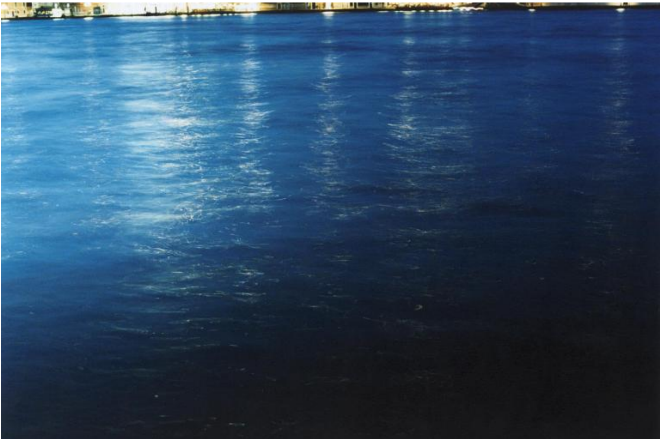
Le ore blu. Giudecca, ore 20:38, 2017

Il presupposto di Marina Ballo Charmet è simmetricamente opposto: a interessarle è proprio il margine di una percezione che, nel lessico dei suoi altri maestri – psicoanalisti come Salomon Resnik e Anton Ehrenzweig –, viene definita «visione periferica»: quella che ci fa percepire la presenza di un oggetto senza che in realtà ce ne accorgiamo. Il nostro occhio, o forse piuttosto la nostra psiche, si comporta come l'obiettivo fotografico di Benjamin: vede più di quanto, cognitivamente e razionalmente, pensi di farlo. Se però dalla generazione dei padri risaliamo a quella dei “nonni”, un air de famille si avverte inequivocabile.