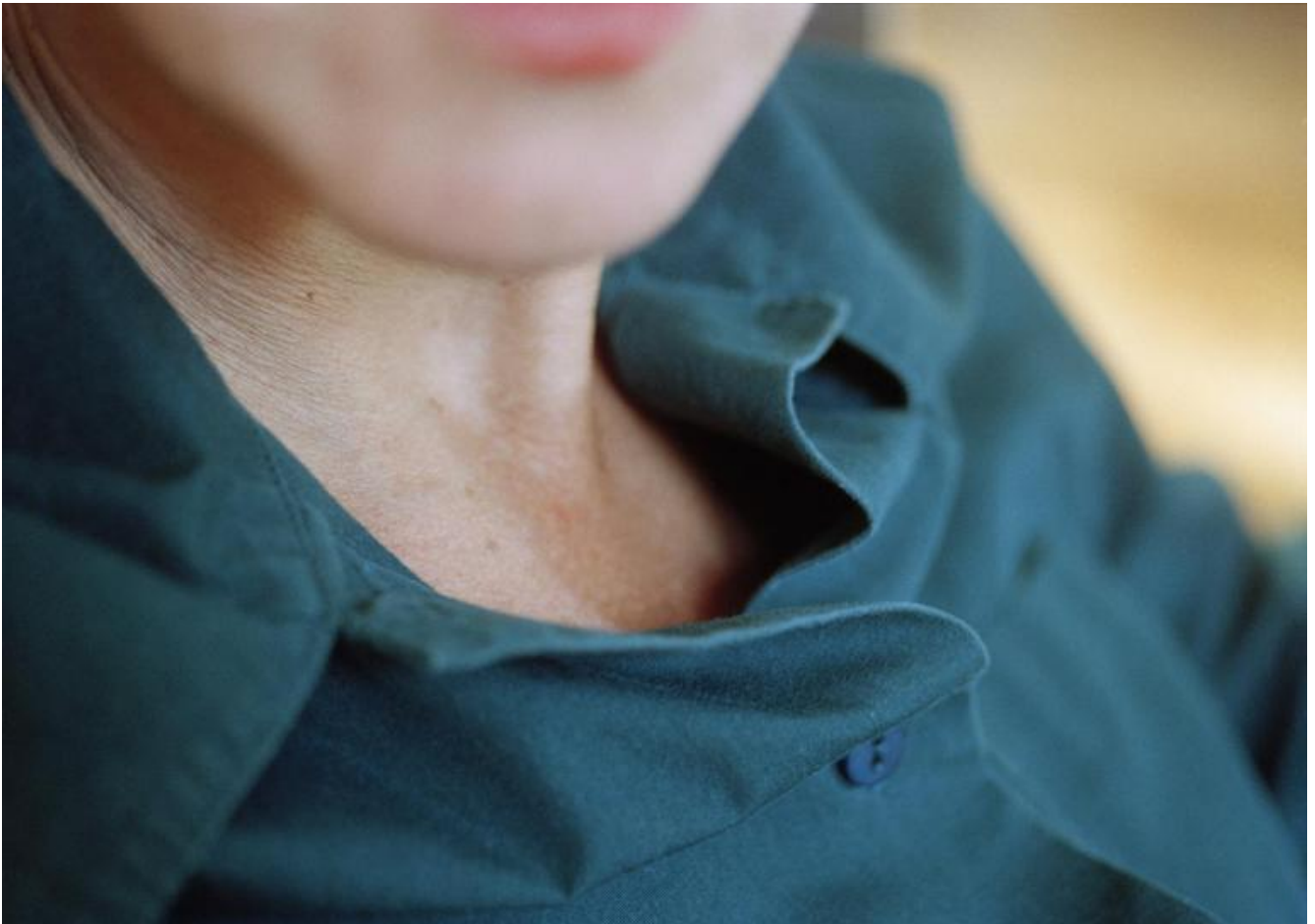
Primo campo, 2005

Non può che venire in mente Donald Winnicott: secondo il quale il volto della madre, e più in generale dell'essere adulto che accudisce l'infante, per quest'ultimo equivale in effetti a uno specchio. Nel saggio La funzione di specchio della madre e della famiglia nello sviluppo infantile (che è del '67: in italiano è raccolto nell'antologia Gioco e realtà , Armando 2006, pp. 175 sgg.) lo psicoanalista britannico prende le mosse dal celebre testo di Lacan sullo «stadio dello specchio», ma se ne discosta decisamente per la direzione relazionale che prende (che varrebbe la pena commentare col pensiero radicalmente intersoggettivo di Emmanuel Lévinas sul volto e lo sguardo). Questa idea straordinaria mi ricorda quella di un altro grande scrittore, Carlo Emilio Gadda, che in un frammento gravitante nell'orbita del suo grande romanzo autobiografico, scritto fra anni Trenta e Quaranta ma pubblicato in forma incompiuta solo nel 1963, La cognizione del dolore (si legge alle pp. 527-35 dell'edizione critica a cura di Emilio Manzotti, Einaudi 1987), descrive il rapporto fra il bambino e la madre (cioè quello tra lui e sua madre) come appunto un rispecchiamento mancato. L'odio fra madre e figlio - dal quale provengono le