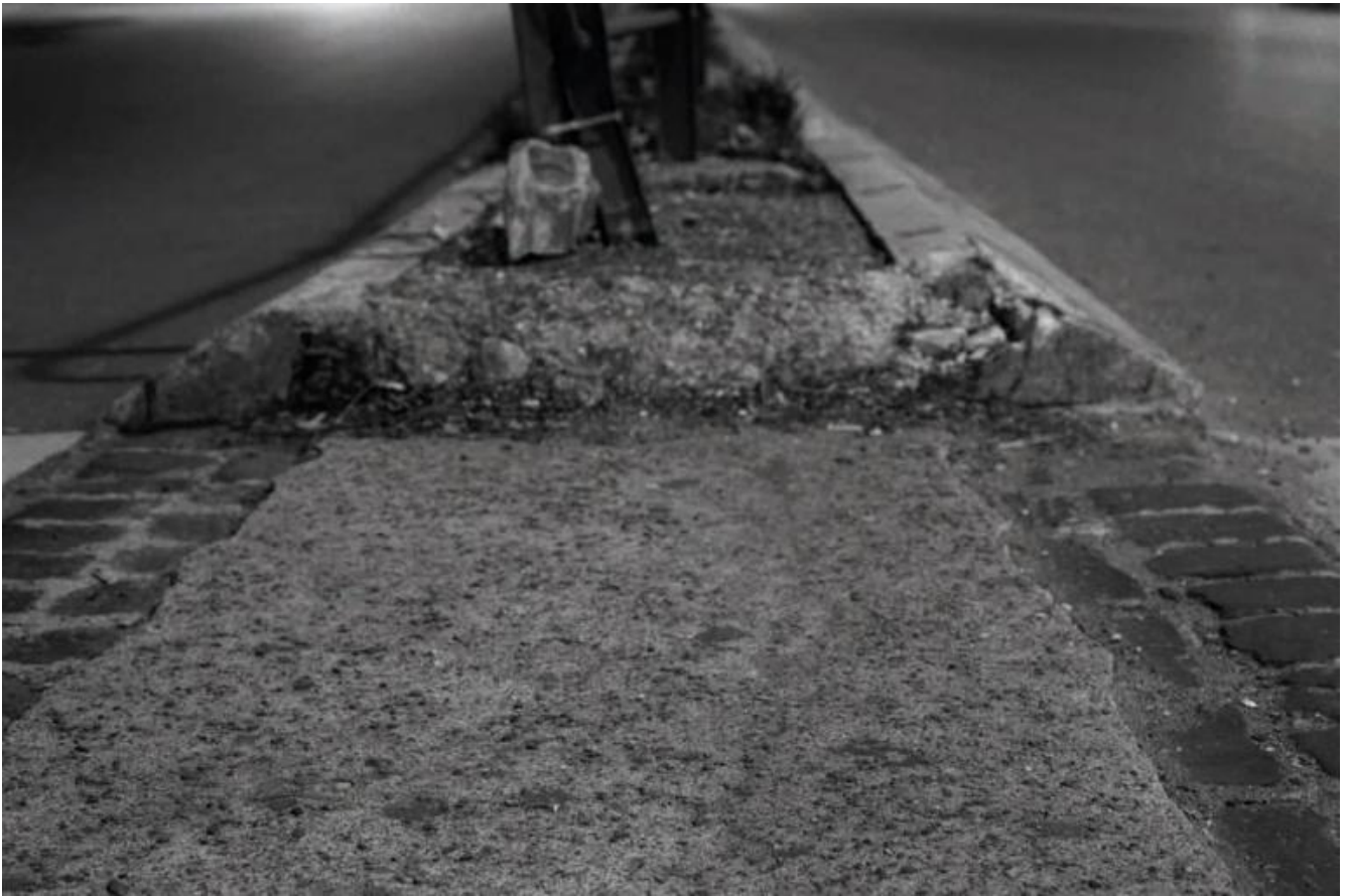
Con la coda dell'occhio, #41, 1993-94

Per un esempio eloquente, di quella che si potrebbe definire una “funzione Blow-Up ”, si pensi all’oltranza antiromanzesca di un testo di Nanni Balestrini dal titolo Tristano , uscito lo stesso anno del film di Antonioni (nel controverso convegno del Gruppo 63 sul Romanzo sperimentale , tenutosi a Palermo l’anno prima, Balestrini aveva dichiarato sprezzante: «i fili spezzati con la realtà non si riannodano più e basta, non ce n’è più bisogno» - a p. 133 nell’edizione a mia cura pubblicata da L’orma nel 2013 - e qui non importa il fatto che la sua opera letteraria a venire smentirà, persino clamorosamente, un simile assunto). Tornando alle narrazioni o de-narrazioni per immagini (non è un caso, però, che mostri un impianto spiccatamente visivo pure il Tristano di Balestrini...), si pensi ai capolavori di un altro grande autore di quella generazione, Alain Resnais: il quale, con un filo d’ironia forse, una volta ha spiegato le infrazioni al codice narrativo, da lui allora spregiudicatamente operate, ricordando come, subito prima e all’inizio della Seconda guerra mondiale, da adolescente fosse abbonato a riviste di fumetti americane che, per arrivare in Francia, dovevano attraversare l’oceano: un percorso talmente lungo che spesso le spedizioni si accavallavano le une alle altre, e poteva capitare che gli arrivassero in lettura prima le puntate successive