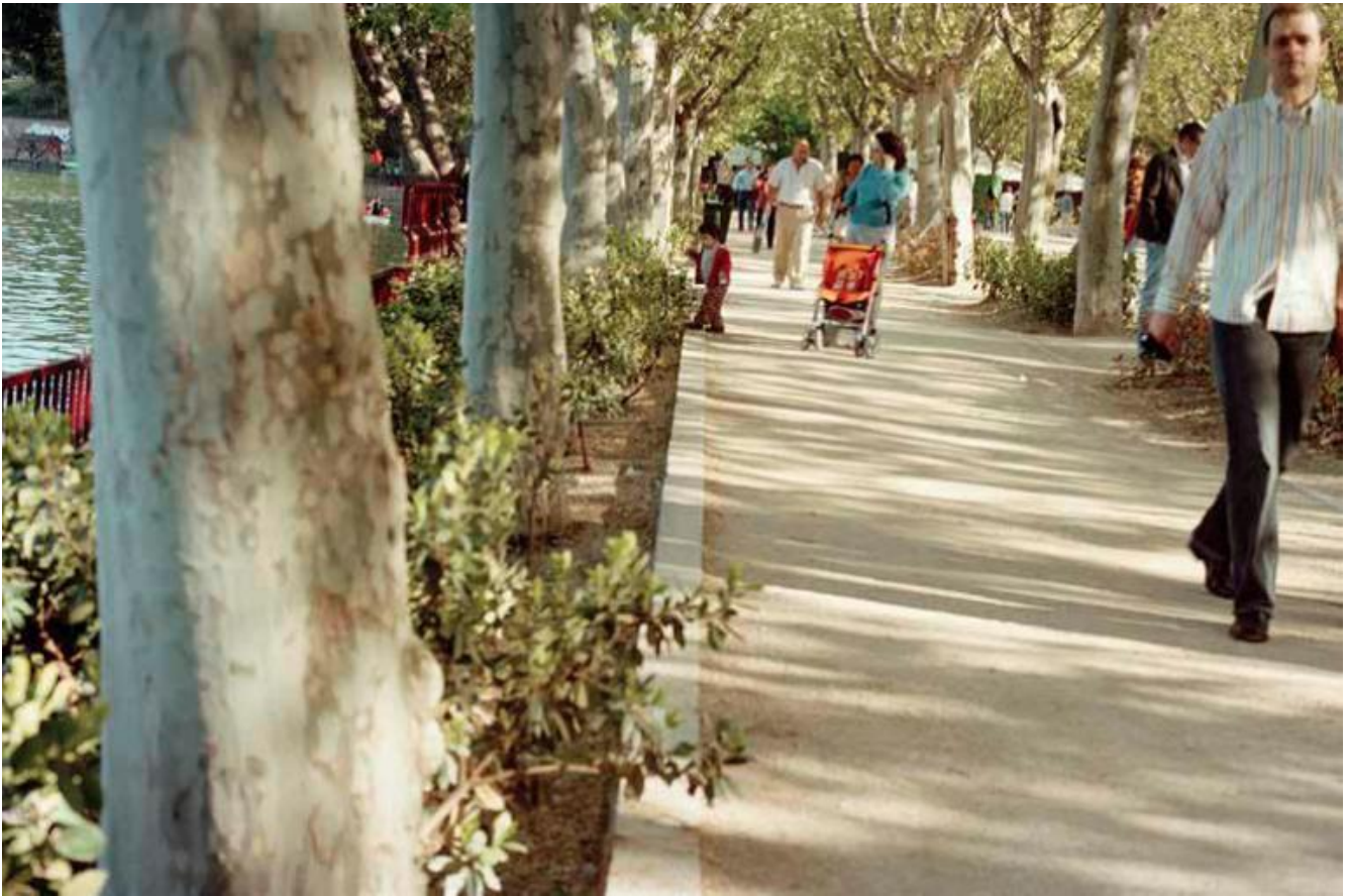
Il parco, Madrid, Casa de campo, 2008

Ma colpisce ritrovare nel lavoro di Ballo Charmet questa medesima, duplice e in apparenza divergente, linea di ricerca: lo sguardo de-narrativo, s-centrato e anti-antropocentrico dei suoi paesaggi metropolitani, e quello invece iper-centrato dell'infantile Primo campo (ancorché, con s-centramento "iper-realistico" in effetti questo "manchi" ogni volta il volto, il risus , per concentrarsi sulla regione, del corpo parentale, che immediatamente vi sottostà; in un suo scritto, infatti, Ballo Charmet corregge appunto Winnicott con Resnik: Con la coda dell'occhio , p. 72).