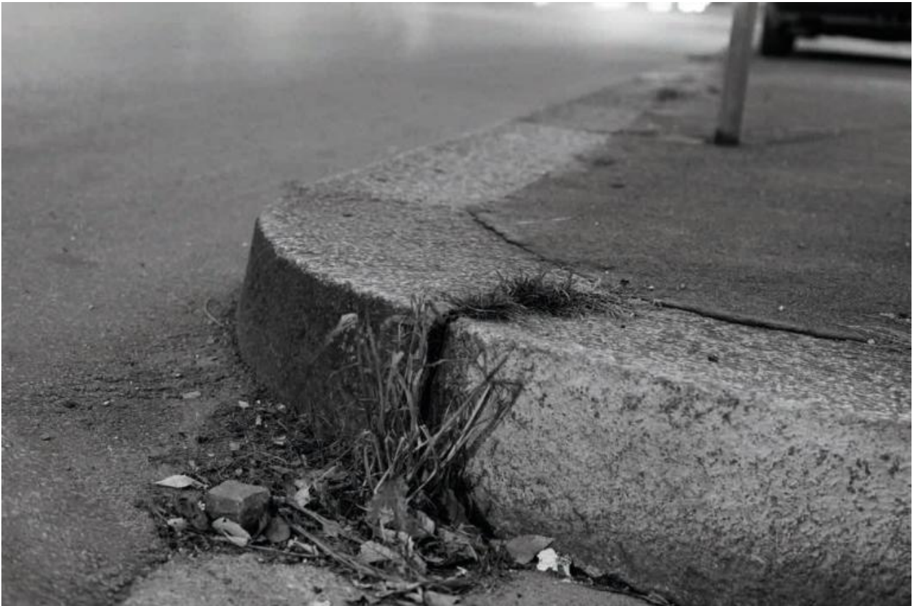
Con la coda dell'occhio, #23, 1993-94

Ma a rendere totalmente s-paesante l'opera è soprattutto qualcosa che in prima battuta percepiamo, invece, solo per via subliminale. La successione delle tre immagini infatti sembra, ma a ben vedere non è, quella logico-spaziale che risponde alla nostra ipotetica percezione "reale". Dalla collocazione delle persone nelle tre fotografie, quella che si trova a sinistra (i bambini che giocano) in teoria dovrebbe invece - per riprodurre la "panoramica" del nostro sguardo - stare a destra.