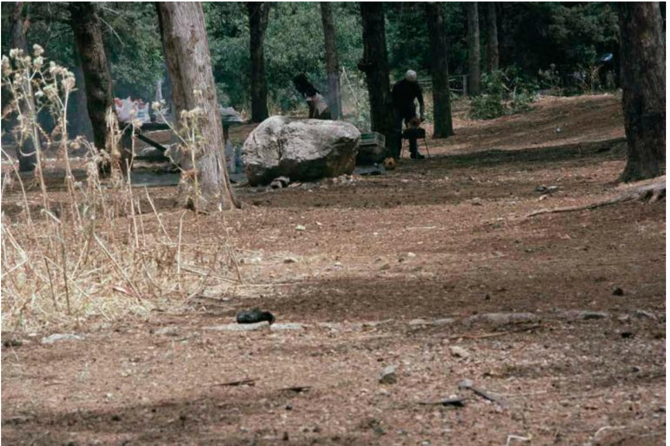
Il parco. Palermo, La Favorita, 2008