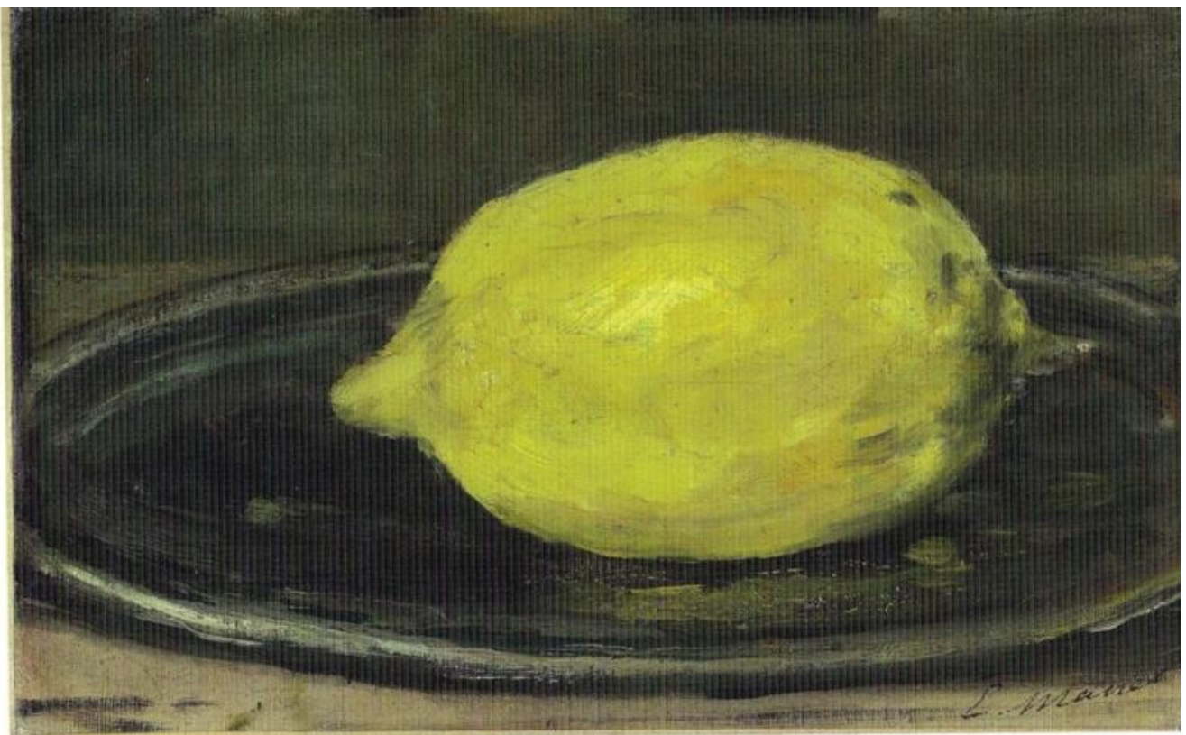
Édouard Manet, Il limone (1880).

usano un termine più spregiativo di croceus : galbinus che indica un giallo che tende al verde e che l'autore pensa possibile collegare con il termine germanico gelb . La possibilità di individuare una vicinanza di giallo e di verde aprirebbe poi, secondo Pastoureau, all'affermarsi della nuova scala cromatica, quella newtoniana, che pone il giallo vicino al verde: possibile - si chiede - che i germani avessero un ordinamento dei colori più vicino a quello dello spettro? Conclude ipotizzando che l'aggettivo galbinus possa semplicemente indicare un brutto giallo slavato che egli tradurrebbe con l'espressione «giallo alla maniera dei Germani» (p. 66). Invero la possibilità di un giallo che tende al verde non sarebbe contraddetta né dalla percezione, né dal linguaggio e nemmeno dalla mescolanza dei colori sulla tavolozza.